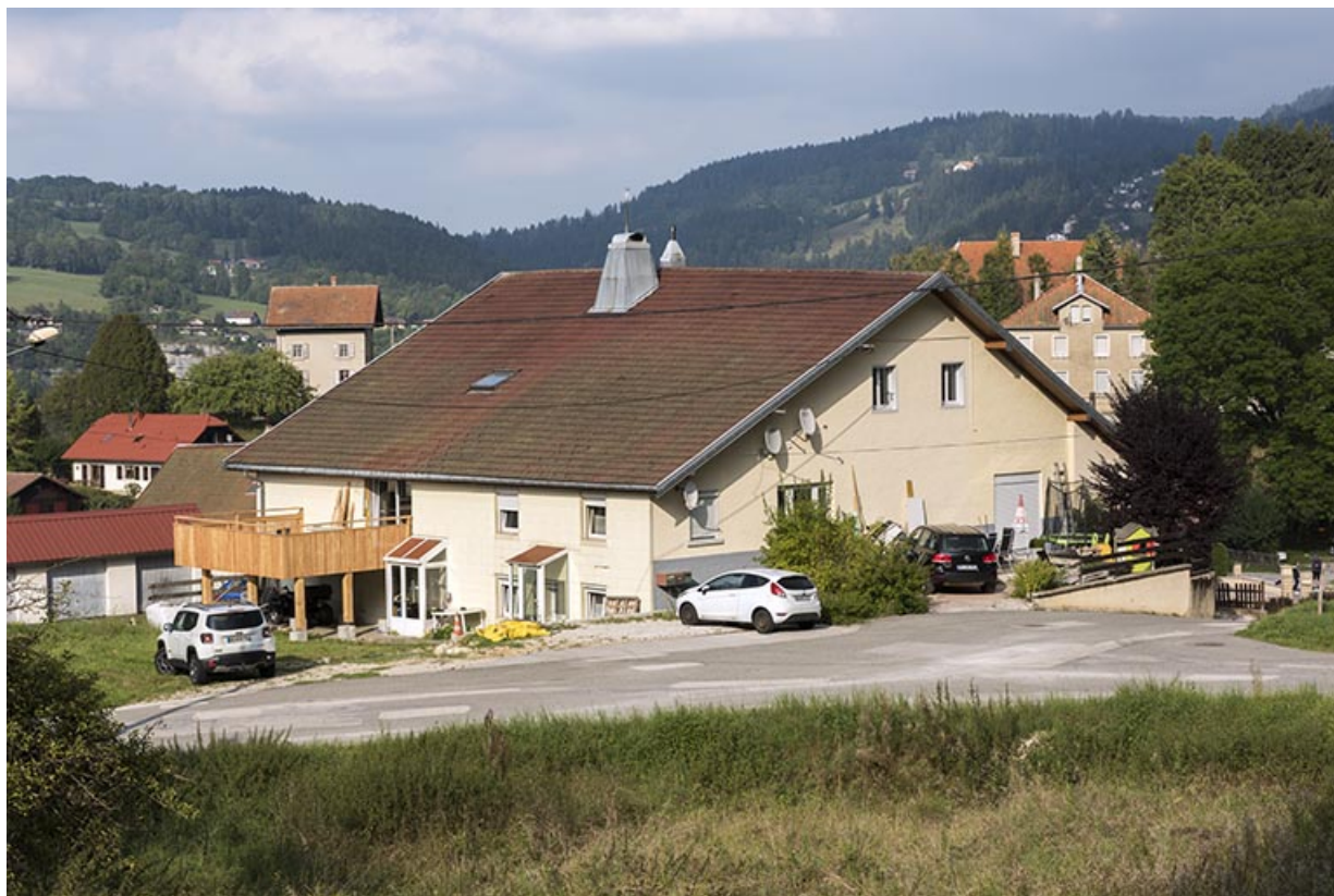
Vue d'ensemble, depuis le sud-ouest (façades antérieure et latérale gauche). 25, Villers-le-Lac rue du Temple, lieudit : les Bassots