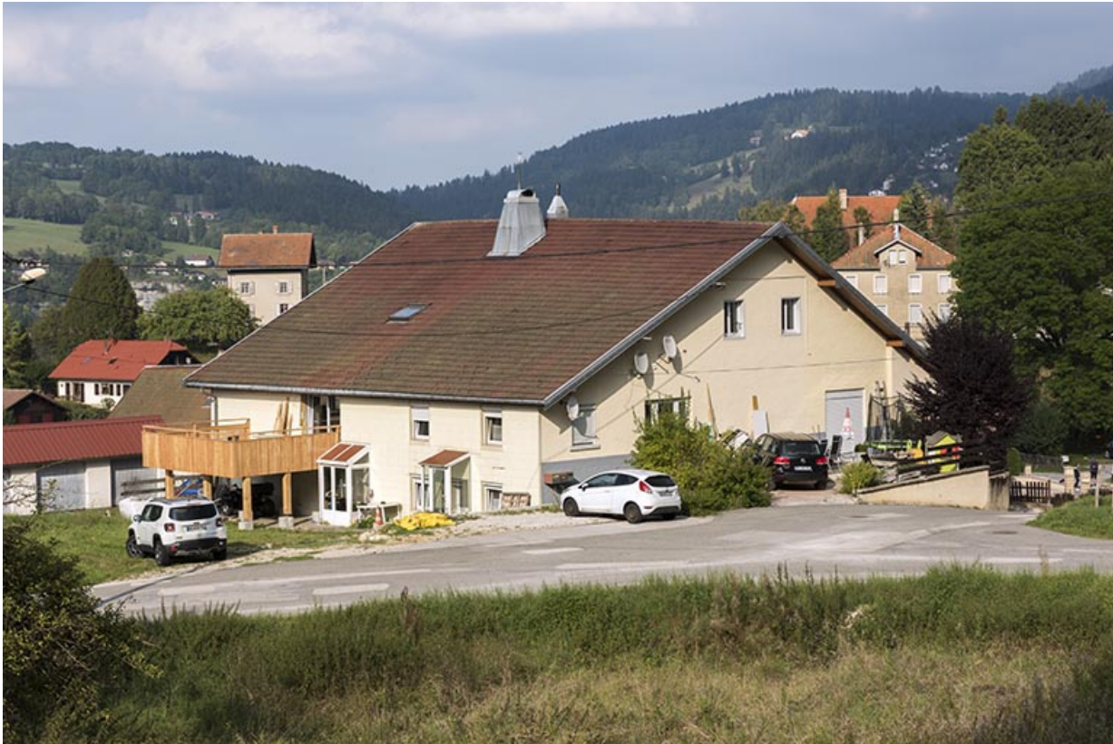
Vue d'ensemble, depuis le sud-ouest (façades antérieure et latérale gauche).

25, Villers-le-Lac rue du Temple, lieudit : les Bassots