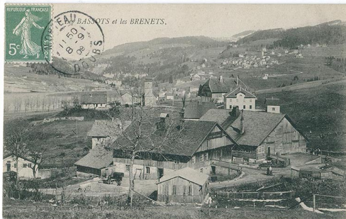
Les Bassots et les Brenets, 4e quart 19e siècle ou 1er quart 20e siècle [avant 1909].