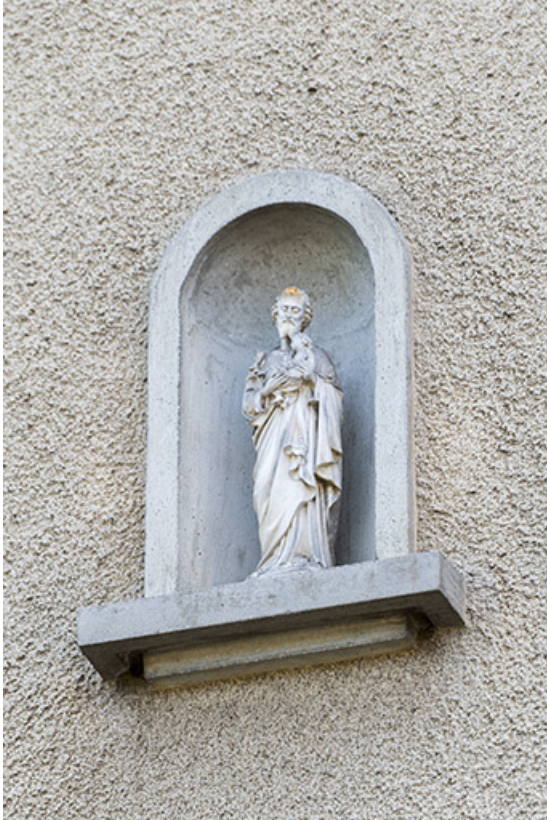
Façade postérieure : statue de saint Joseph avec l'Enfant Jésus.

25, Villers-le-Lac rue du Temple, lieudit : les Bassots