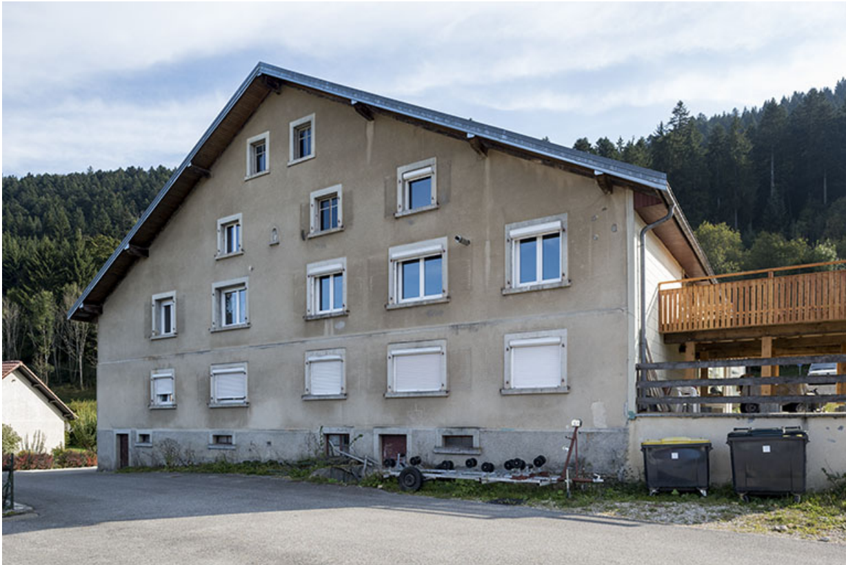
Façade postérieure, de trois quarts droite.

25, Villers-le-Lac rue du Temple, lieudit : les Bassots