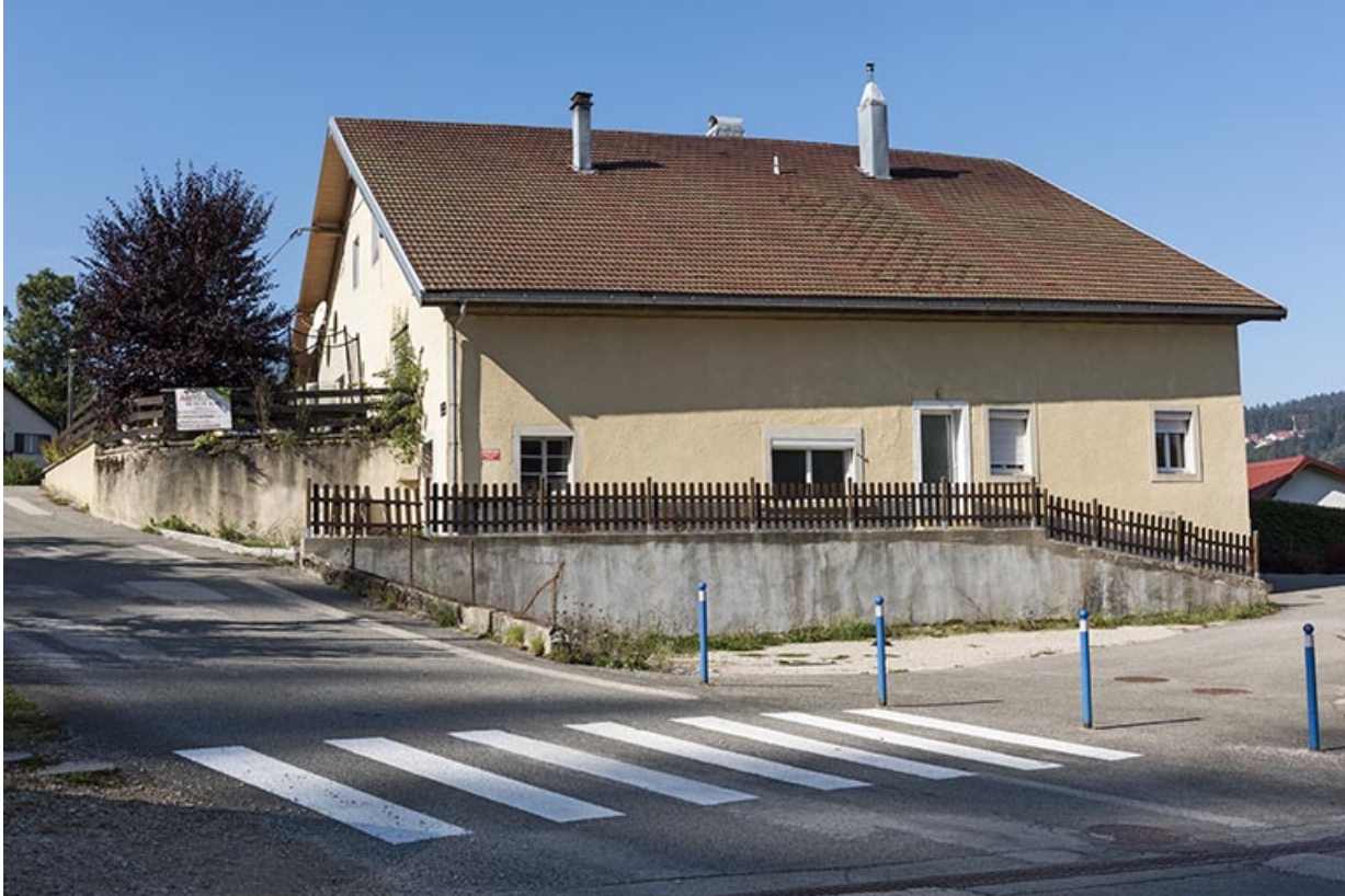
Façade latérale droite, de trois quarts gauche.

25, Villers-le-Lac rue du Temple, lieudit : les Bassots