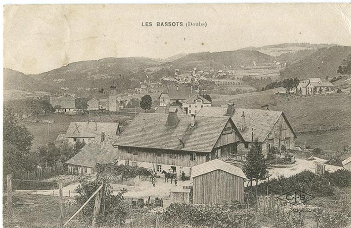
Les Bassots (Doubs), 1er quart 20e siècle.

25, Villers-le-Lac rue du Temple, lieudit : les Bassots