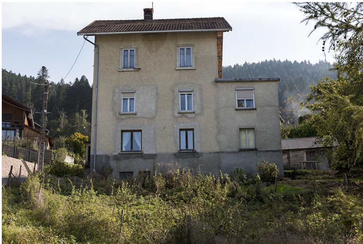
Façade latérale droite, vue en contre-plongée.

25, Villers-le-Lac, 5 rue de l' Ile, lieudit : les Bassots