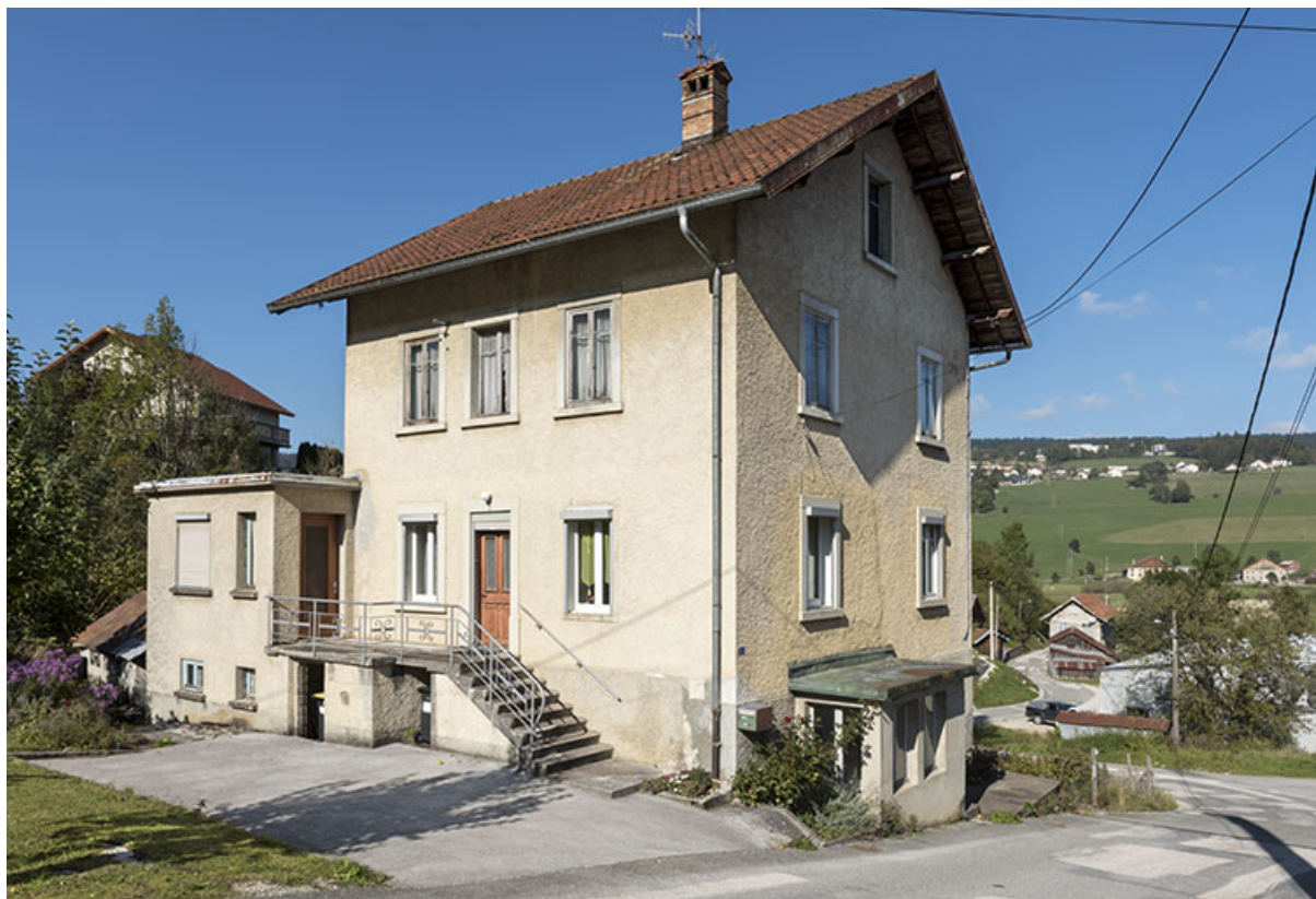
Façades antérieure et latérale gauche. 25, Villers-le-Lac