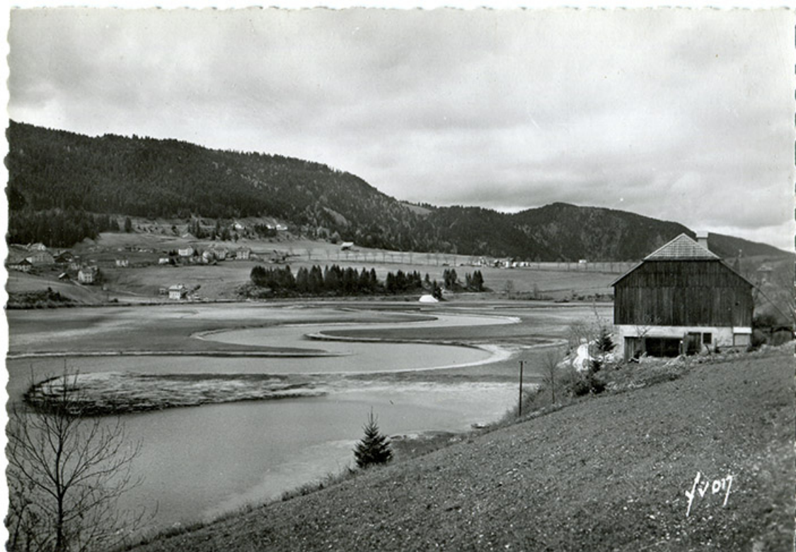
Lac ou Villers (Doubs). Les méandres du Doubs et le hameau des Bassots, 2e quart 20e siècle. 25, Villers-le-Lac