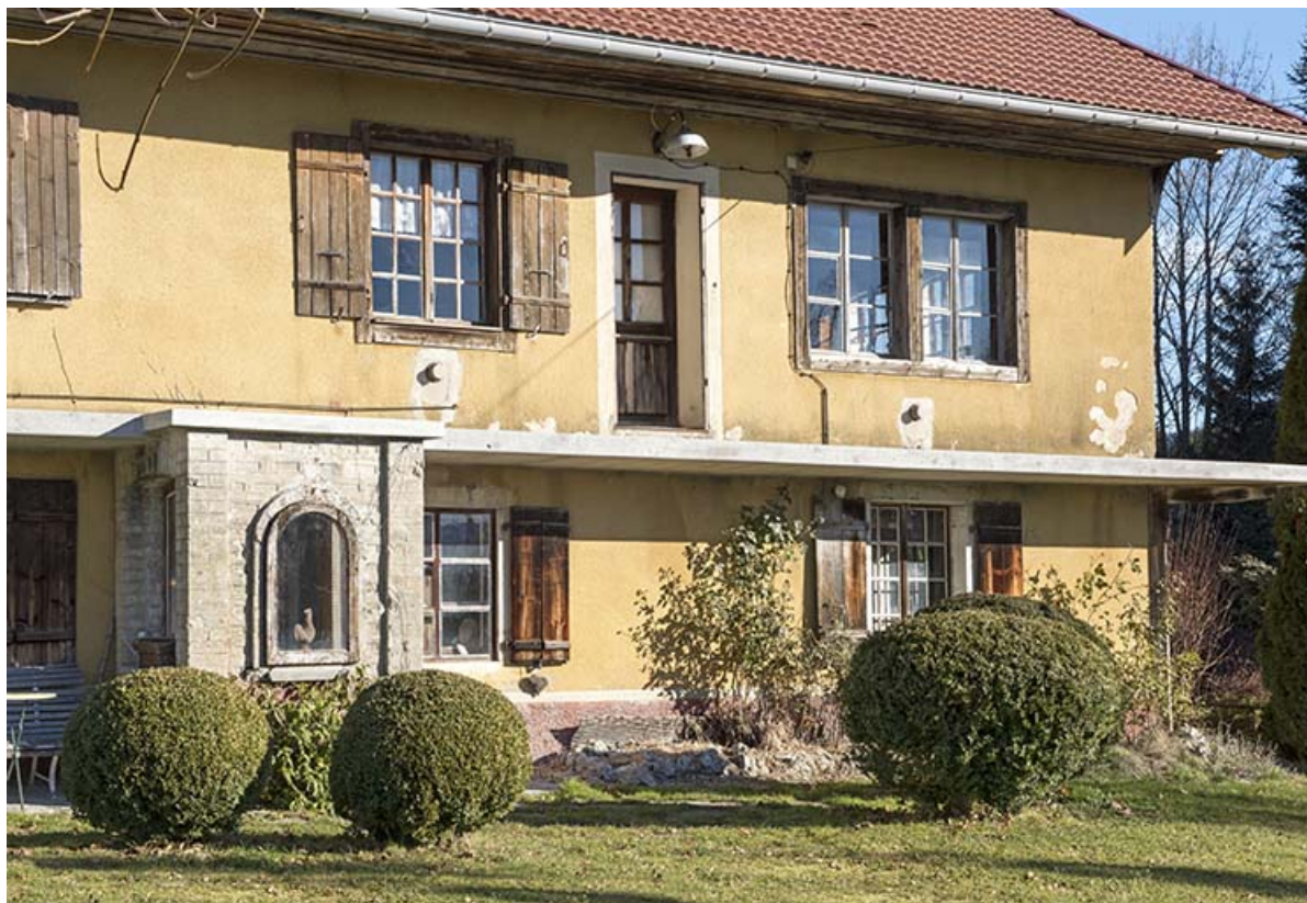
Façade antérieure : partie droite (atelier de fabrication à l'étage). 25, Villers-le-Lac, lieudit : le Désert