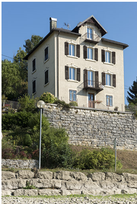
Façades postérieure et latérale droite, vues en contre-plongée.

25, Villers-le-Lac, 7 route du Port, lieudit : Chaillexon