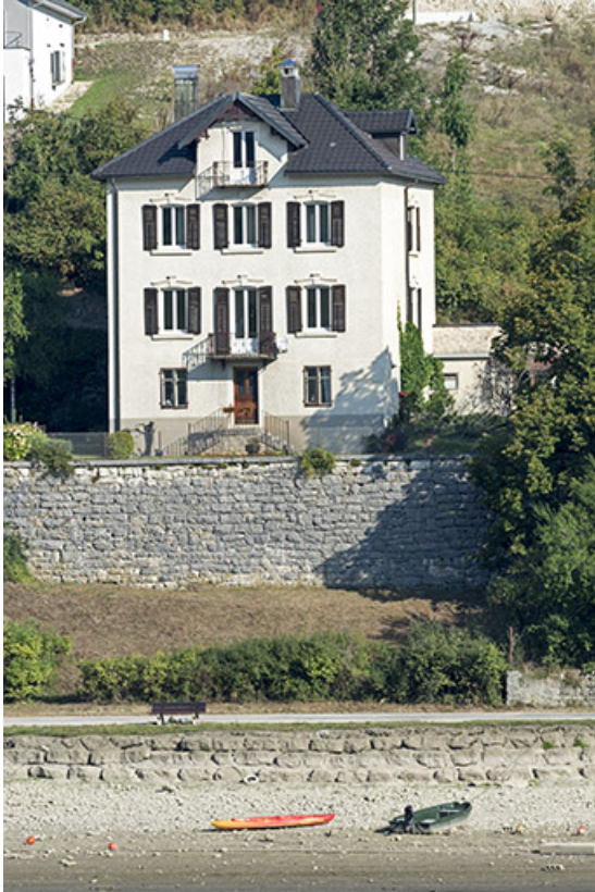
Vue d'ensemble, depuis le sud-est (façade postérieure).

25, Villers-le-Lac, 7 route du Port, lieudit : Chaillexon