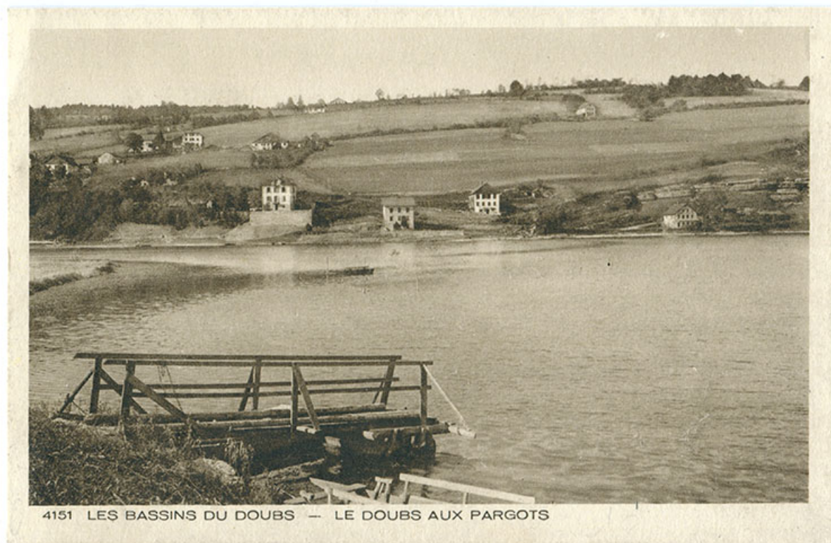
4151 LES BASSINS DU DOUBS — LE DOUBS AUX PARGOTS

4151 Les bassins du Doubs - Le Doubs aux Pargots, 1ère moitié 20e siècle. 25, Villers-le-Lac