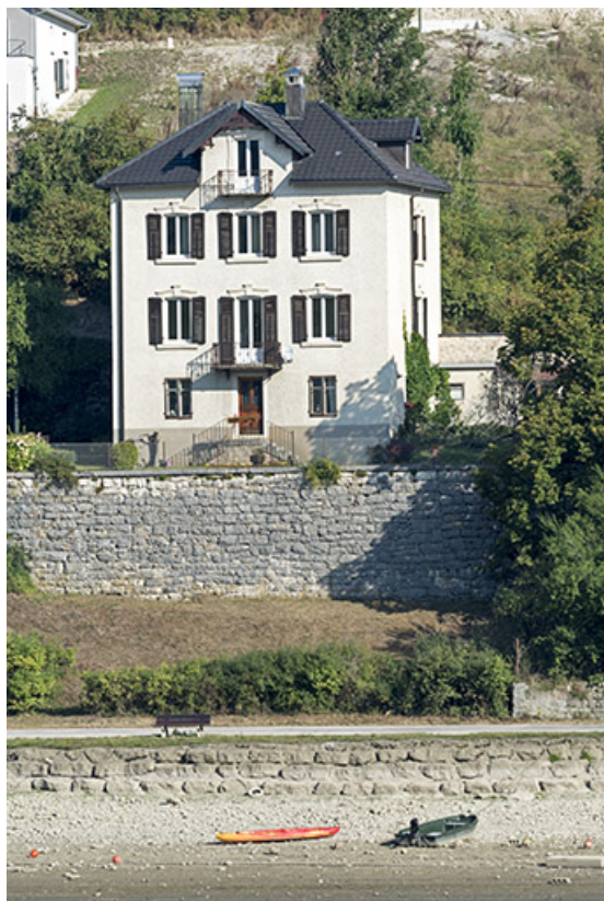
Vue d'ensemble, depuis le sud-est (façade postérieure).

25, Villers-le-Lac, 7 route du Port, lieudit : Chaillexon