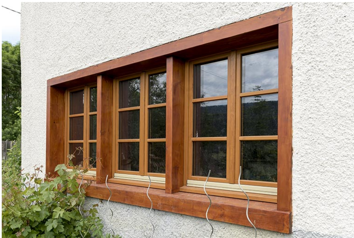
Façade latérale gauche : fenêtre multiple à l'étage de soubassement de l'atelier de fabrication. 25, Villers-le-Lac, 7 rue des Murgers, lieudit : Chaillexon