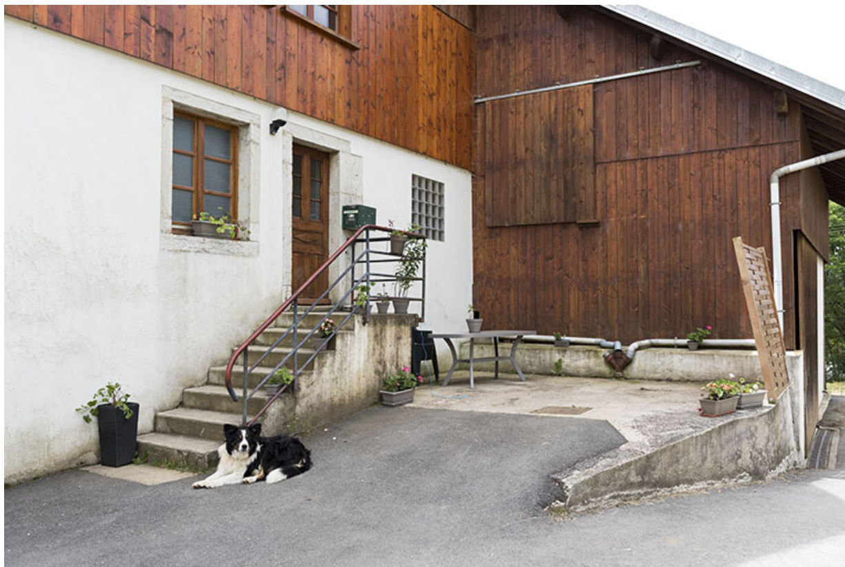
Façade latérale droite : escalier extérieur et étable. 25, Villers-le-Lac, 7 rue des Murgers, lieudit : Chaillexon