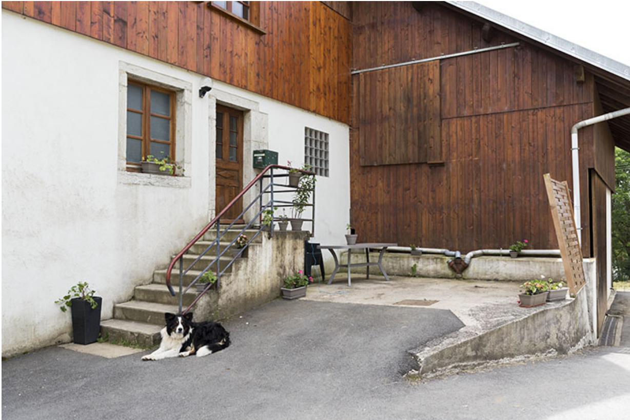
Façade latérale droite : escalier extérieur et étable. 25, Villers-le-Lac, 7 rue des Murgers, lieudit : Chaillexon