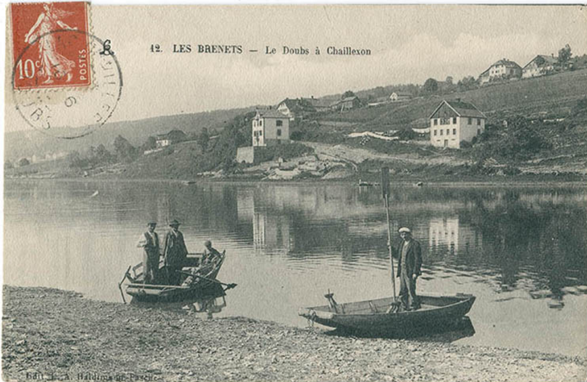
12. Les Brenets - Le Doubs à Chaillexon, 1er quart 20e siècle [entre 1908 et 1913].

25, Villers-le-Lac, 16 rue de l' Ile, lieudit : les Bassots