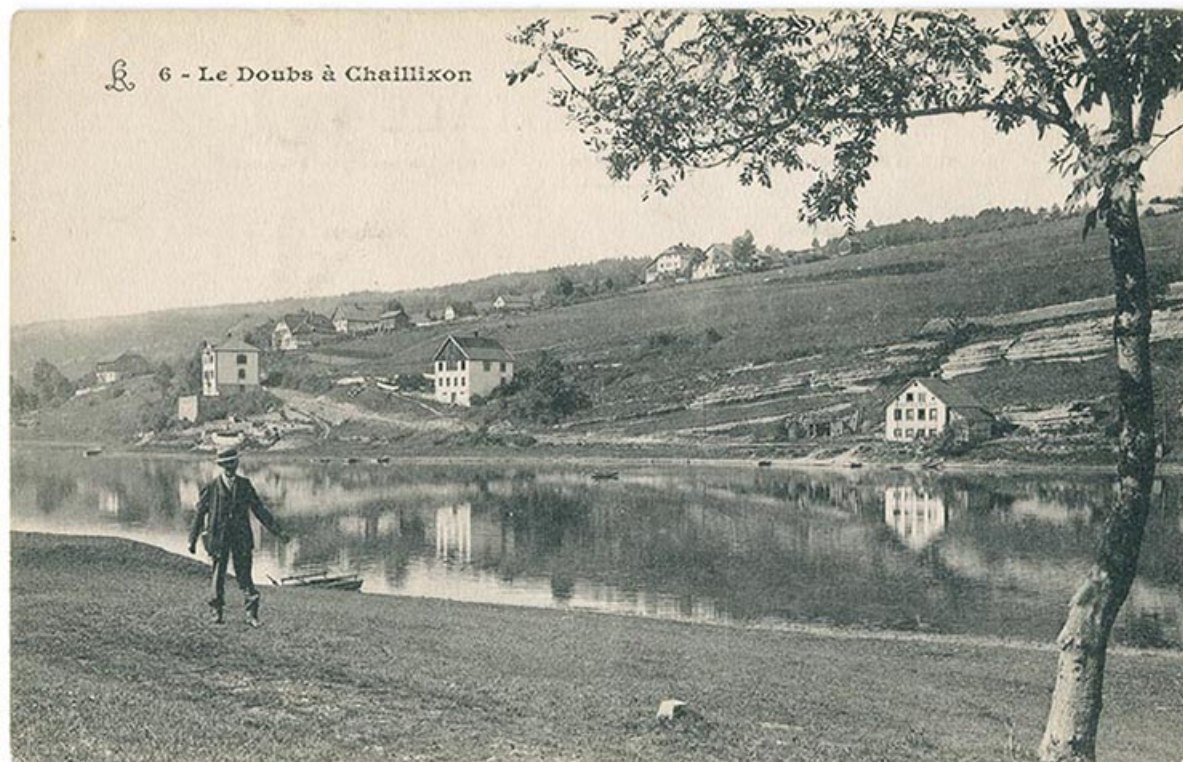
6 - Le Doubs à Chaillixon [sic], 1er quart 20e siècle.

25, Villers-le-Lac, 7 rue des Murgers, lieudit : Chaillixon