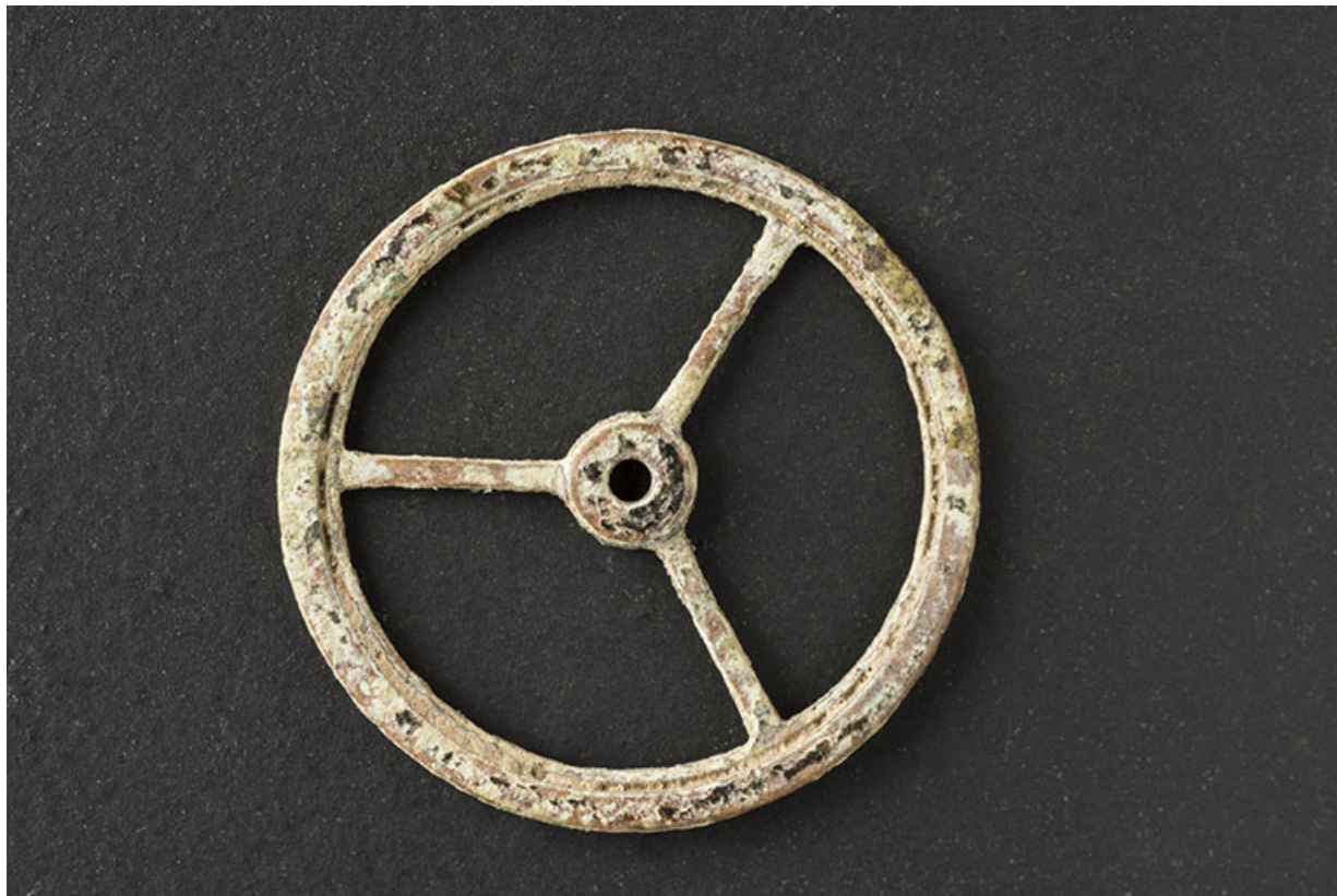
Exemple de balancier fabriqué dans l'atelier. Présentant un défaut, il avait comme beaucoup été jeté dans le jardin. 25, Villers-le-Lac, 7 rue des Murgers, lieudit : Chaillexon