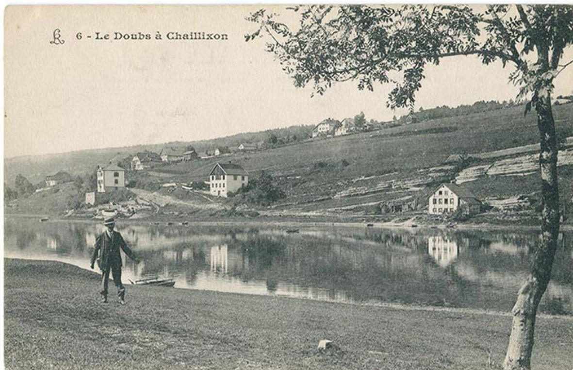
6 - Le Doubs à Chaillixon [sic], 1er quart 20e siècle.

25, Villers-le-Lac, 7 rue des Murgers, lieudit : Chaillixon