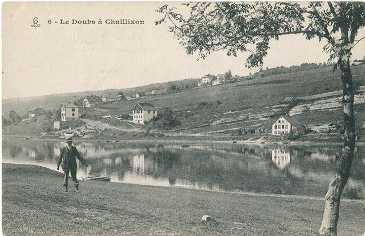
6 - Le Doubs à Chaillixon [sic], 1er quart 20e siècle.

25, Villers-le-Lac, 7 rue des Murgers, lieudit : Chaillixon