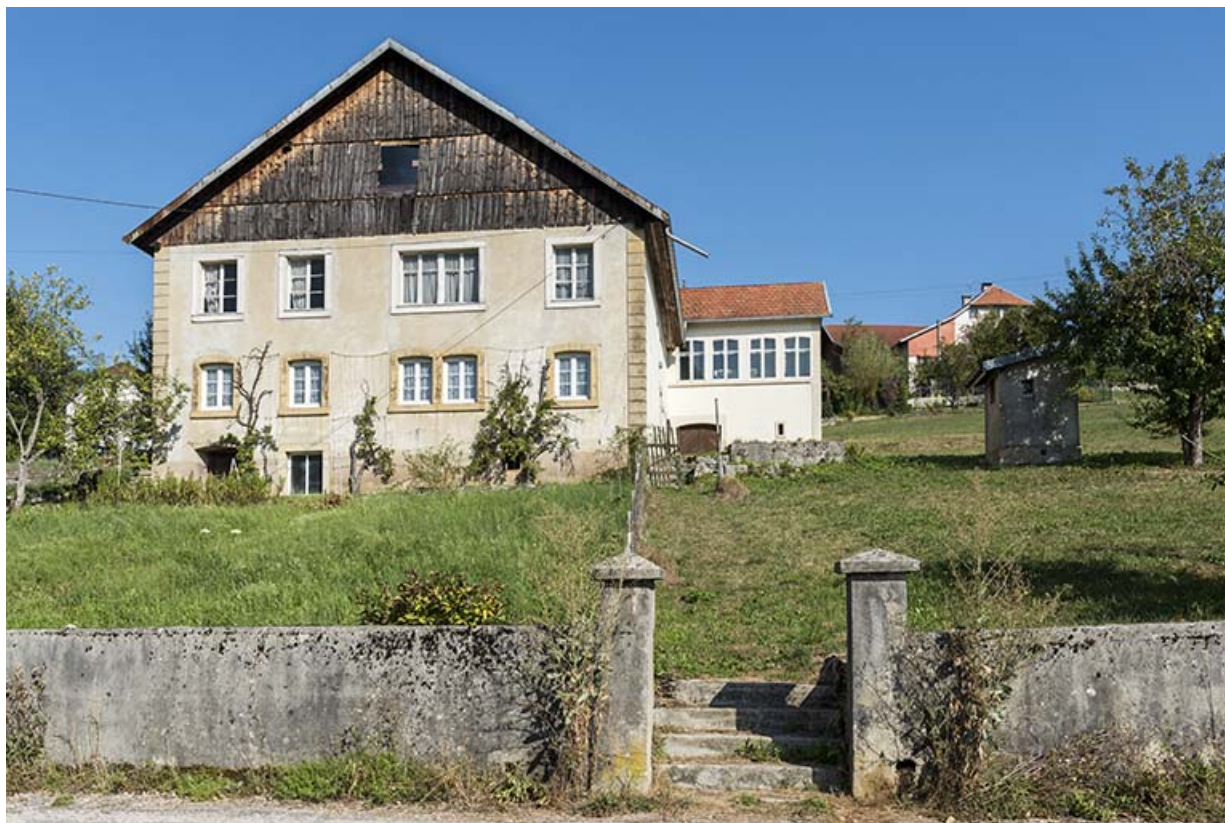
Façade antérieure et atelier de fabrication. 25, Villers-le-Lac