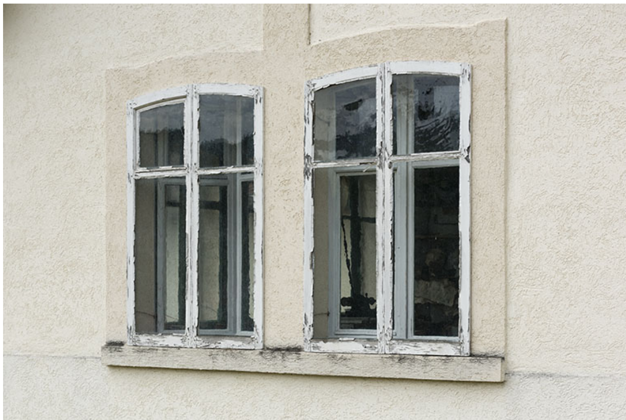
Atelier de fabrication : fenêtre horlogère dans le mur pignon oriental.

25, Villers-le-Lac, 4 rue des Murgers, lieudit : Chaillexon