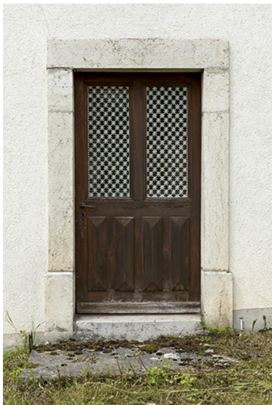
Façade latérale droite : porte.

25, Villers-le-Lac, 4 rue des Murgers, lieudit : Chaillexon