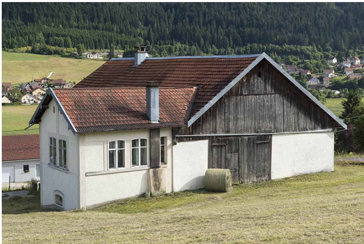
Façade postérieure, de trois quarts gauche, et atelier de fabrication.

25, Villers-le-Lac, 4 rue des Murgers, lieudit : Chaillexon