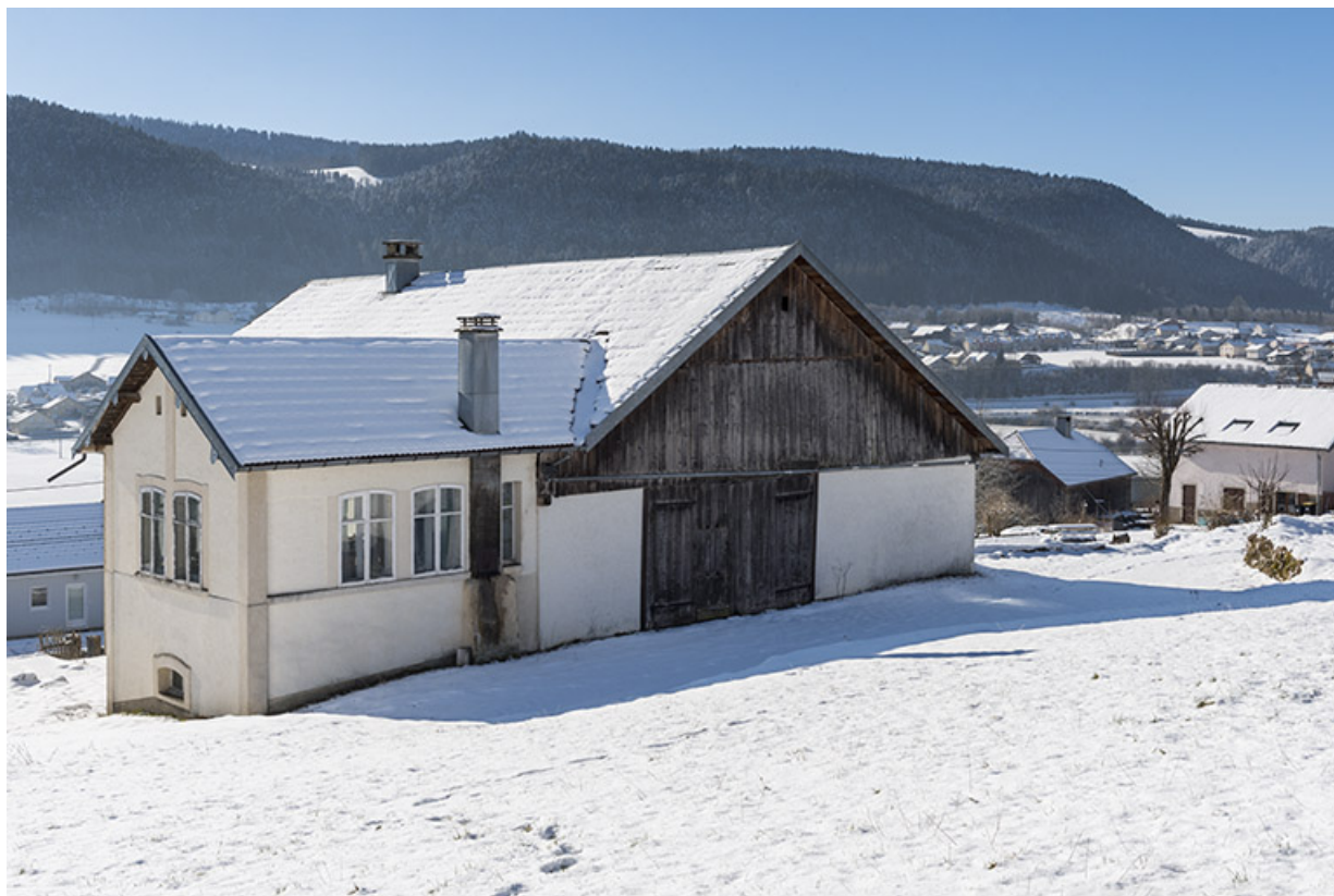
Façade postérieure, de trois quarts gauche, et atelier de fabrication, en hiver. 25, Villers-le-Lac, 4 rue des Murgers, lieudit : Chaillexon