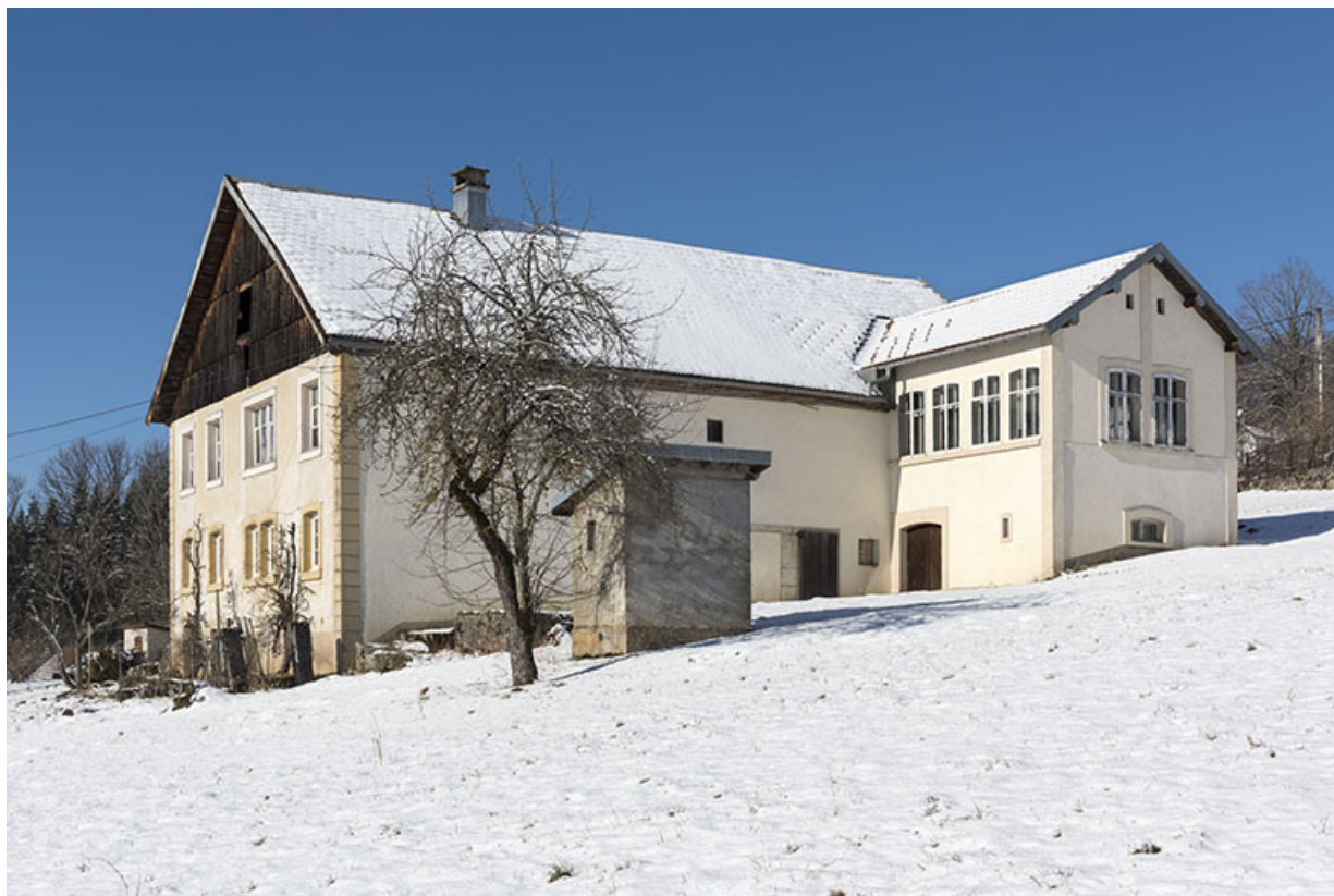
ferme et atelier de balanciers et d'horlogerie Zimmermann, à Villers-le-Lac.