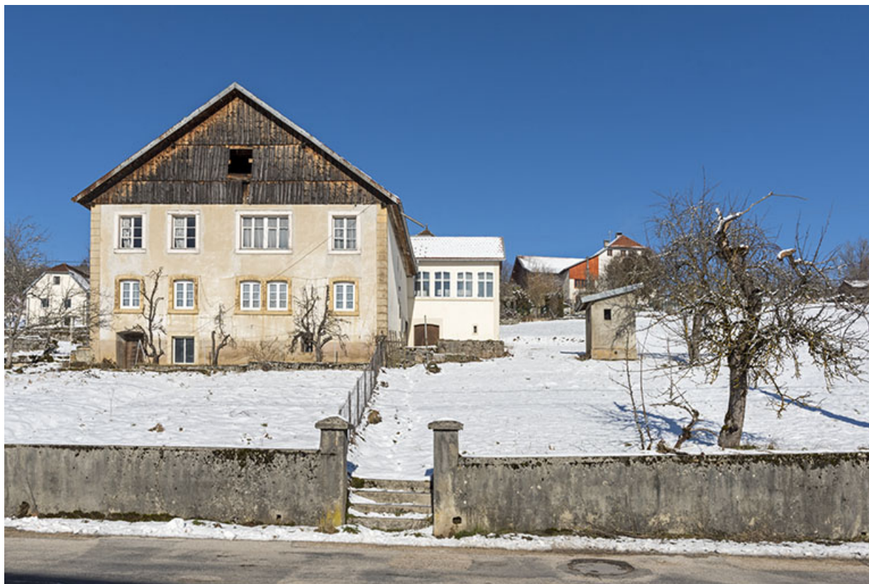
Façade antérieure et atelier de fabrication, en hiver.

25, Villers-le-Lac, 4 rue des Murgers, lieudit : Chaillexon