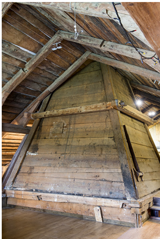
Etage en surcroît : tué.