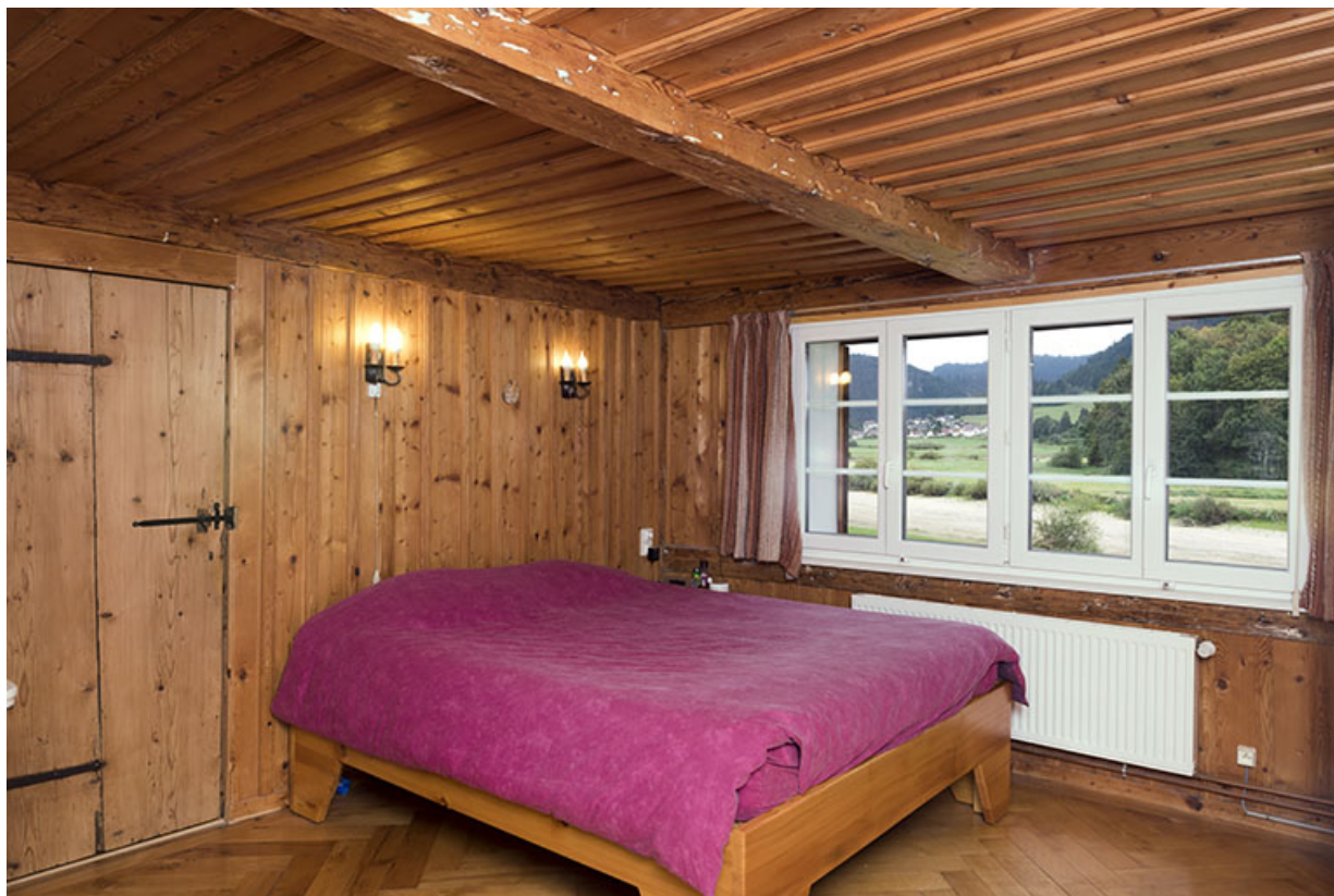
Rez-de-chaussée : chambre.