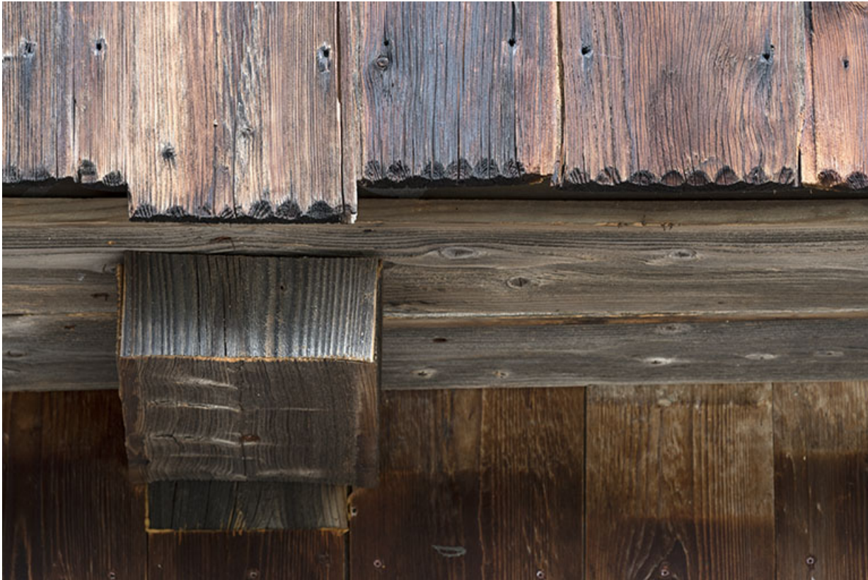
Extrémité des planches de la lambrichure.