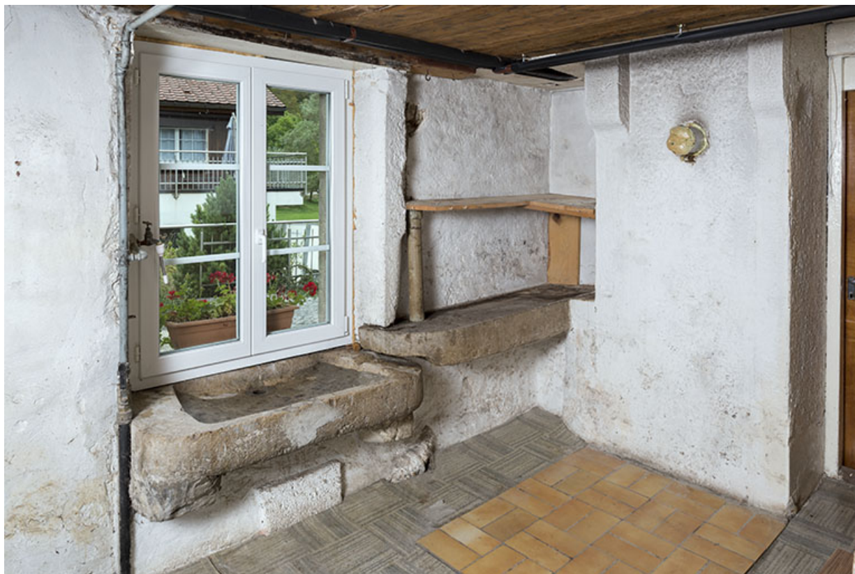
Premier étage de soubassement : ancien évier.