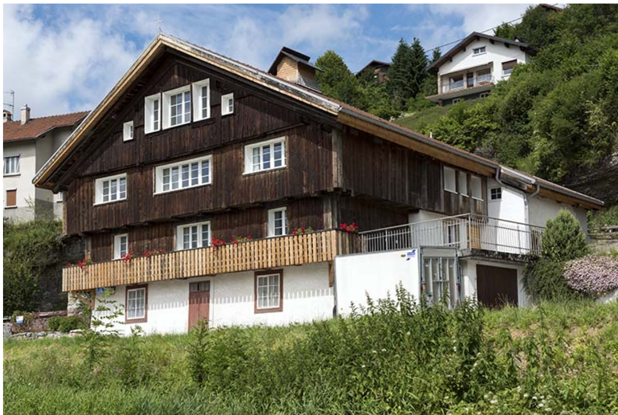
Façades antérieure et latérale droite.