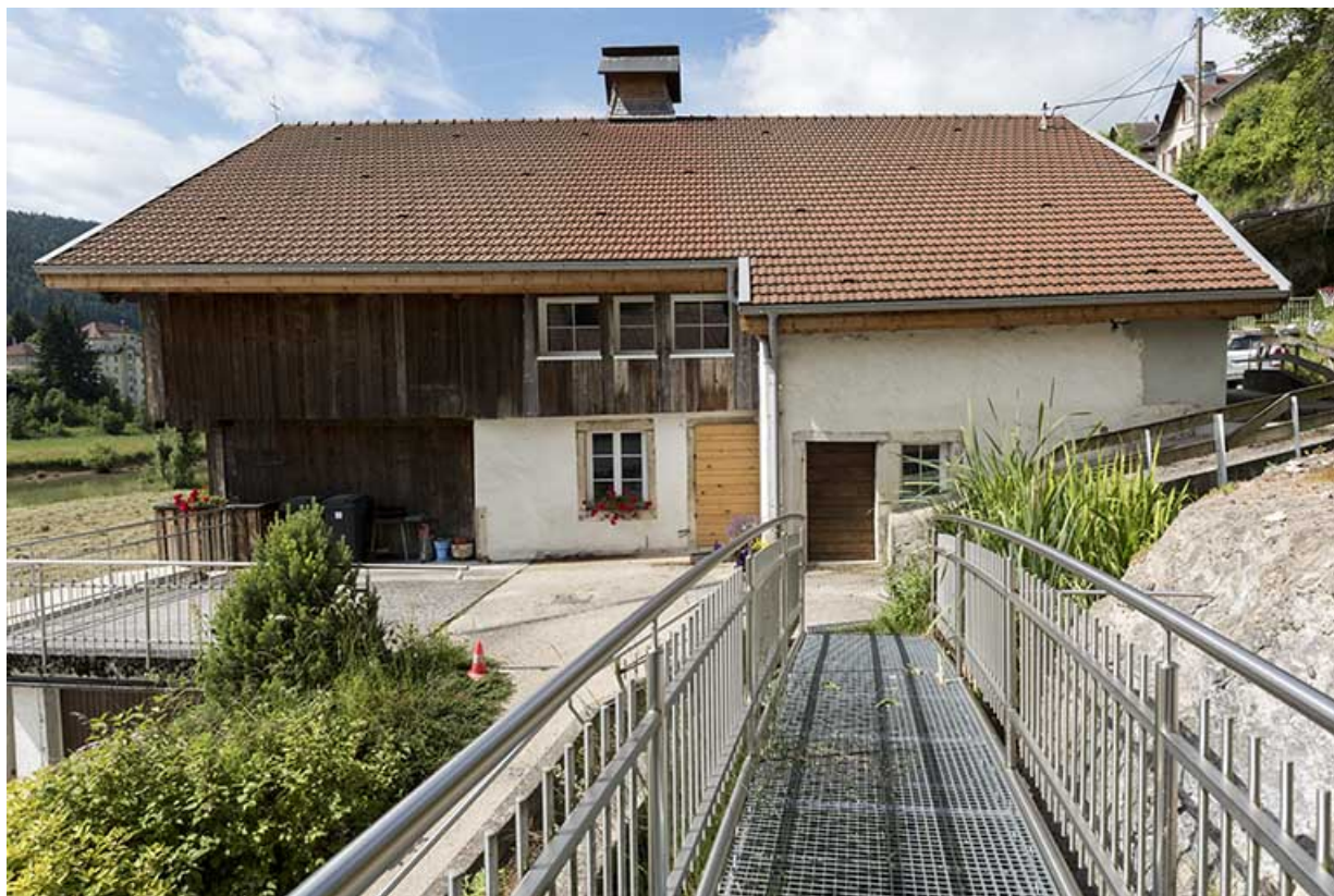
Façade latérale droite.