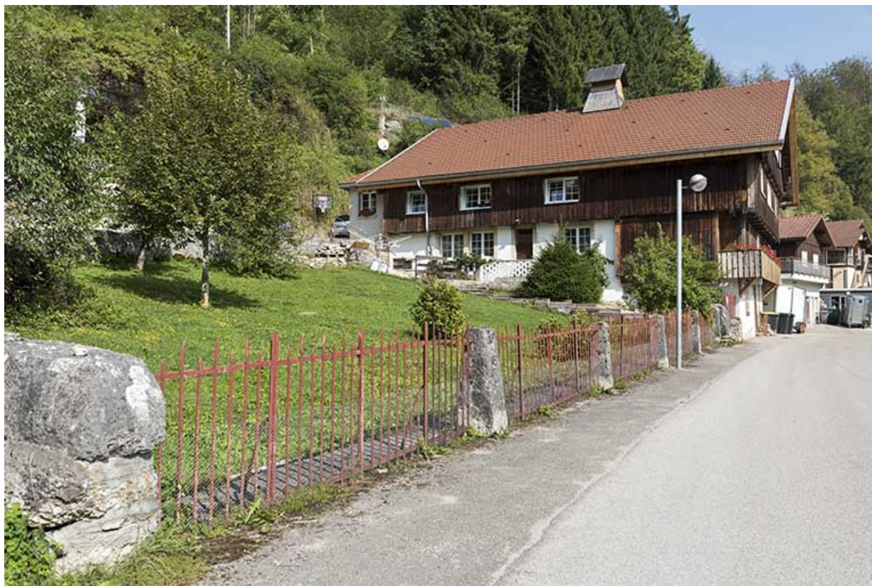
Vue d'ensemble, depuis le sud (façade latérale gauche).