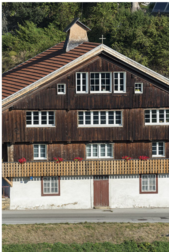
Façade antérieure : travées centrales.