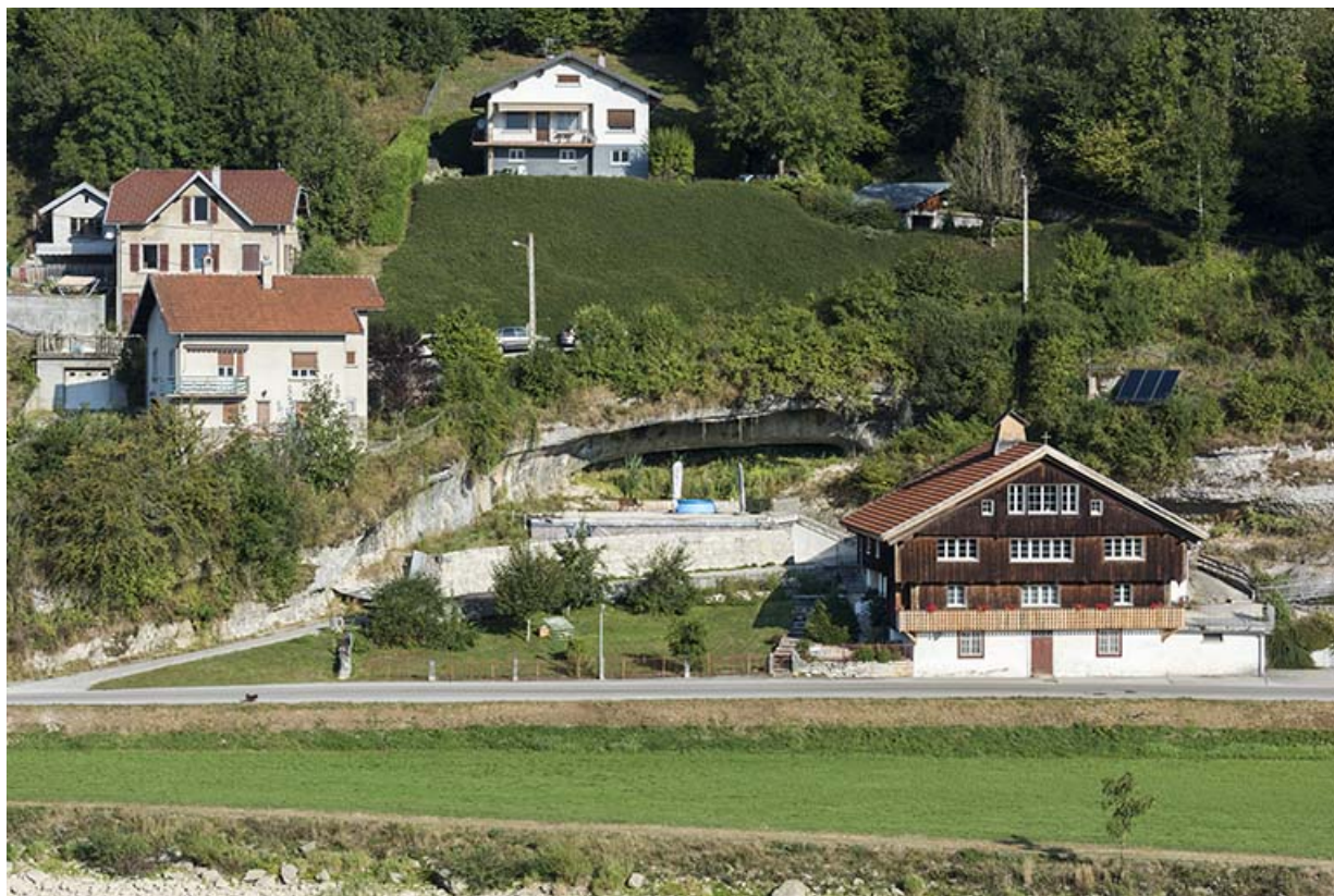
Vue d'ensemble, depuis le sud-est.