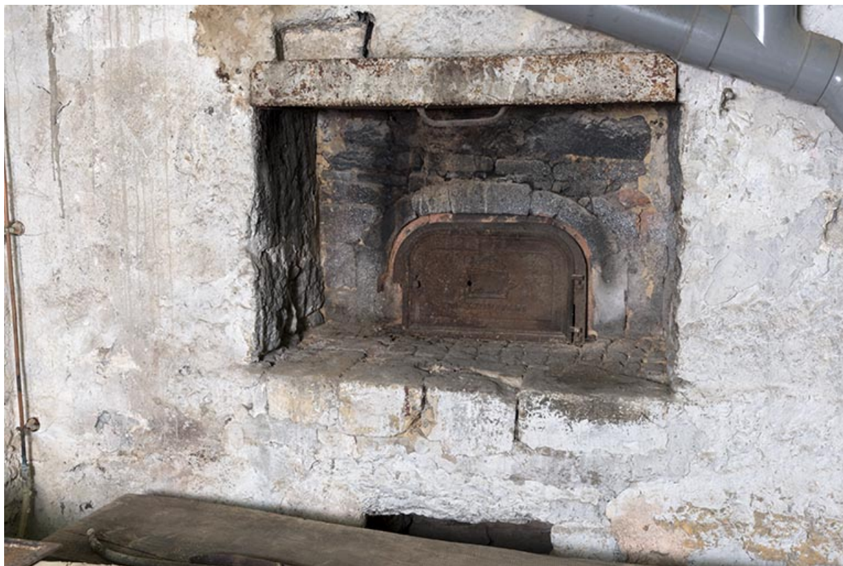
Deuxième étage de soubassement : four à pain.