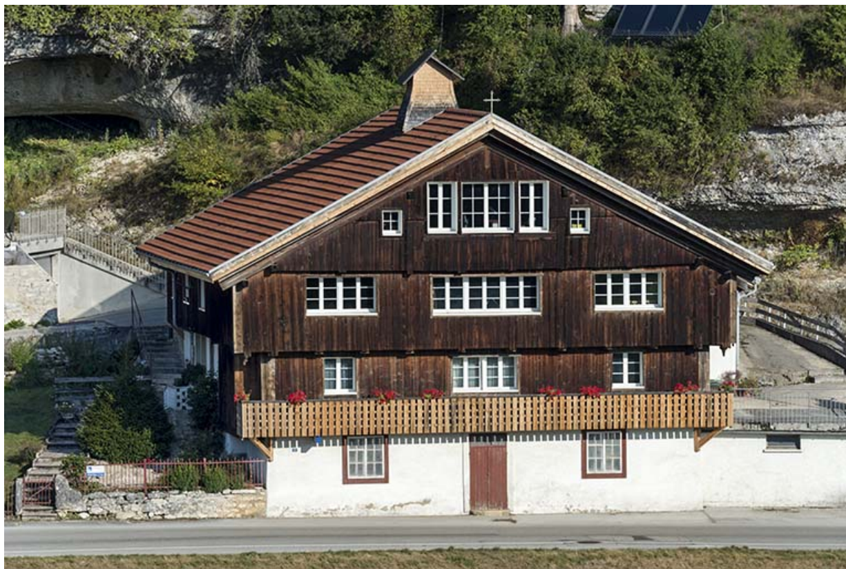
Façade antérieure, vue en plongée.