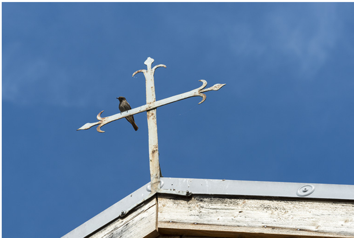
Croix métallique au faitage de la façade antérieure.