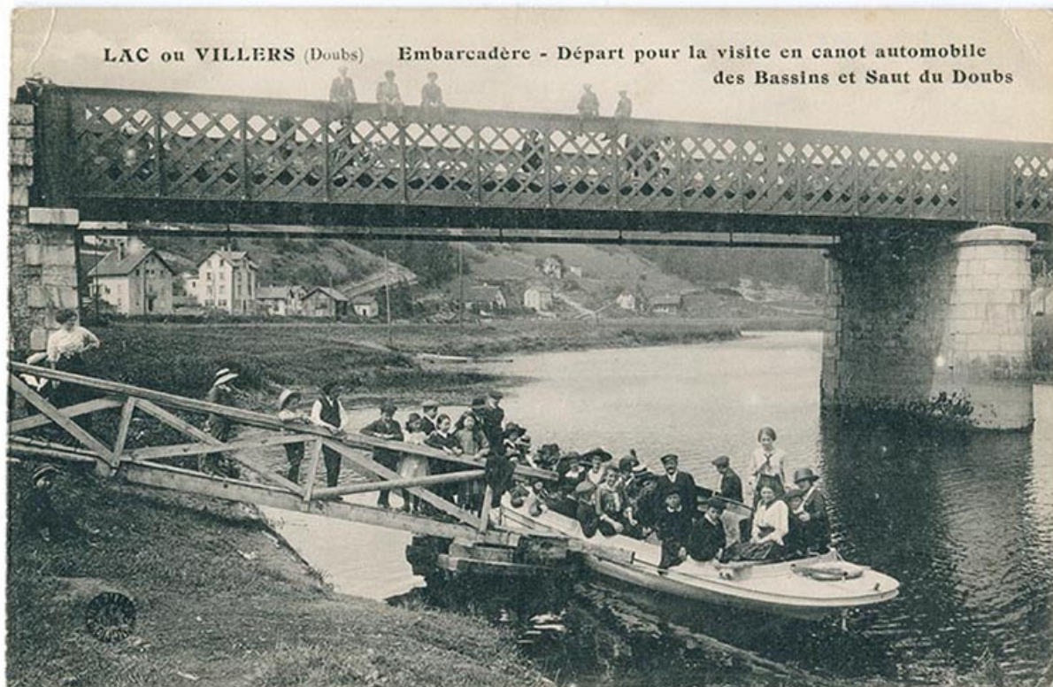
Lac ou Villers (Doubs). Embarcadère - Départ pour la visite en canot automobile des Bassins et Saut du Doubs, 1er quart 20e siècle [entre 1909 et 1916]