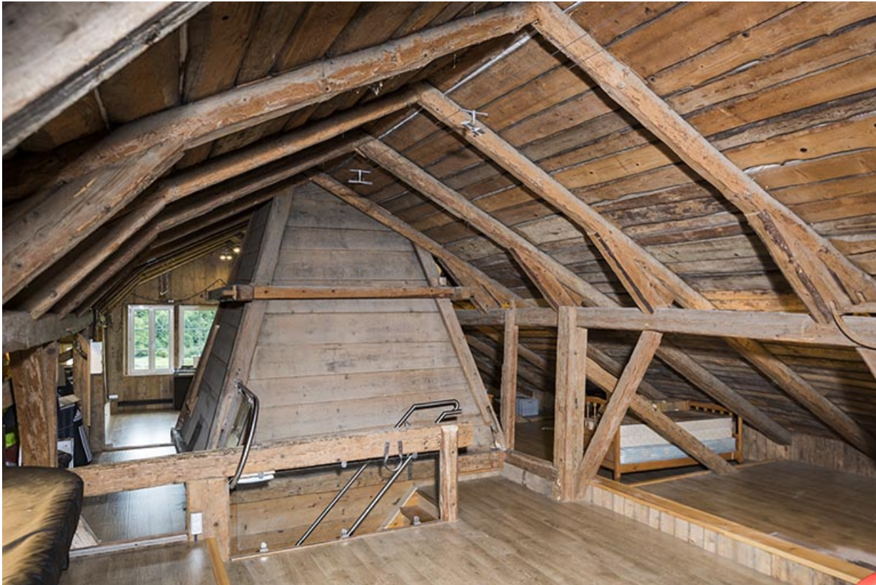
Etage en surcroît : charpente et tué.