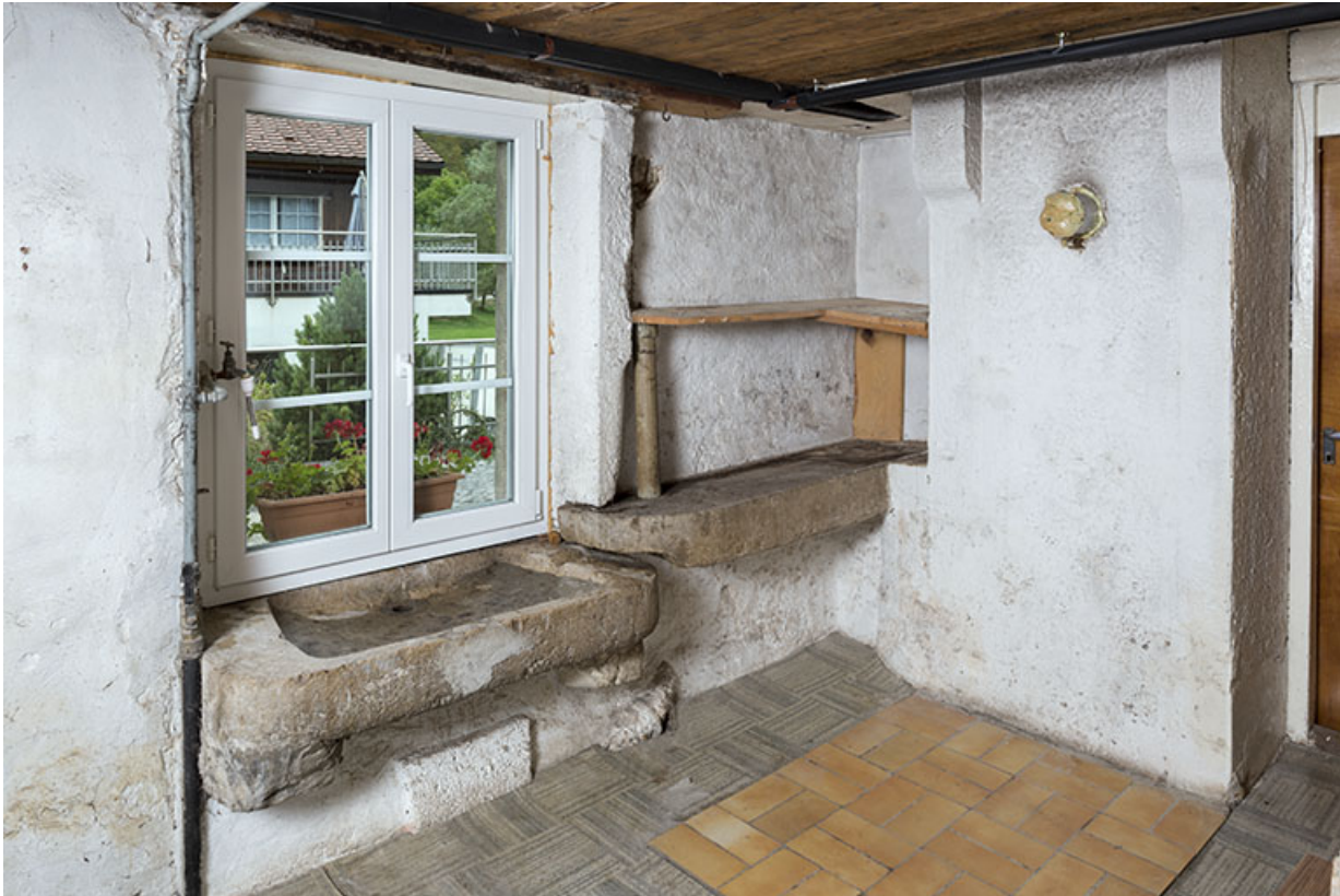
Premier étage de soubassement : ancien évier.