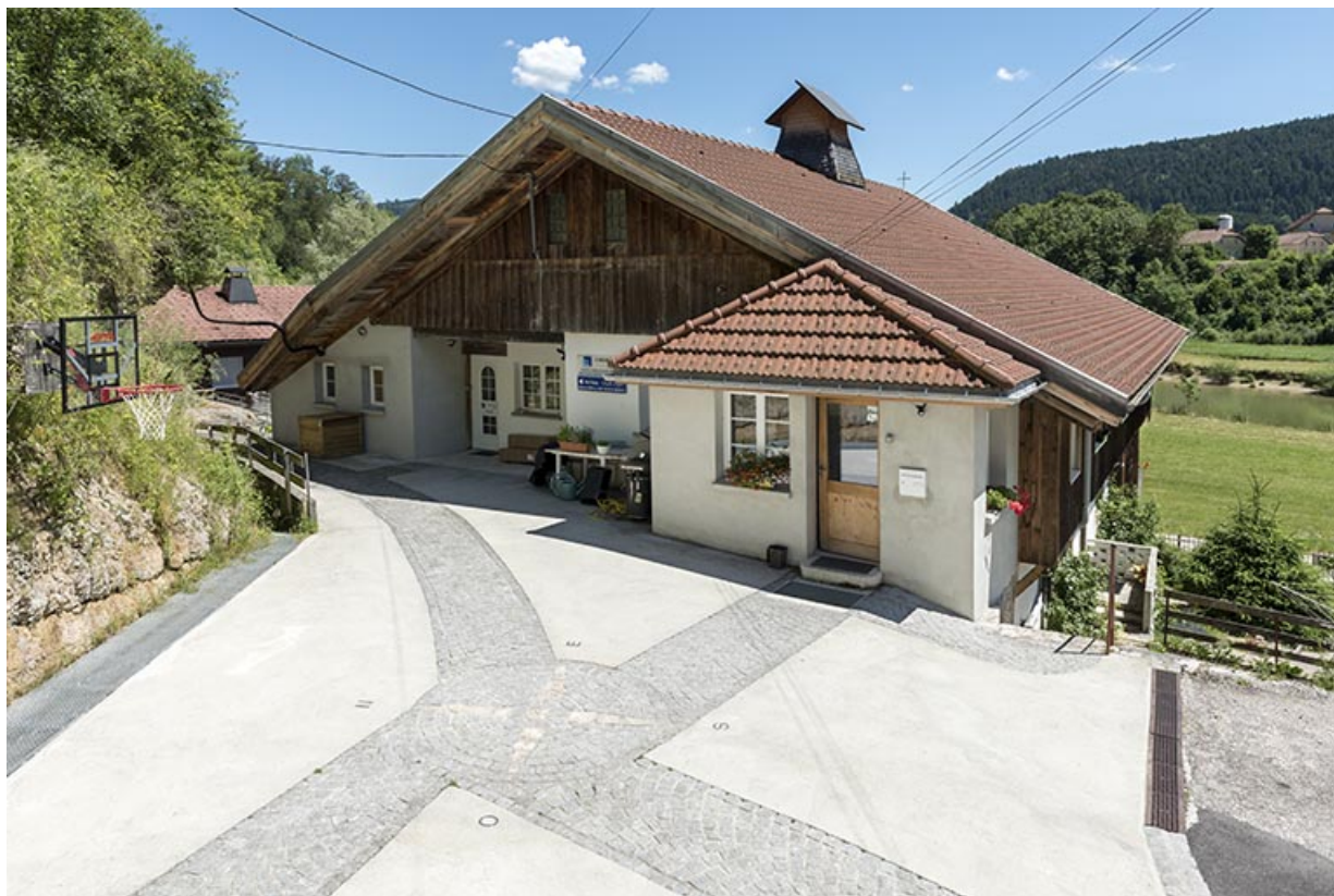
Façade postérieure, de trois quarts droite. 25, Villers-le-Lac, 19 rue du Lac