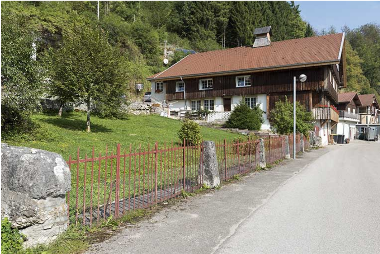
Vue d'ensemble, depuis le sud (façade latérale gauche).