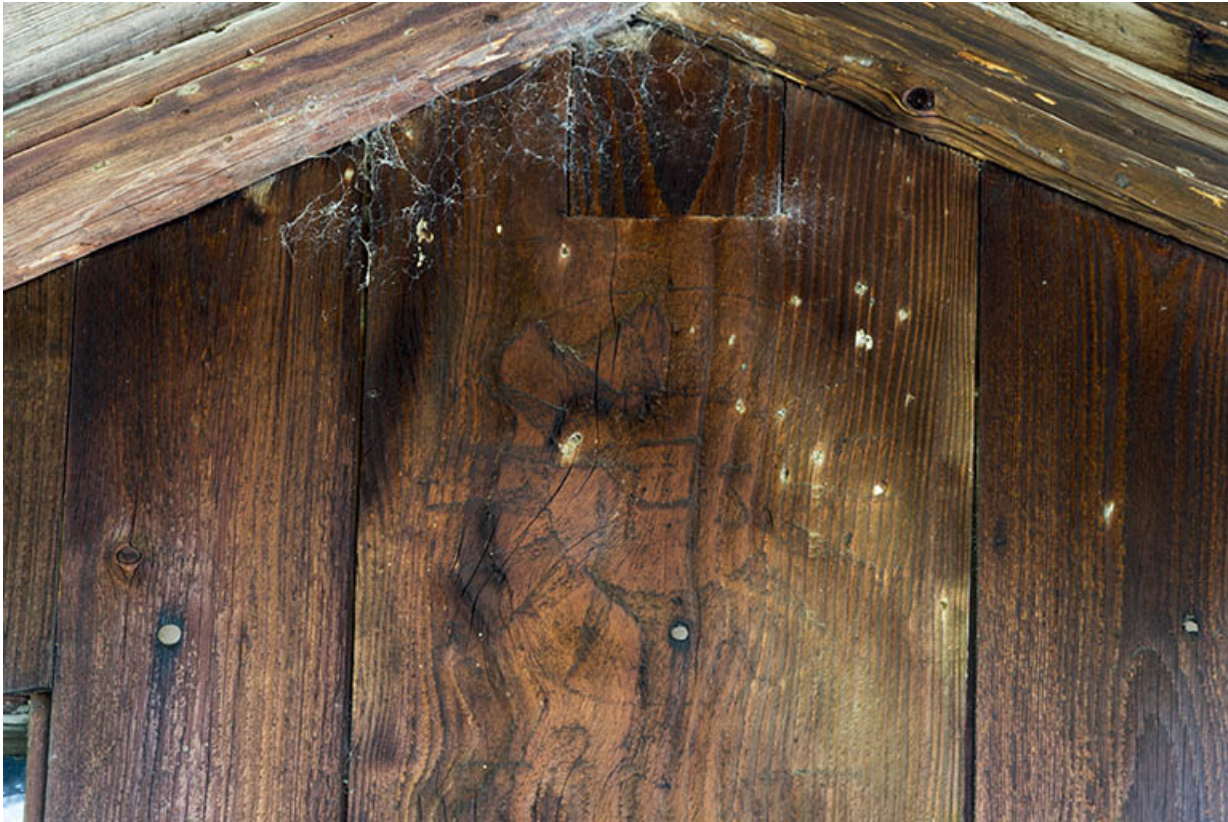
Façade postérieure : ostensoir-soleil associé au monogramme IHS.