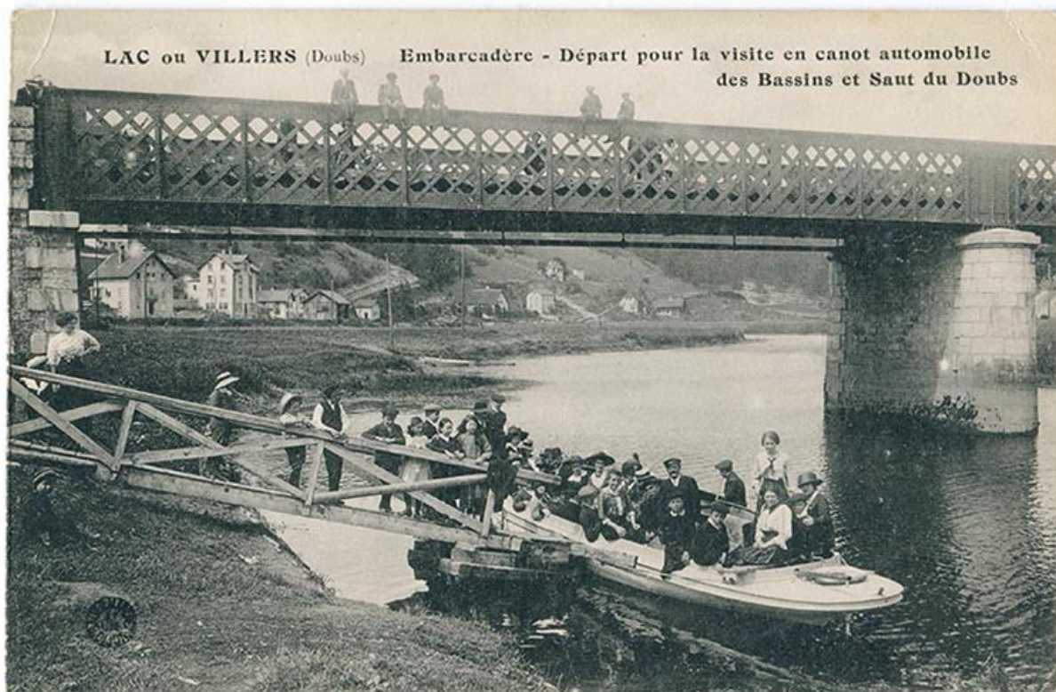
Lac ou Villers (Doubs). Embarcadère - Départ pour la visite en canot automobile des Bassins et Saut du Doubs, 1er quart 20e siècle [entre 1909 et 1916]