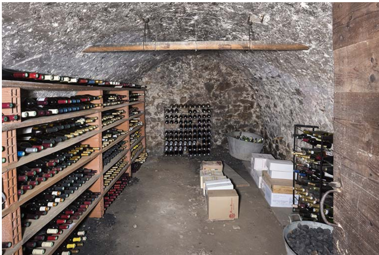
Deuxième étage de soubassement : cellier.