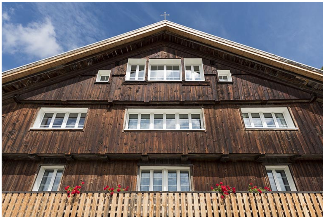
Façade antérieure, vue en contre-plongée.