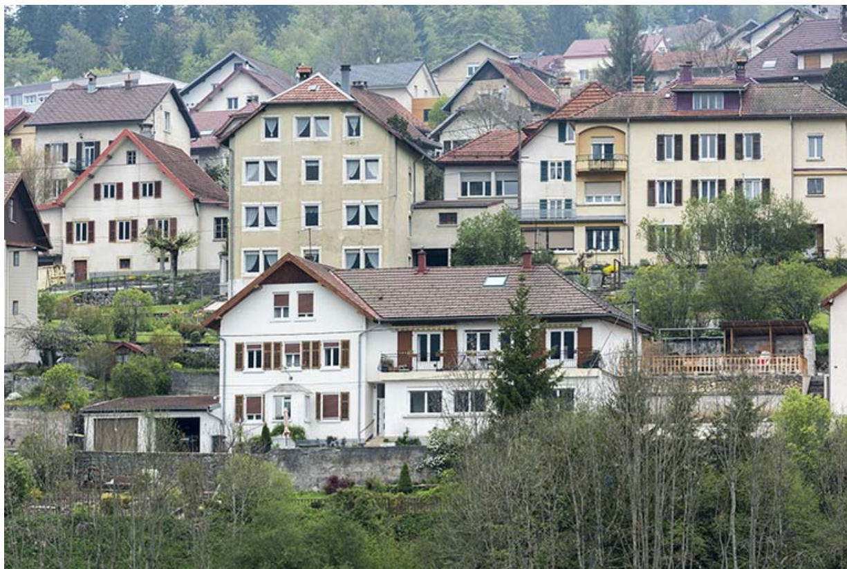
Vue d'ensemble éloignée, depuis l'est.