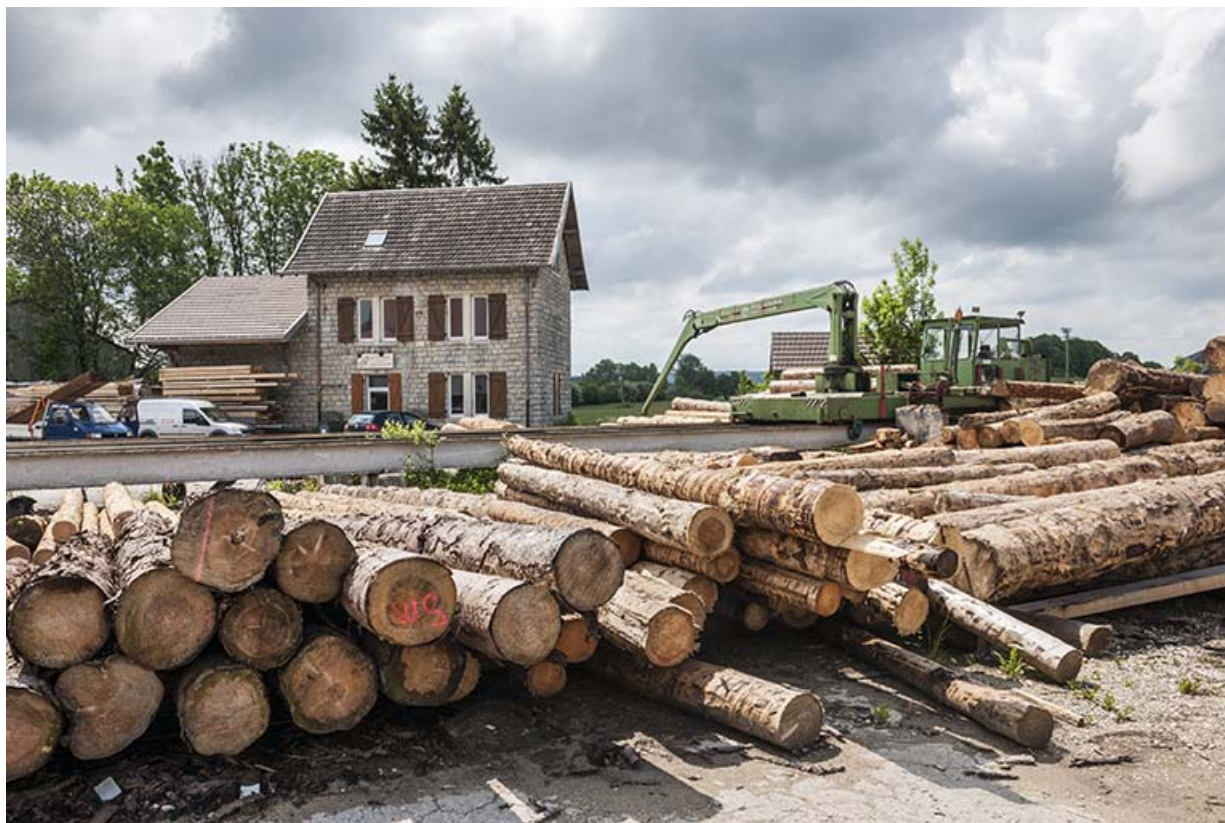
Les bureaux (ancienne gare) et le parc à grumes. 25, Évillers, 14 Grande Rue