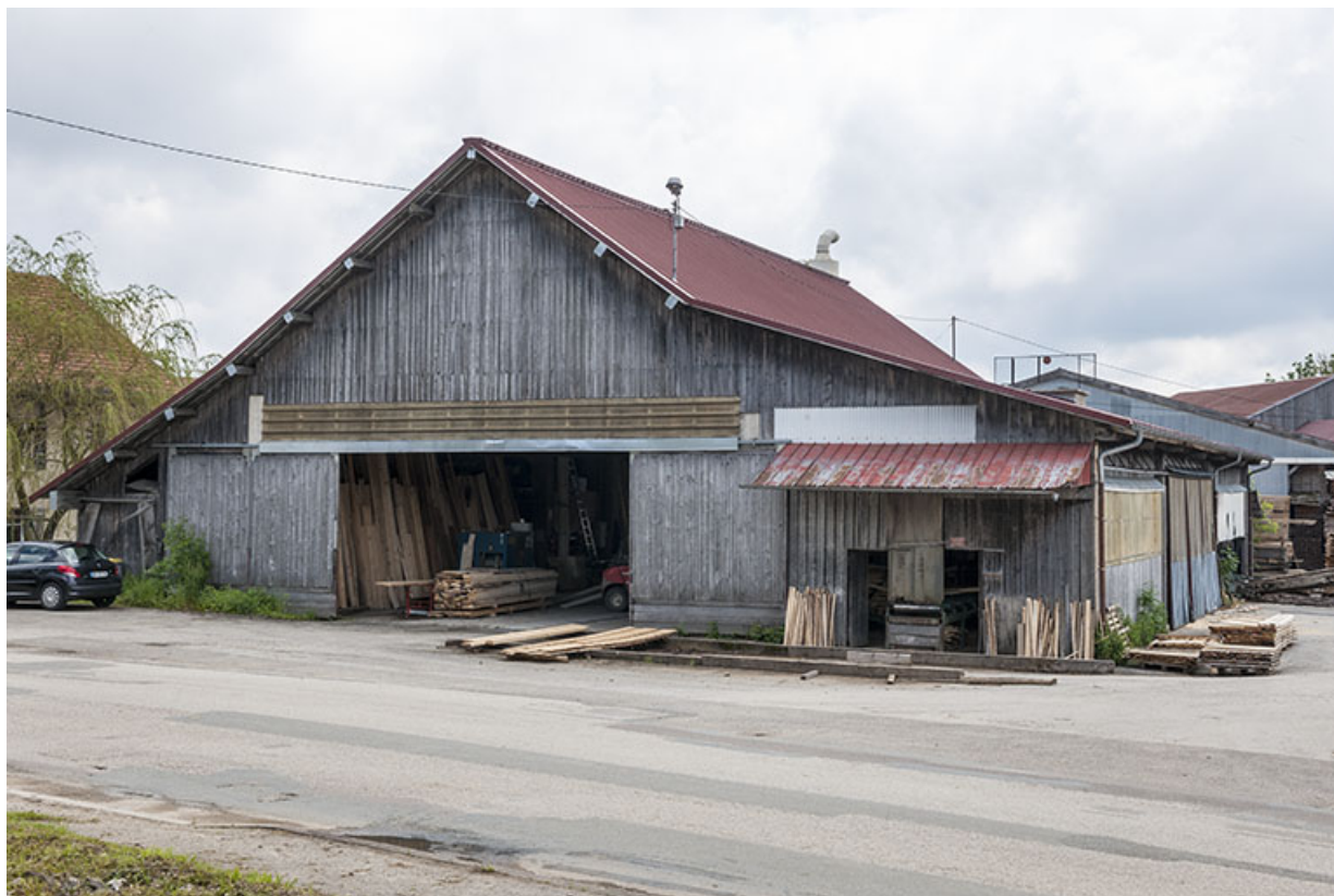
Atelier de scierie vu de trois quarts droite.