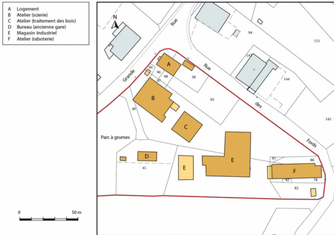
Plan-masse et de situation. Extrait du plan cadastral, 2016, section ZD. 25, Évillers, 14 Grande Rue