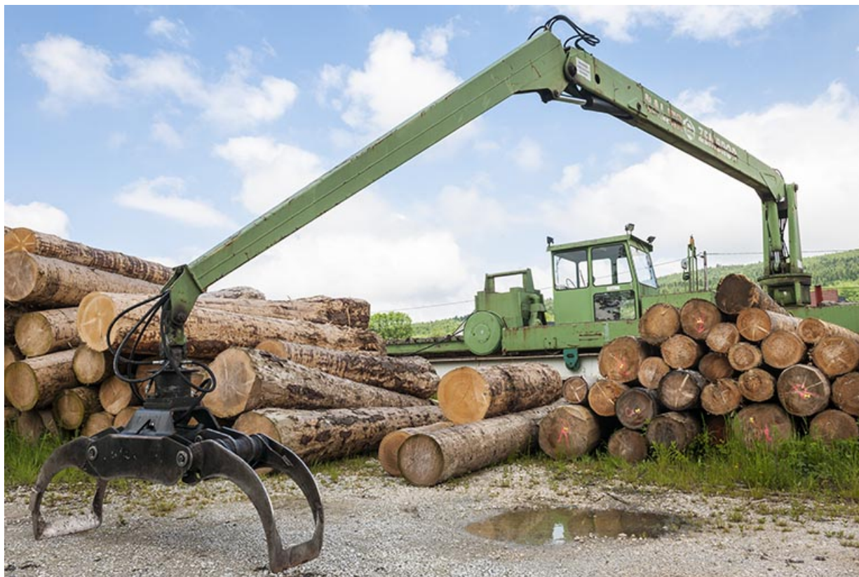
Grue mobile sur le parc à grumes.