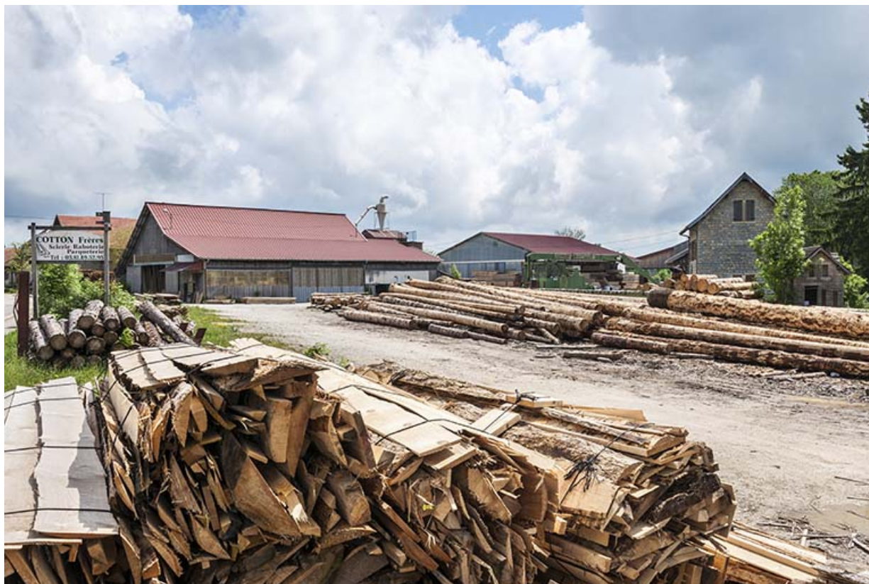
Vue d'ensemble depuis le sud-ouest. 25, Évillers, 14 Grande Rue