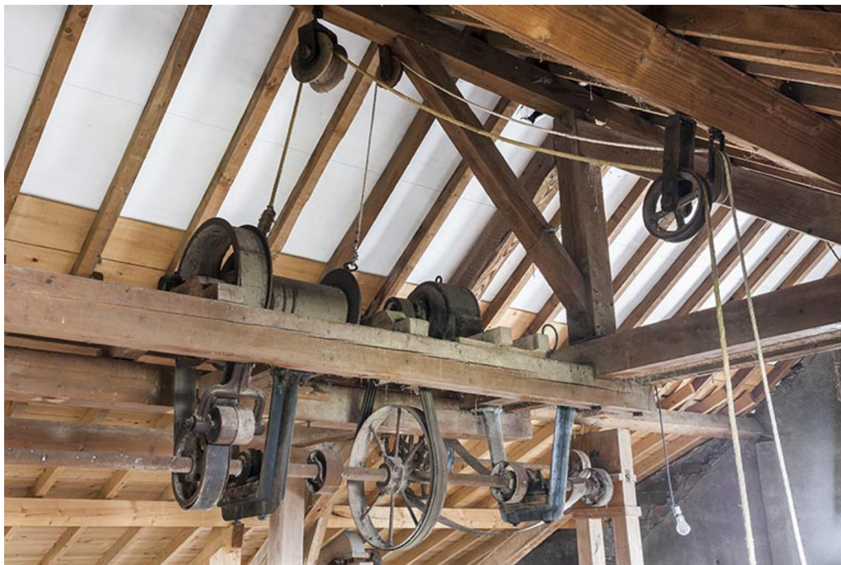
Etage en surcroît. Système de transmission et d'enroulement du monte-sac. 25, Levier, 8 rue de Champagnole