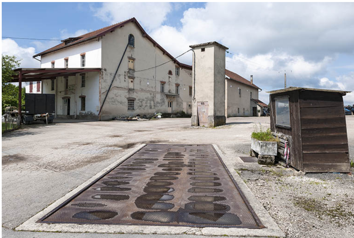
Vue d'ensemble depuis le pont bascule.