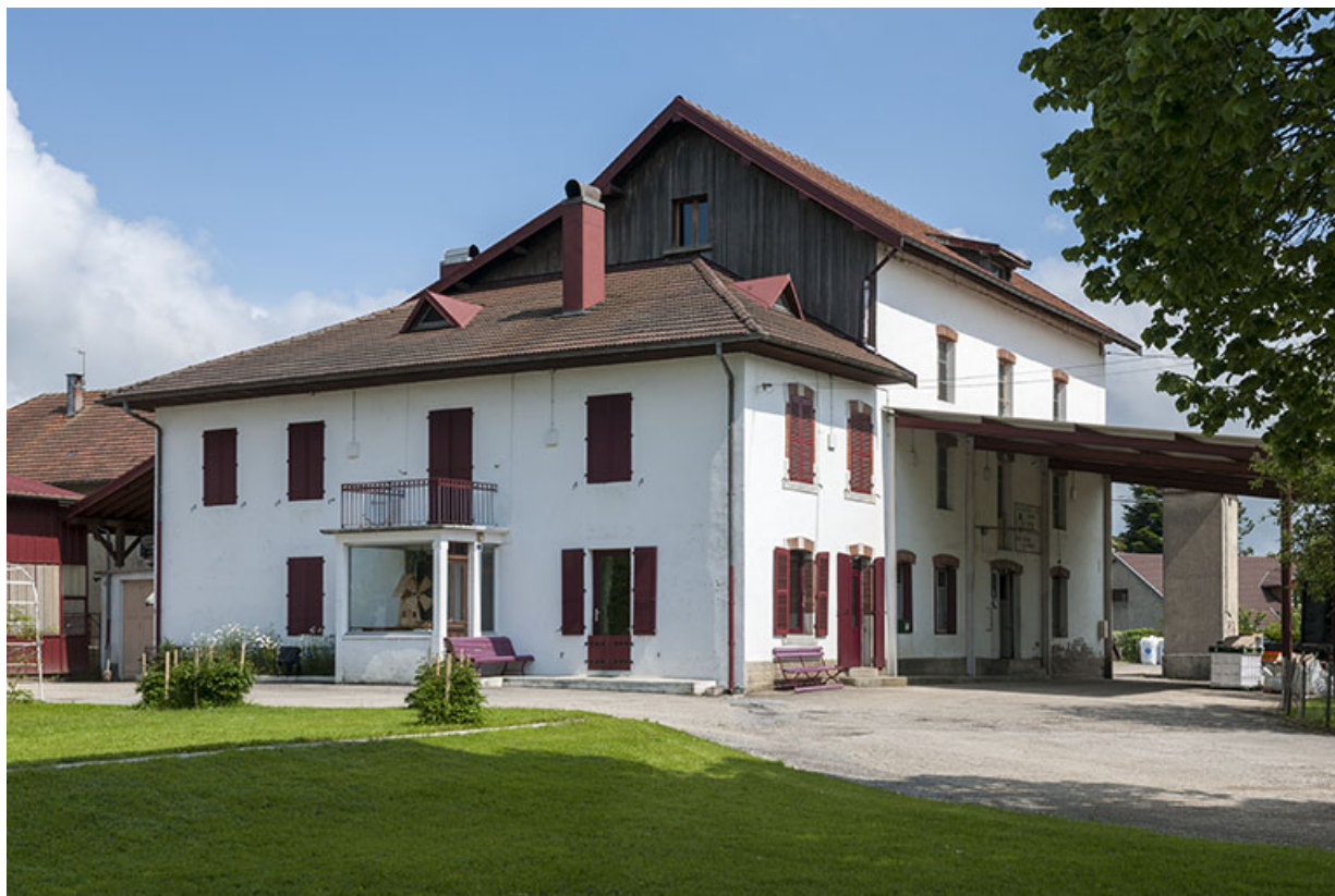
Vue d'ensemble depuis le sud-est. Logement au premier plan.