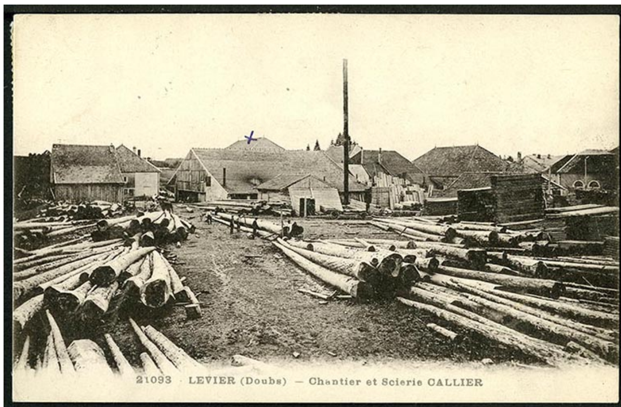
Levier (Doubs). Chantier et scierie Callier, carte postale, s.d. [fin 19e ou début 20e siècle]. 25, Levier, 8 rue de Champagnole