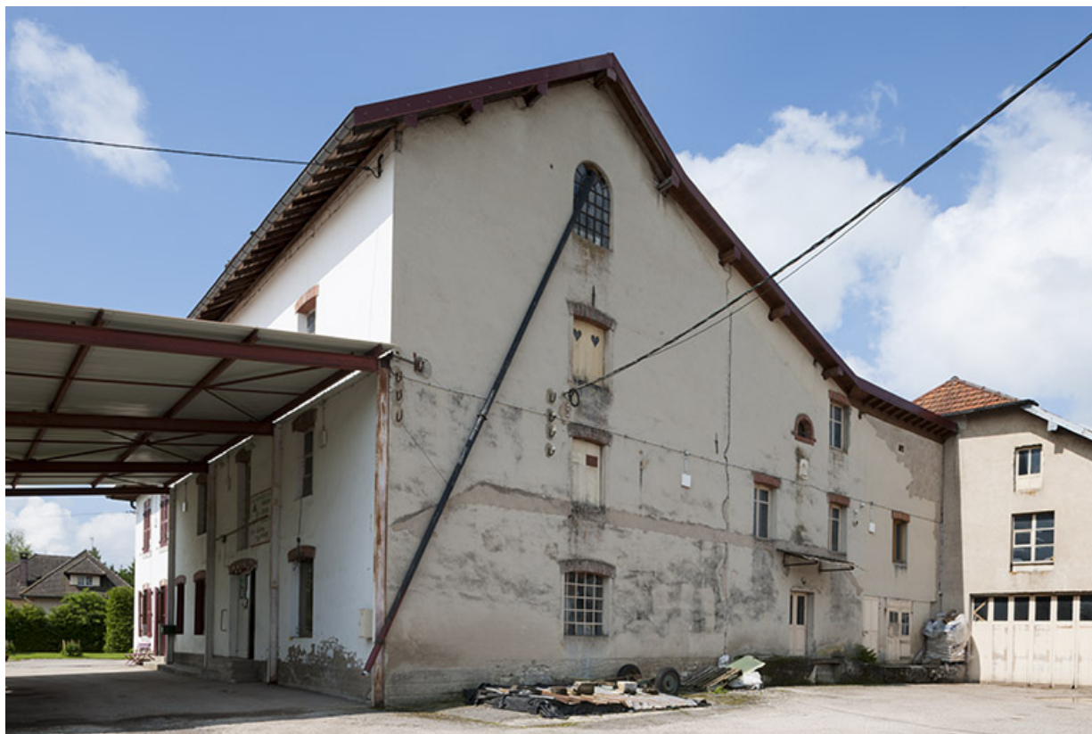
Vue rapprochée depuis le nord-est.