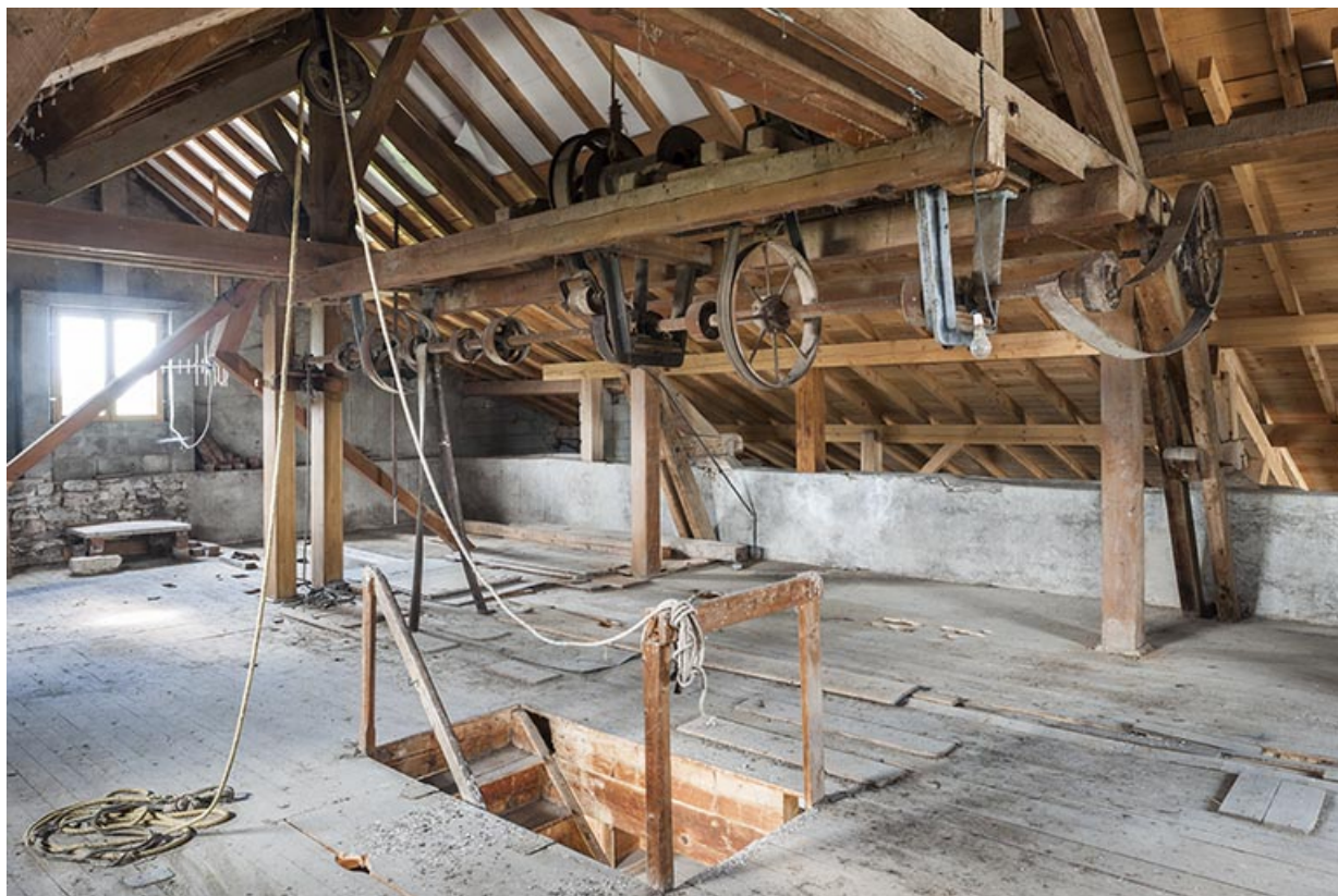
Etage en surcroît. Vue d'ensemble.