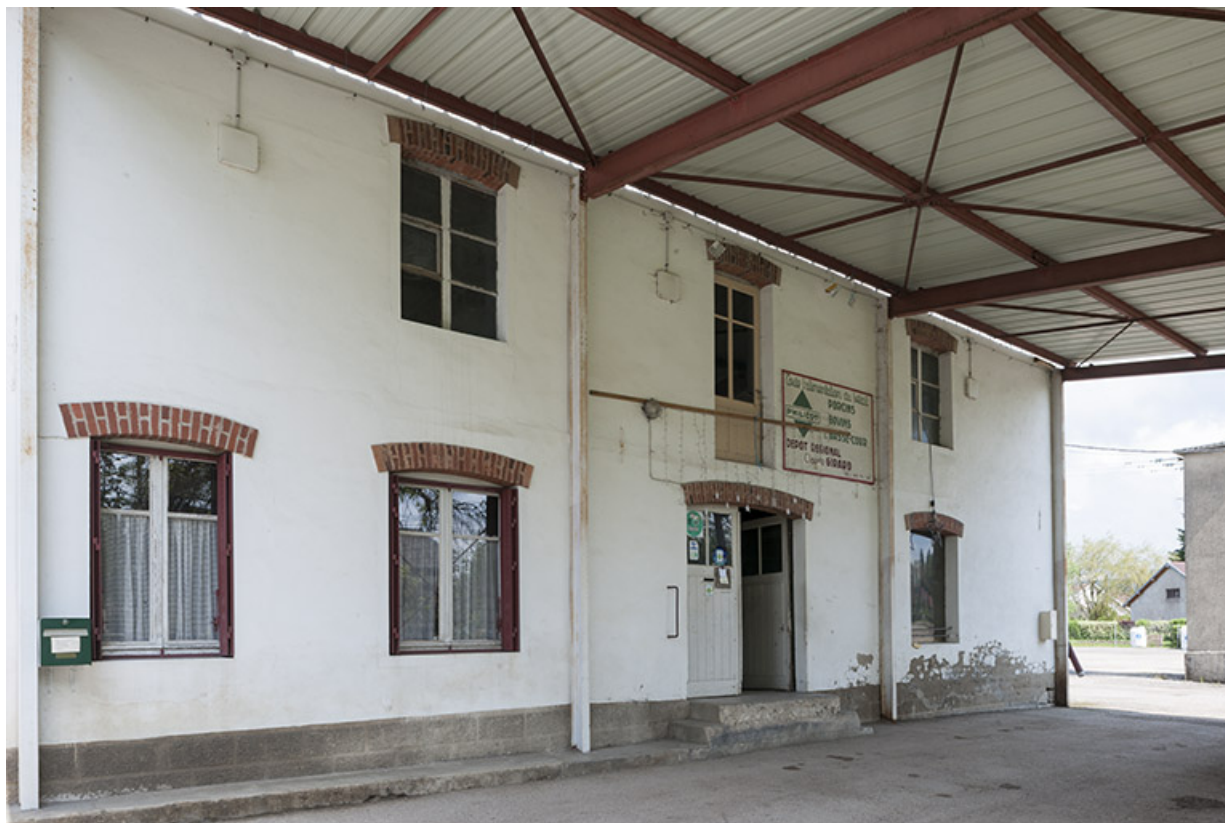
Façade est de la minoterie. 25, Levier, 8 rue de Champagnole