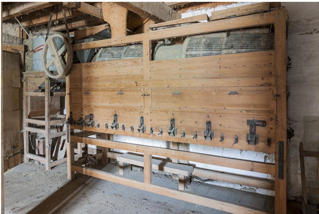
Trieur à grains Emile Marot.