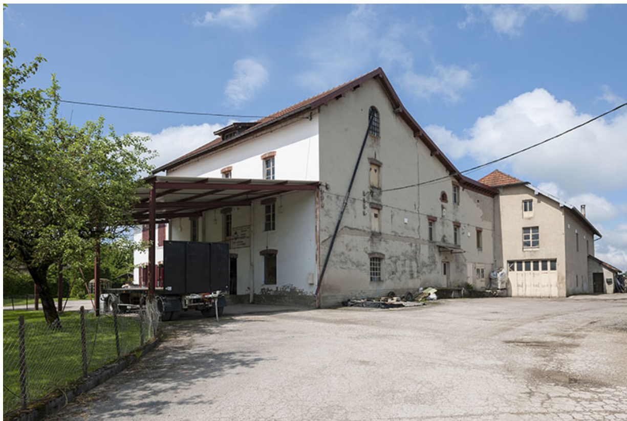
Vue d'ensemble depuis le nord-est.