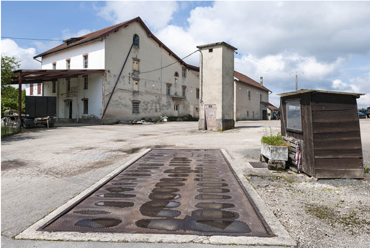
Vue d'ensemble depuis le pont bascule.