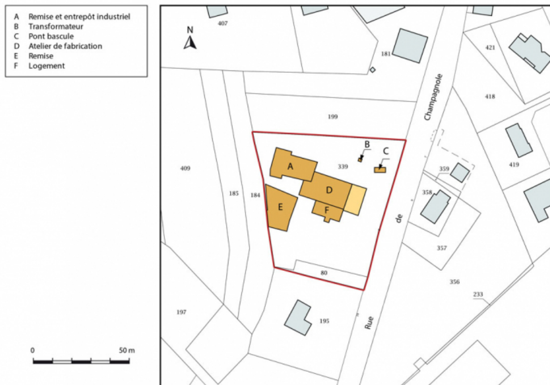
Plan-masse et de situation. Extrait du plan cadastral, 2016, section AE.