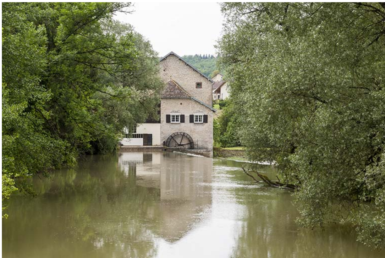
Vue d'ensemble depuis l'amont du Lison.