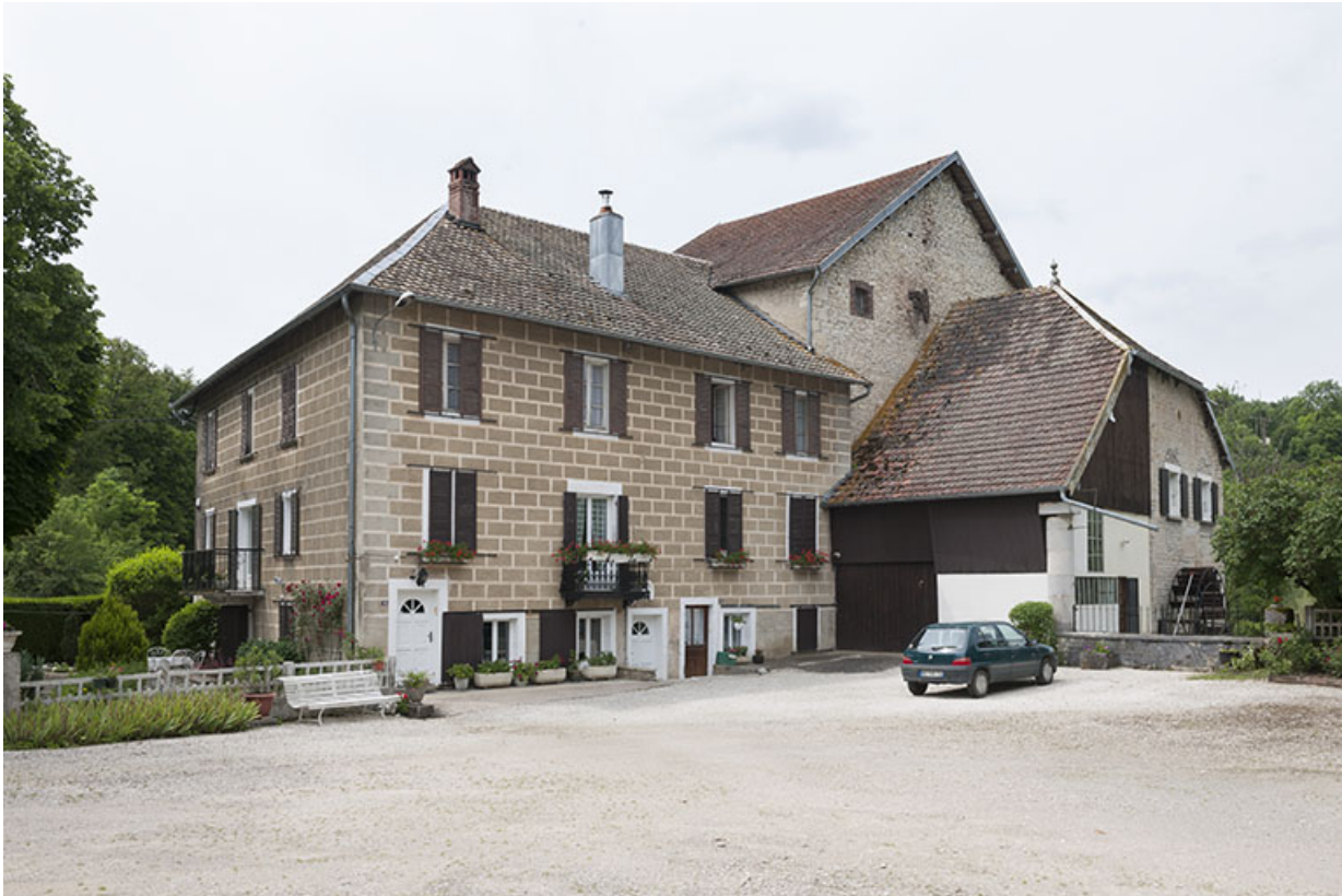
Logement et moulin depuis la cour.