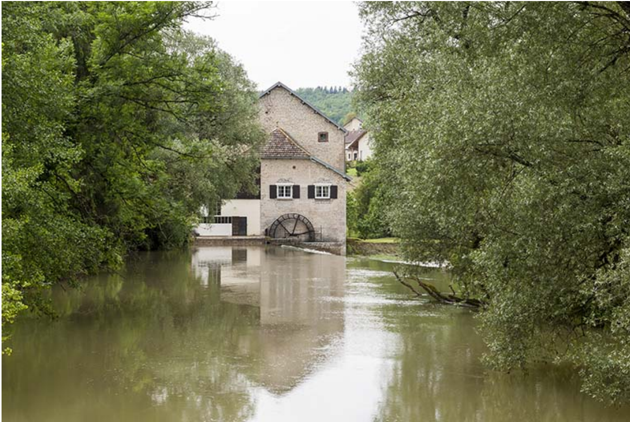
Vue d'ensemble depuis l'amont du Lison.