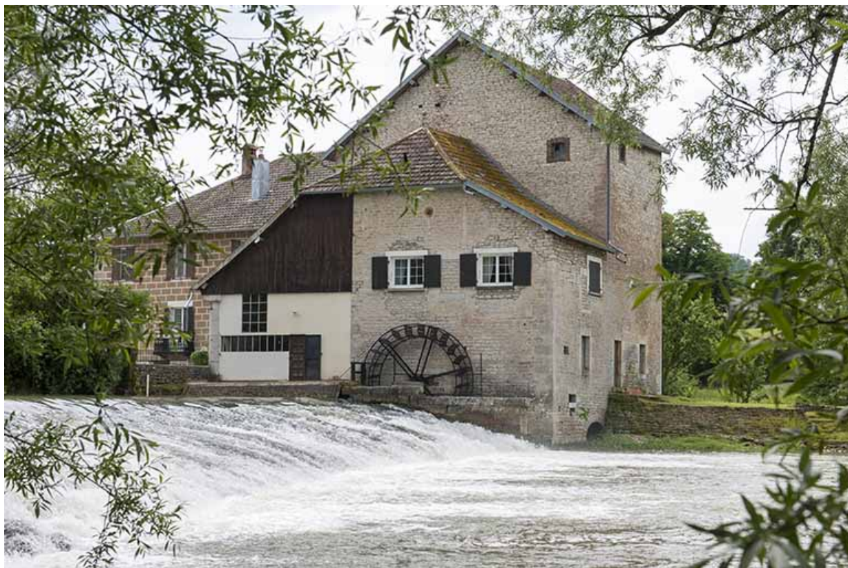
Vue d'ensemble depuis le nord-est.