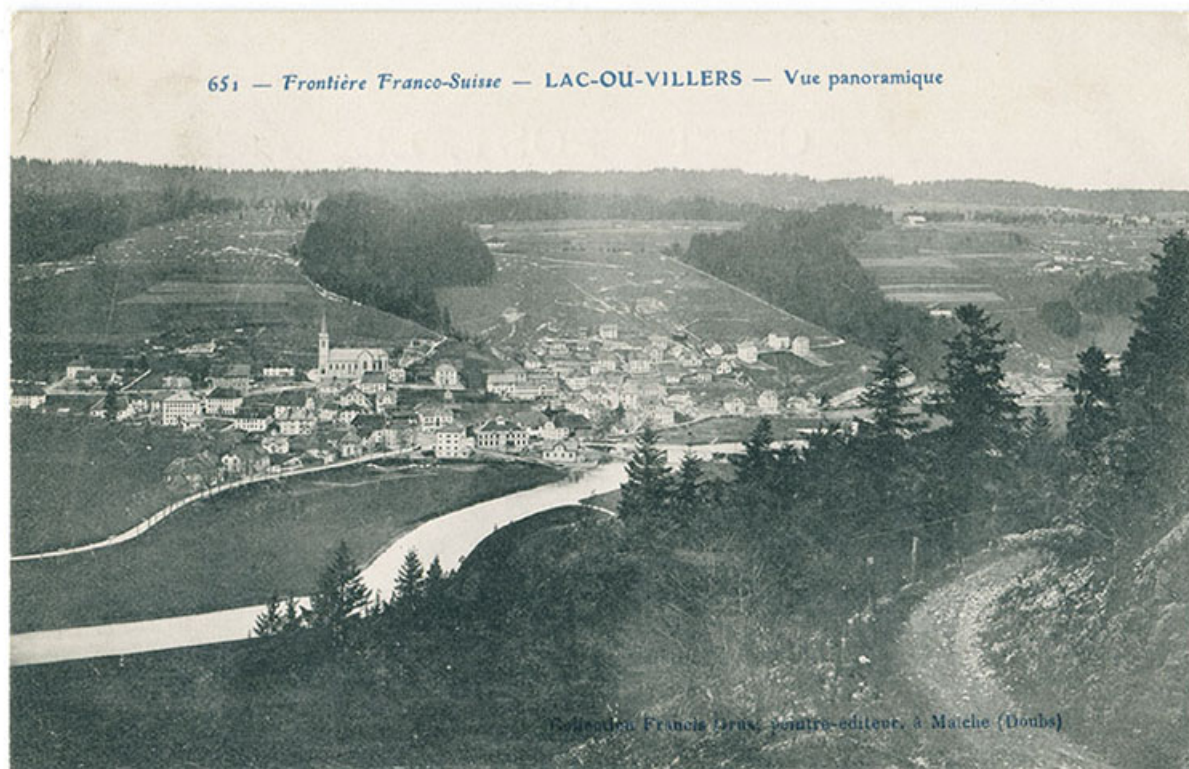
651 - Frontière franco-suisse - Lac-ou-Villers - Vue panoramique [depuis la montagne au sud-est], 1er quart 20e siècle [avant 1908]. 25, Villers-le-Lac

651 - Frontière franco-suisse - Lac-ou-Villers - Vue panoramique [depuis la montagne au sud-est], carte postale, par Francis Grux, s.d. [1er quart 20e siècle, avant 1908], Francis Grux peintre-éditeur à Maiche Lieu de conservation : Collection particulière : Henri Ethalon, Les Ecorces