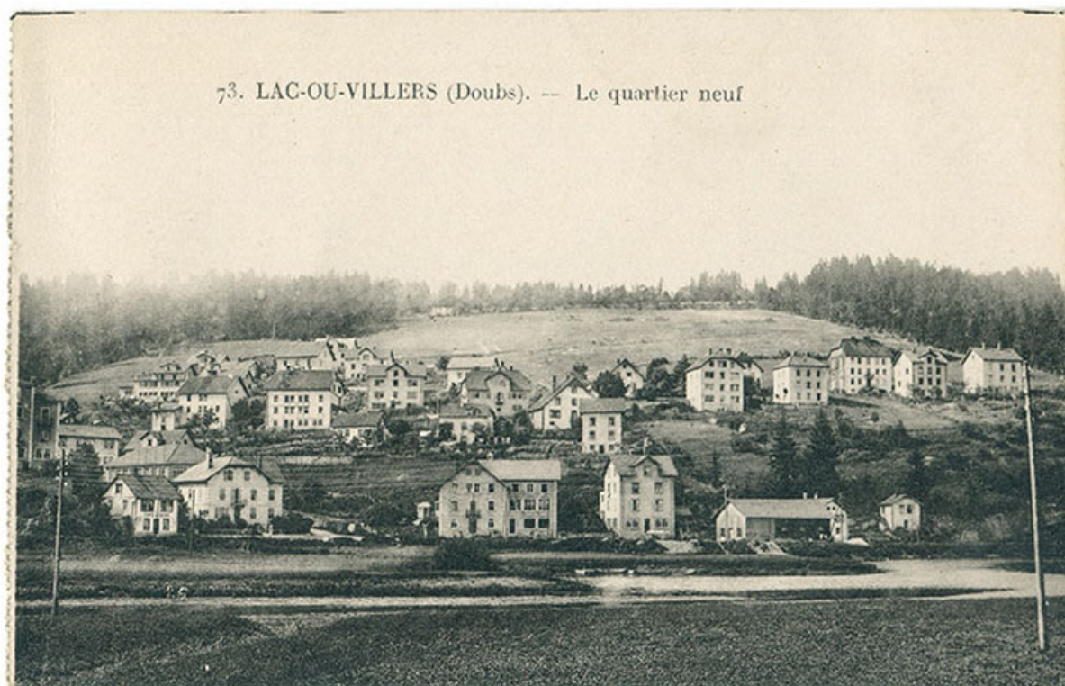
73. Lac-ou-Villers (Doubs). - Le quartier neuf [vu de l'est], 2e quart 20e siècle [vers 1925-1927]. Seul existe le premier bâtiment (au centre à gauche). 25, Villers-le-Lac