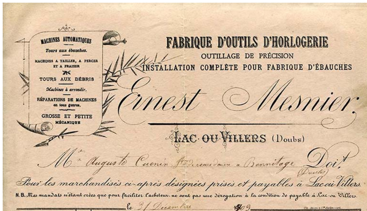
Papier à en-tête d'Ernest Mesnier [détail], 31 décembre 1903