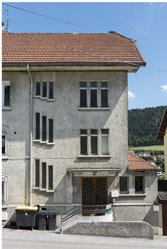
Façade antérieure : partie droite.

25, Villers-le-Lac, 22 rue du Quartier neuf