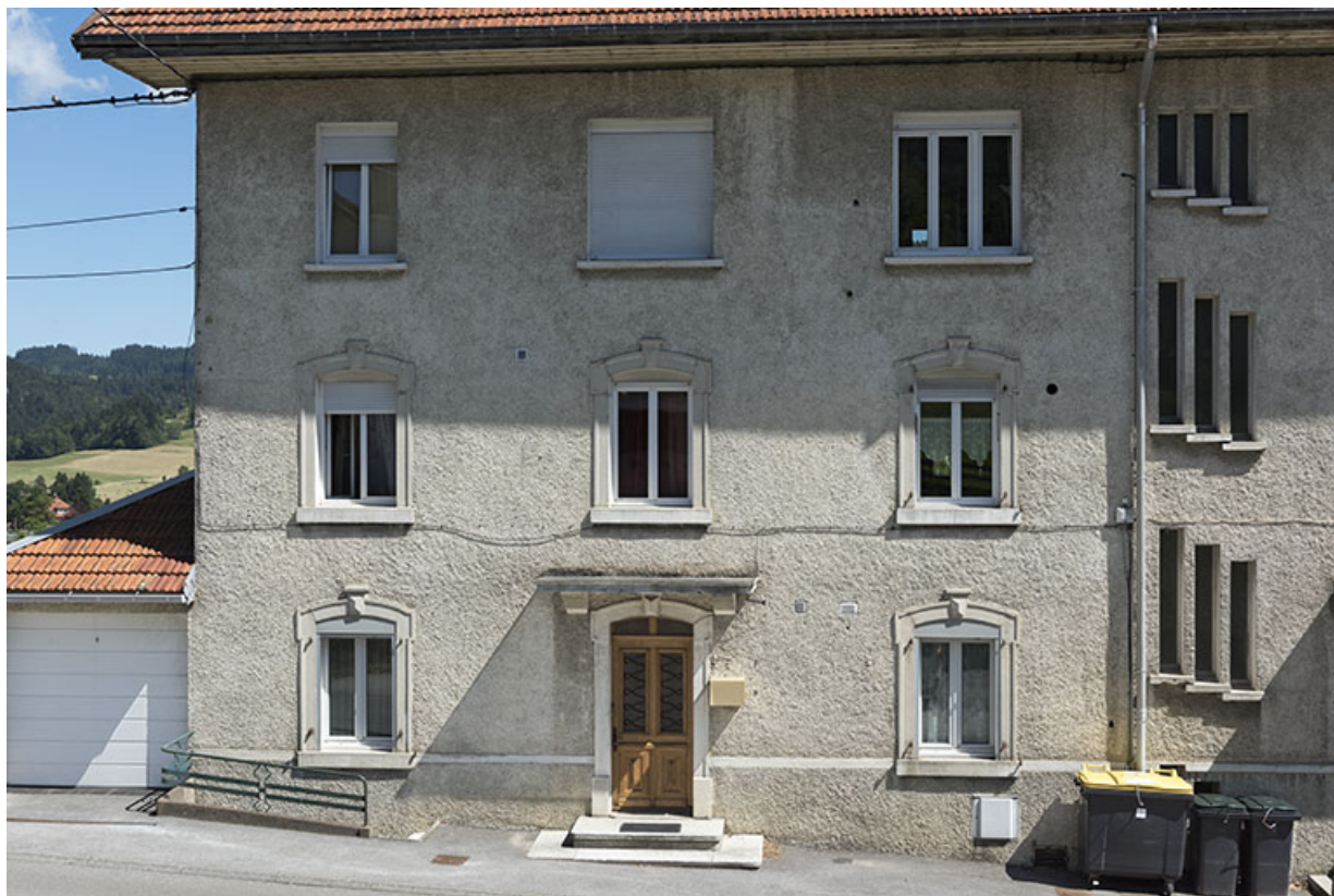
Façade antérieure : partie gauche.

25, Villers-le-Lac, 22 rue du Quartier neuf