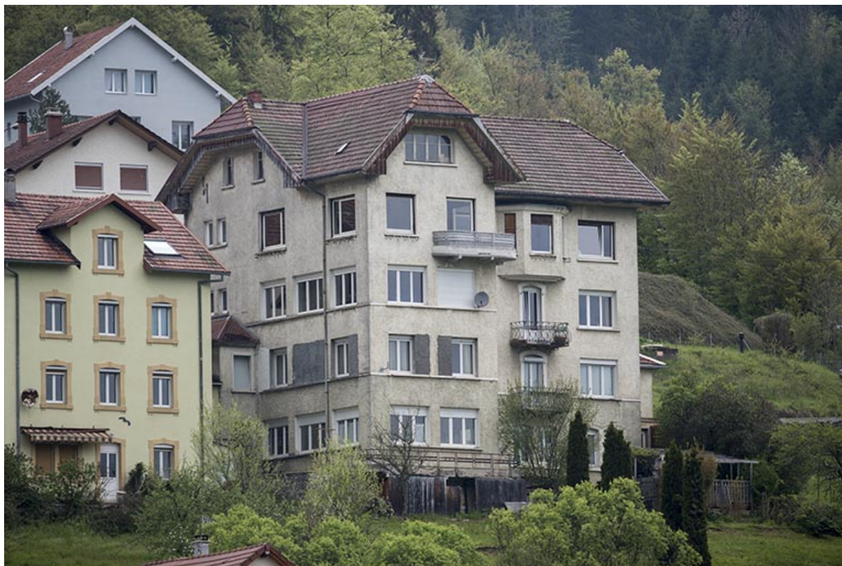
Façades postérieure et latérale droite.

25, Villers-le-Lac, 22 rue du Quartier neuf