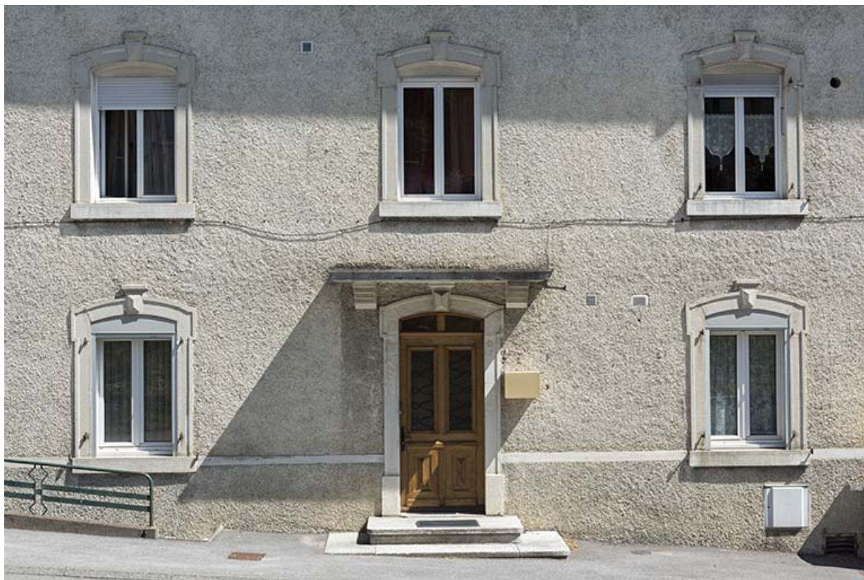
Façade antérieure : baies du bâtiment d'origine.

25, Villers-le-Lac, 22 rue du Quartier neuf