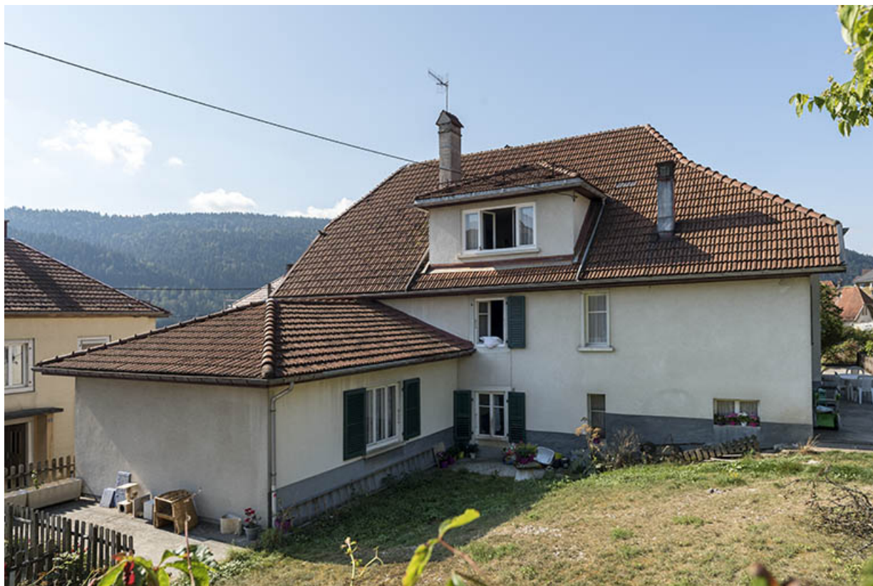
Façade latérale droite, de trois quarts.

25, Villers-le-Lac, 21 rue du Quartier neuf