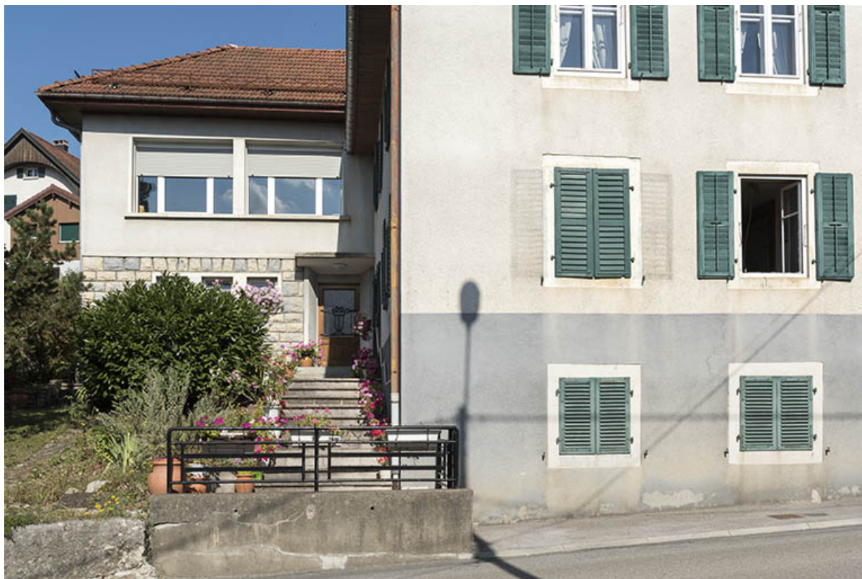
Façade antérieure de l'atelier de fabrication.

25, Villers-le-Lac, 21 rue du Quartier neuf