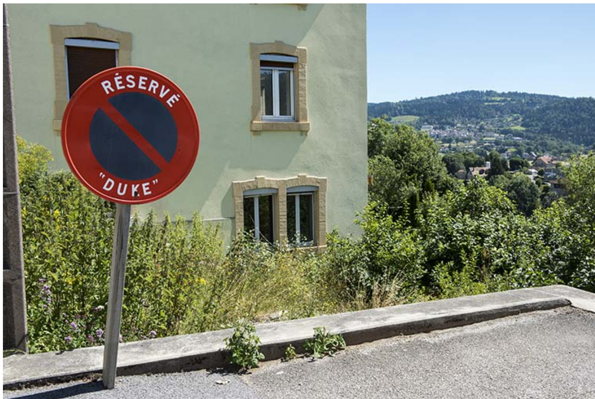
Panneau de la "Duke".

25, Villers-le-Lac, 18 rue du Quartier neuf