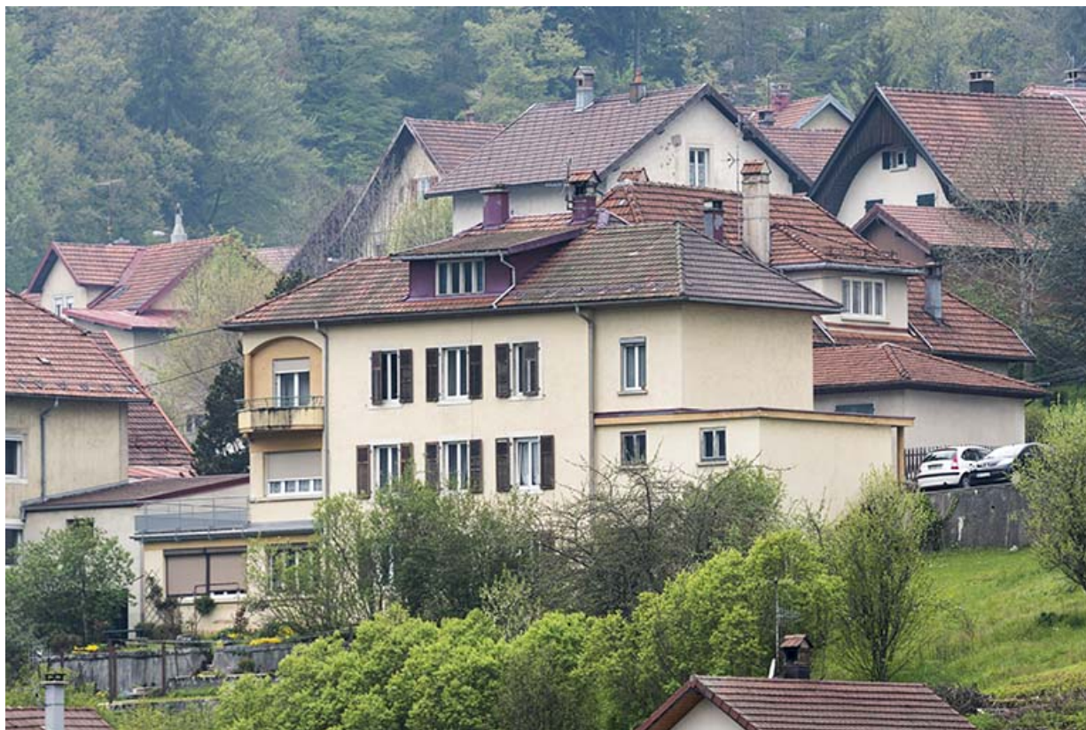
Façade postérieure, de trois quarts droite. 25, Villers-le-Lac, 18 rue du Quartier neuf