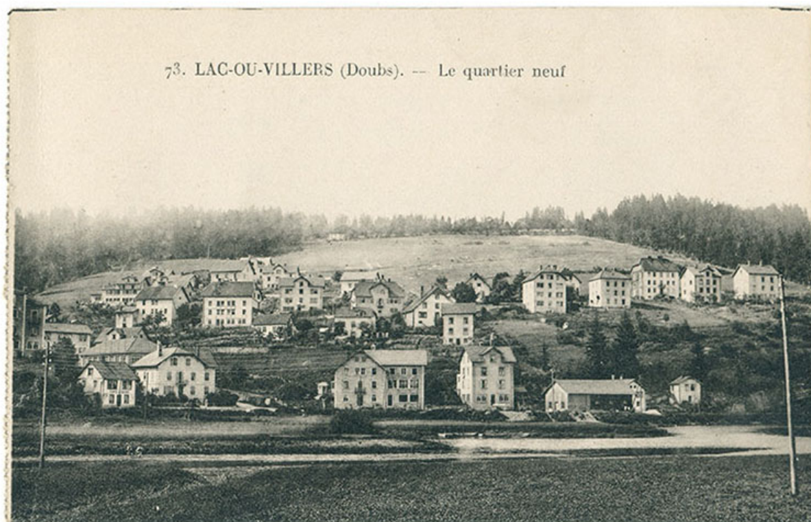
73. Lac-ou-Villers (Doubs). - Le quartier neuf [vu de l'est], 2e quart 20e siècle [vers 1925-1927]. Seul existe le premier bâtiment (au centre à gauche).