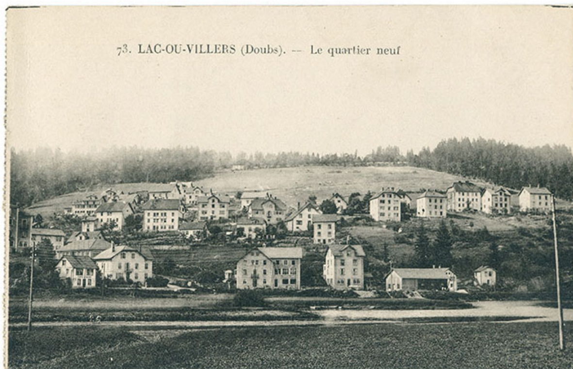
73. Lac-ou-Villers (Doubs). - Le quartier neuf [vu de l'est], 2e quart 20e siècle [vers 1925-1927]. Seul existe le premier bâtiment (au centre à gauche). 25, Villers-le-Lac