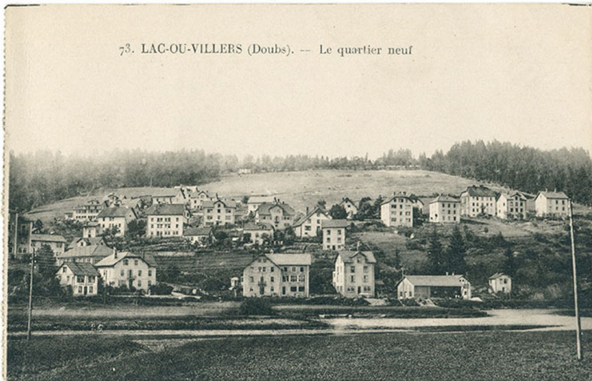
73. Lac-ou-Villers (Doubs). - Le quartier neuf [vu de l'est], 2e quart 20e siècle [vers 1925-1927]. Seul existe le premier bâtiment (au centre à gauche). 25, Villers-le-Lac