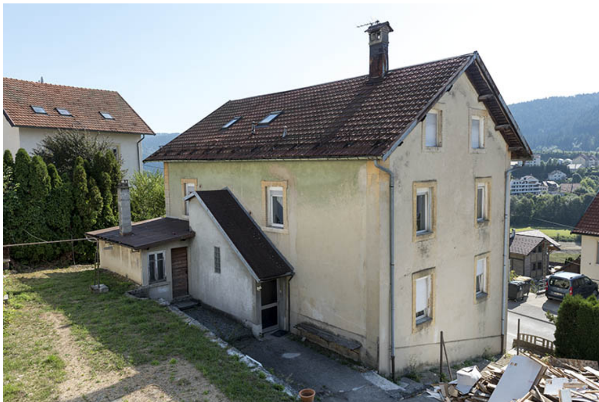
Façades postérieure et latérale gauche. 25, Villers-le-Lac, 15 rue du Quartier neuf