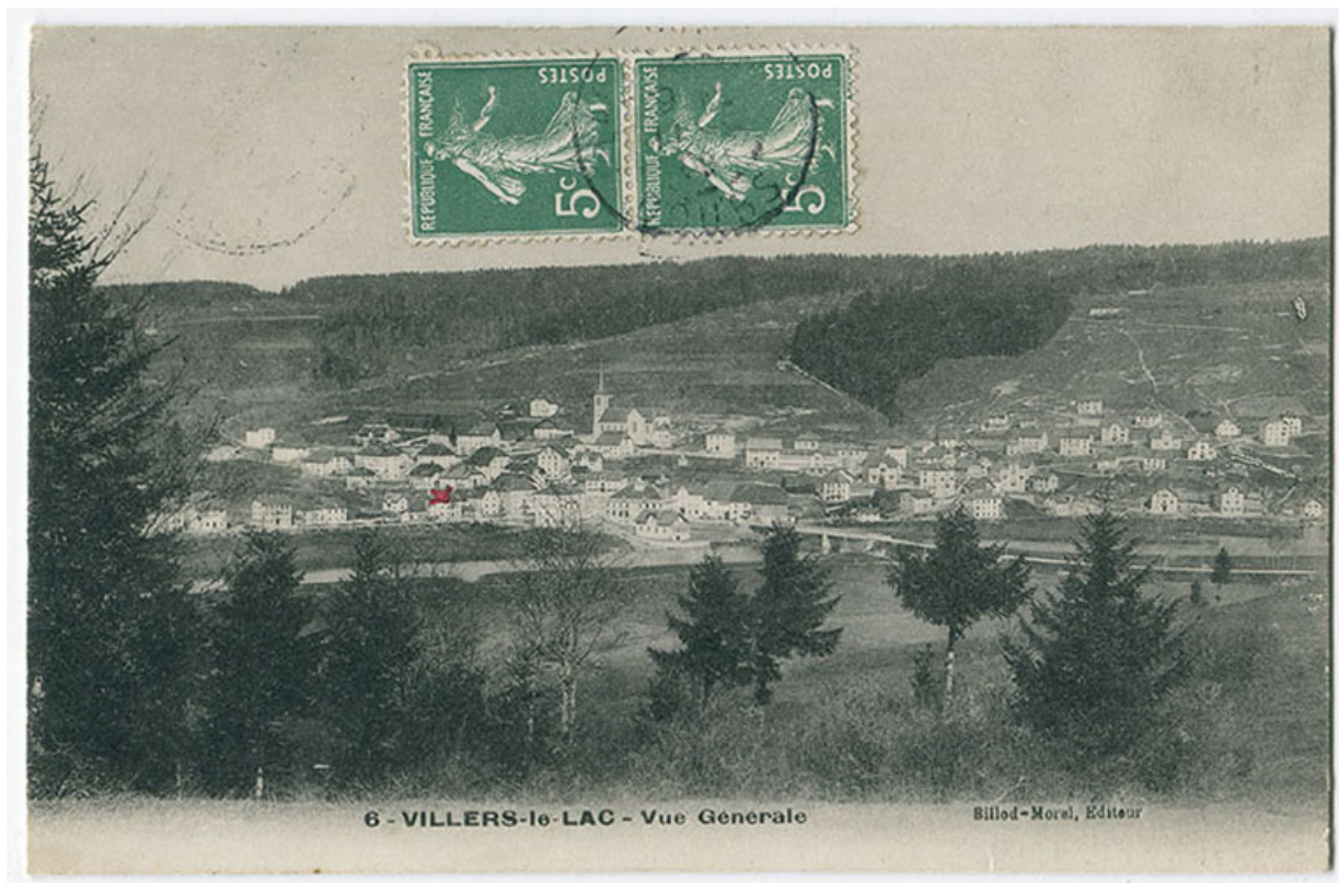
6 - Villers-le-Lac - Vue générale [depuis l'est], 1er quart 20e siècle [avant 1908]. Seul existe le premier bâtiment. 25, Villers-le-Lac