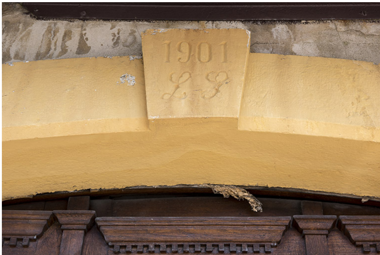
Façade antérieure : date et initiales sur le linteau de la porte.

25, Villers-le-Lac, 15 rue du Quartier neuf