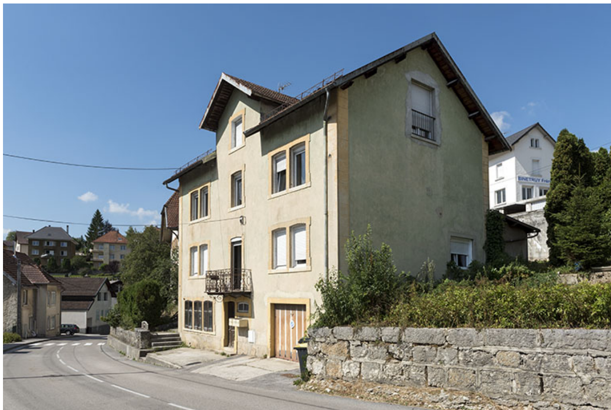
Façades antérieure et latérale droite. 25, Villers-le-Lac