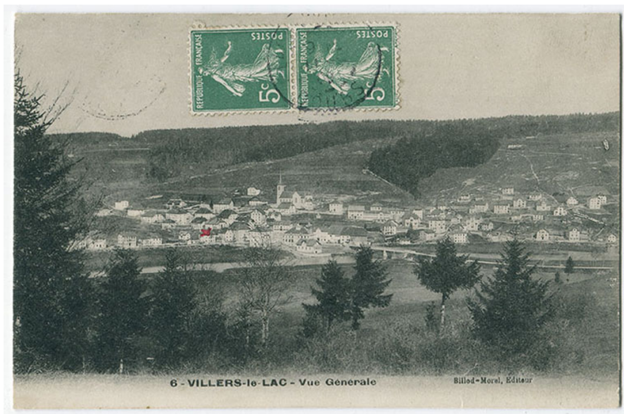
6 - Villers-le-Lac - Vue générale [depuis l'est], 1er quart 20e siècle [avant 1908]. Seul existe le premier bâtiment. 25, Villers-le-Lac