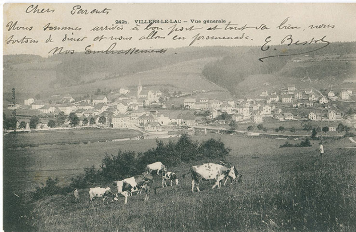
2421. Villers-le-Lac - Vue générale [vue d'ensemble, depuis le sud-est], 1902 ou 1903. Le bâtiment, à droite, est coiffé d'une terrasse.

25, Villers-le-Lac, 5-9 rue Hippolyte Parrenin