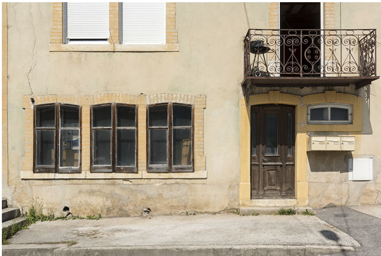
Façade antérieure : fenêtres multiples à l'étage de soubassement.

25, Villers-le-Lac, 15 rue du Quartier neuf