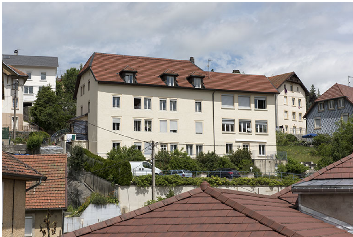
Façade postérieure, de trois quarts gauche. 25, Villers-le-Lac, 12 rue du Quartier neuf