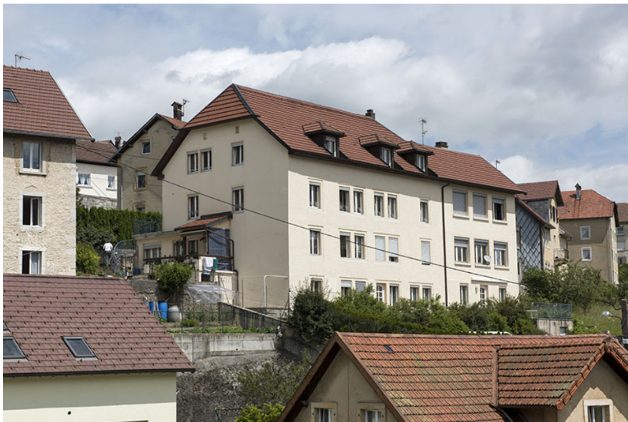
Façades postérieure et latérale gauche. 25, Villers-le-Lac, 12 rue du Quartier neuf