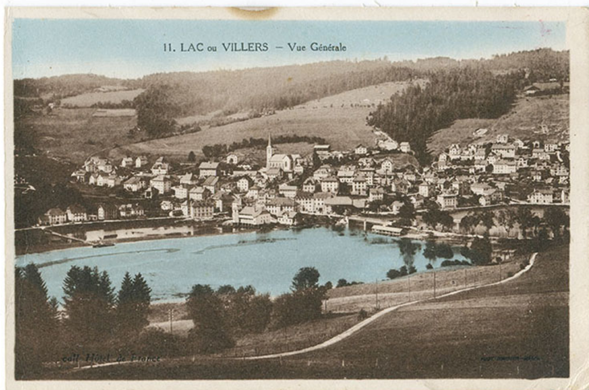
11. Lac ou Villers - Vue générale [depuis le sud-est], 2e quart 20e siècle. 25, Villers-le-Lac, 12 rue du Quartier neuf