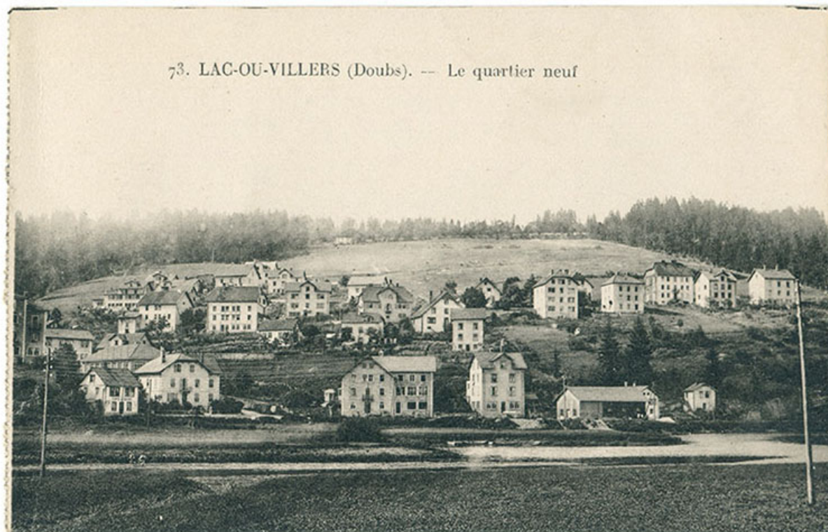
73. Lac-ou-Villers (Doubs). - Le quartier neuf [vu de l'est], 2e quart 20e siècle [vers 1925-1927]. Seul existe le premier bâtiment (au centre à gauche). 25, Villers-le-Lac