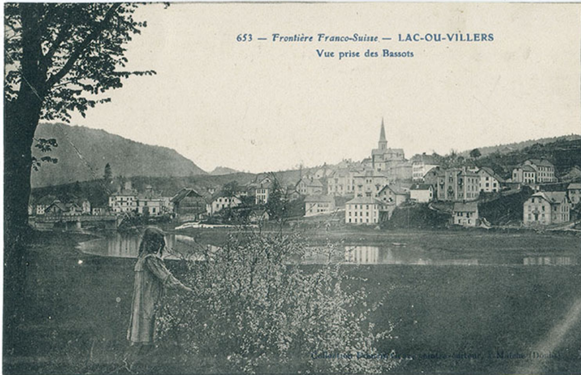
653 - Frontière franco-suisse - Lac-ou-Villers - Vue prise des Bassots, 1er quart 20e siècle [avant 1908].