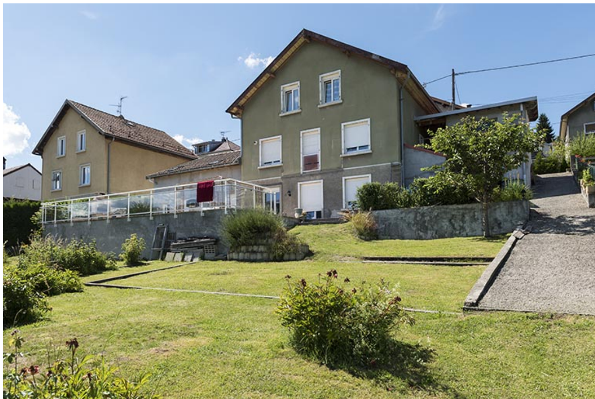
Façade postérieure, de trois quarts gauche.