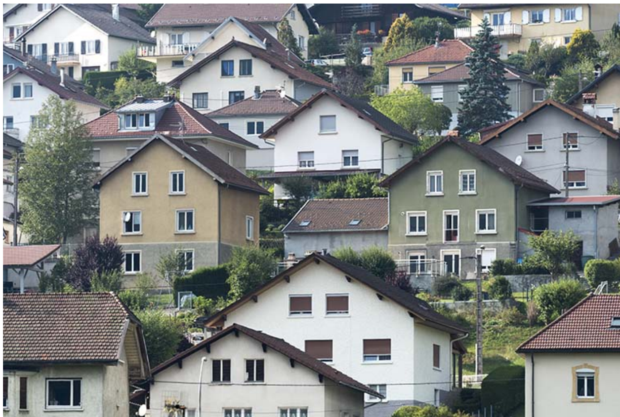
Vue d'ensemble des maisons de la rue de Curcol, depuis l'est (façade postérieure de la maison, de couleur beige). 25, Villers-le-Lac, 10 rue de Curcol