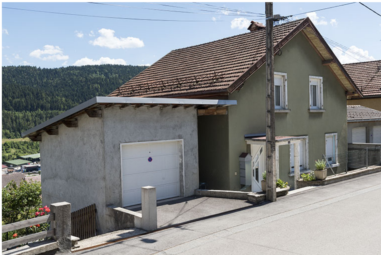
Façade antérieure, de trois quarts gauche.