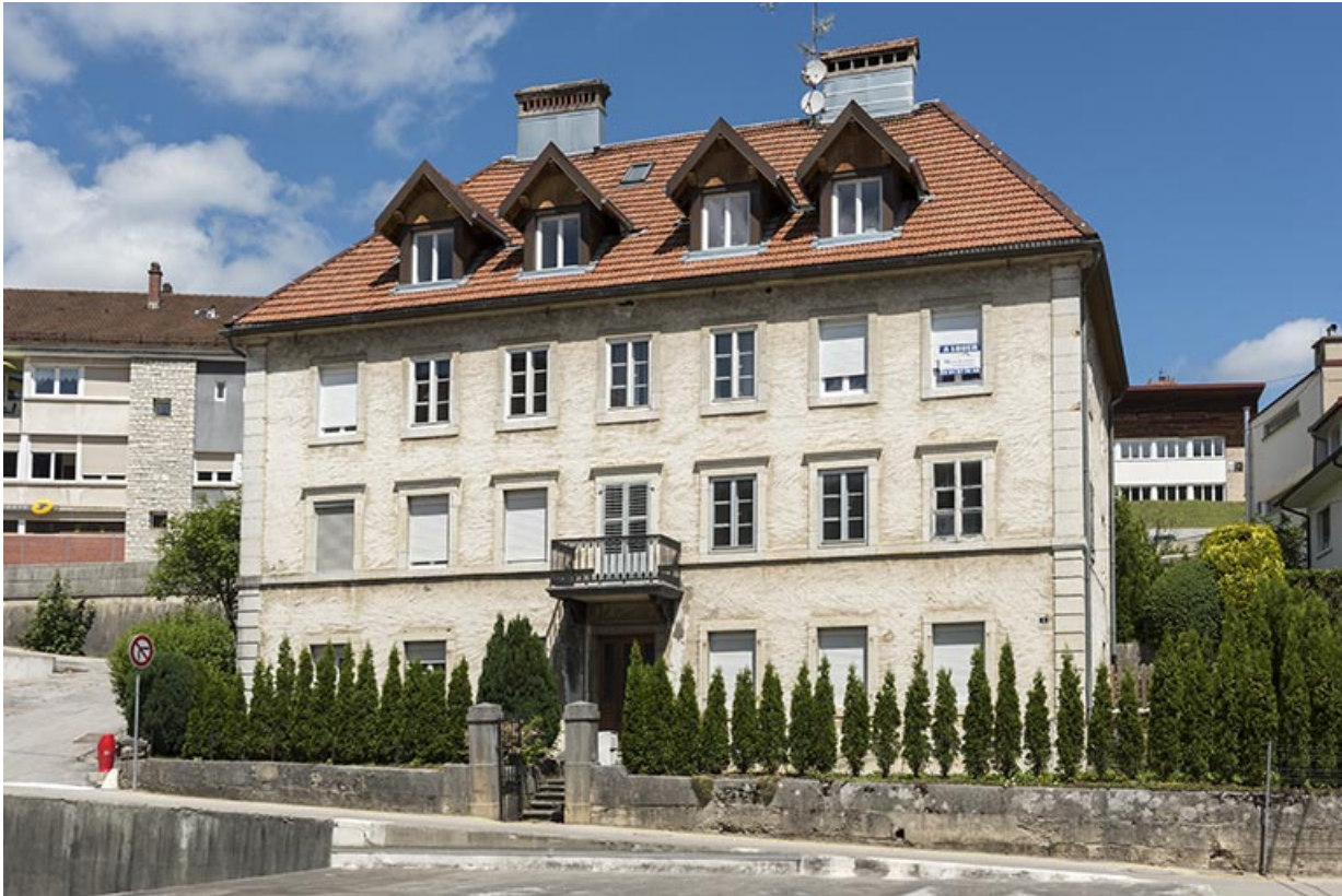
Façade antérieure, de trois quarts droite.