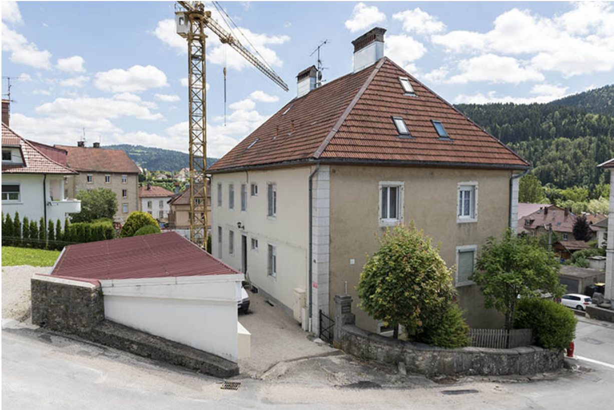
Façades postérieure et latérale gauche.