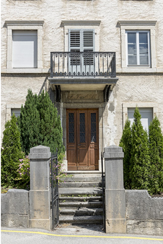
Façade antérieure : travée centrale.