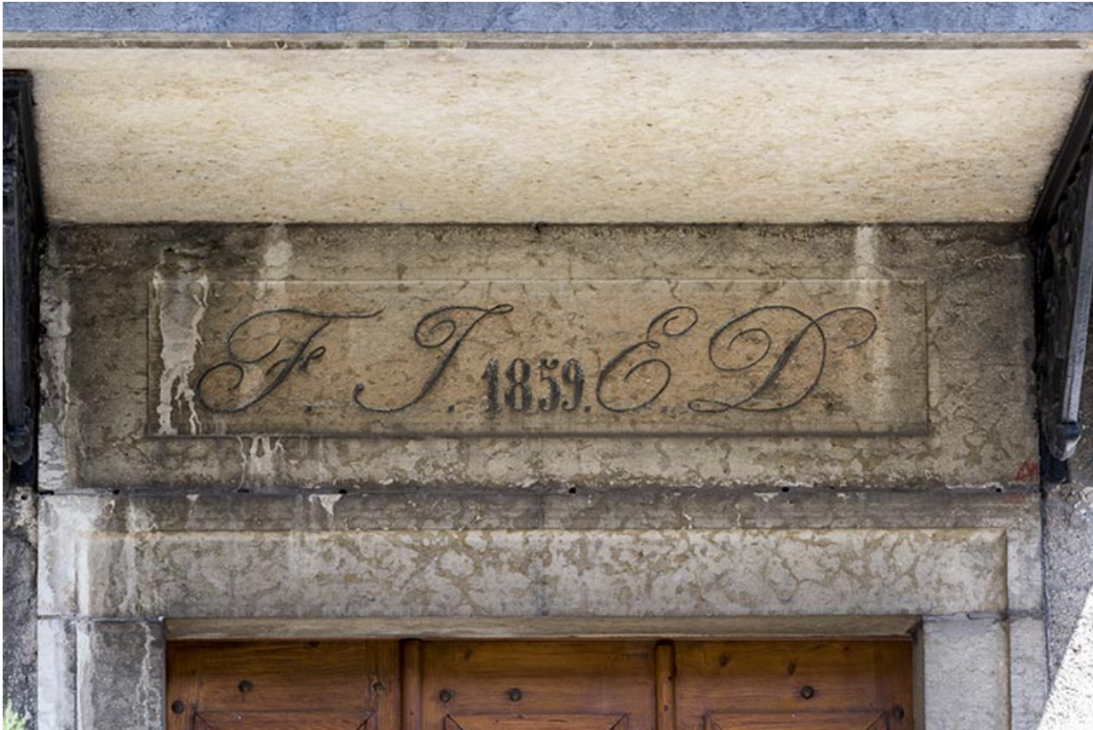
Façade antérieure : date et initiales sur le linteau de la porte.