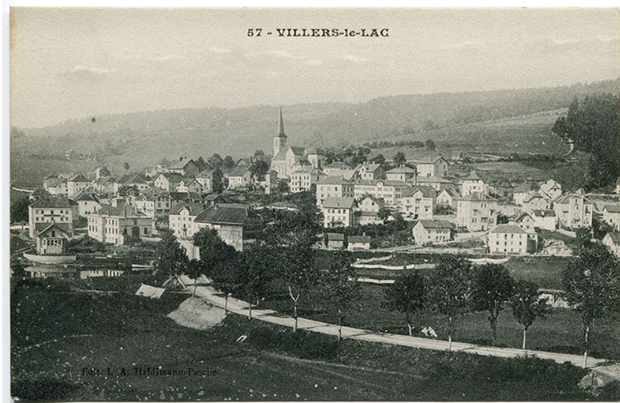
57 - Villers-le-Lac [vue d'ensemble, depuis l'est], 1er quart 20e siècle [entre 1908 et 1914 ?]. Les bâtiments sont visibles au centre, entre les Ets Lambert et Parrenin.

25, Villers-le-Lac, 2 place Maxime Cupillard