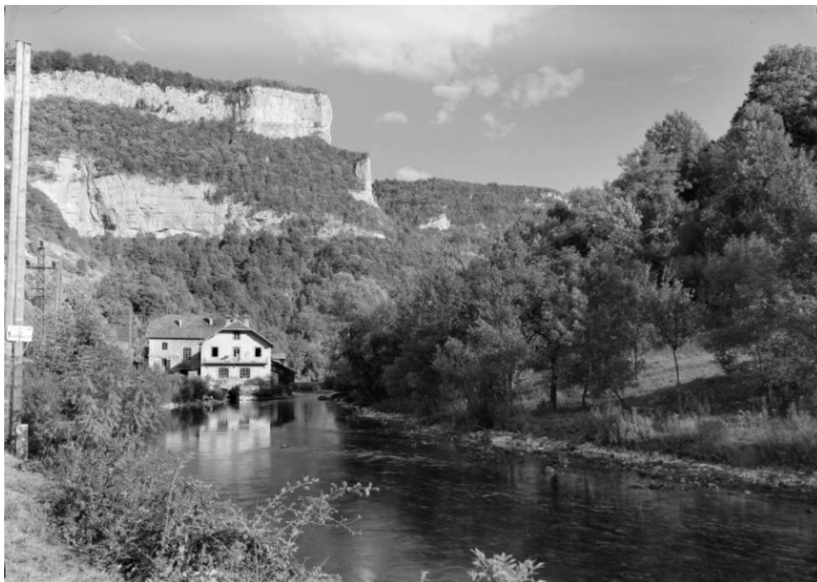
[Vue d'ensemble depuis l'aval], s.d. [vers 1930].

25, Mouthier-Haute-Pierre, 6 à 10 chemin des Moulins