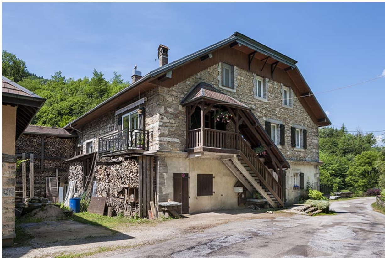
Atelier de fabrication vu de trois quarts arrière.

25, Mouthier-Haute-Pierre, 6 à 10 chemin des Moulins