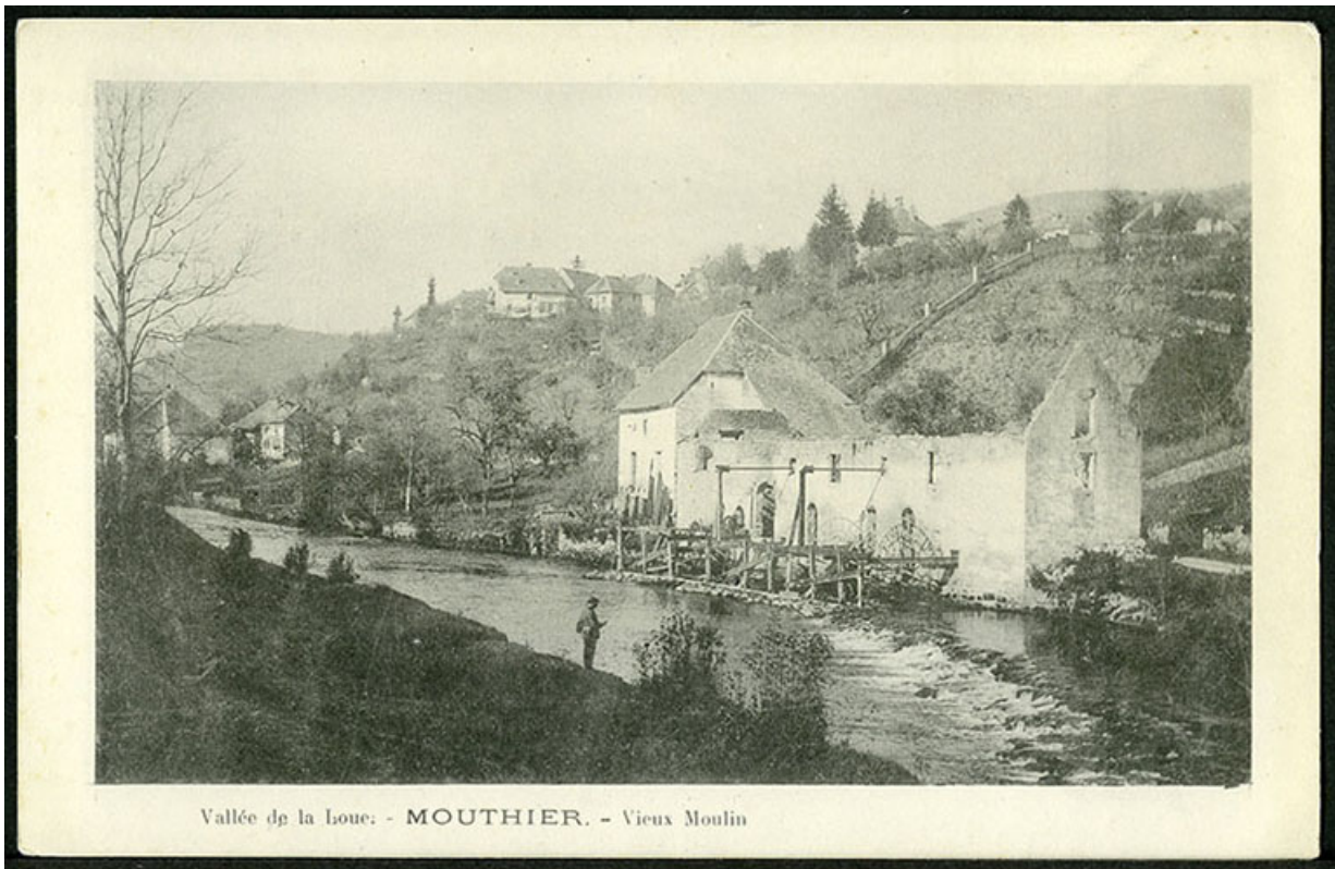
Vallée de la Loue - Mouthier- Vieux moulin, carte postale, s.d. [fin 19e ou début 20e siècle]. 25, Mouthier-Haute-Pierre, 6 à 10 chemin des Moulins