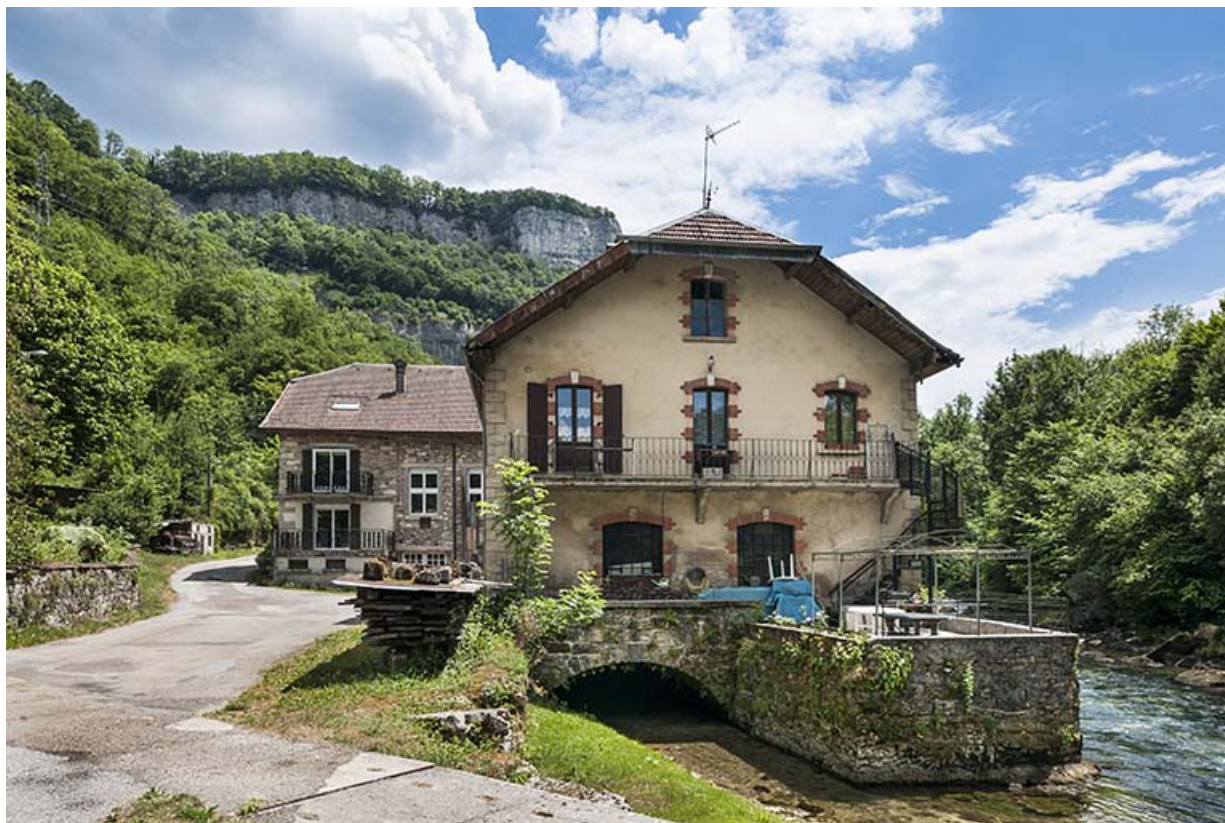
Vue rapprochée depuis l'ouest en 2015.

25, Mouthier-Haute-Pierre, 6 à 10 chemin des Moulins