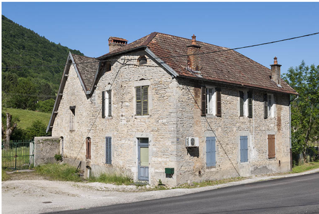
Le moulin et son logement depuis le sud-est.