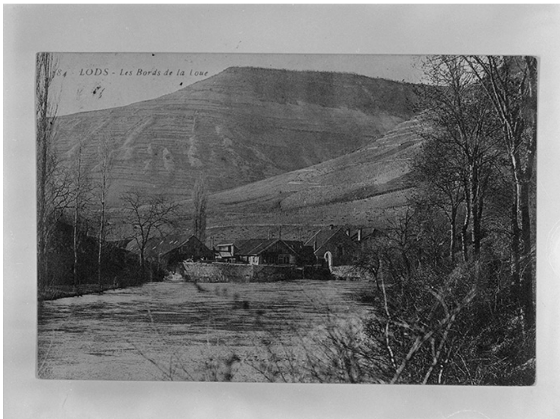
Lods - Les bords de la Loue, vers 1890.