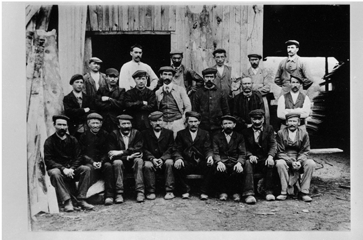
Ouvriers, vers 1890.