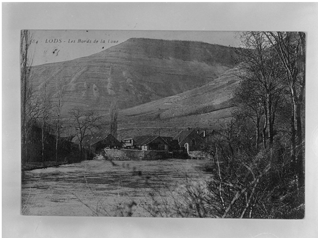
Lods - Les bords de la Loue, vers 1890.