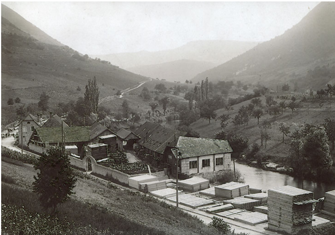
Vue plongeante depuis le nord-est, s.d. [fin 19e ou début 20e siècle] 25, Vuillafans, 18 route de Pontarlier