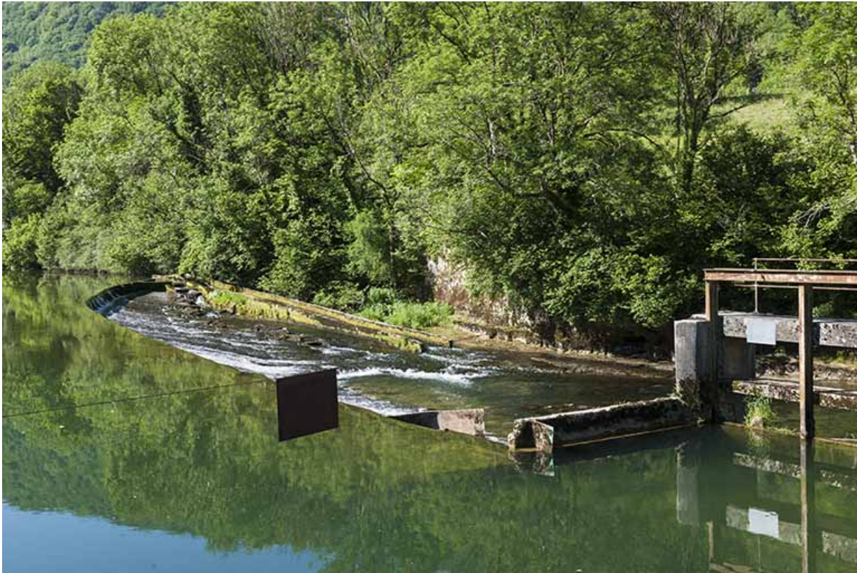
Le barrage depuis la rive droite.