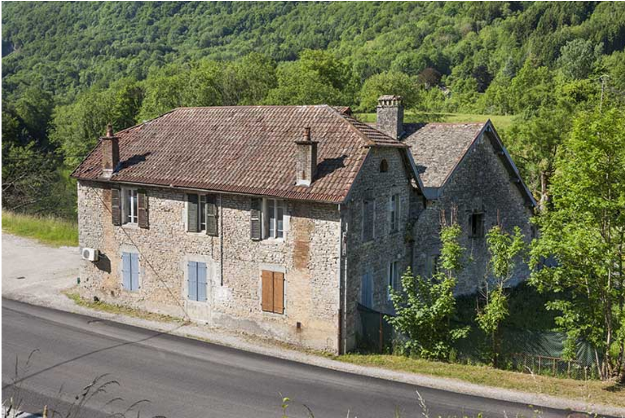
Vue plongeante depuis l'est.