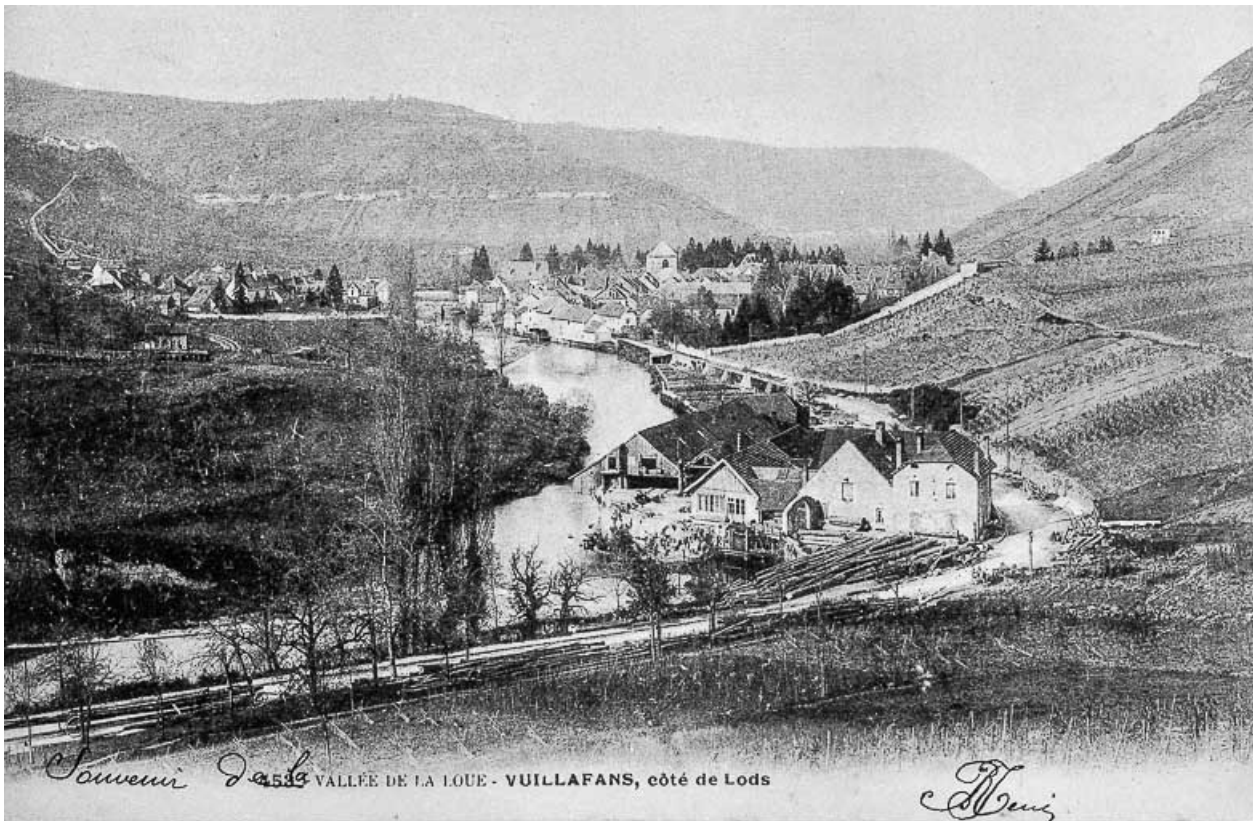
589. VALLEE DE LA LOUE - VUILLAFANS, côté de Lods. 25, Vuillafans