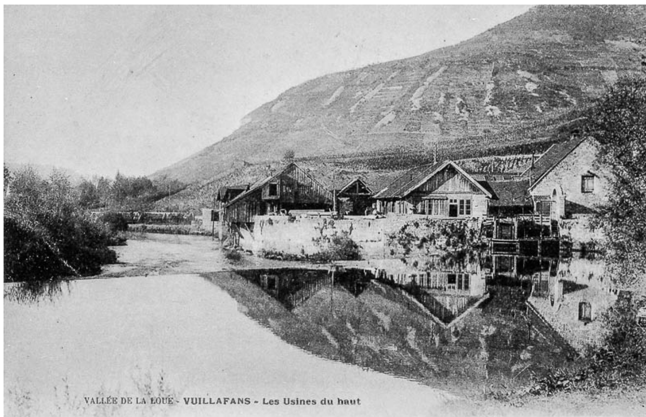
VALLÉE DE LA LOUË - VUILLAFANS - Les usines du haut. 25, Vuillafans