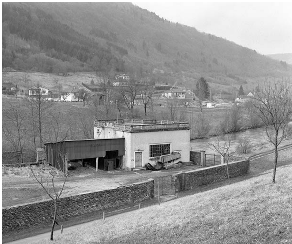
Le bâtiment d'eau de la tréfilerie Bersaillin.