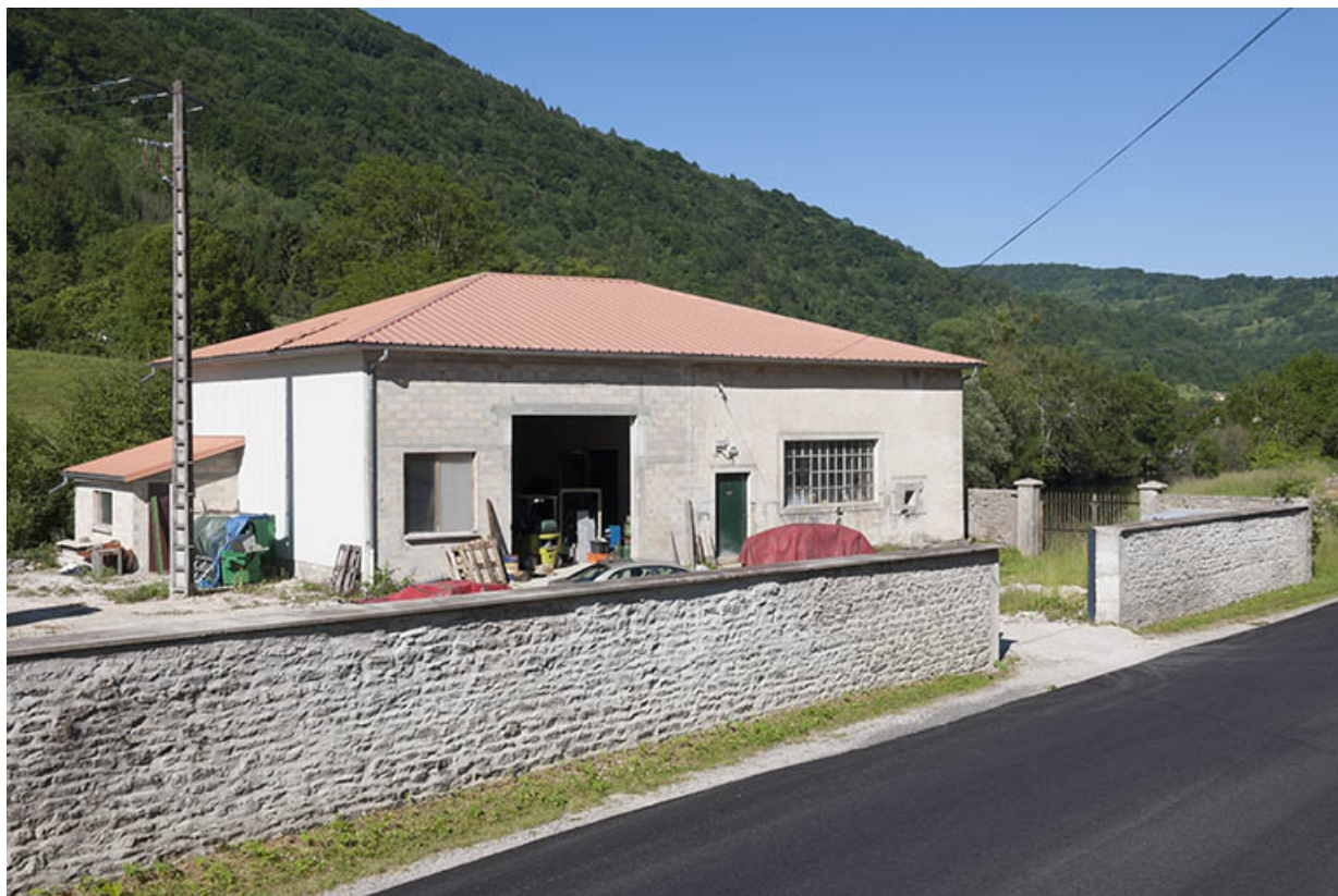
La centrale hydroélectrique.