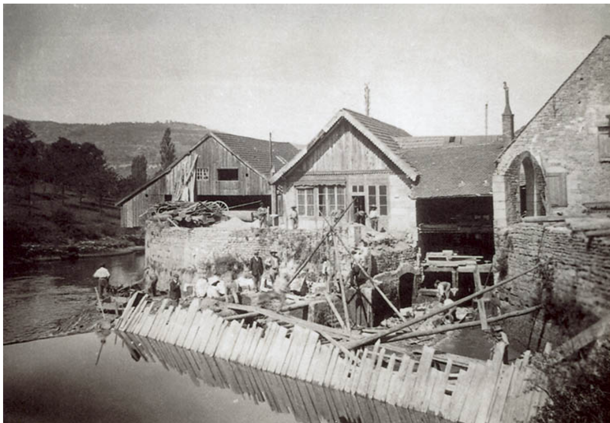
Travaux d'aménagement hydraulique, s.d. [fin 19e siècle].