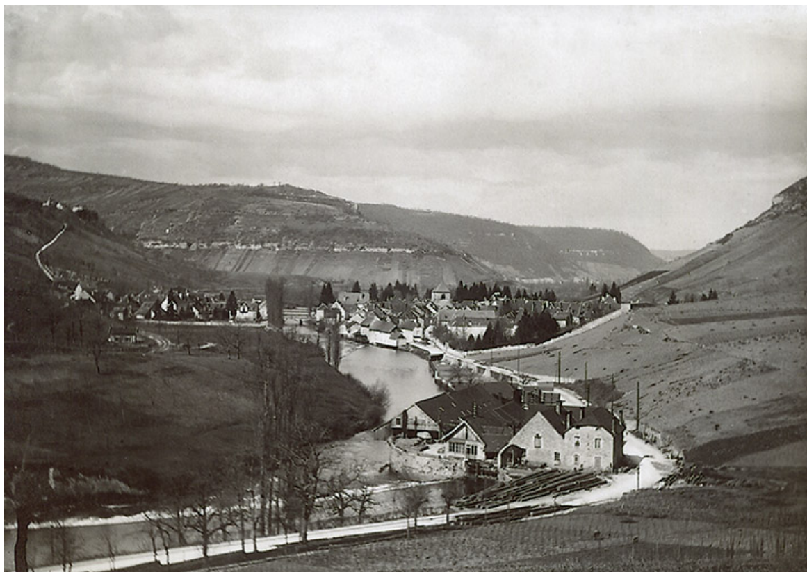
Vue d'ensemble depuis le sud, s.d. [fin 19e ou début 20e siècle]