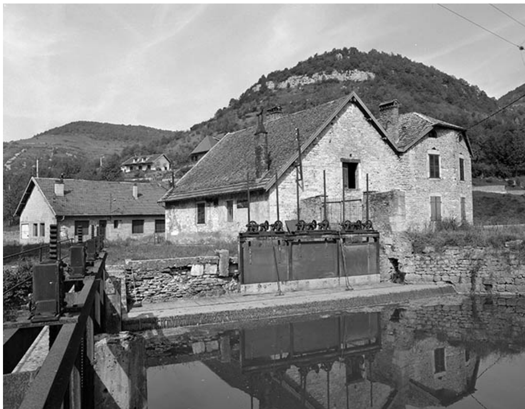
Vue d'ensemble des bâtiments de la tréfilerie Bersaillin.