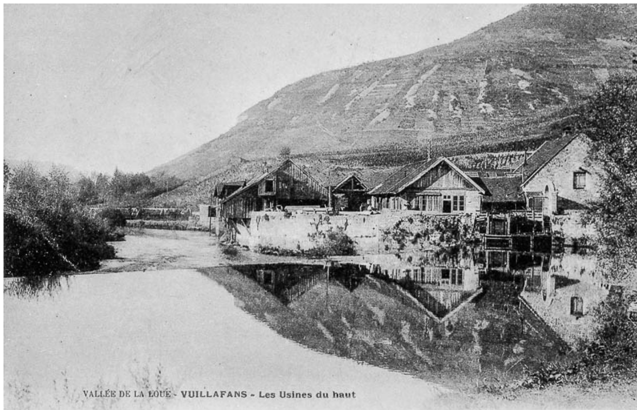
VALLÉE DE LA LOUË - VUILLAFANS - Les Usines du haut

VALLEE DE LA LOUE - VUILLAFANS - Les usines du haut. 25, Vuillafans