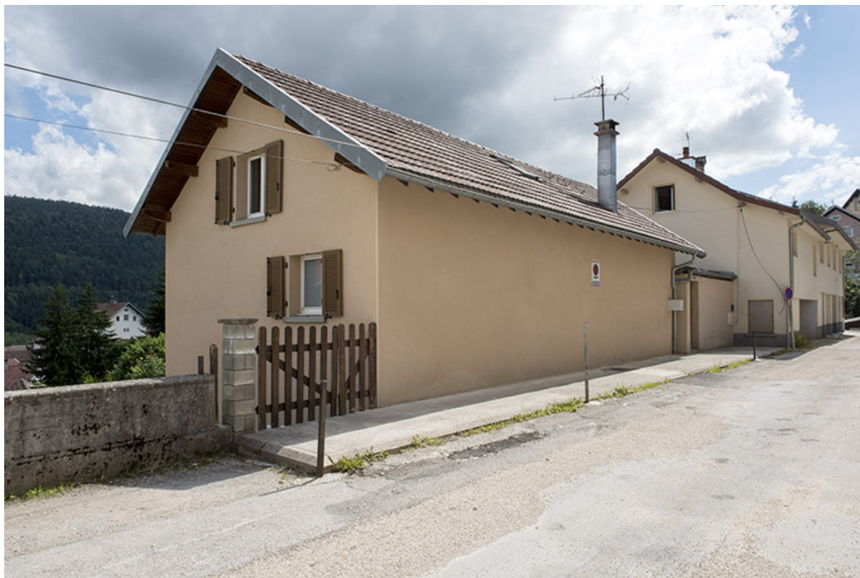
Façades sur la rue de l'Horlogerie, depuis le nord-est (maison Sire au premier plan, Jaccard à l'arrière-plan). 25, Villers-le-Lac, 3 et 5 rue de l' Horlogerie