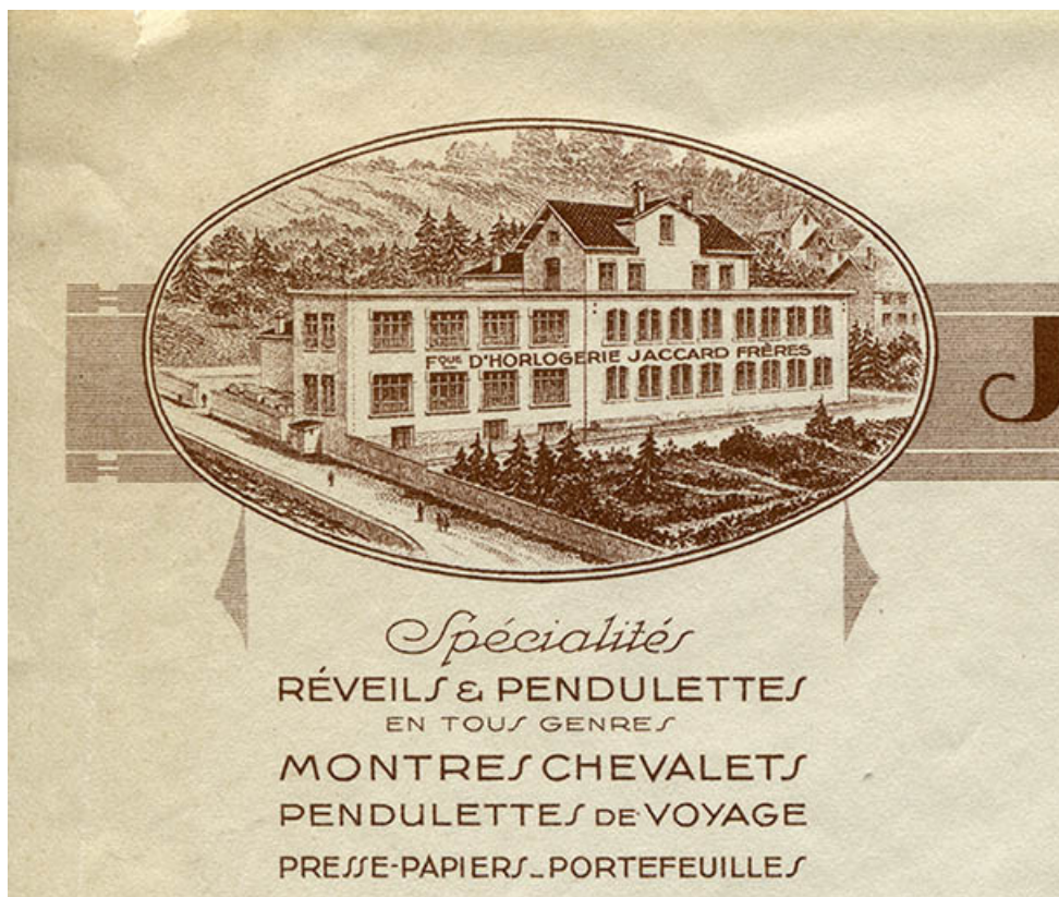
Papier à en-tête de la société Jaccard Frères (détail : le site vu du sud), 25 septembre 1930. 25, Villers-le-Lac, 3 et 5 rue de l'Horlogerie