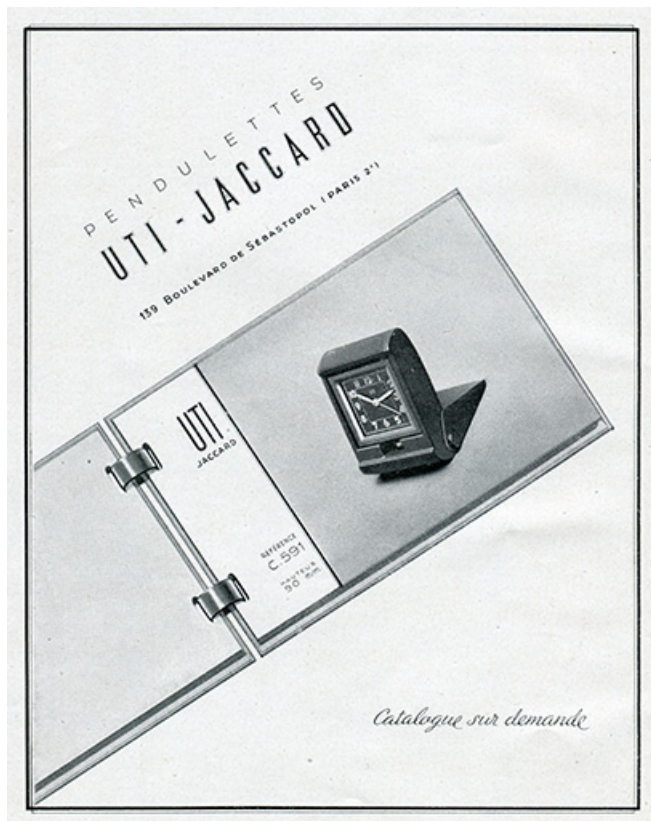
Publicité pour les pendulettes Uti-Jaccard (p. 76), 1947. 25, Villers-le-Lac, 3 et 5 rue de l'Horlogerie