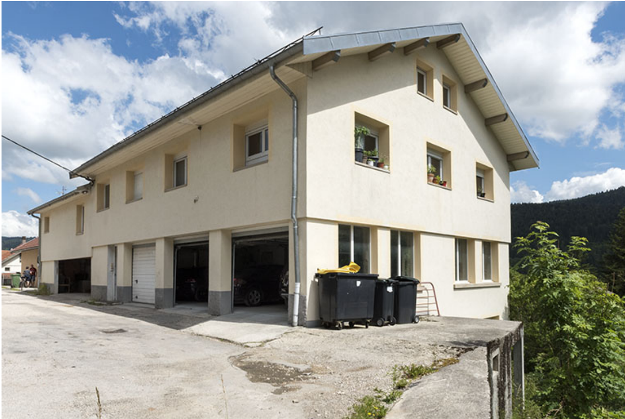
Façades sur la rue de l'Horlogerie, depuis l'ouest.

25, Villers-le-Lac, 3 et 5 rue de l' Horlogerie