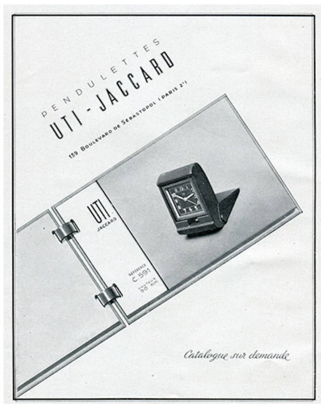
Publicité pour les pendulettes Uti-Jaccard (p. 76), 1947. 25, Villers-le-Lac, 3 et 5 rue de l'Horlogerie