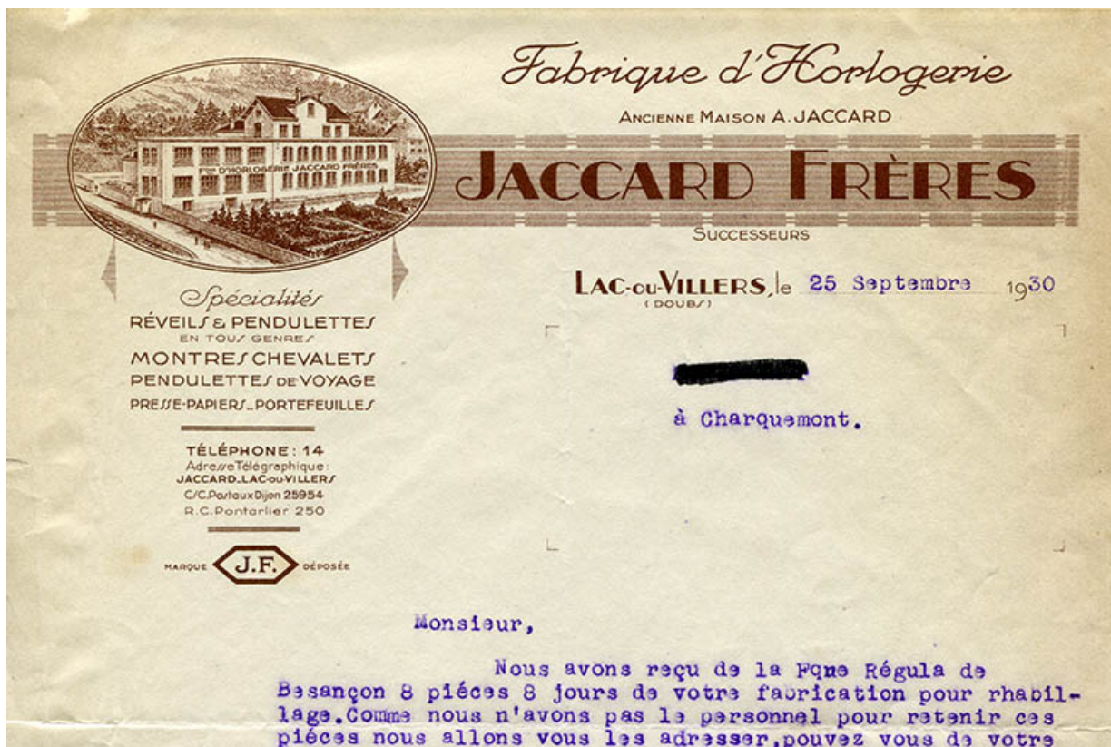
Papier à en-tête de la société Jaccard Frères (montrant le site vu du sud), 25 septembre 1930. 25, Villers-le-Lac, 3 et 5 rue de l'Horlogerie