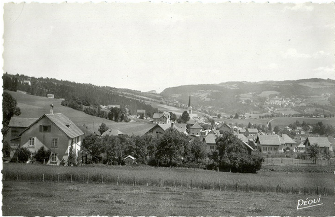
328. Lac ou Villers (Doubs). Vue générale [depuis l'ouest], milieu 20e siècle [1945 ?]. 25, Villers-le-Lac, 2 rue Newton