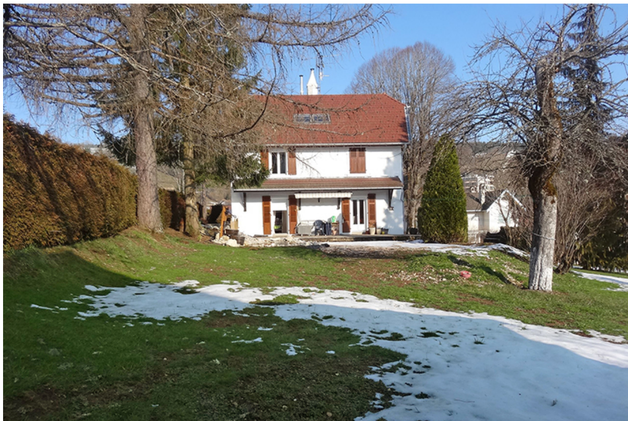
[Façade postérieure de la maison, 14 mars 2013].