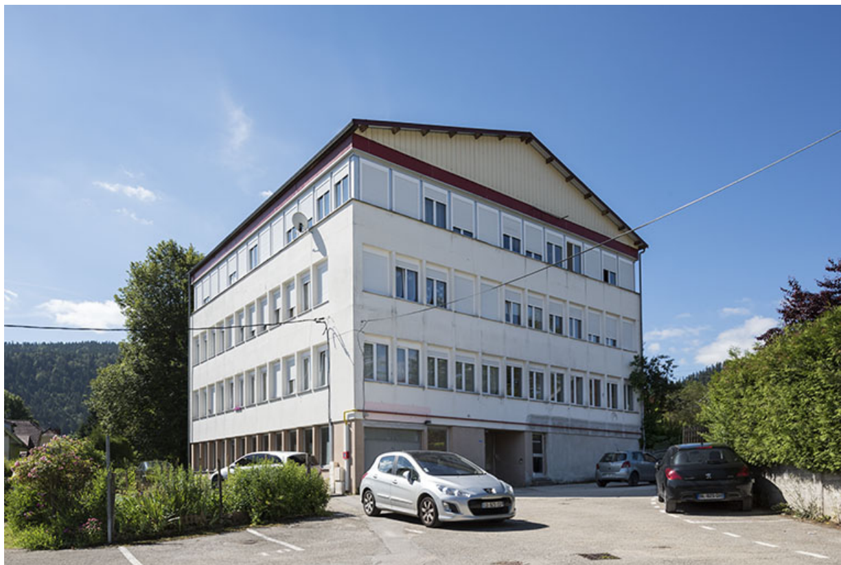
Usine : façades antérieure et latérale gauche. 25, Villers-le-Lac