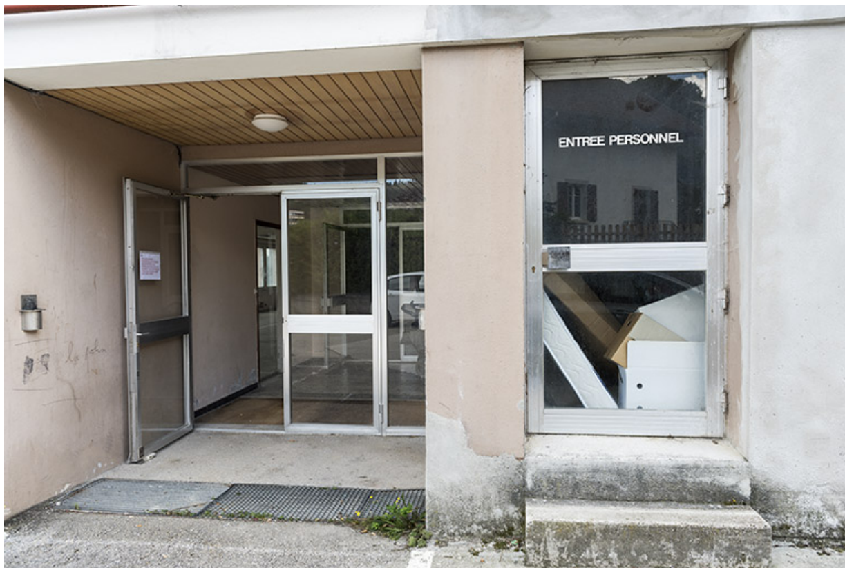
Usine : entrée sur la façade antérieure.