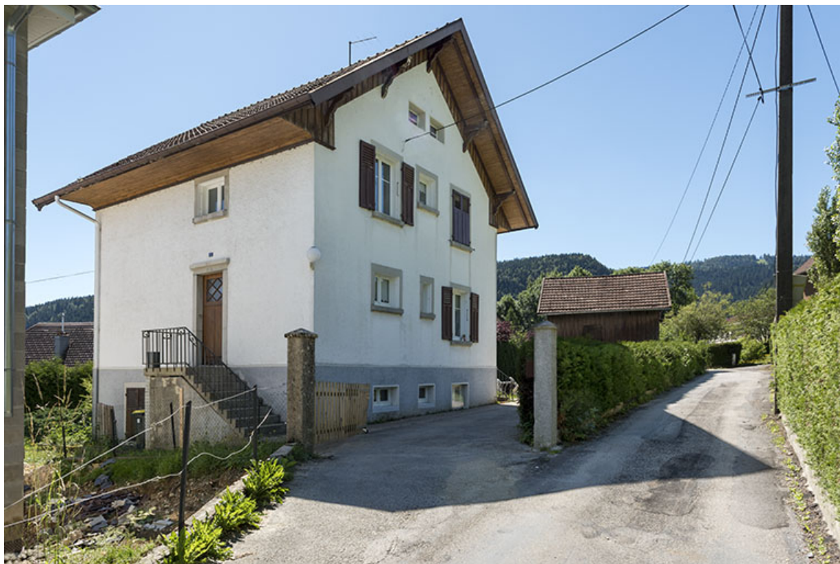
Maison : façades antérieure et latérale gauche.