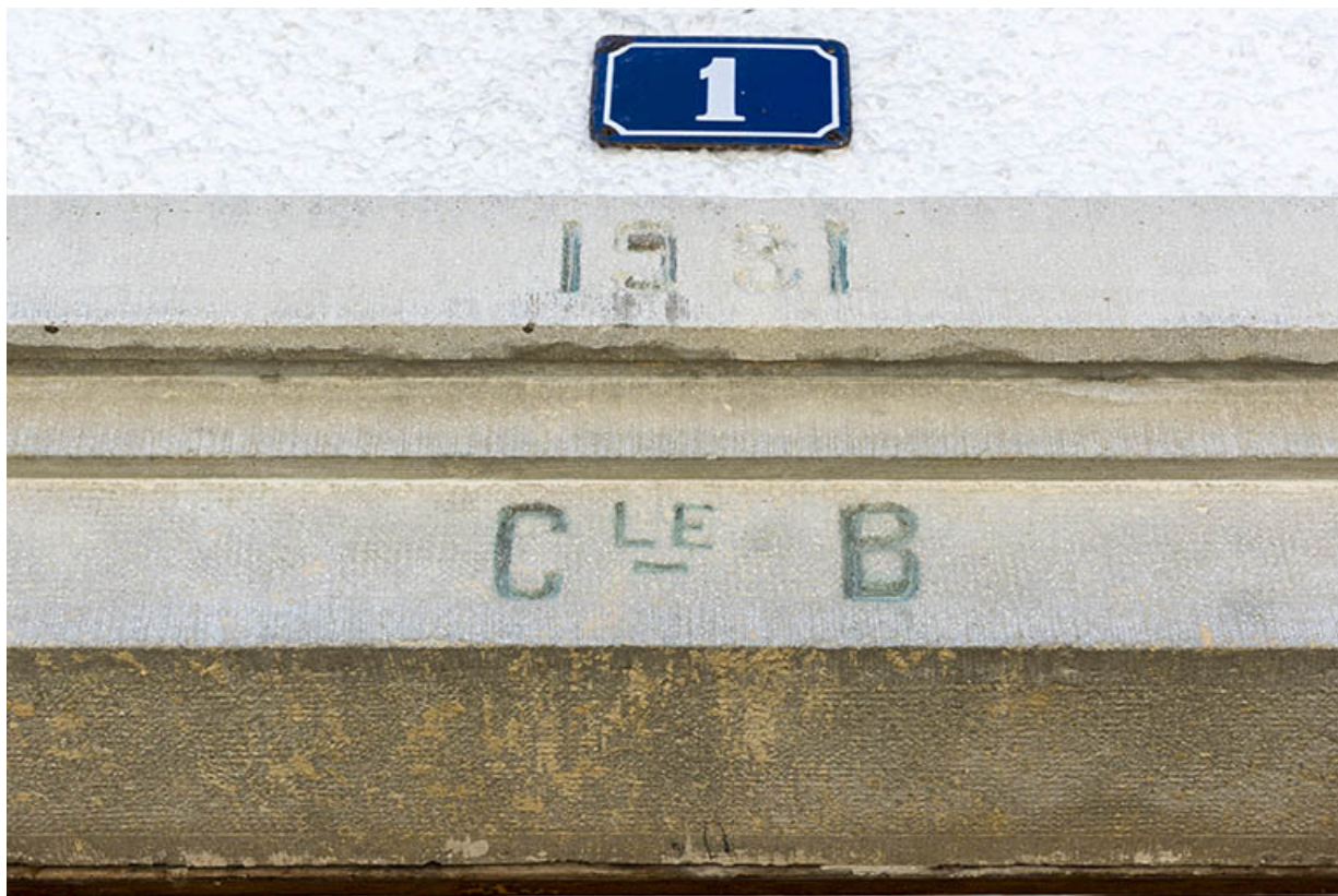
Maison : date et initiales sur le linteau de la porte de la façade latérale gauche. 25, Villers-le-Lac, 1 et 9 rue Newton