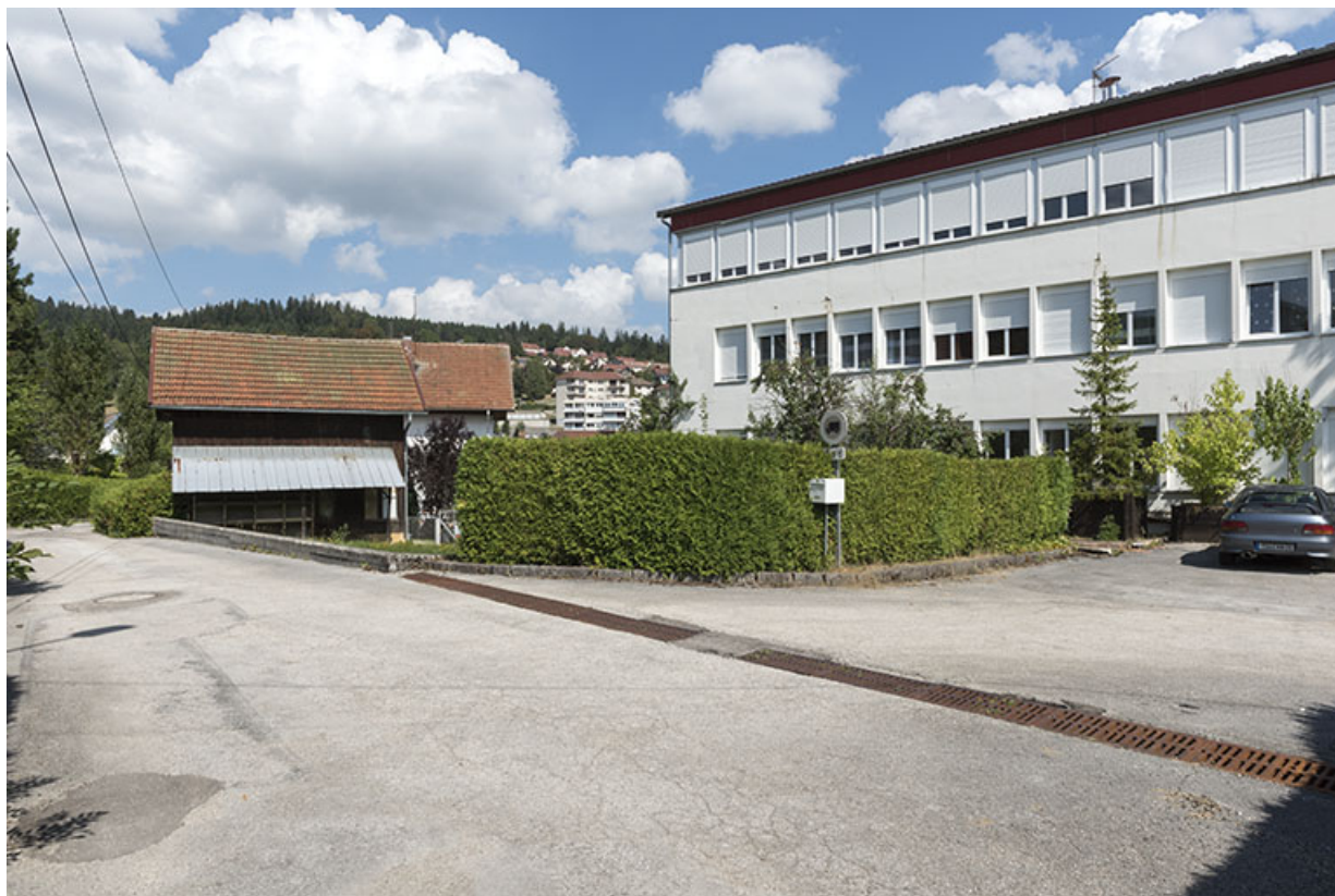
Bûcher, maison et usine (façade latérale droite). 25, Villers-le-Lac, 1 et 9 rue Newton