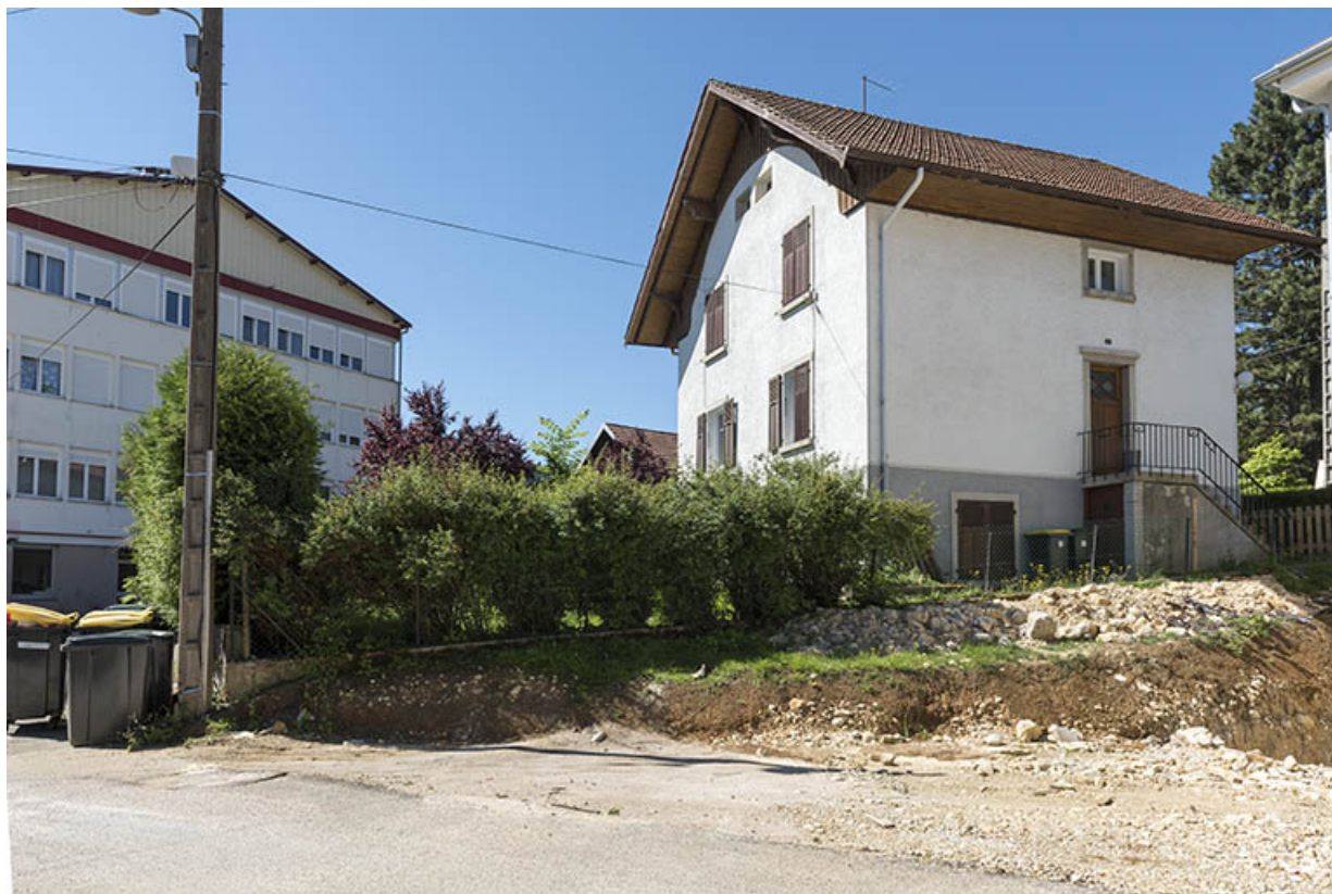
Vue d'ensemble, depuis le nord : usine à gauche, maison à droite. 25, Villers-le-Lac, 1 et 9 rue Newton