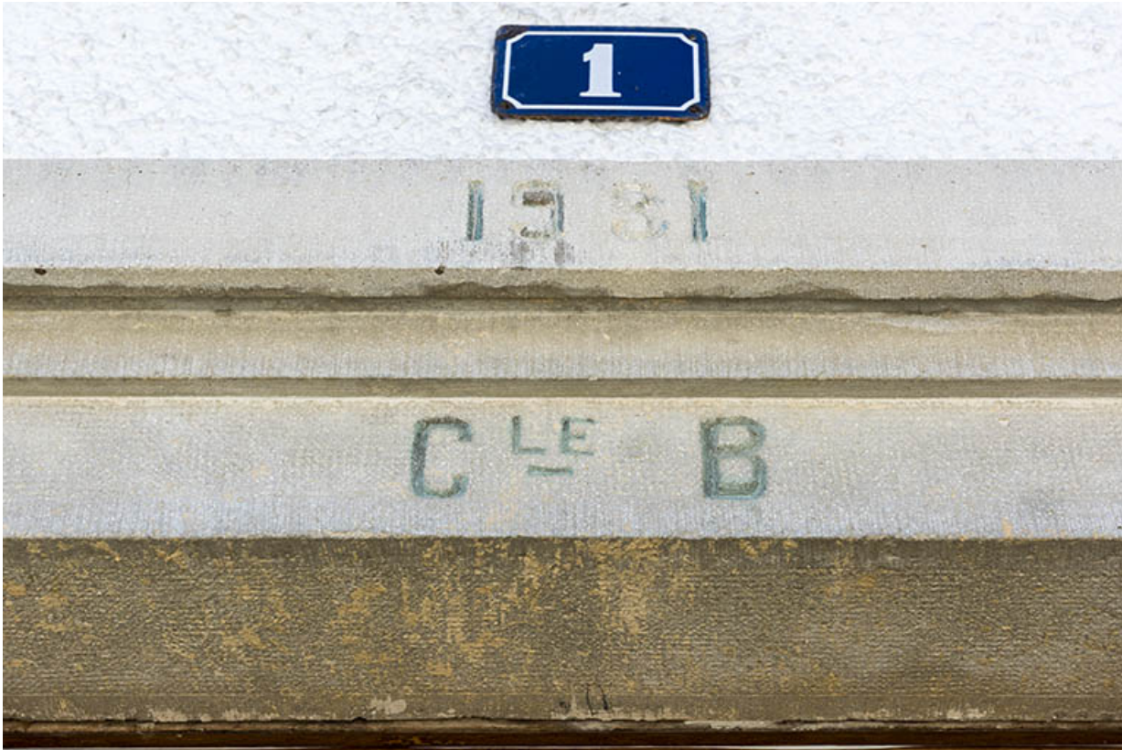
Maison : date et initiales sur le linteau de la porte de la façade latérale gauche.