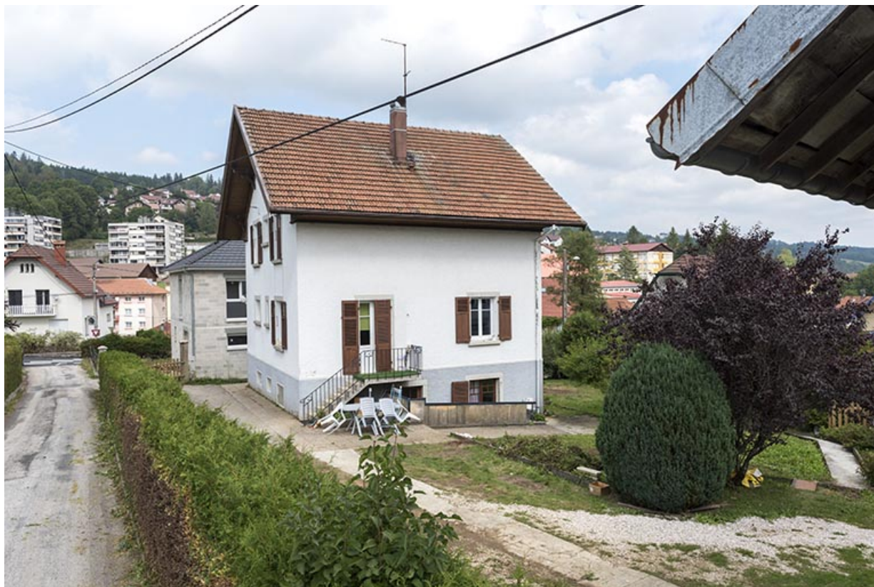
Maison : façades antérieure et latérale droite.