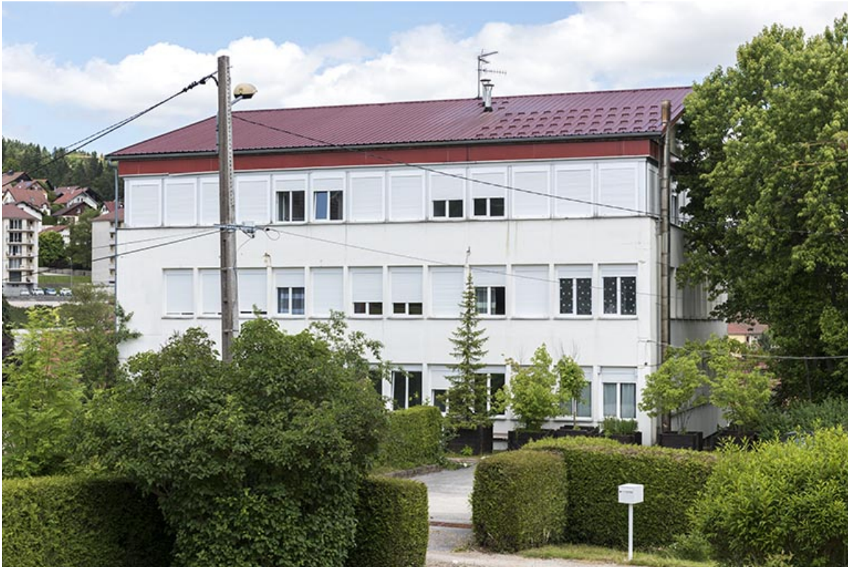
Usine : façade latérale droite, de trois quarts droite.