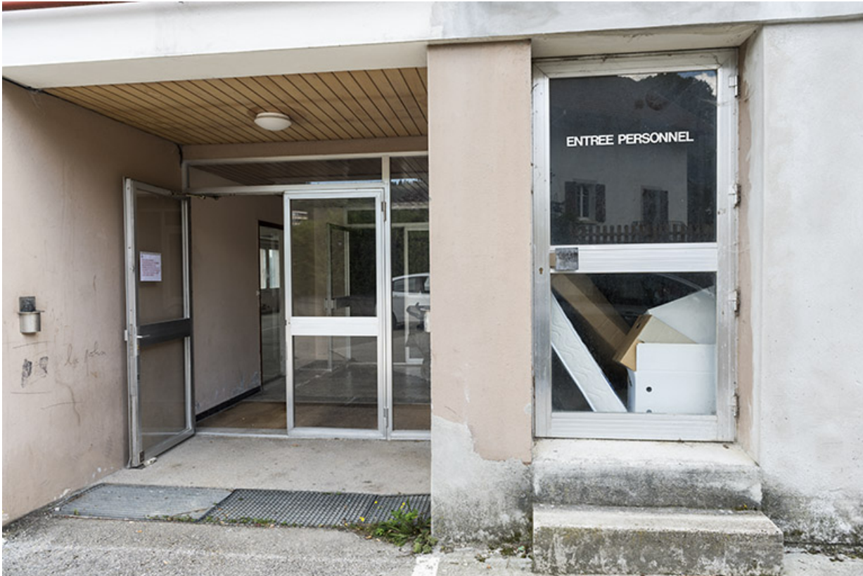
Usine : entrée sur la façade antérieure.