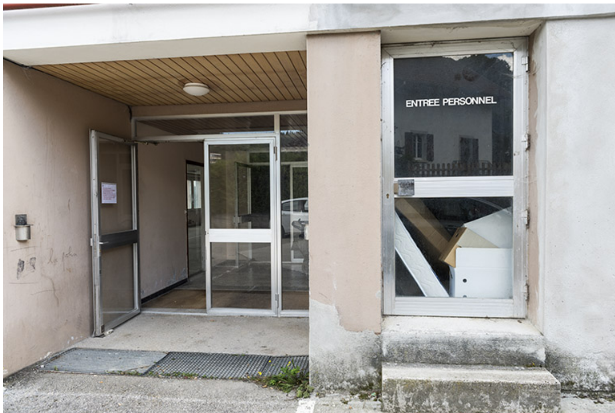
Usine : entrée sur la façade antérieure.