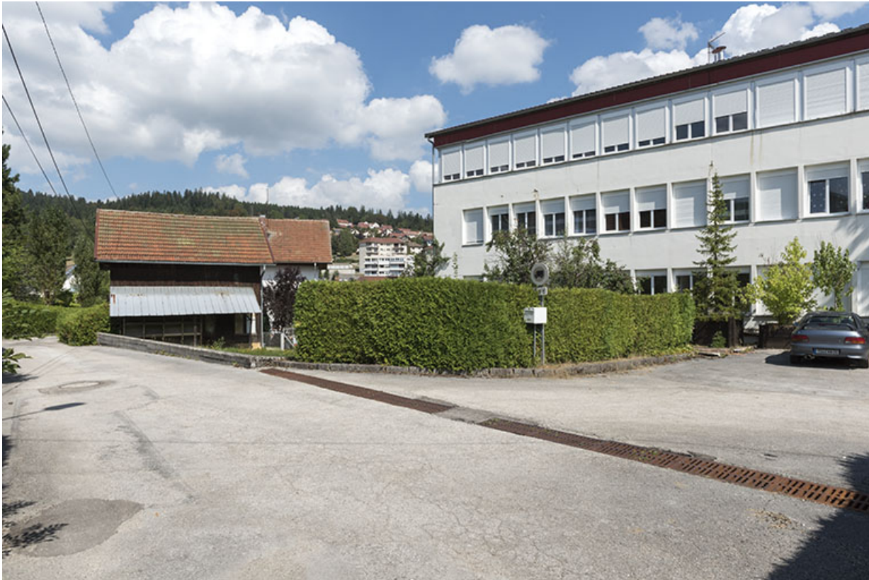
Bûcher, maison et usine (façade latérale droite).