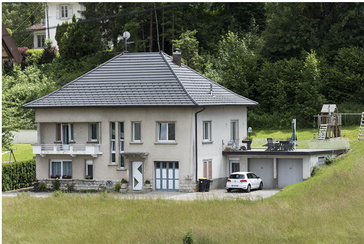
Vue d'ensemble, depuis le nord-ouest.

25, Villers-le-Lac, 4 et 6 bis rue de la Cotote