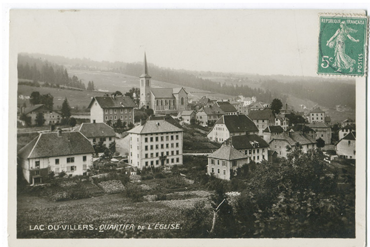
Lac-ou-Villers - Quartier de l'Eglise [vu du sud-ouest], entre 1912 et 1915. 25, Villers-le-Lac