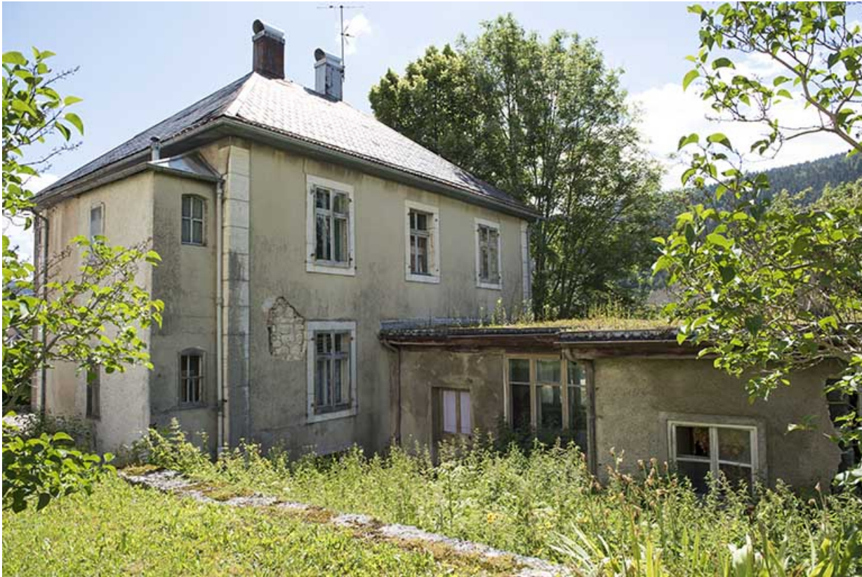
Façade postérieure et atelier de fabrication.