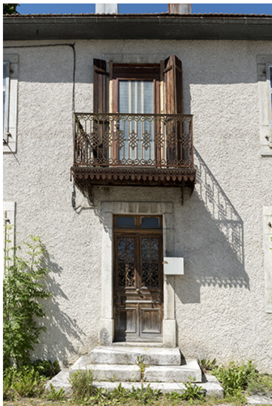
Façade antérieure : travée centrale.