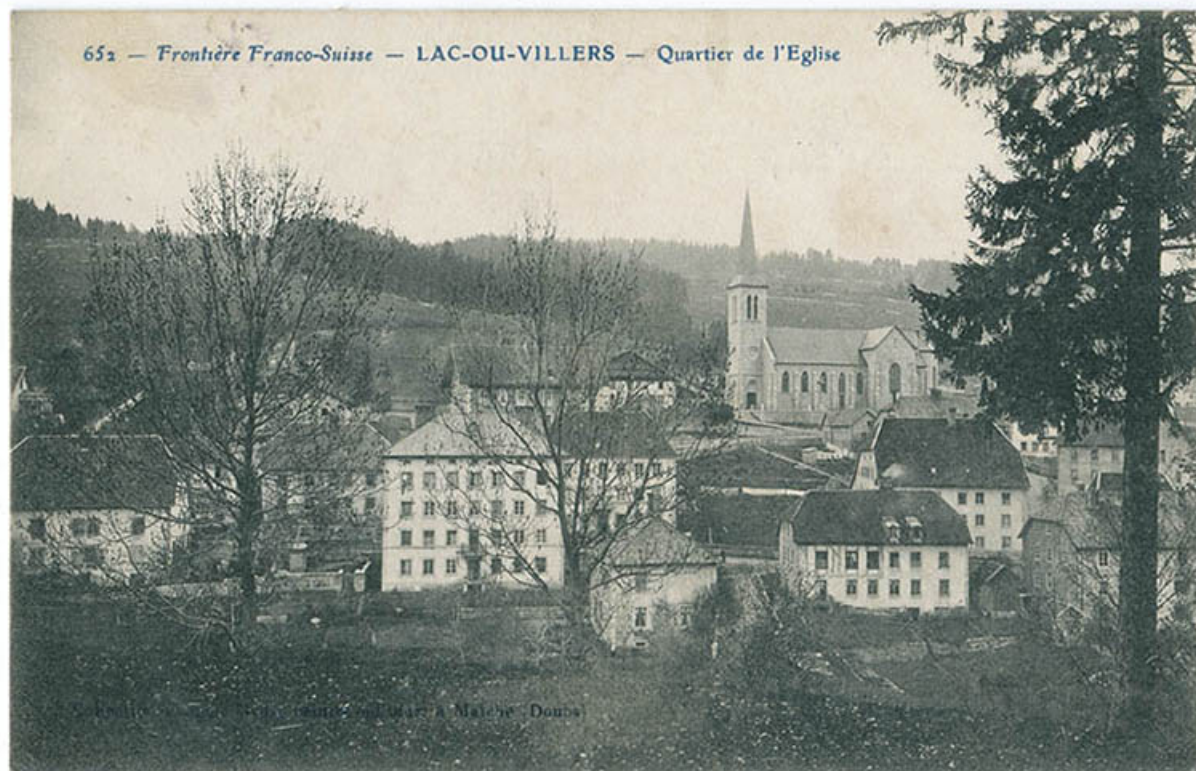
652 - Frontière franco-suisse - Lac-ou-Villers - Quartier de l'Eglise [vu du sud], 1er quart 20e siècle [avant 1915]. 25, Villers-le-Lac, 2 rue de la Cotote