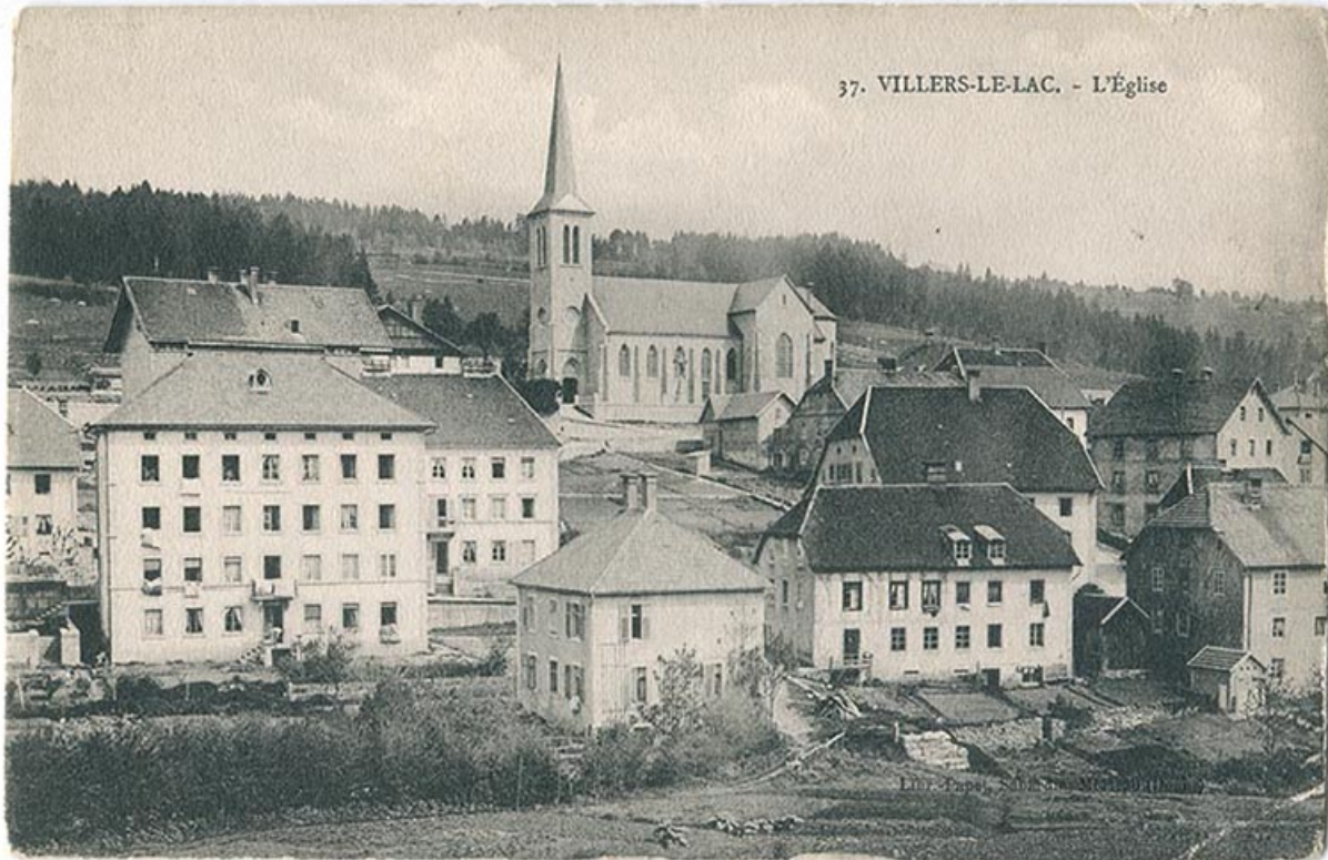
37. Villers-le-Lac. - L'Église [quartier de l'église, vu du sud], 1er quart 20e siècle [avant 1915]. Le bâtiment, au centre, est partiellement masqué par l'imposante demeure de gauche.