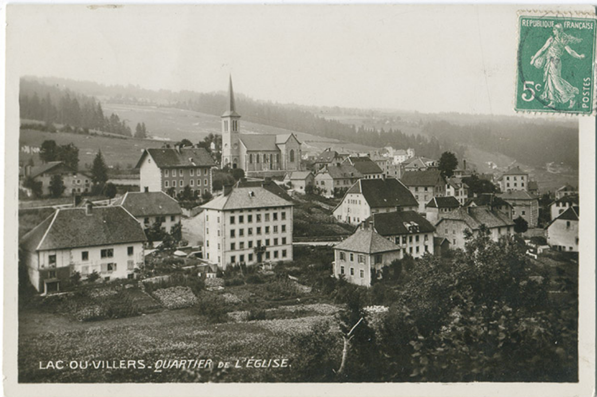
Lac-ou-Villers - Quartier de l'Eglise [vu du sud-ouest], entre 1912 et 1915. 25, Villers-le-Lac