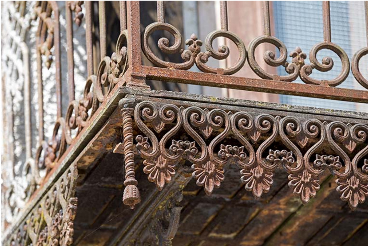
Façade antérieure : ferronnerie du balcon au premier étage.