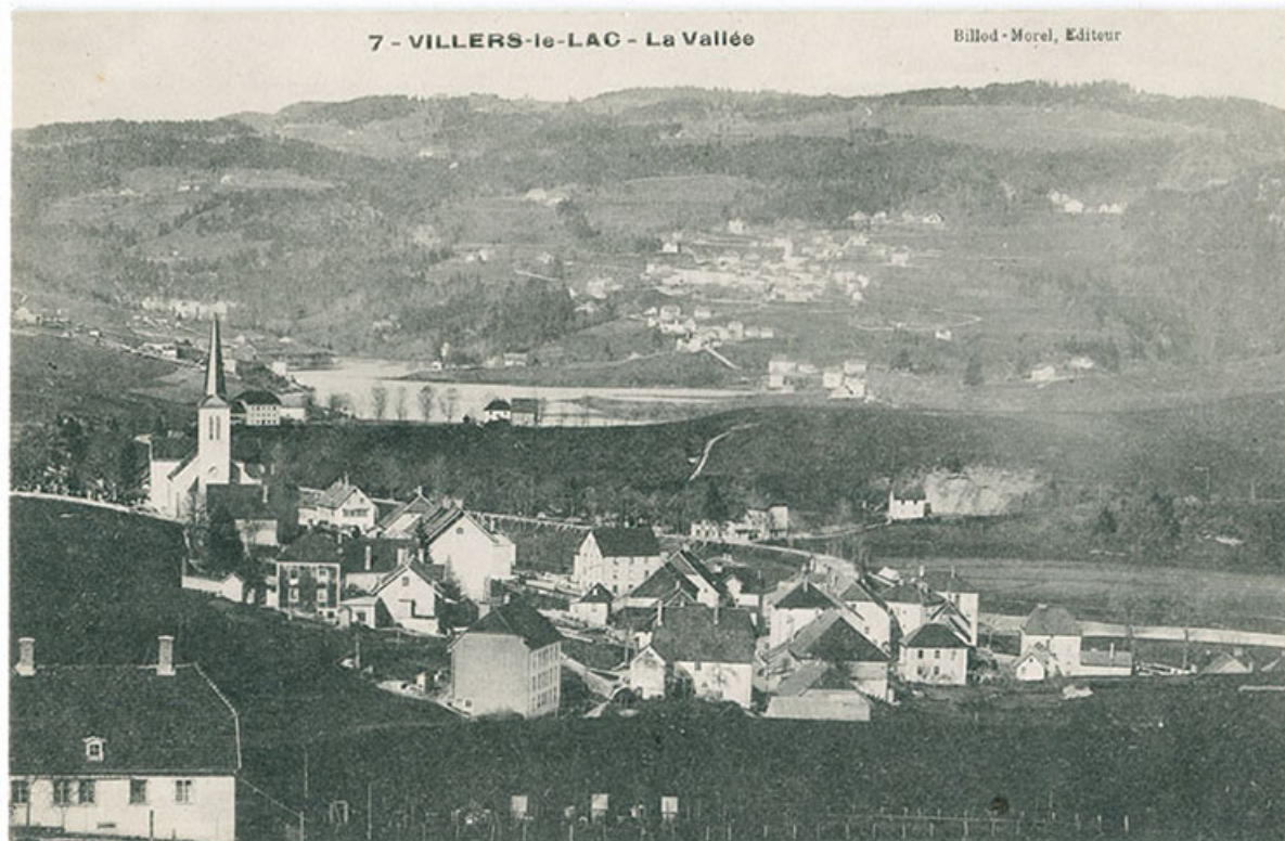
7 - Villers-le-Lac - La vallée [le village, depuis le sud-ouest], 1er quart 20e siècle. L'arrière du bâtiment est visible à droite. 25, Villers-le-Lac, 2 rue de la Cotote