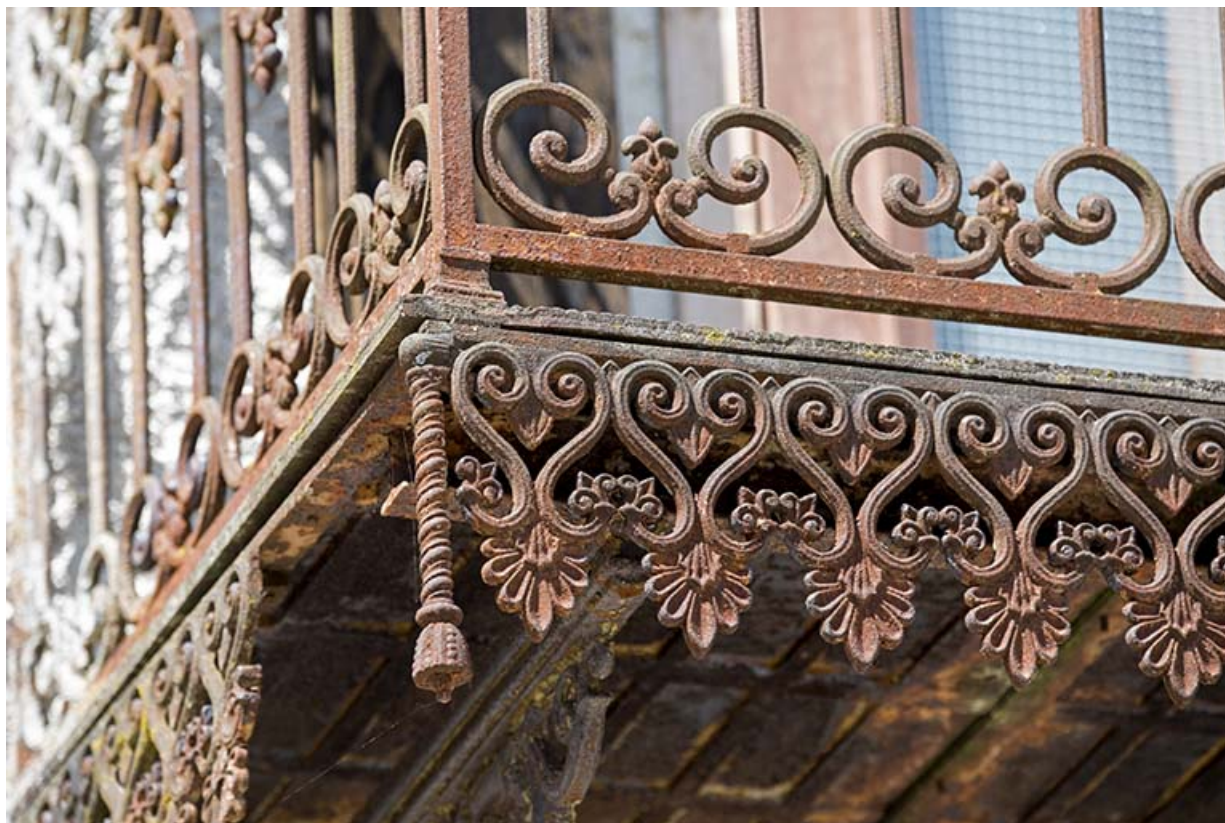
Façade antérieure : ferronnerie du balcon au premier étage.