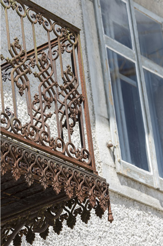
Façade antérieure : ferronnerie du balcon au premier étage.