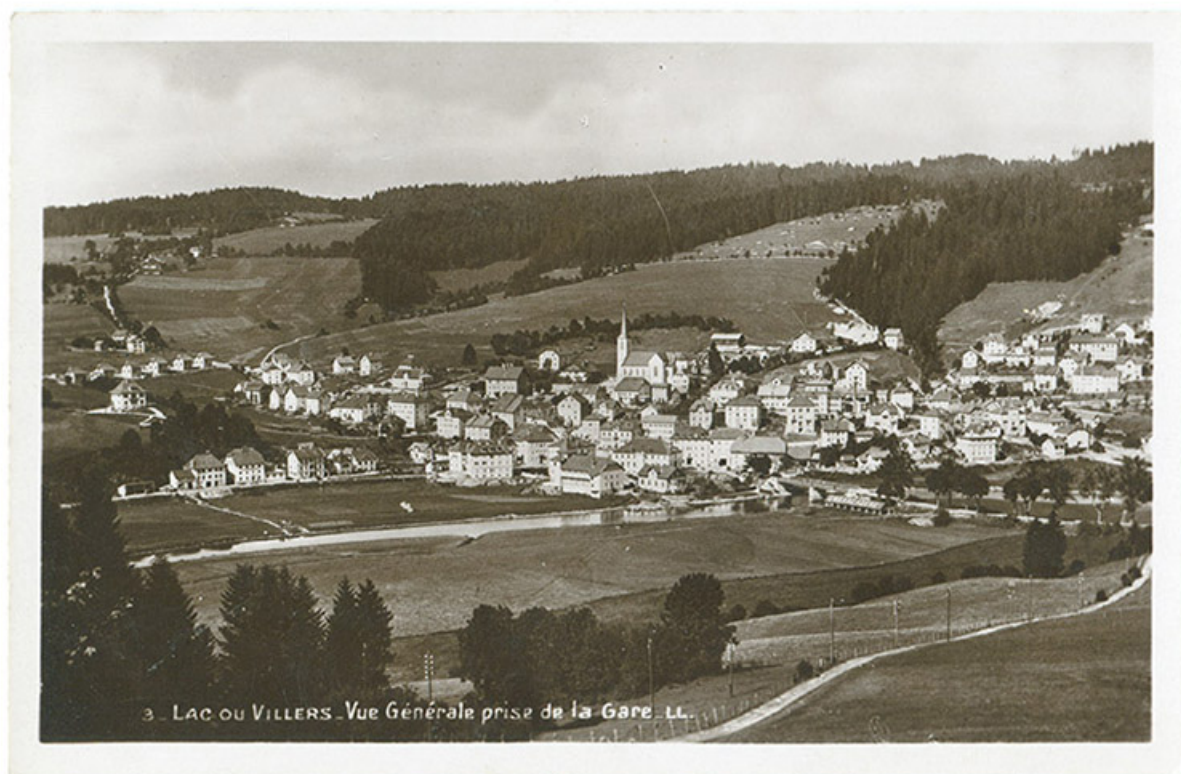
3 - Lac ou Villers - Vue générale prise de la gare, décennie 1930 [avant 1938]. Le bâtiment est visible au centre à droite. 25, Villers-le-Lac

3 - Lac ou Villers - Vue générale prise de la gare, carte postale, par Louis Lévy, [décennie 1930, avant 1938], Lévy et Neurdein réunis impr. à Paris. Porte la date 1938 (tampon) au verso. Cliché aussi exploité par la CAP pour : "Ed. H. Guillaume, Saut du Doubs - Villers-le-Lac (Doubs)".