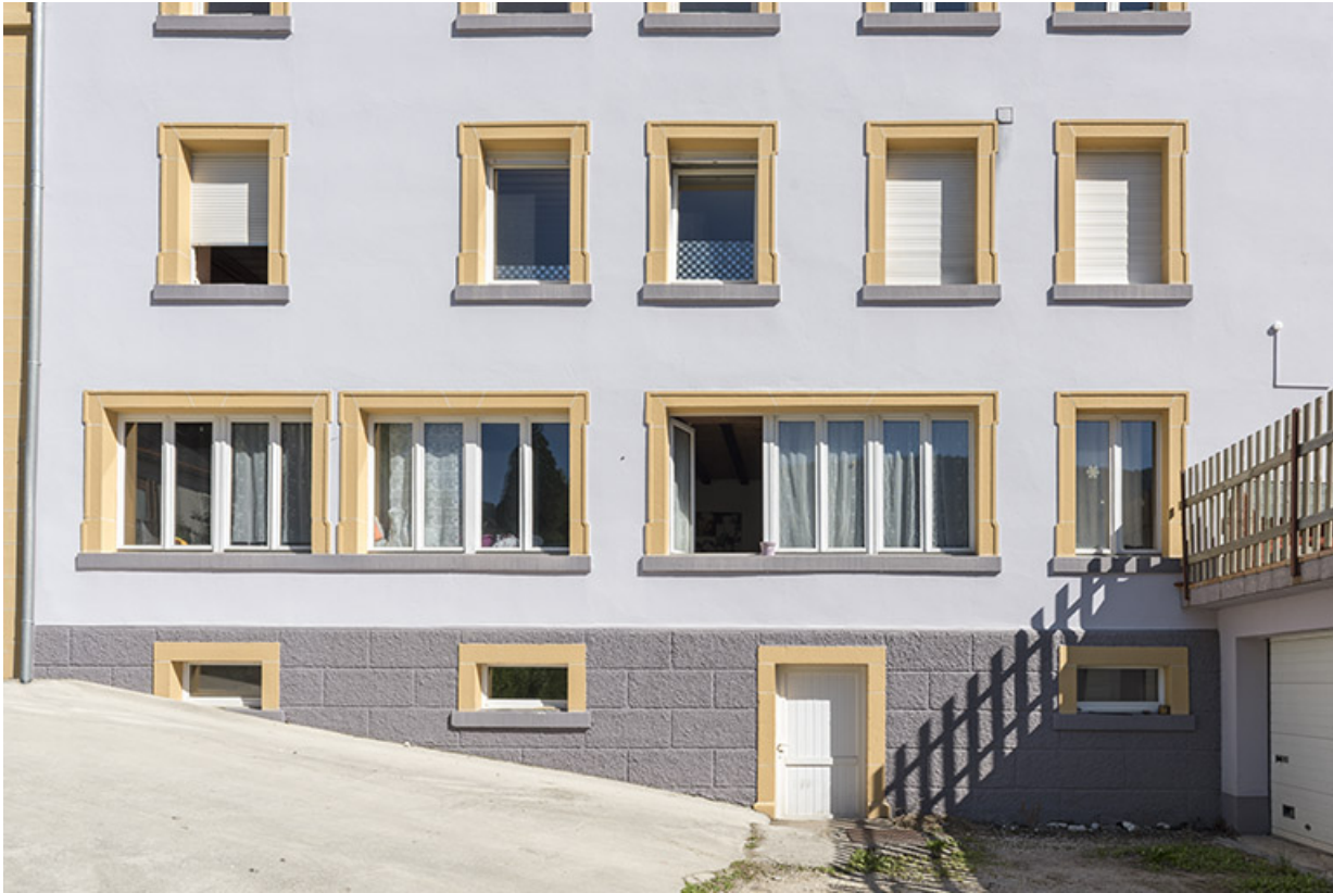
Façade postérieure : baies d'atelier.