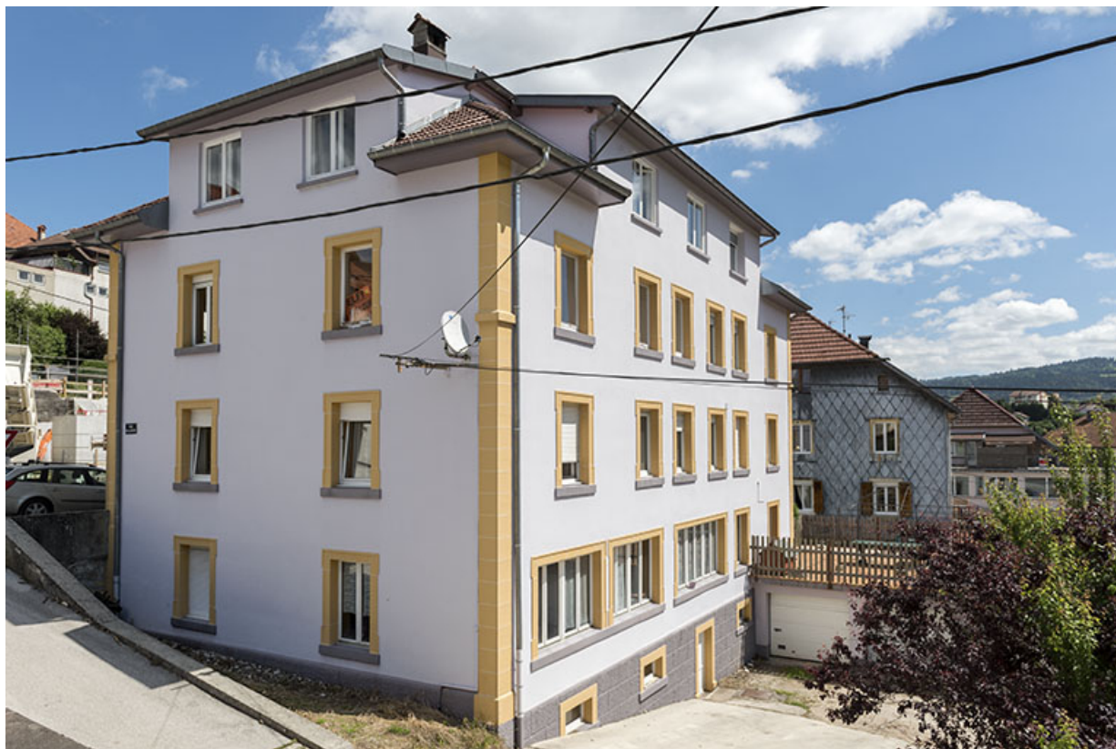
Immeuble (vers 1915) et atelier de pierres pour l'horlogerie d'Antoine Taillard, au 5 Grande Rue. 25, Villers-le-Lac