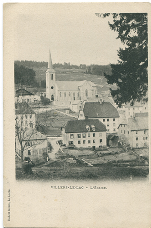
Villers-le-Lac. - L'Eglise, entre 1900 et 1902. Le bâtiment incendié en 1915 est visible au centre au premier plan. 25, Villers-le-Lac, 5 Grande Rue

Villers-le-Lac. - L'Eglise, carte postale, s.n., entre 1900 et 1902, Robert Frères éd. au Locle. Porte la date 22 février 1902 au recto. Publiée dans : Vuillet, Bernard. Le val de Morteau et les Brenets en 1900. - 1978, p. 112. Lieu de conservation : Collection particulière : Henri Ethalon, Les Ecorces