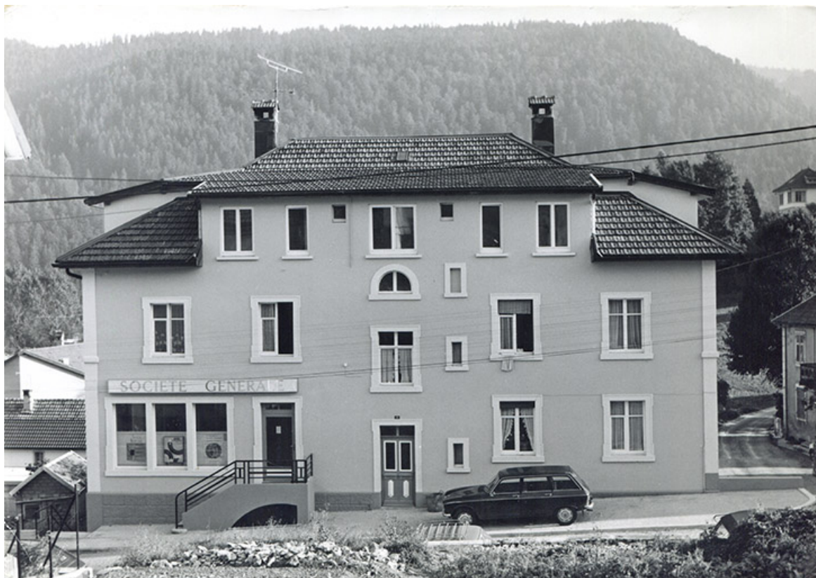
[Façade antérieure vue de face, avec l'agence bancaire et son escalier extérieur], fin des années 1960 ou début des années 1970. 25, Villers-le-Lac, 5 Grande Rue