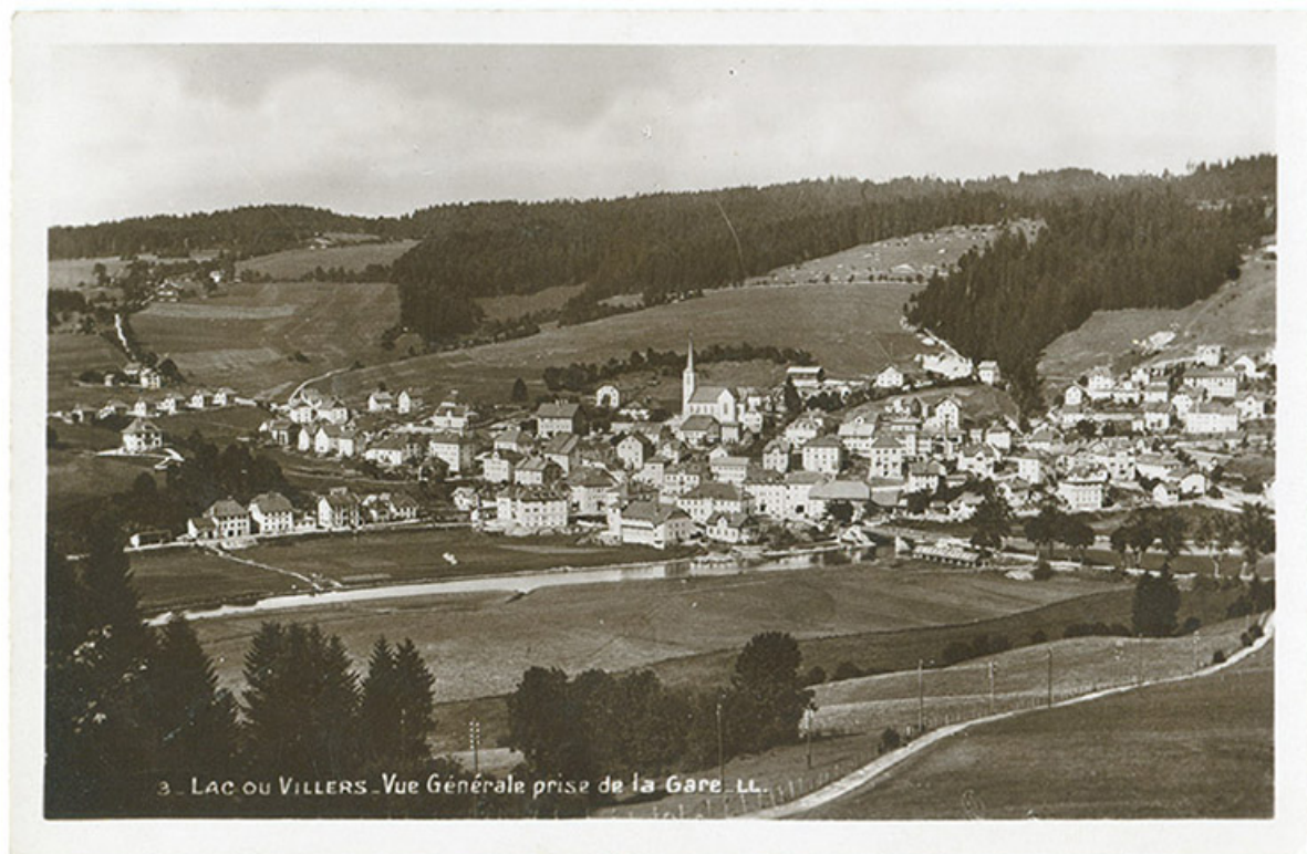
3 - Lac ou Villers - Vue générale prise de la gare, décennie 1930 [avant 1938]. Le bâtiment est visible au centre à droite. 25, Villers-le-Lac