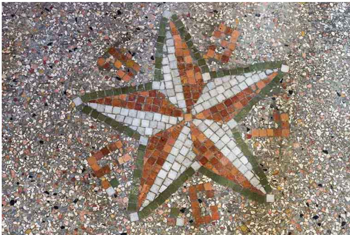
Mosaïque dans l'entrée, ornée d'une étoile et du nom Clerc. 25, Villers-le-Lac, 5 Grande Rue