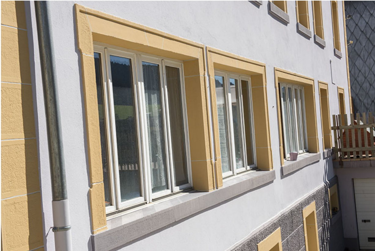
Façade postérieure : baies d'atelier vues en enfilade.