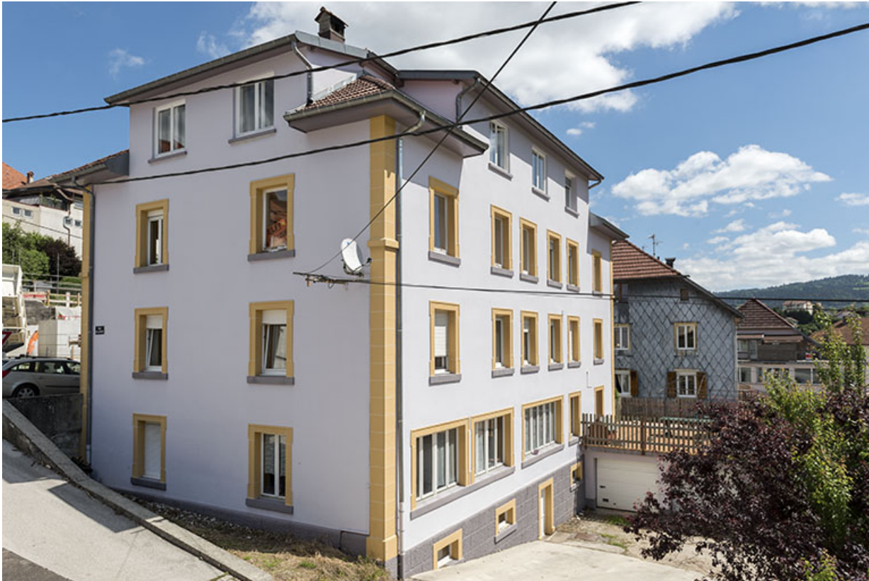
Immeuble (vers 1915) et atelier de pierres pour l'horlogerie d'Antoine Taillard, au 5 Grande Rue. 25, Villers-le-Lac