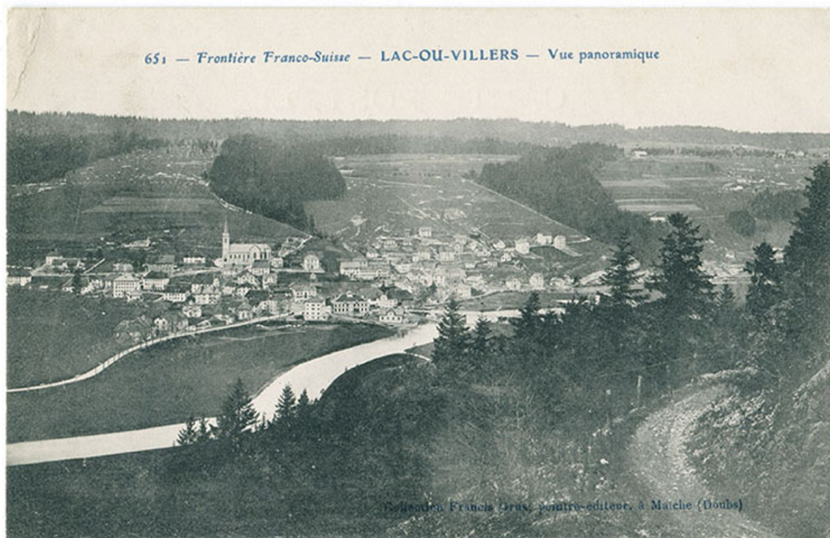
651 - Frontière franco-suisse - Lac-ou-Villers - Vue panoramique [depuis la montagne au sud-est], 1er quart 20e siècle [avant 1908]. 25, Villers-le-Lac

651 - Frontière franco-suisse - Lac-ou-Villers - Vue panoramique [depuis la montagne au sud-est], carte postale, par Francis Grux, s.d. [1er quart 20e siècle, avant 1908], Francis Grux peintre-éditeur à Maiche Lieu de conservation : Collection particulière : Henri Ethalon, Les Ecorces