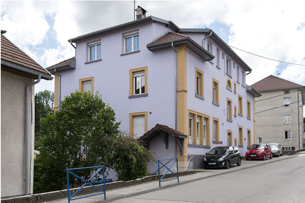
Façades antérieure et latérale gauche.