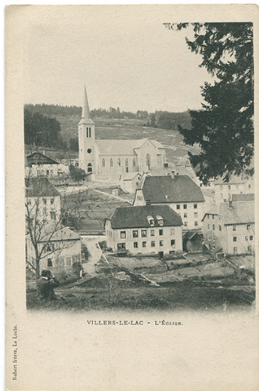
Villers-le-Lac. - L'Eglise, entre 1900 et 1902. Le bâtiment incendié en 1915 est visible au centre au premier plan. 25, Villers-le-Lac, 5 Grande Rue