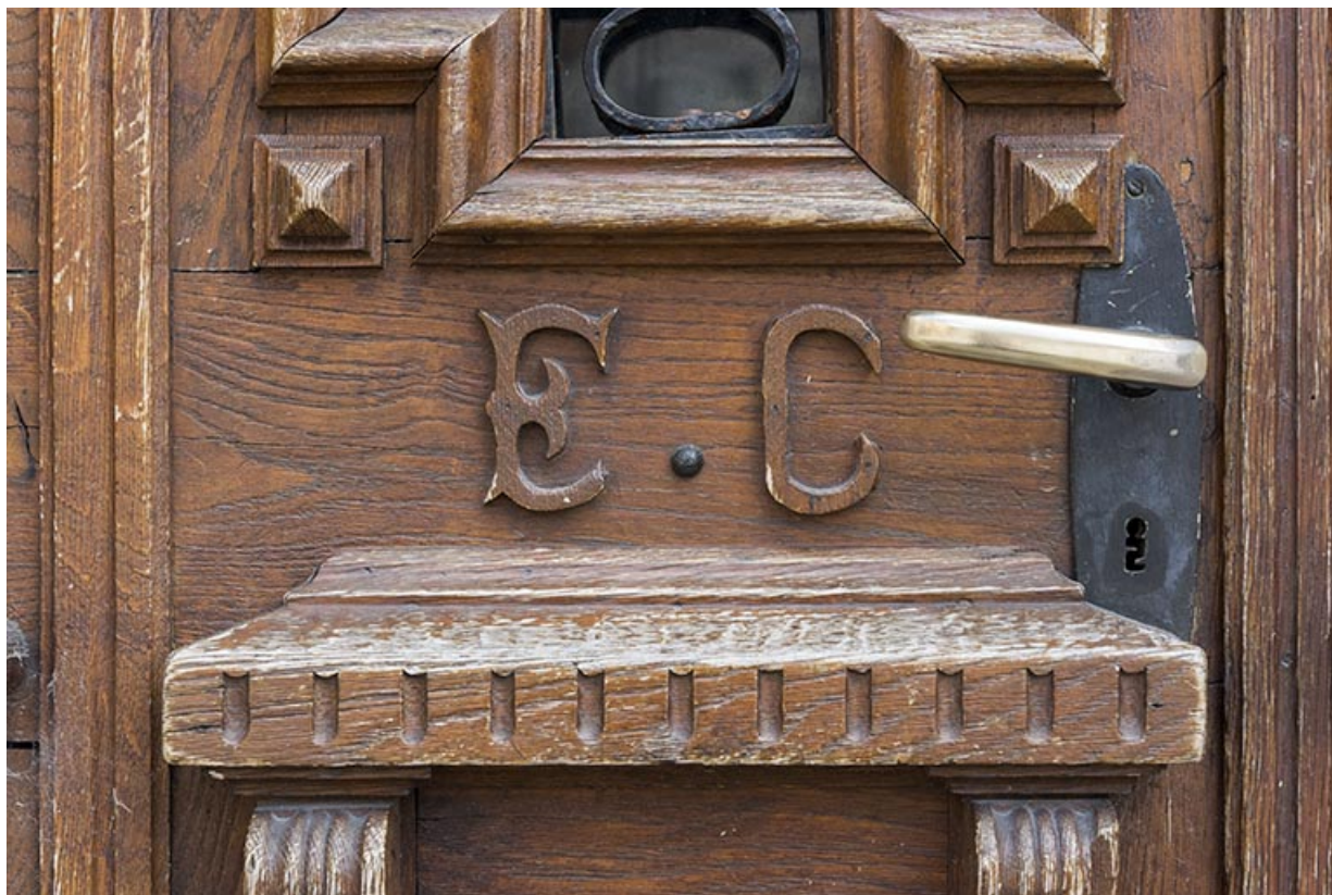
Porte au n° 3 : initiales d'Etienne Claude. 25, Villers-le-Lac, 3 Grande Rue