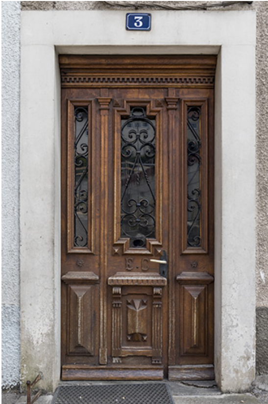
Porte au n° 3.