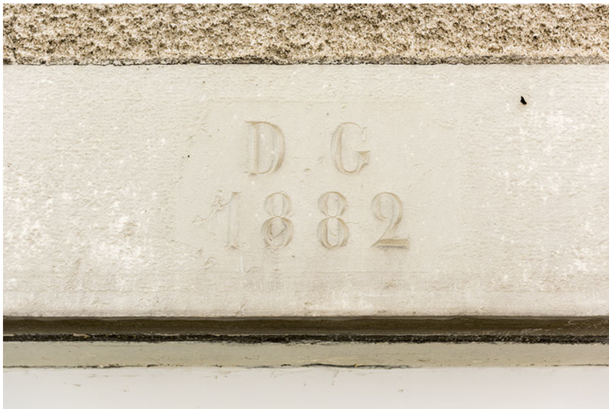
Fenêtre (ancienne porte) : date portée sur le linteau avec les initiales DG.