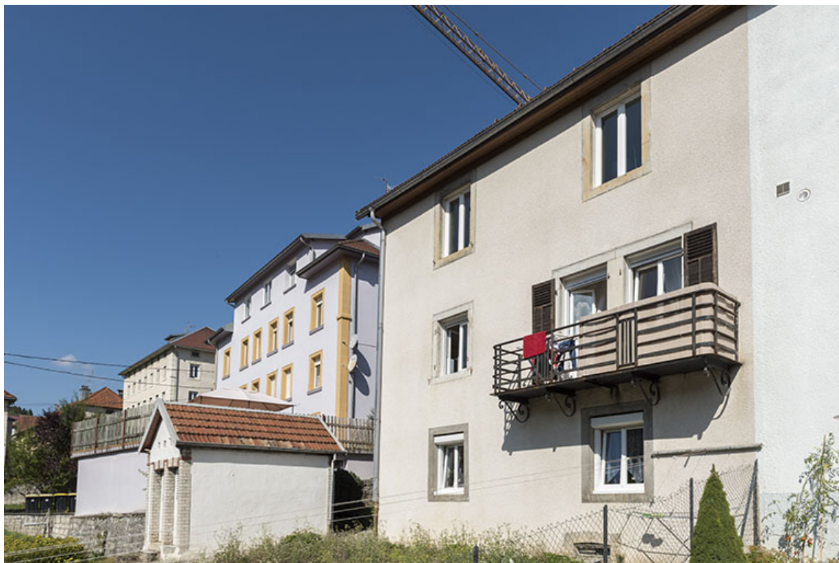
Façade postérieure, de trois quarts droite, et latrines. A gauche, façade postérieure de l'immeuble et atelier de pierres pour l'horlogerie d'Antoine Taillard, au n° 5 de la rue.