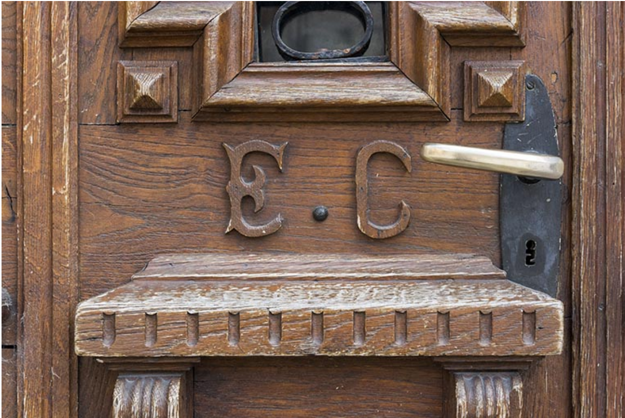
Porte au n° 3 : initiales d'Etienne Claude.