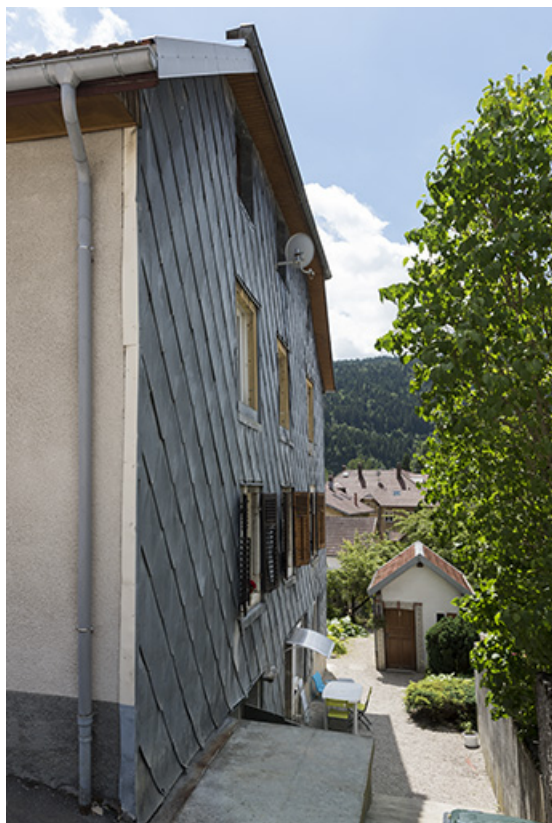
Façade latérale droite, vue en enfilade, et latrines.