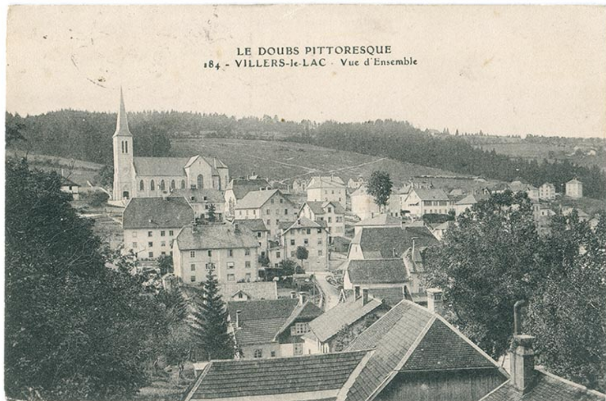
Le Doubs pittoresque. 184 - Villers-le-Lac - Vue d'ensemble [vue d'ensemble, depuis la rue Berçot côté Morteau], entre 1908 et 1913.

25, Villers-le-Lac, 5-9 rue Hippolyte Parrenin