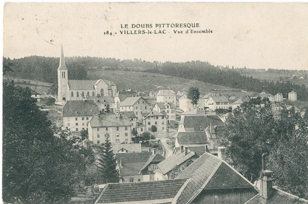
Le Doubs pittoresque. 184 - Villers-le-Lac - Vue d'ensemble [vue d'ensemble, depuis la rue Berçot côté Morteau], entre 1908 et 1913.

25, Villers-le-Lac, 5-9 rue Hippolyte Parrenin