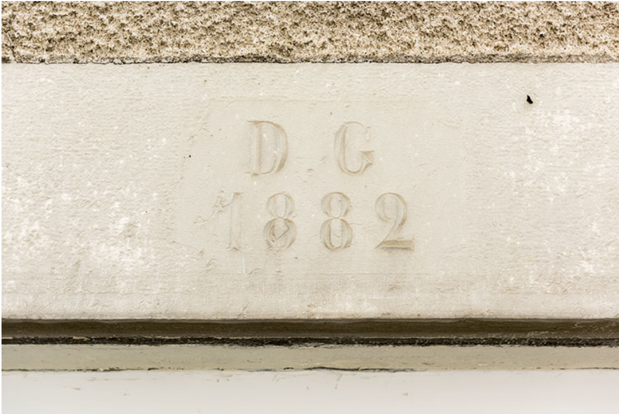
Fenêtre (ancienne porte) : date portée sur le linteau avec les initiales DG.