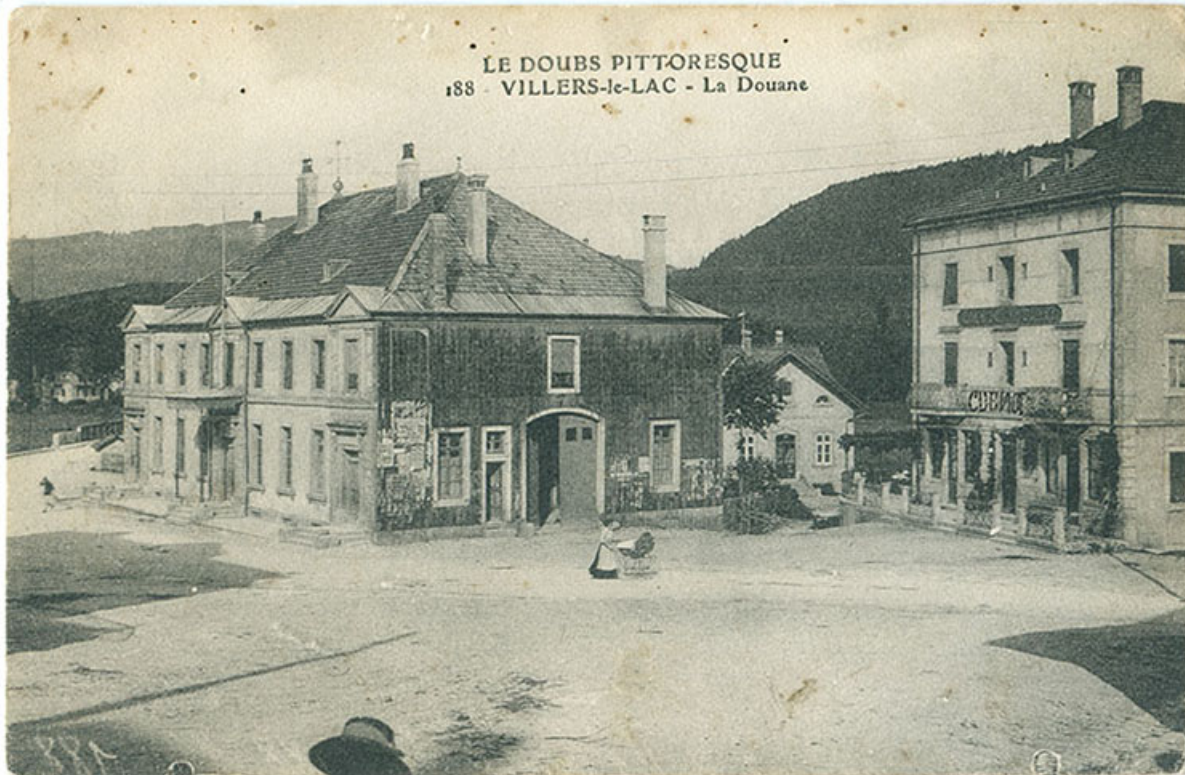
Le Doubs pittoresque. 188 - Villers-le-Lac - La Douane, 1ère moitié 20e siècle. 25, Villers-le-Lac, 1 rue Pierre Berçot