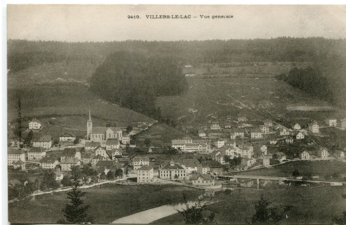
2419. Villers-le-Lac - Vue générale [vue d'ensemble du village depuis le sud-ouest], entre 1898 et 1903. Le bâtiment, à droite, est coiffé d'une terrasse.