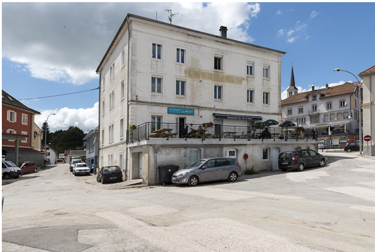
Immeuble : façade latérale gauche, de trois quarts gauche.