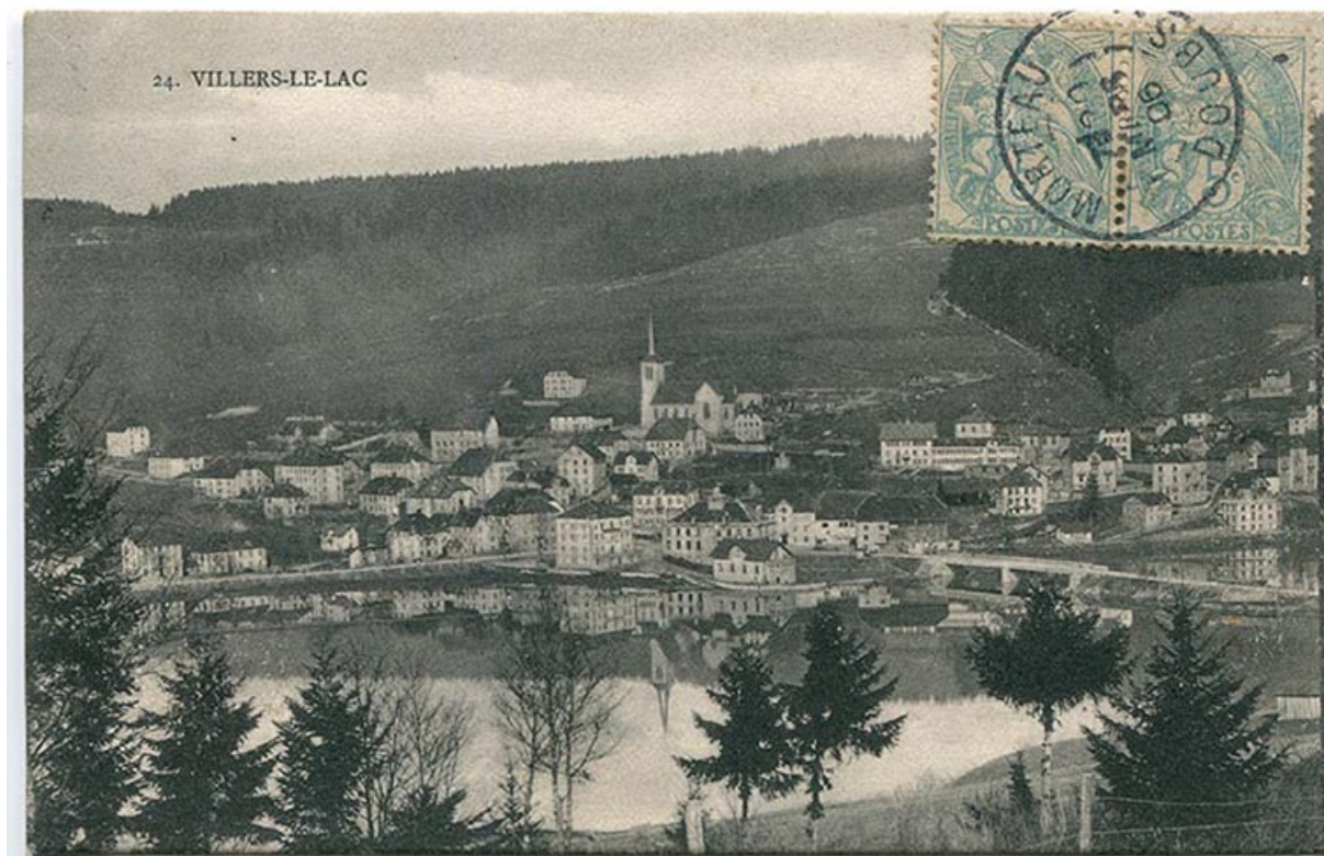
24. Villers-le-Lac [le village vu du sud-est], limite 19e siècle 20e siècle [entre 1893 et 1906]. La maison est bâtie mais pas l'atelier. 25, Villers-le-Lac, 6 rue du Maréchal Foch