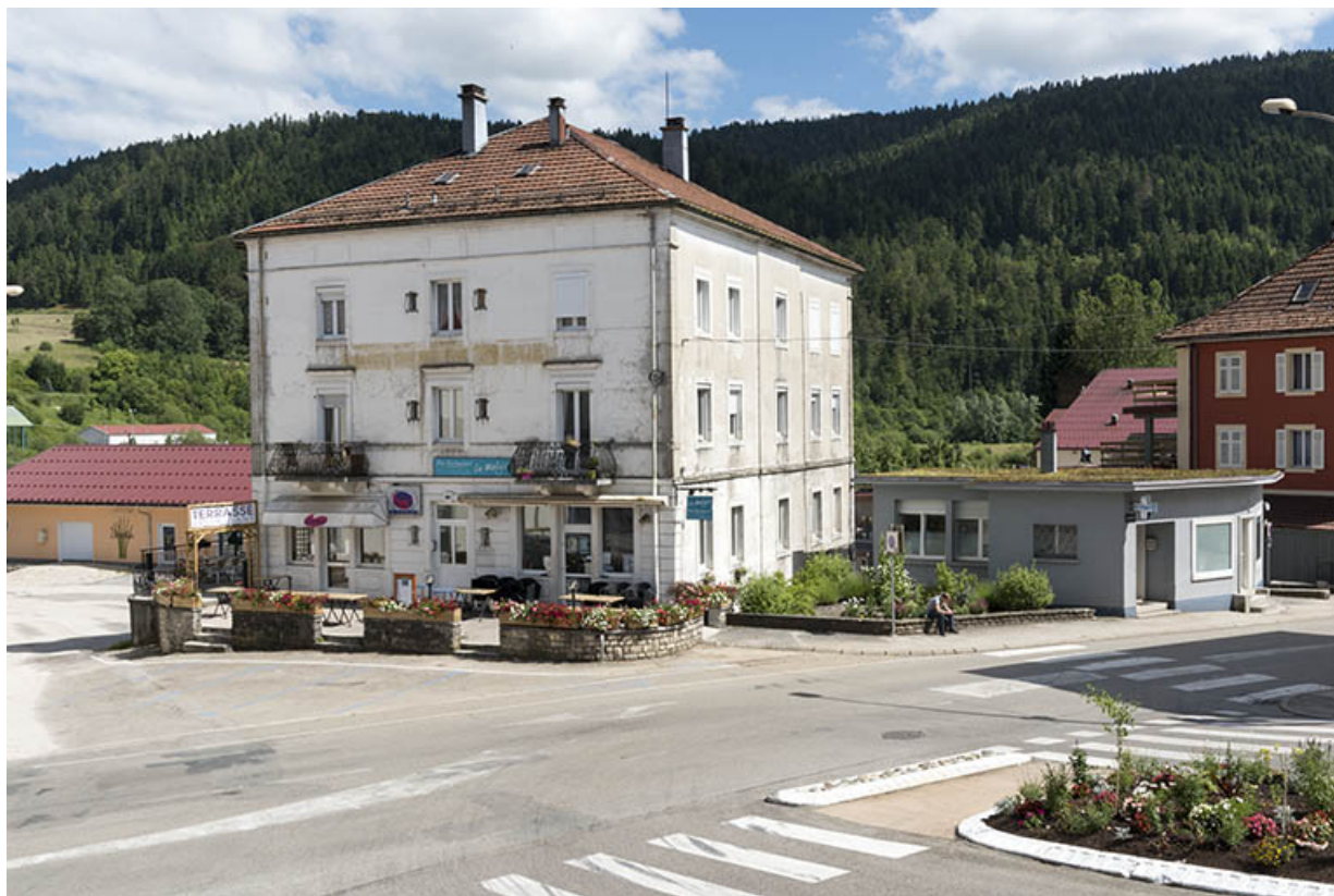
Vue d'ensemble, depuis le nord-ouest : immeuble à gauche, atelier à droite. 25, Villers-le-Lac, 1 rue Pierre Berçot