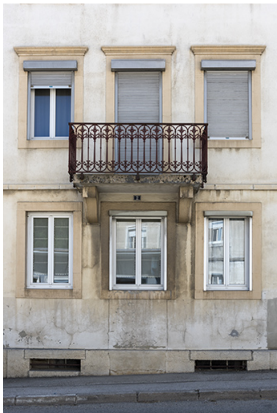
Façade antérieure : travées centrales.