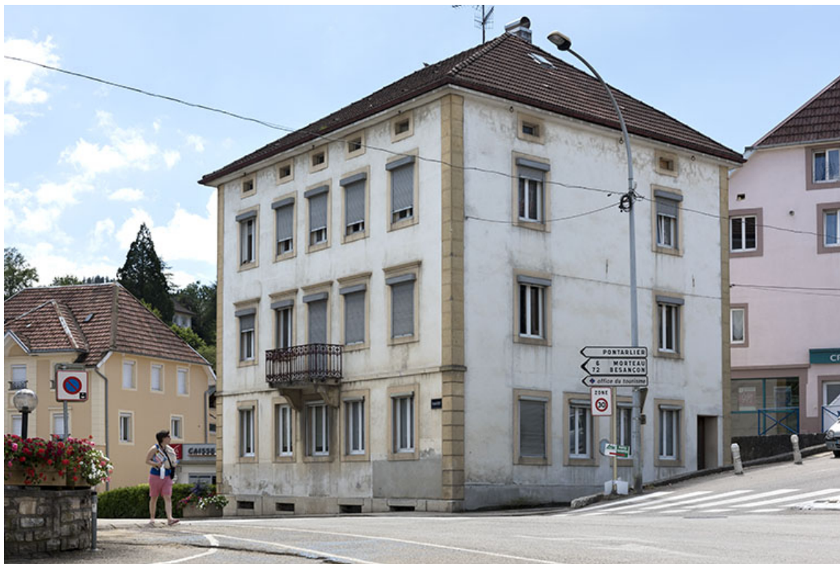
Façades antérieure et latérale droite. 25, Villers-le-Lac