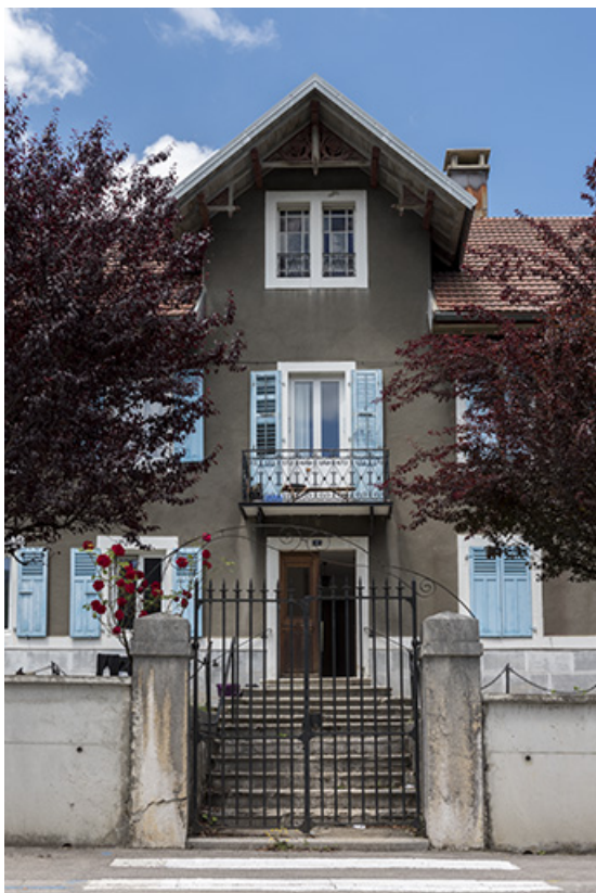
Extension : travée centrale de la façade antérieure. 25, Villers-le-Lac, 4-8 rue Pasteur