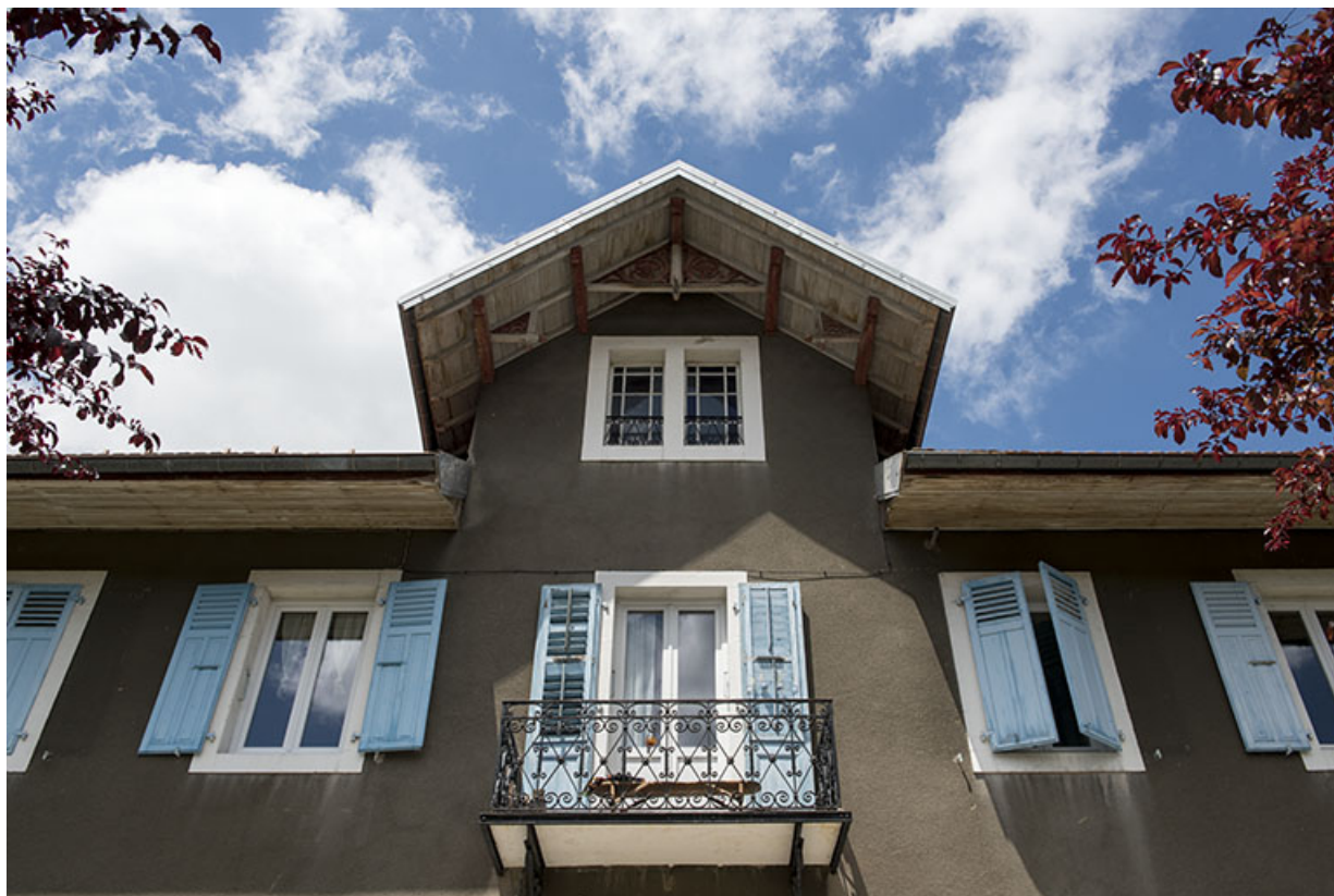
Extension : travée centrale de la façade antérieure, vue en contre-plongée.