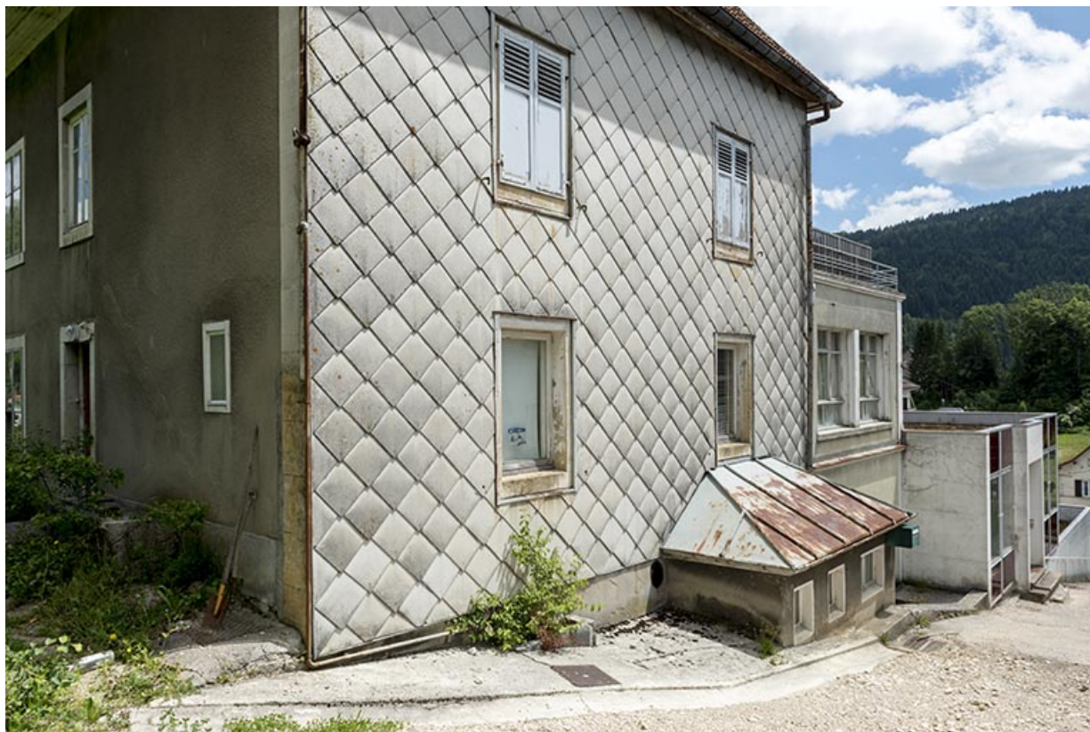
Maison et ateliers : façade antérieure, de trois quarts gauche.