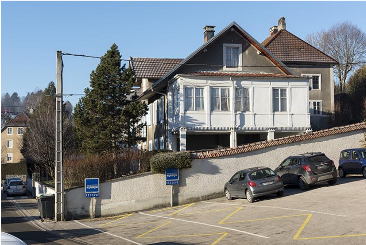
Extension : façade latérale droite.