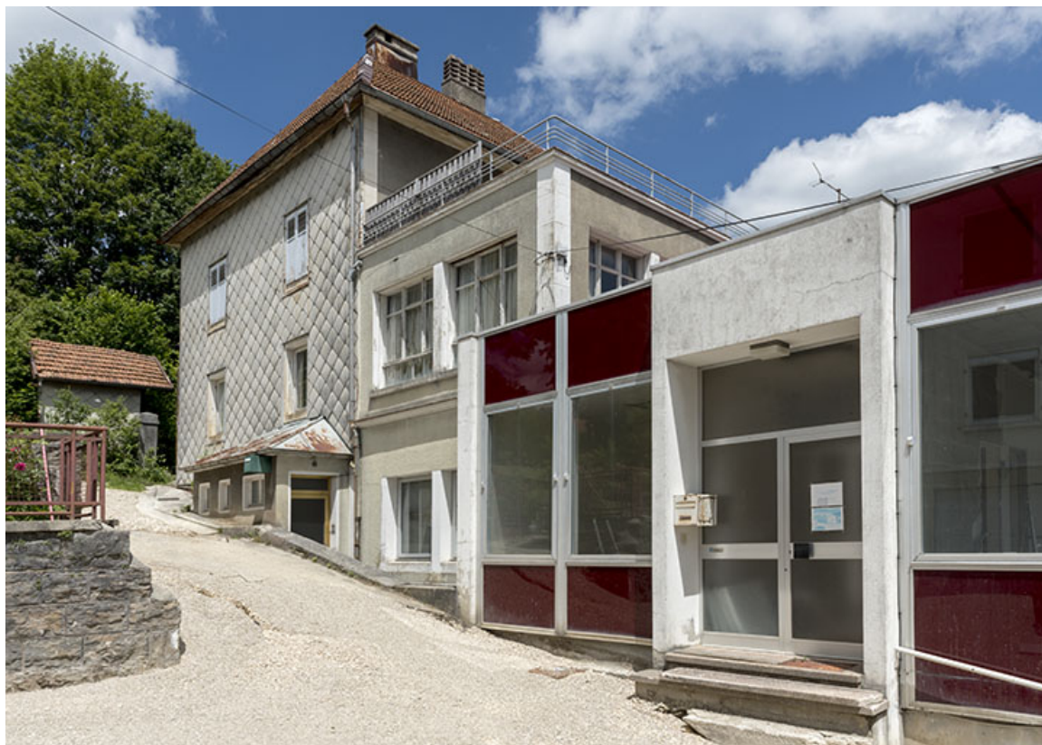
Maison et ateliers : façade antérieure, de trois quarts droite.