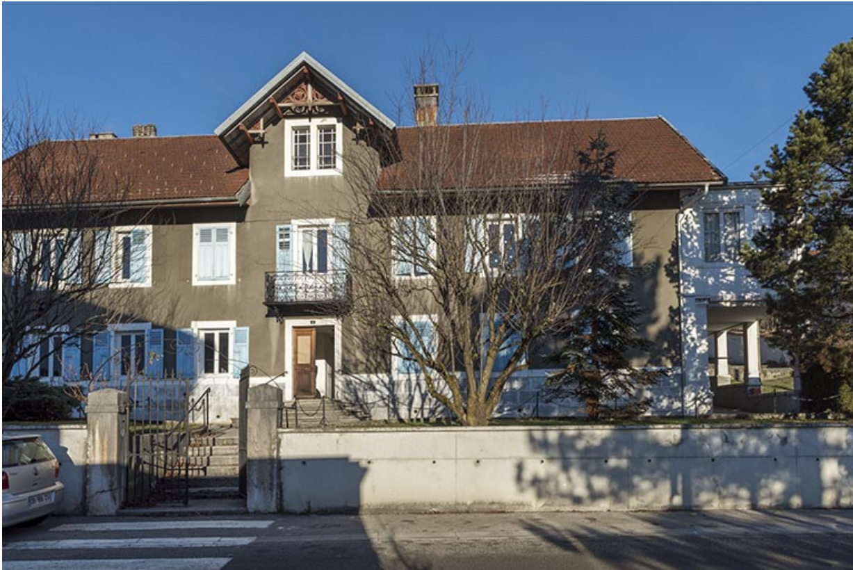
Extension : façade antérieure.