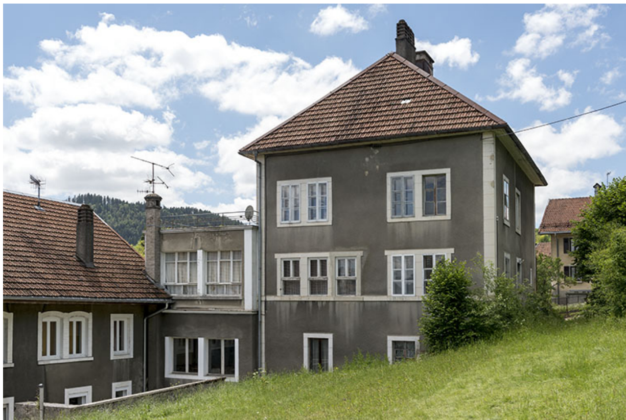
Atelier et maison : façade postérieure, de trois quarts droite.