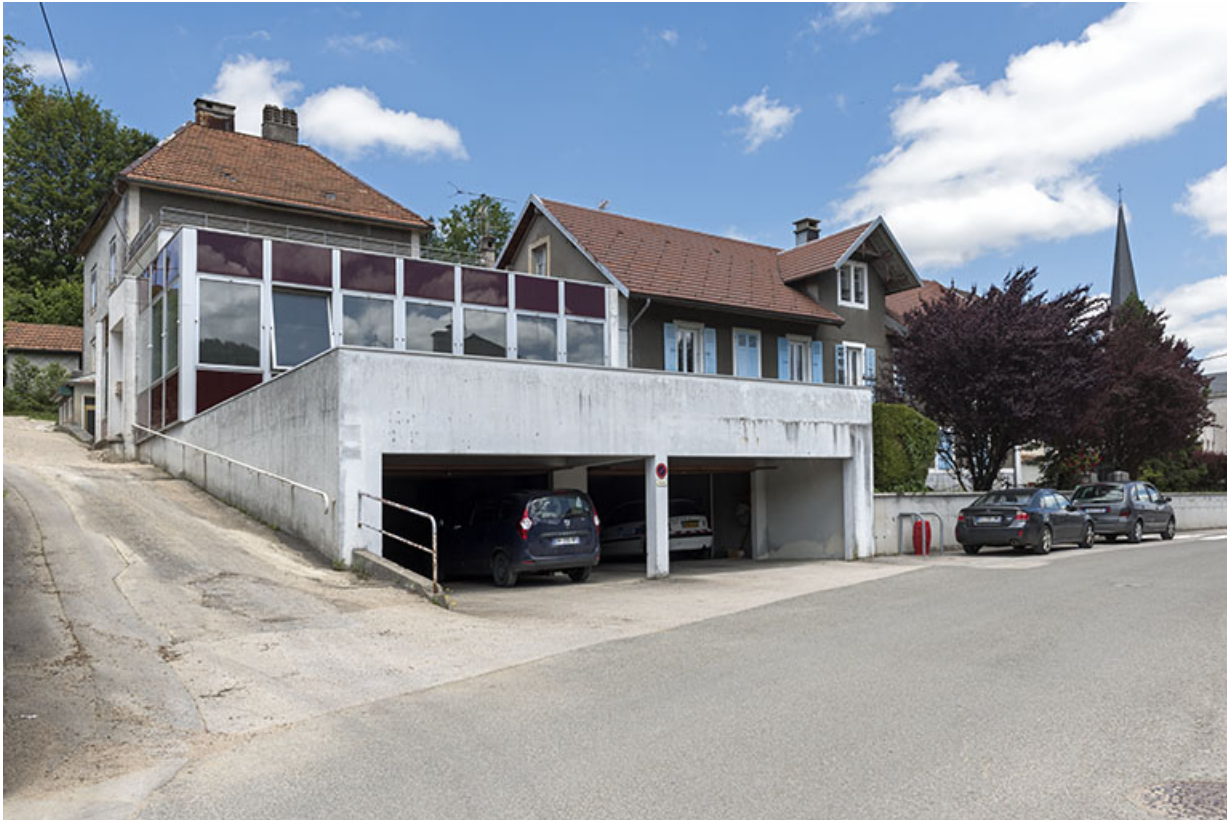
Vue d'ensemble, depuis le sud-ouest (garage, atelier et maison à gauche, extension à droite). 25, Villers-le-Lac, 4-8 rue Pasteur