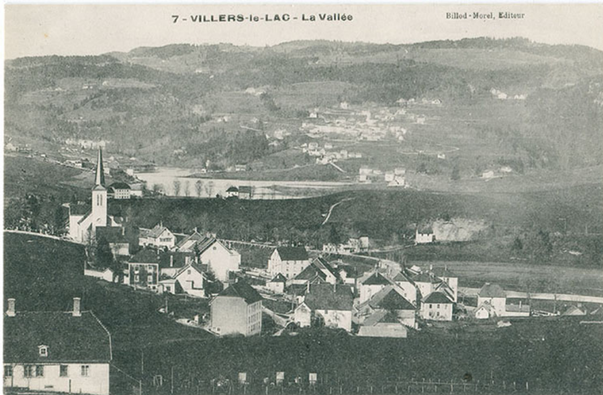
7 - Villers-le-Lac - La vallée [le village, depuis le sud-ouest], 1er quart 20e siècle. L'arrière du bâtiment est visible à droite. 25, Villers-le-Lac, 2 rue de la Cotote