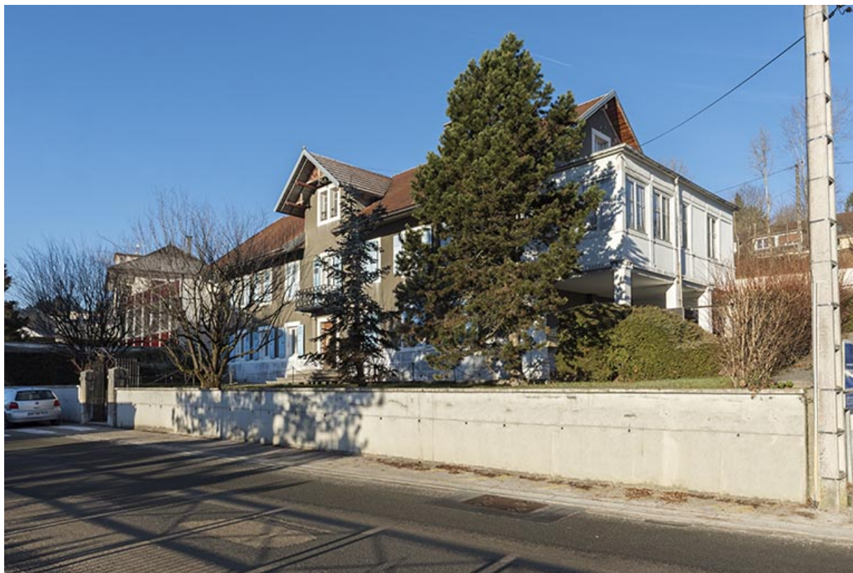
Vue d'ensemble, depuis l'est (façades antérieure et latérale droite de l'extension). 25, Villers-le-Lac, 4-8 rue Pasteur