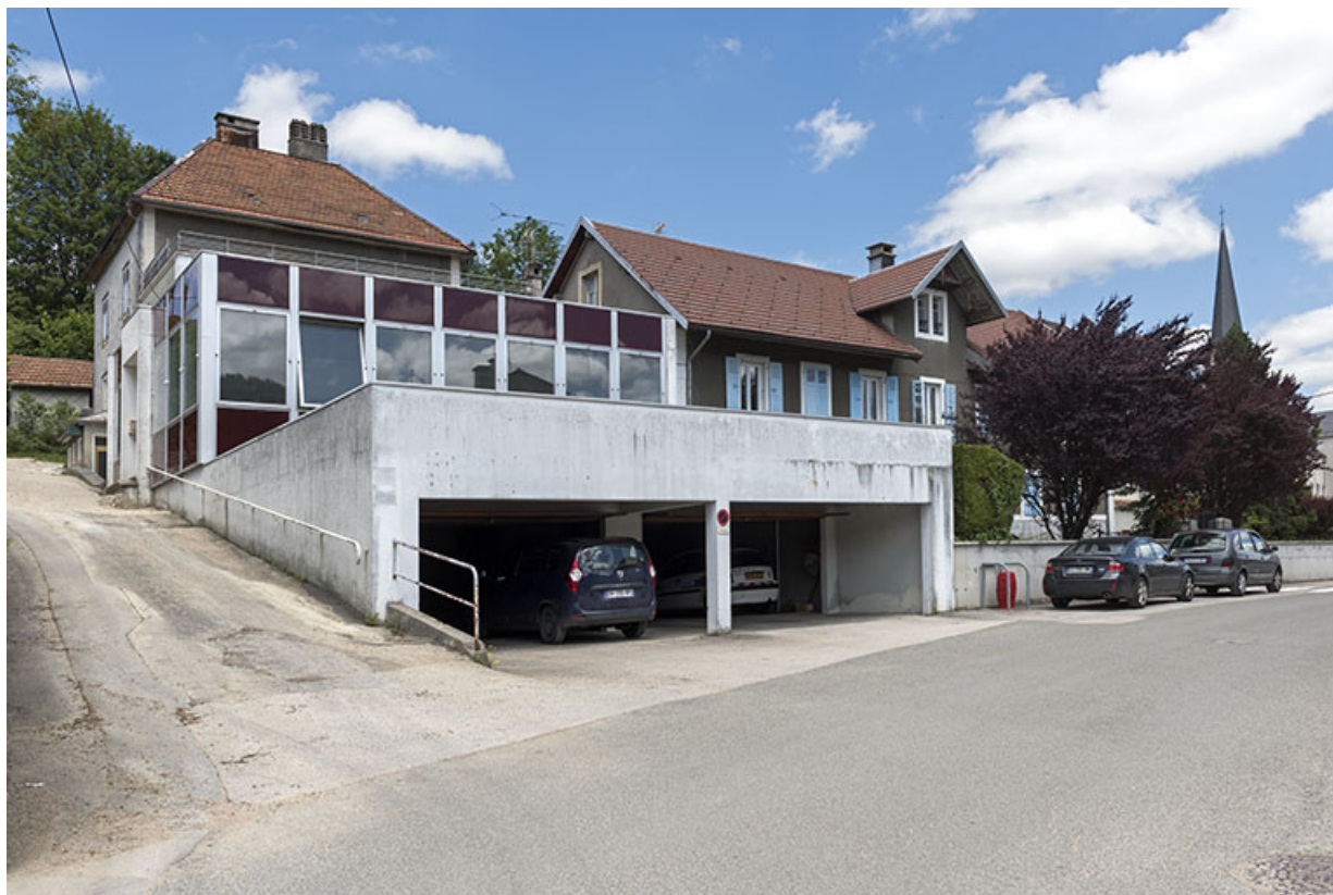
Vue d'ensemble, depuis le sud-ouest (garage, atelier et maison à gauche, extension à droite). 25, Villers-le-Lac, 4-8 rue Pasteur