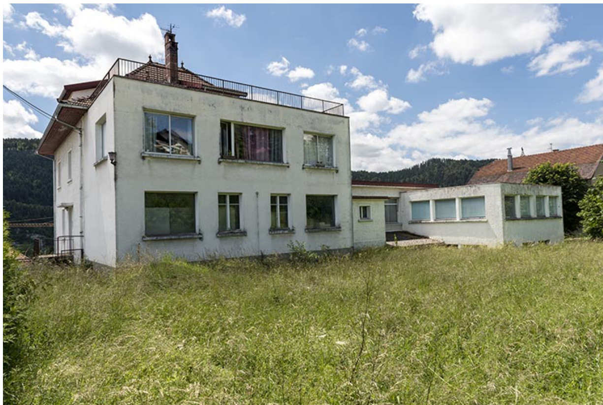
Façade postérieure, de trois quarts gauche.