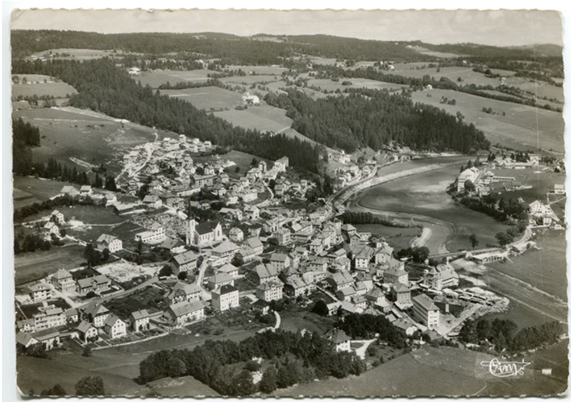
Villers-le-Lac (Doubs). 22173 - Vue panoramique aérienne [depuis le sud], 1952. L'usine est visible à droite. 25, Villers-le-Lac