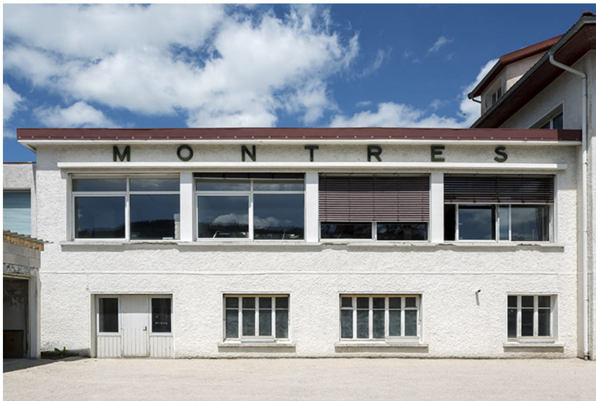
Façade antérieure de l'usine.