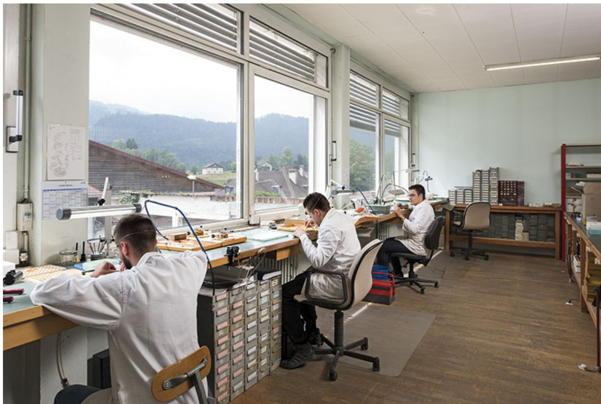
Atelier de fabrication, avec horlogers à l'établi.