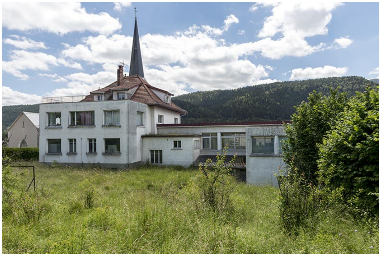
Façade postérieure, de trois quarts droite.