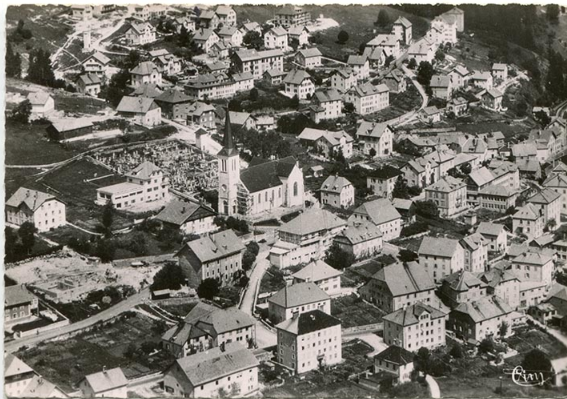
Villers-le-Lac (Doubs) - Vue aérienne. 22173 - Le Centre du Pays, 1952. La maison est visible entre deux autres, à la verticale de l'angle supérieur du cimetière.