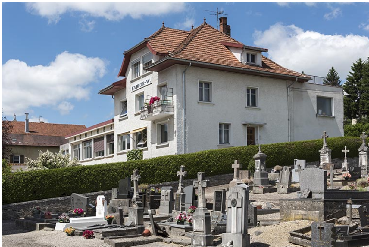
Maison et usine de montres Parent Frères, Fabior-Watch puis Berthet (1948-1949), au 4 place Saint-Jean. 25, Villers-le-Lac