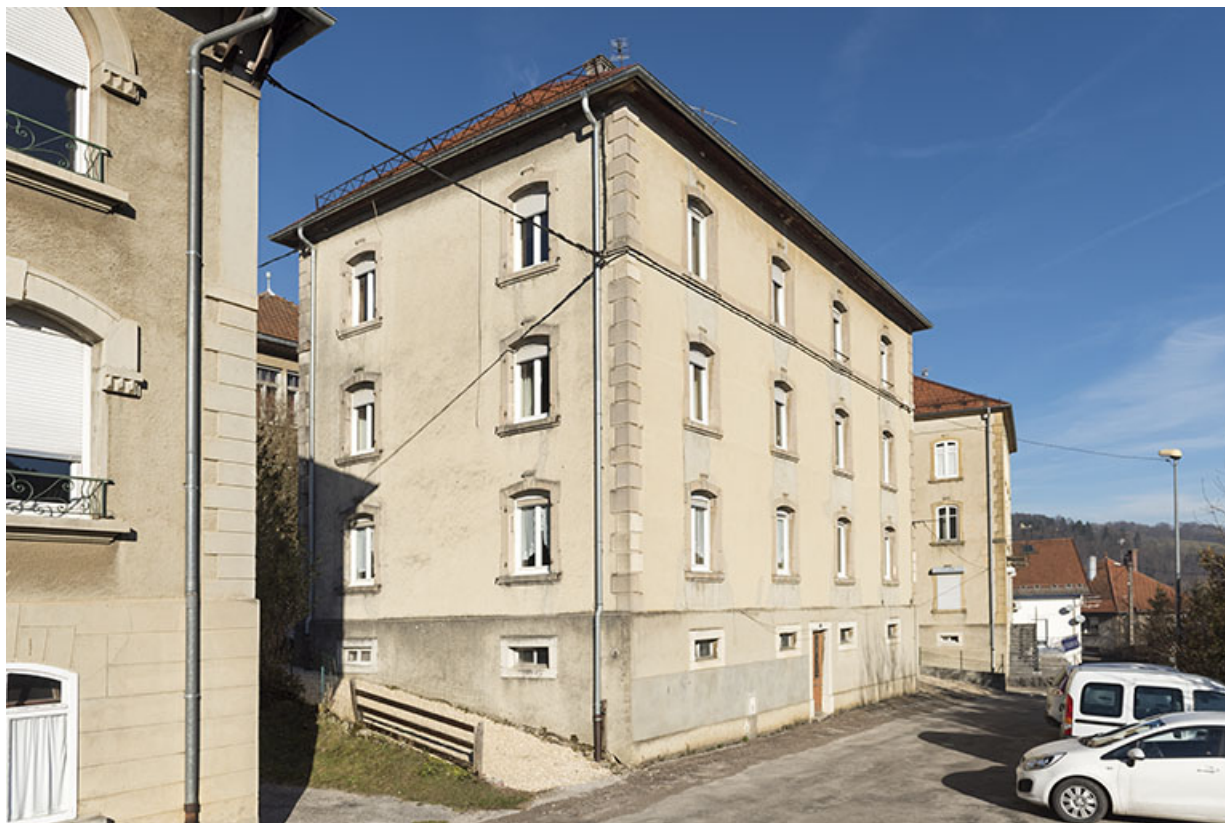
Façades antérieure et latérale gauche. 25, Villers-le-Lac, 9 rue Virgile Cupillard