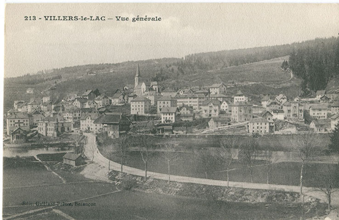
213 - Villers-le-Lac - Vue générale [vue d'ensemble, depuis l'est], 1er quart 20e siècle. Le bâtiment est visible au centre, sous l'église.