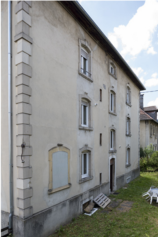
Façade postérieure, de trois quarts gauche. 25, Villers-le-Lac, 9 rue Virgile Cupillard