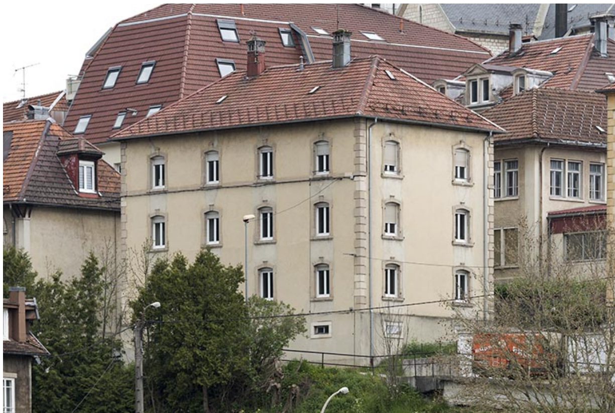
Vue d'ensemble, depuis l'est (façades antérieure et latérale droite). 25, Villers-le-Lac, 9 rue Virgile Cupillard