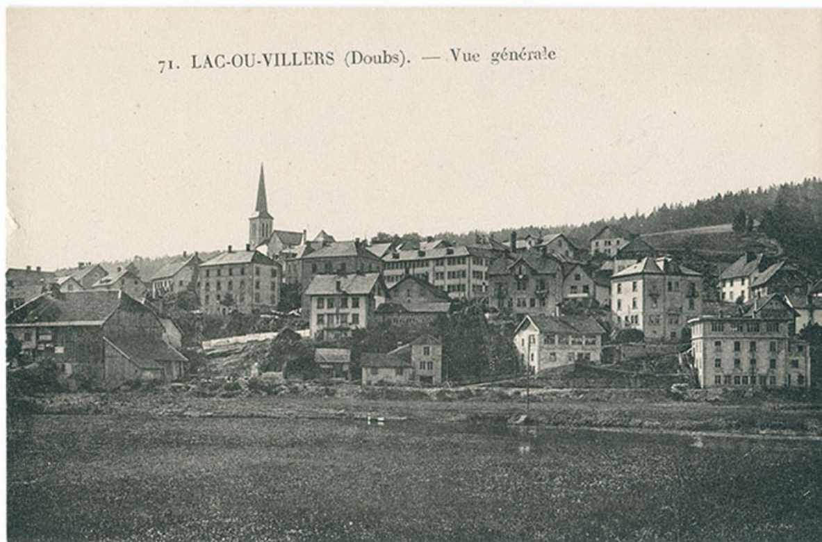
71. Lac-ou-Villers (Doubs). - Vue générale [le quartier des rues du Lac et du Doubs, depuis l'est], décennie 1930. 25, Villers-le-Lac, 3 et 4 rue du Lac

71. Lac-ou-Villers (Doubs). - Vue générale [le quartier des rues du Lac et du Doubs, depuis l'est], carte postale, s.n., s.d. [décennie 1930]