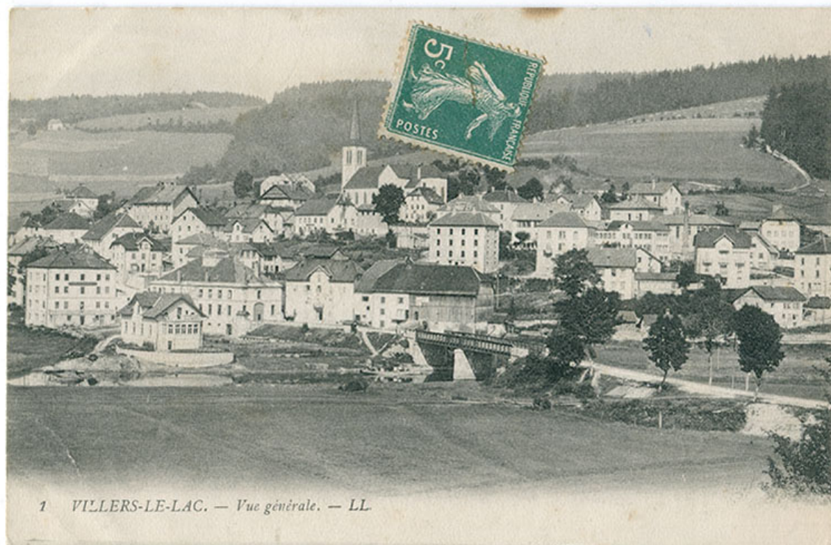
1 Villers-le-Lac. - Vue générale [vue d'ensemble, depuis l'est], 1er quart 20e siècle. Le bâtiment est visible au centre, sous le timbre. 25, Villers-le-Lac, 9 rue Virgile Cupillard

1 Villers-le-Lac. - Vue générale [vue d'ensemble, depuis l'est], carte postale, par Louis Lévy, s.d. [1er quart 20e siècle]