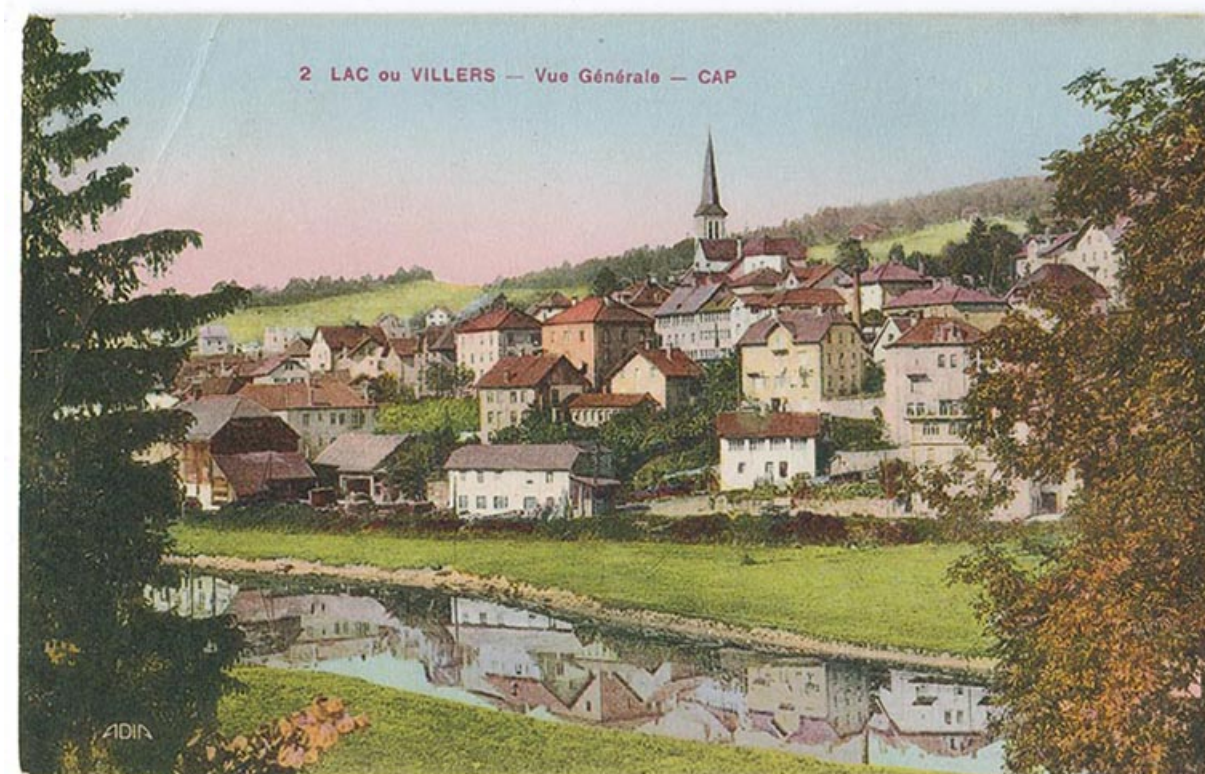
2 Lac ou Villers - Vue générale - CAP [le village vu de l'est], 2e quart 20e siècle [vers 1930]. 25, Villers-le-Lac