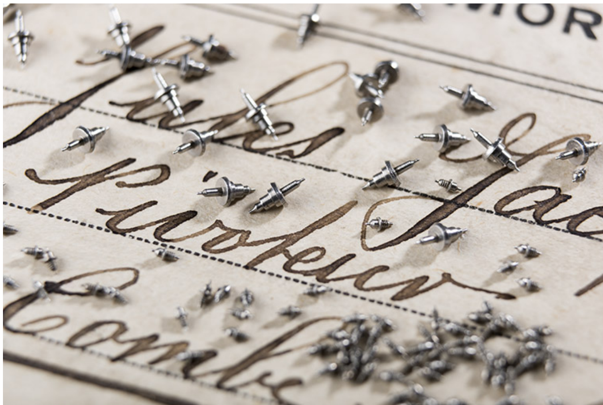
Axes de balancier destinés aux Ets Lambert Frères, de Villers-le-Lac (collection Jean-Claude Vuez, Villers-le-Lac). Le paquet porte l'inscription : "axes / 16" Dellémont / (Français) / Lambert Frères / 380-183".