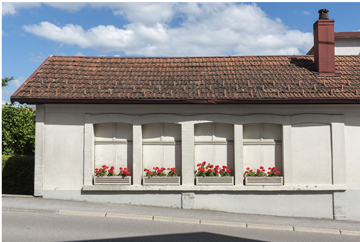
Atelier de fabrication de 1905 environ : fenêtres multiples sur la façade antérieure. 25, Villers-le-Lac, 6 rue du Maréchal Foch