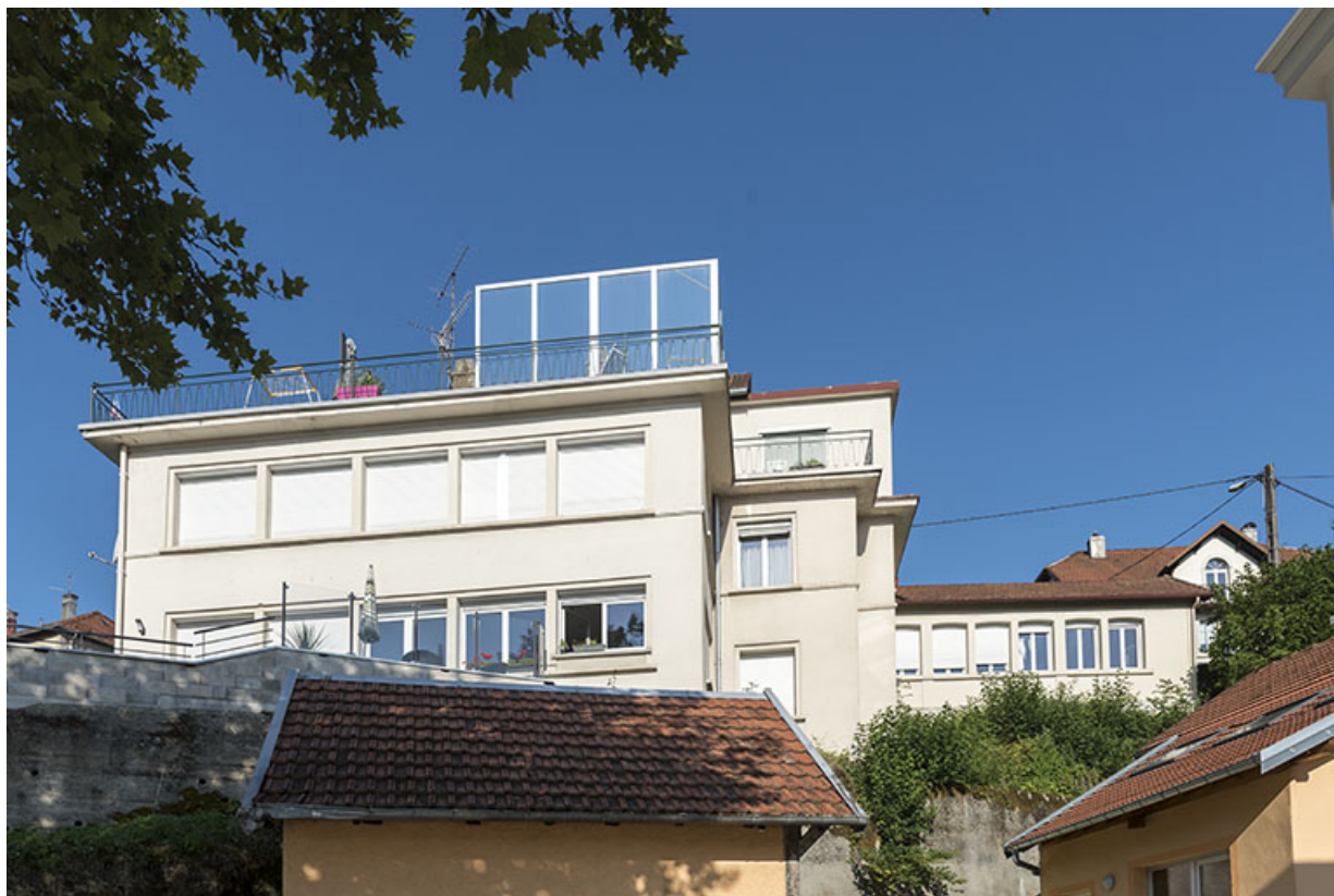
Façade postérieure, vue en contre-plongée.

25, Villers-le-Lac, 6 rue du Maréchal Foch