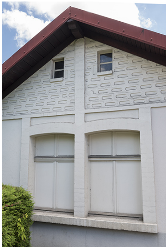
Atelier de fabrication de 1905 environ : mur pignon, avec fenêtre horlogère et briques silico-calcaires. 25, Villers-le-Lac, 6 rue du Maréchal Foch