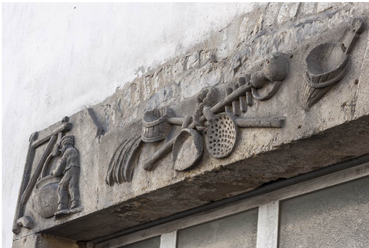
Linteau figurant le métier de fromager.