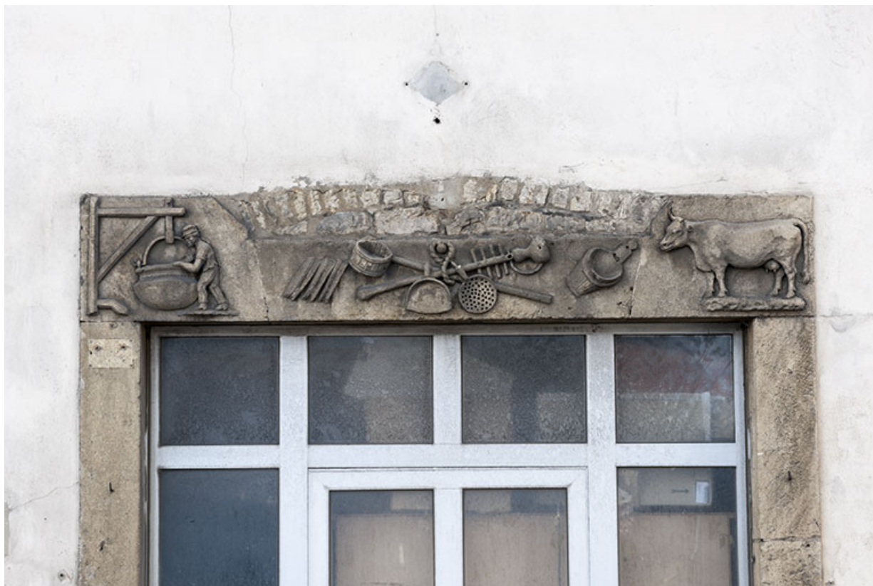
Façade antérieure. Linteau figuré.