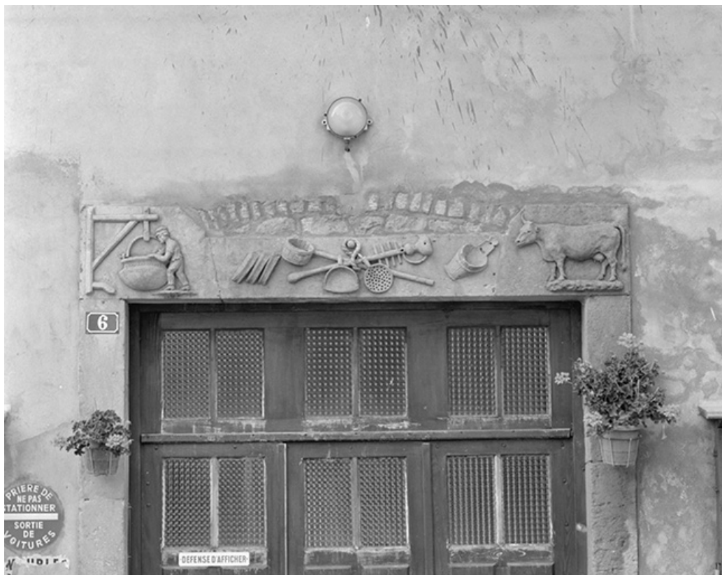
Linteau de la porte d'entrée.