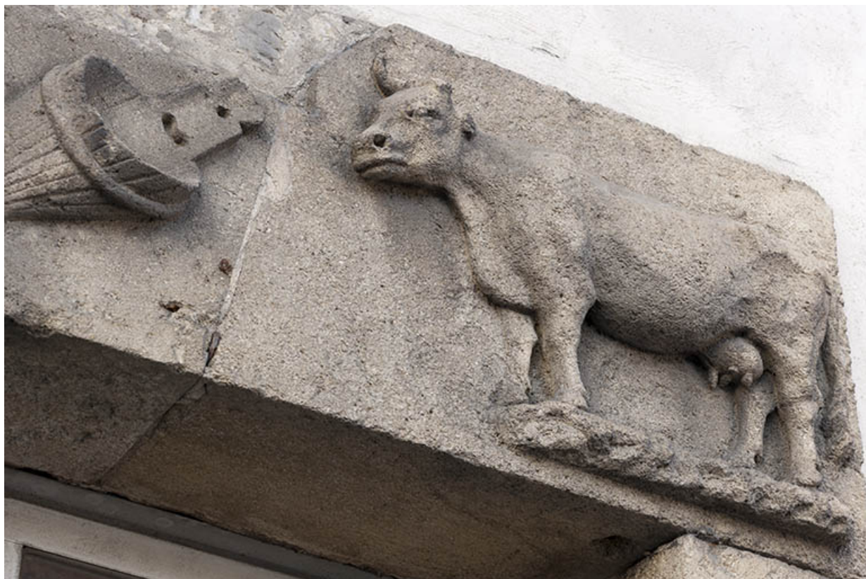
Linteau figuré. Partie droite.