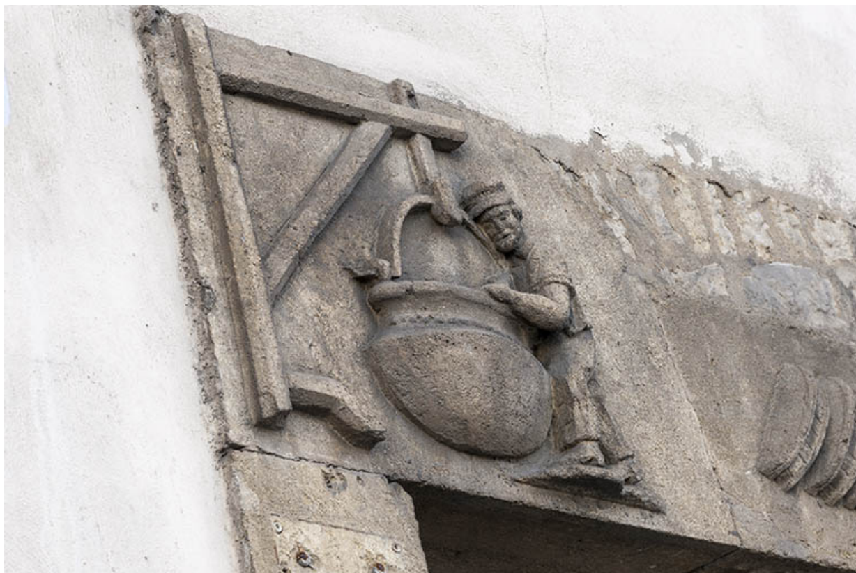
Linteau figuré. Partie gauche.