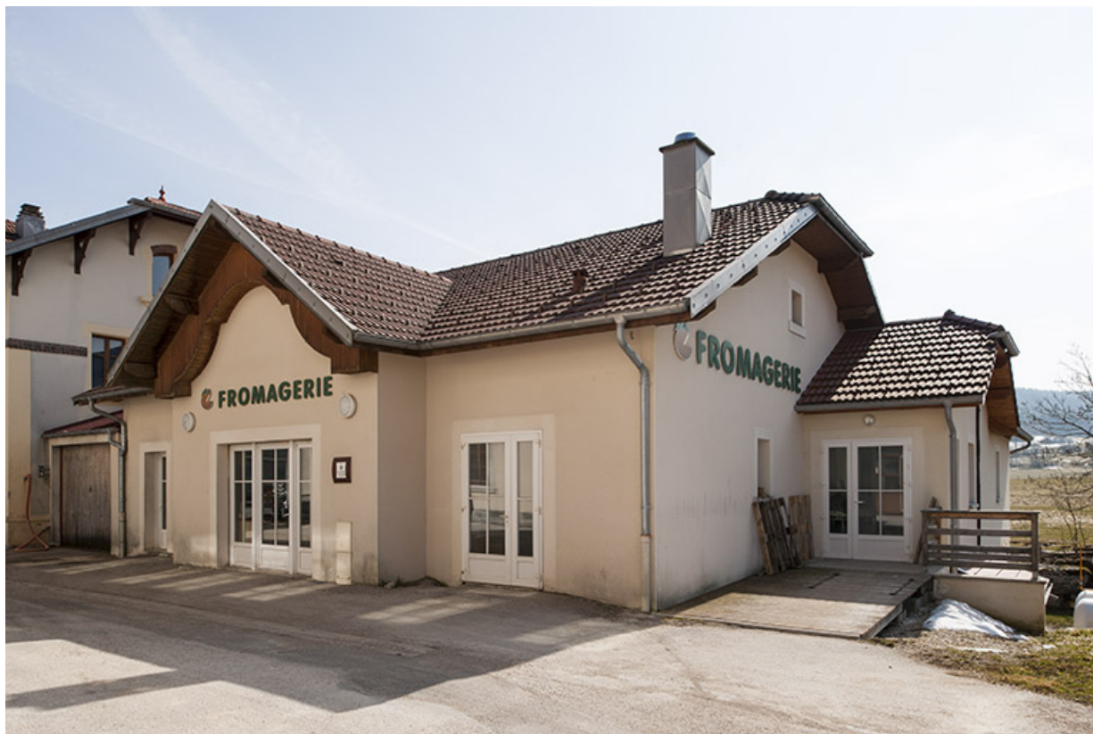
Nouvelle fromagerie vue de trois quarts droite.