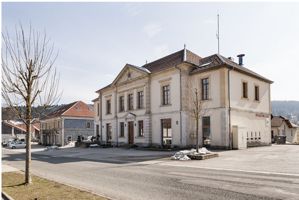
Mairie-fromagerie vue de trois quarts droite. 25, La Chaux, 12B rue du Docteur Girard