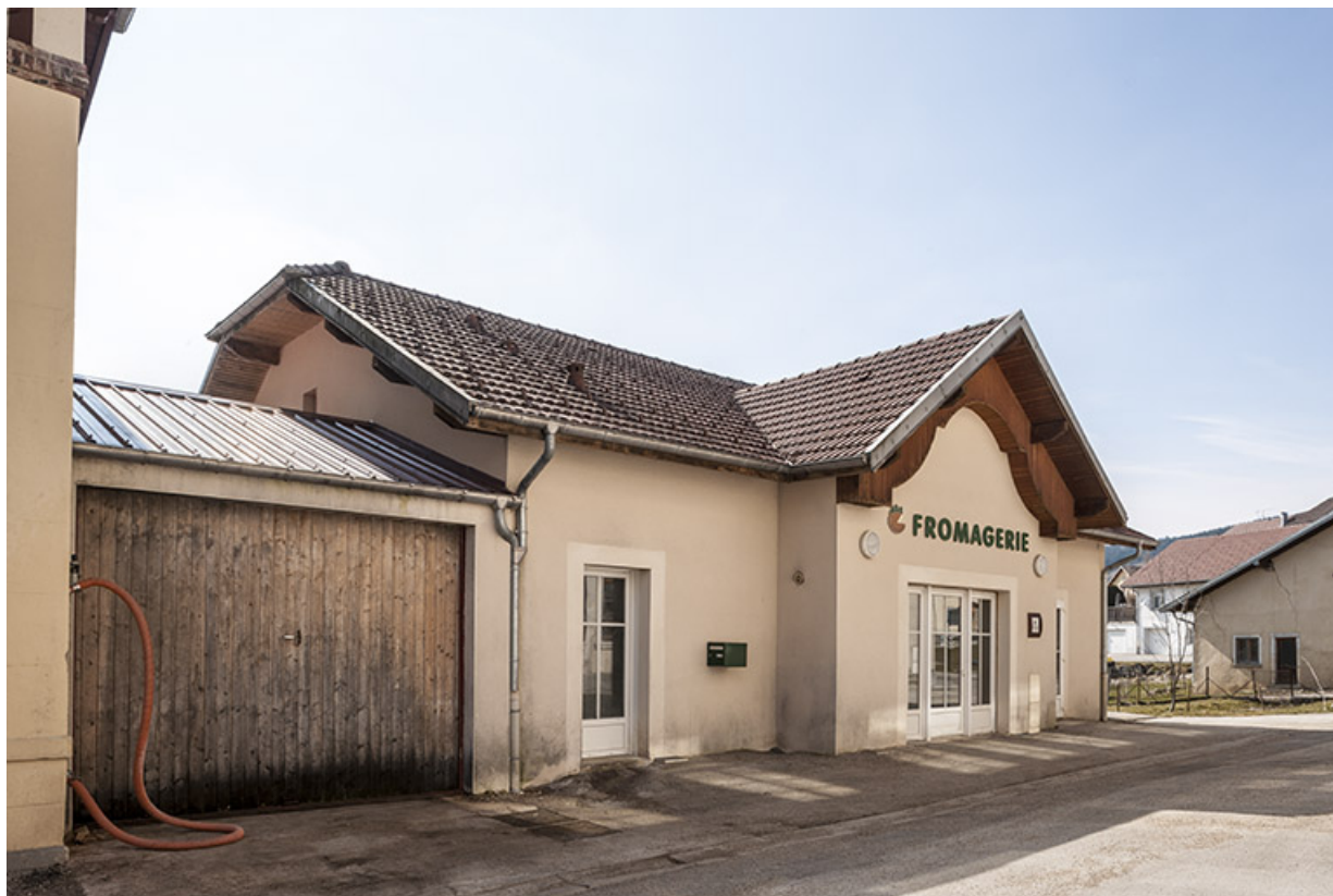
Nouvelle fromagerie vue de trois quarts gauche.