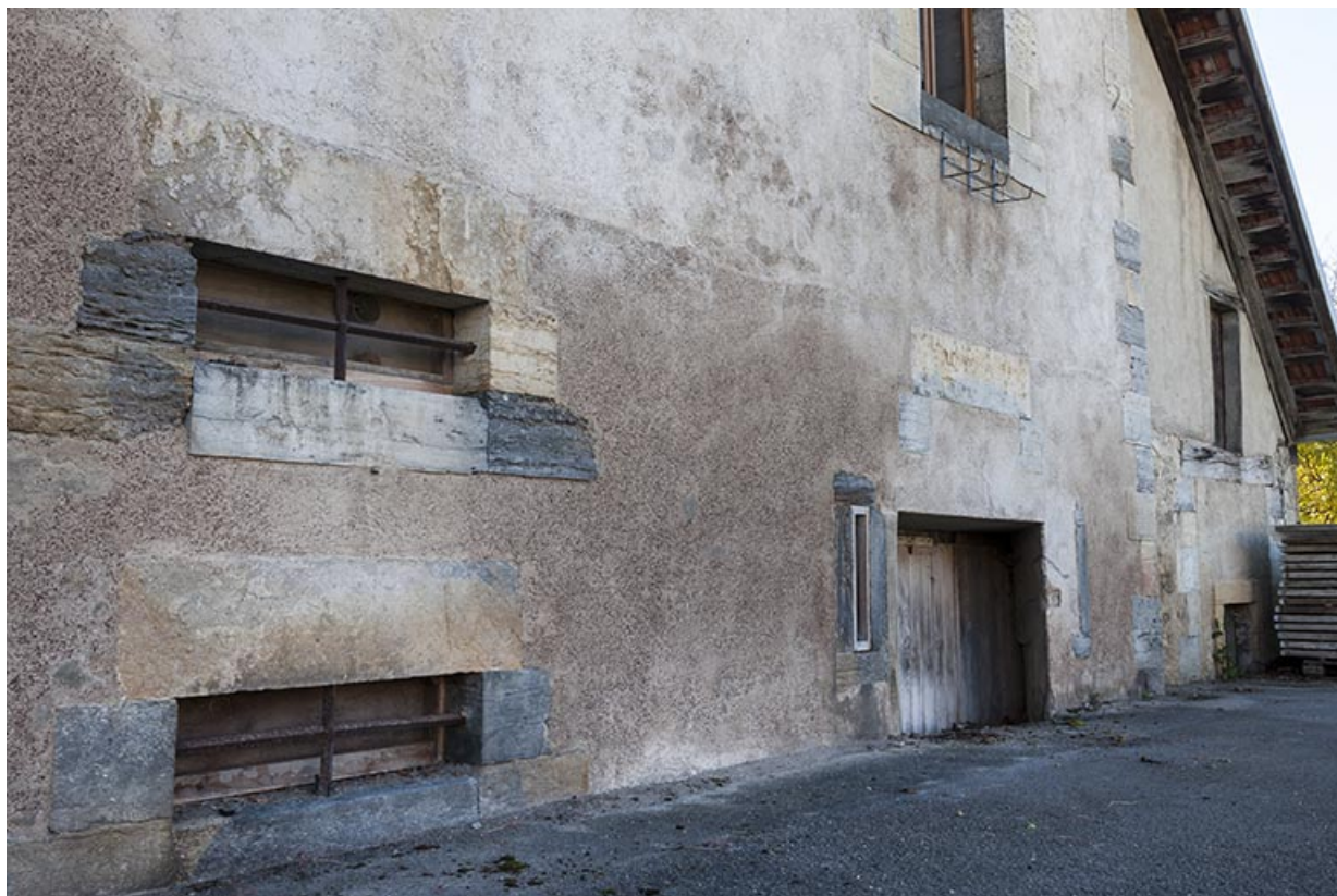
Ouvertures (caves d'affinage) sur la façade postérieure.