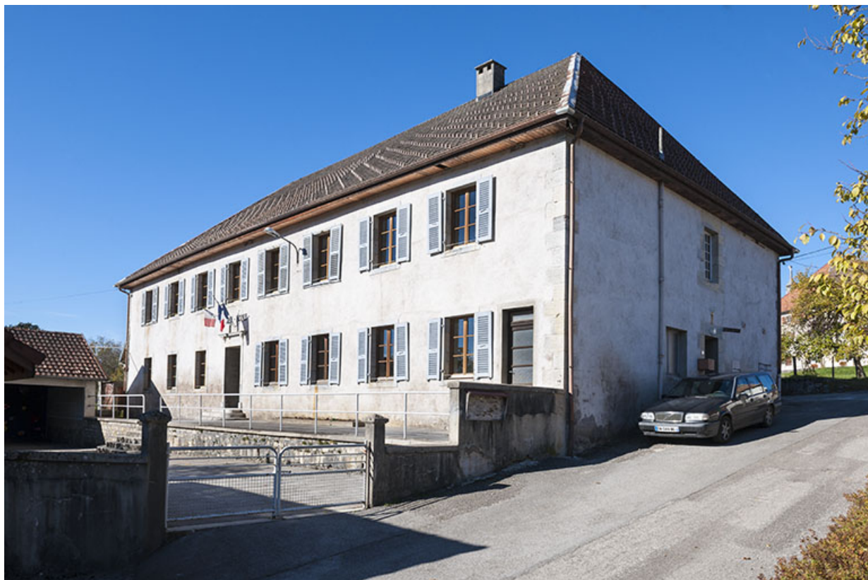
Vue d'ensemble depuis l'est. 25, Aubonne, 1 rue de la Mairie