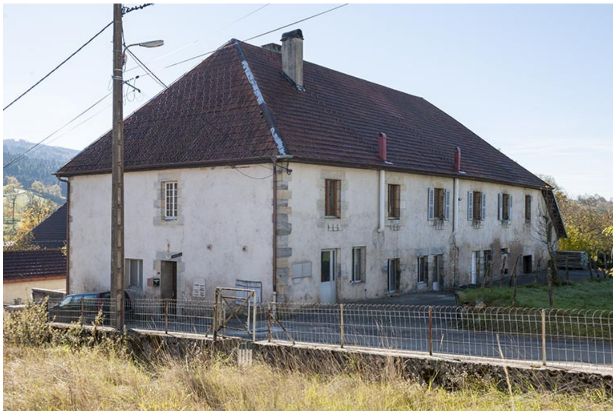
Vue de trois quarts arrière.