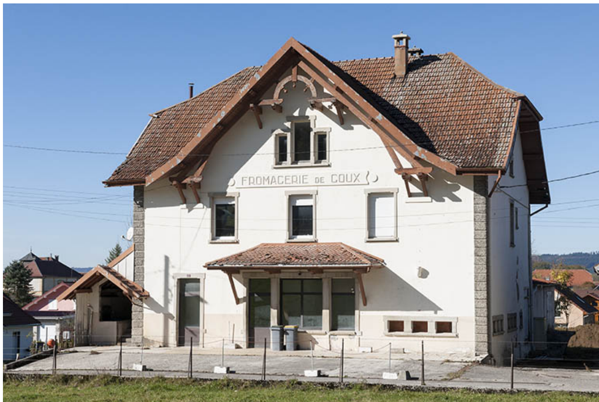
Vue de trois quarts droite.