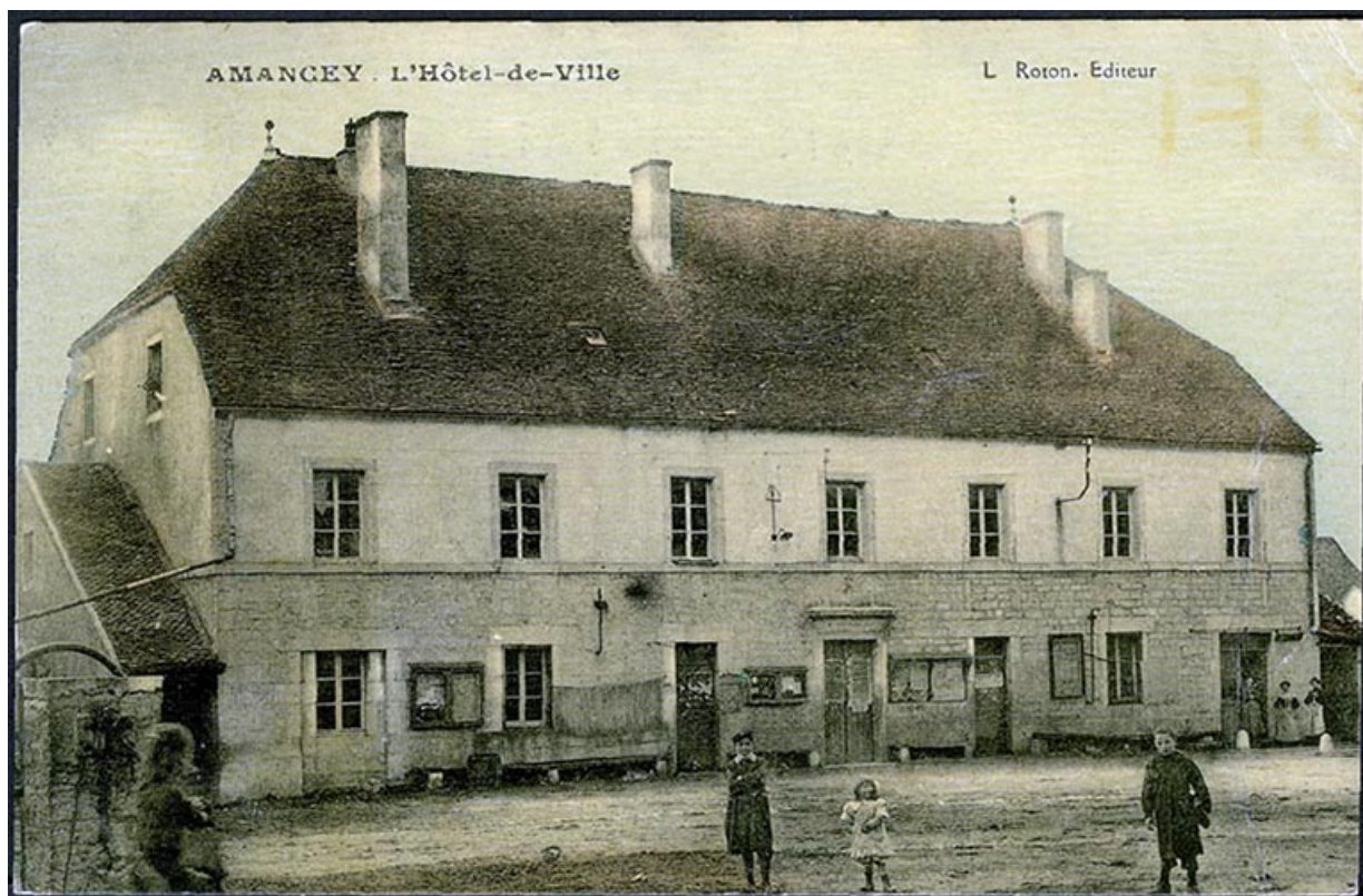
Amancey - L'hôtel de ville, carte postale, s.d. [fin 19e ou début 20e siècle]. 25, Amancey, 1 place de la Mairie