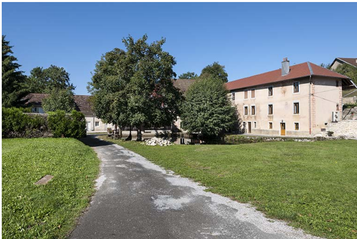
Vue d'ensemble depuis l'est.