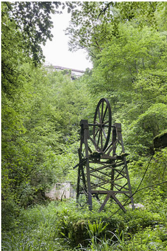
Système de transmission par câble en fond de vallée.