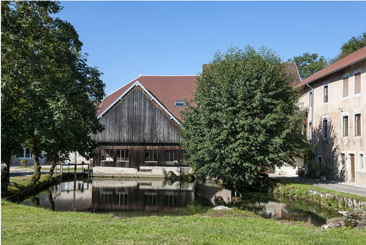
Atelier de scierie depuis le bassin de retenue, à l'est. 25, Éternoz, 4 rue du Moulin