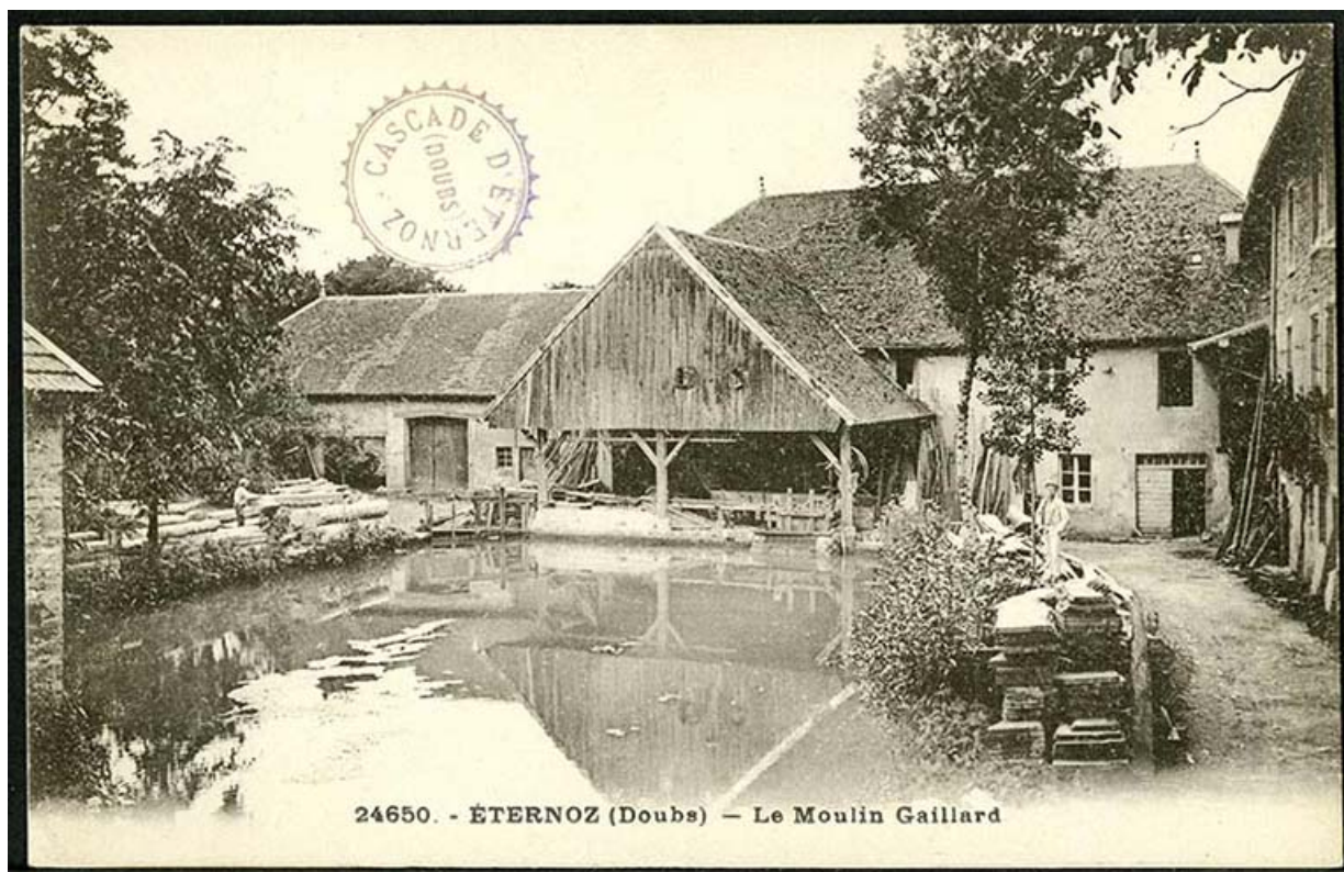
Le moulin Gaillard, carte postale, s.d. [fin 19e ou début 20e siècle]. 25, Éternoz, 4 rue du Moulin