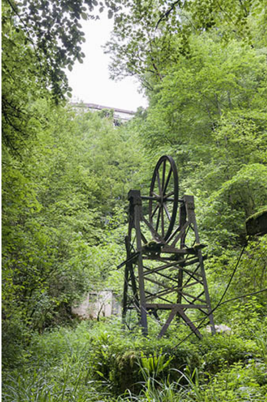
Système de transmission par câble en fond de vallée. 25, Éternoz, 4 rue du Moulin