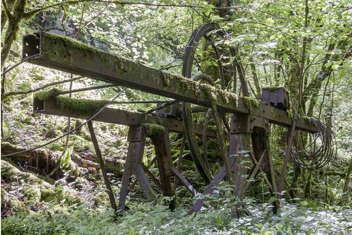
Support métallique (aval) de la transmission par câble.