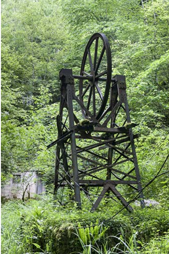
Support métallique (amont) de la transmission par câble. 25, Éternoz, 4 rue du Moulin