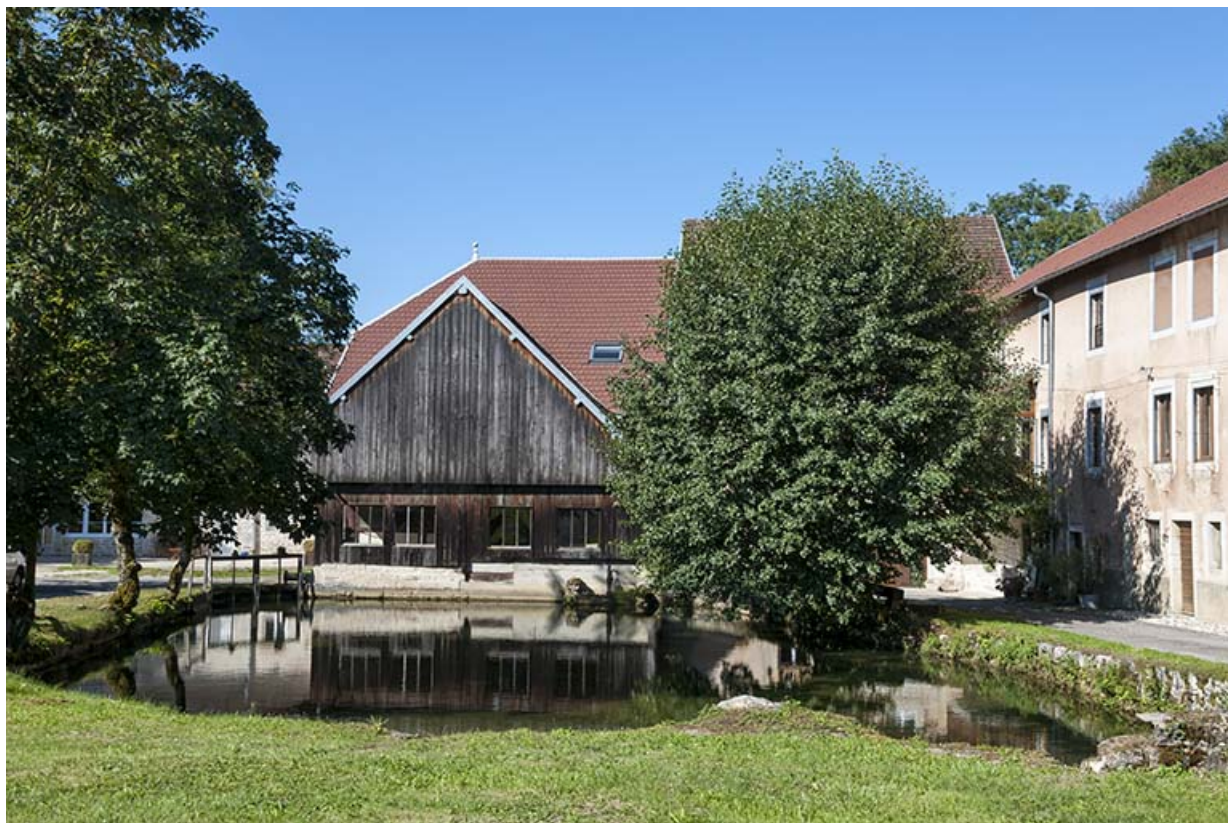
Atelier de scierie depuis le bassin de retenue, à l'est. 25, Éternoz, 4 rue du Moulin