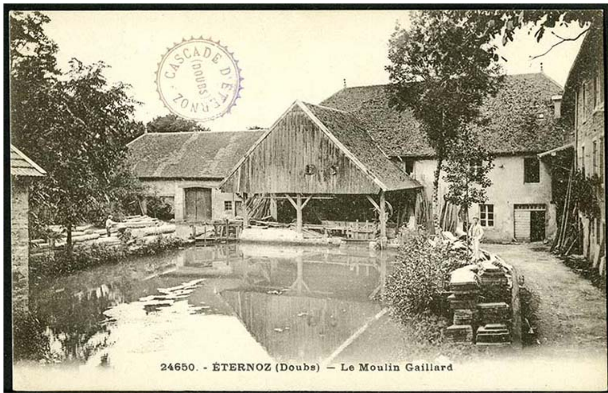
Le moulin Gaillard, carte postale, s.d. [fin 19e ou début 20e siècle]. 25, Éternoz, 4 rue du Moulin