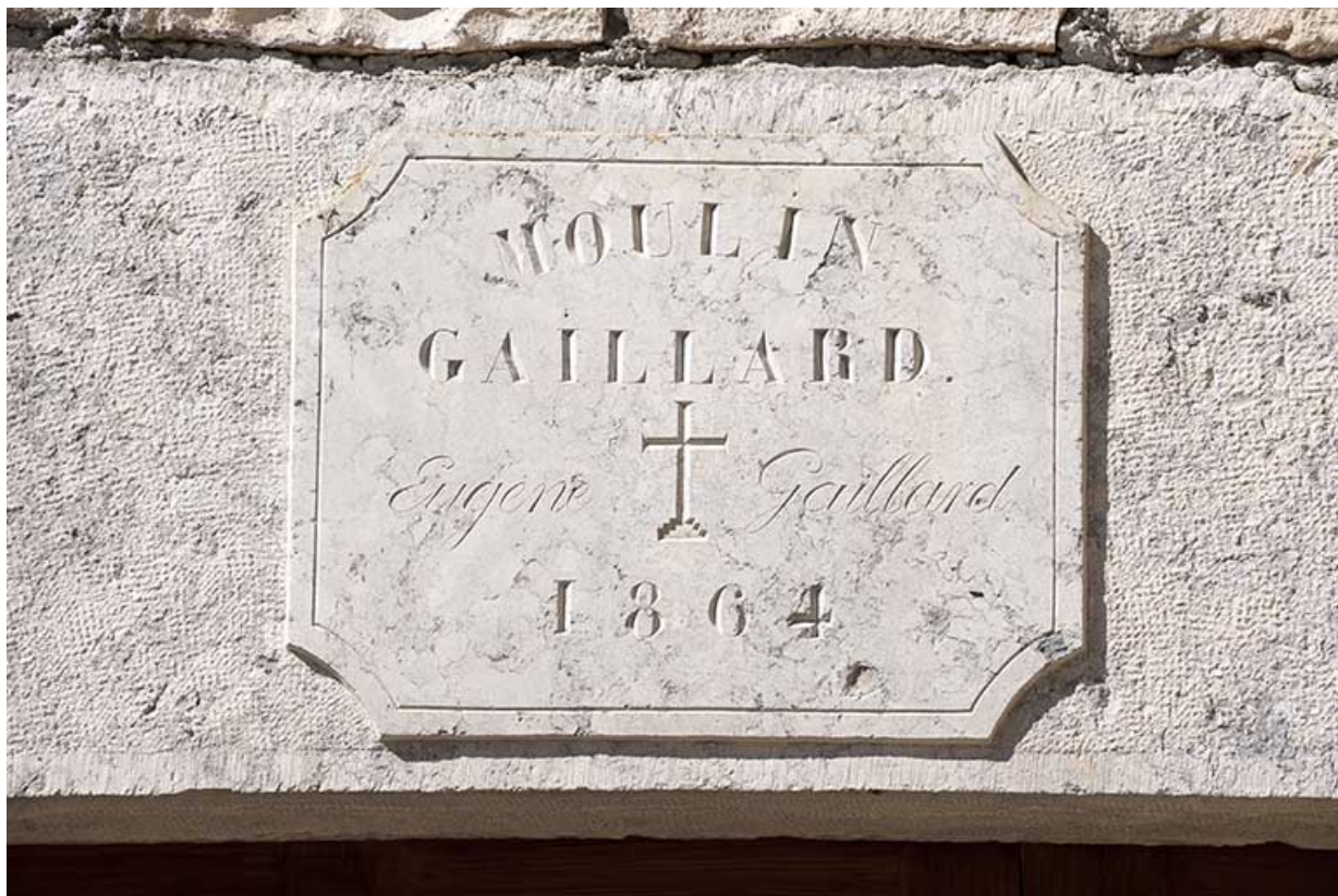
Linteau de porte du moulin. 25, Éternoz, 4 rue du Moulin