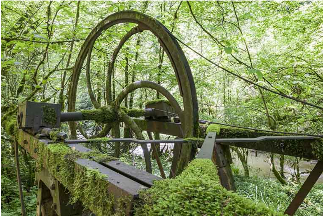
Poulie métallique à gorge du support aval.