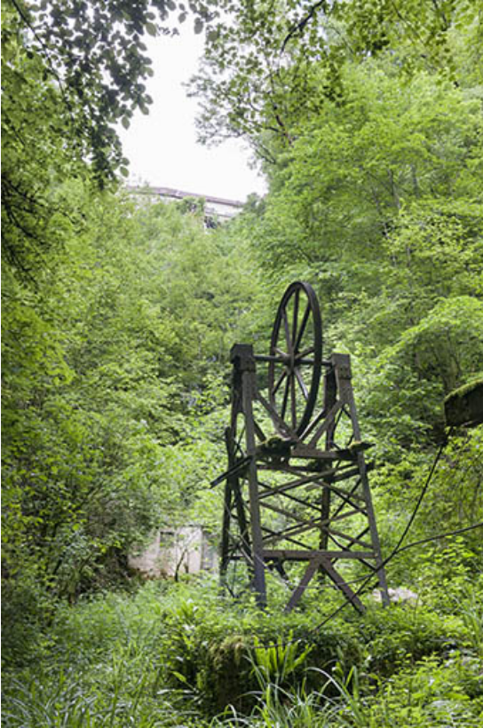
Système de transmission par câble en fond de vallée. 25, Éternoz, 4 rue du Moulin