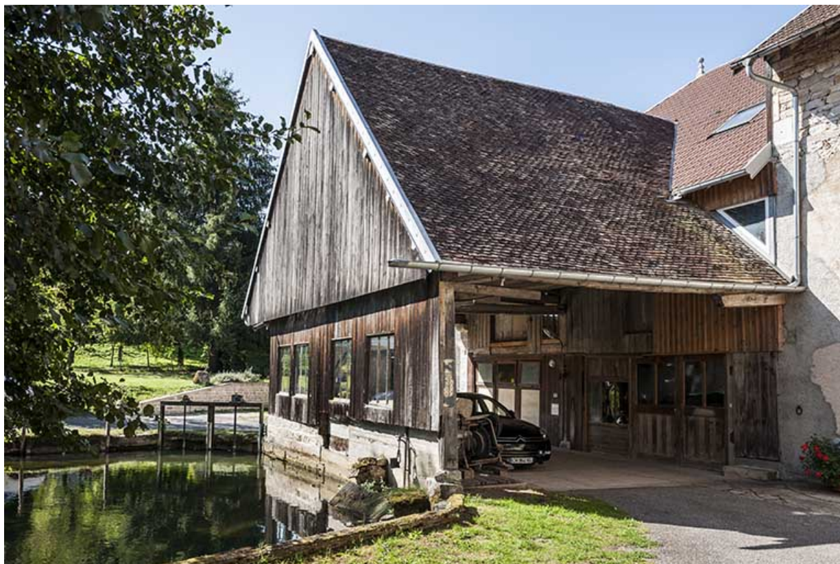
Prise d'eau de la retenue et passage couvert de la scierie.