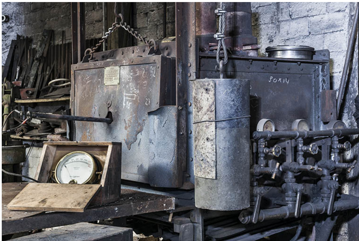
Four à fuel de marque Tranchant (Paris). Au premier plan : pyromètre et sa sonde. 25, Éternoz, 39 Grand Rue