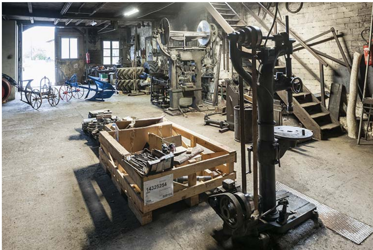
Vue d'ensemble depuis l'ouest.