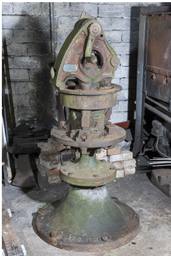
Machine Vernet (Dijon) à poinçonner et à découper. 25, Éternoz, 39 Grand Rue