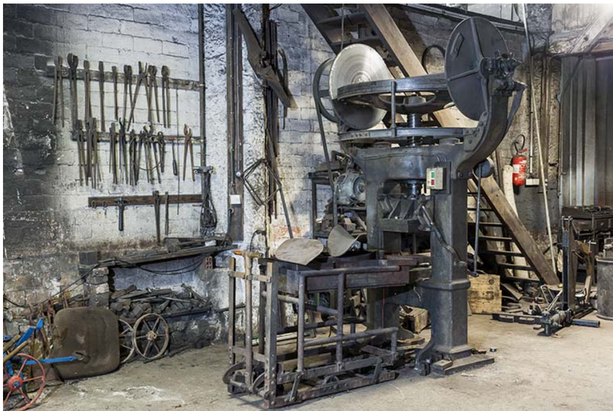
Balancier à friction (emboutissage des soles). 25, Éternoz, 39 Grand Rue