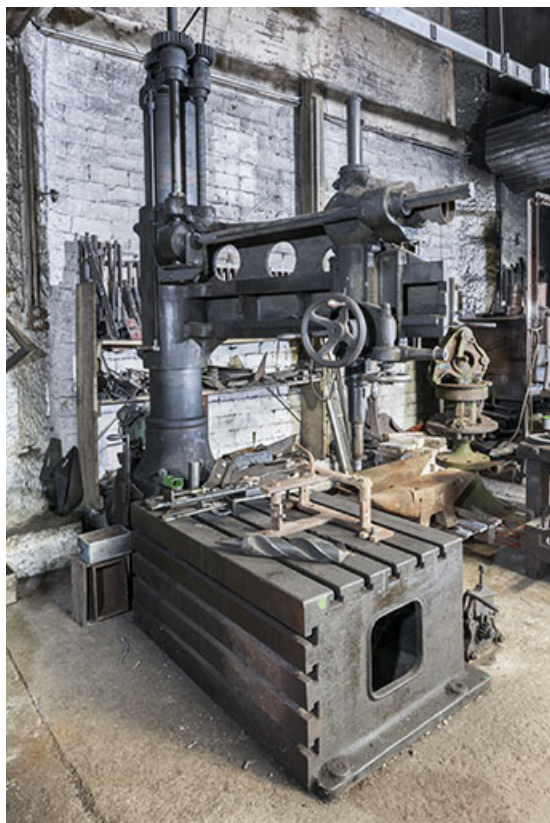
Machine à aléser (perceuse radiale).