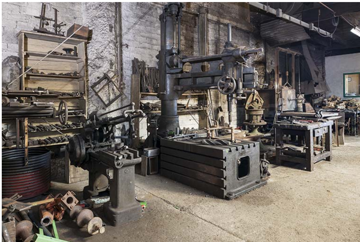
Machines installées contre le mur nord. Vue depuis le sud-ouest. 25, Éternoz, 39 Grand Rue