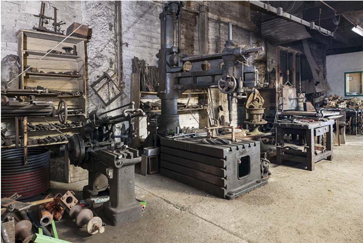
Machines installées contre le mur nord. Vue depuis le sud-ouest. 25, Éternoz, 39 Grand Rue