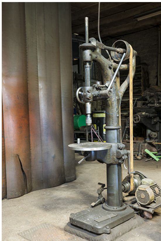
Perceuse à colonne Rego-AA-Jones 25, Éternoz, 39 Grand Rue