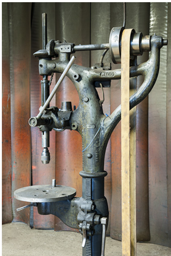
Détail de la perceuse à colonne.