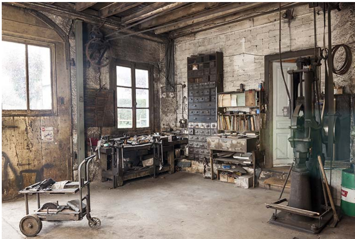
Entrée de l'atelier.