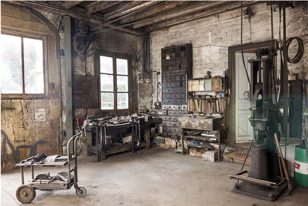
Entrée de l'atelier.