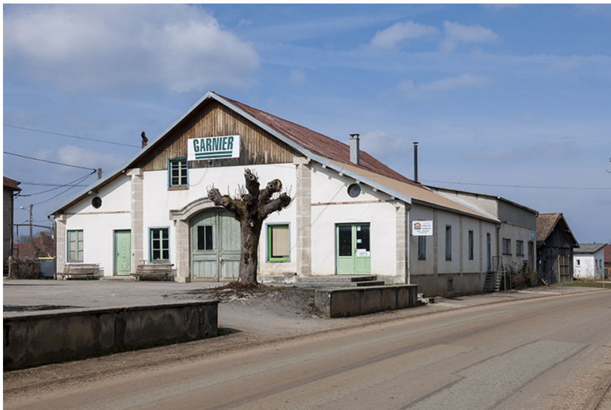
Vue de trois quarts droite.