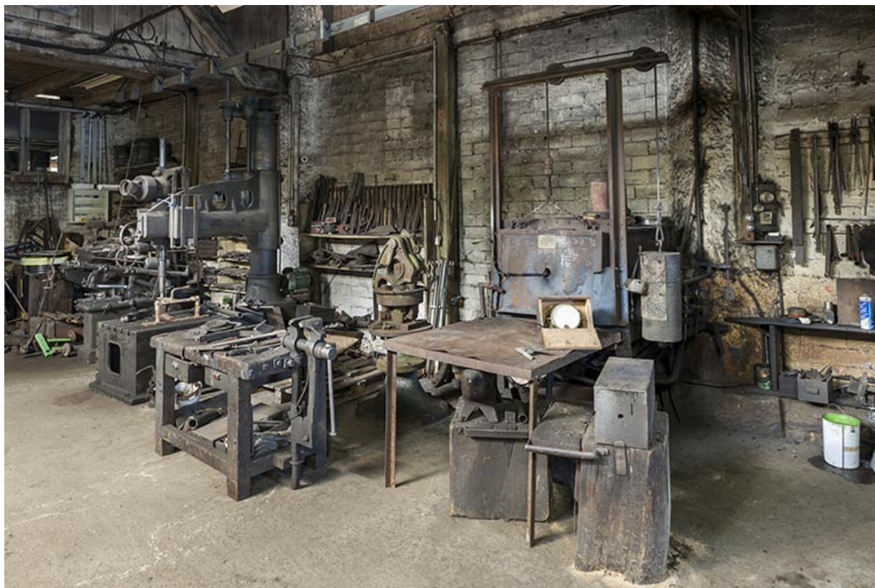
Machines installées contre le mur nord. Vue depuis le sud-est. 25, Éternoz, 39 Grand Rue