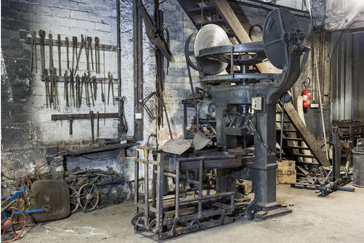
Balancier à friction (emboutissage des socs).