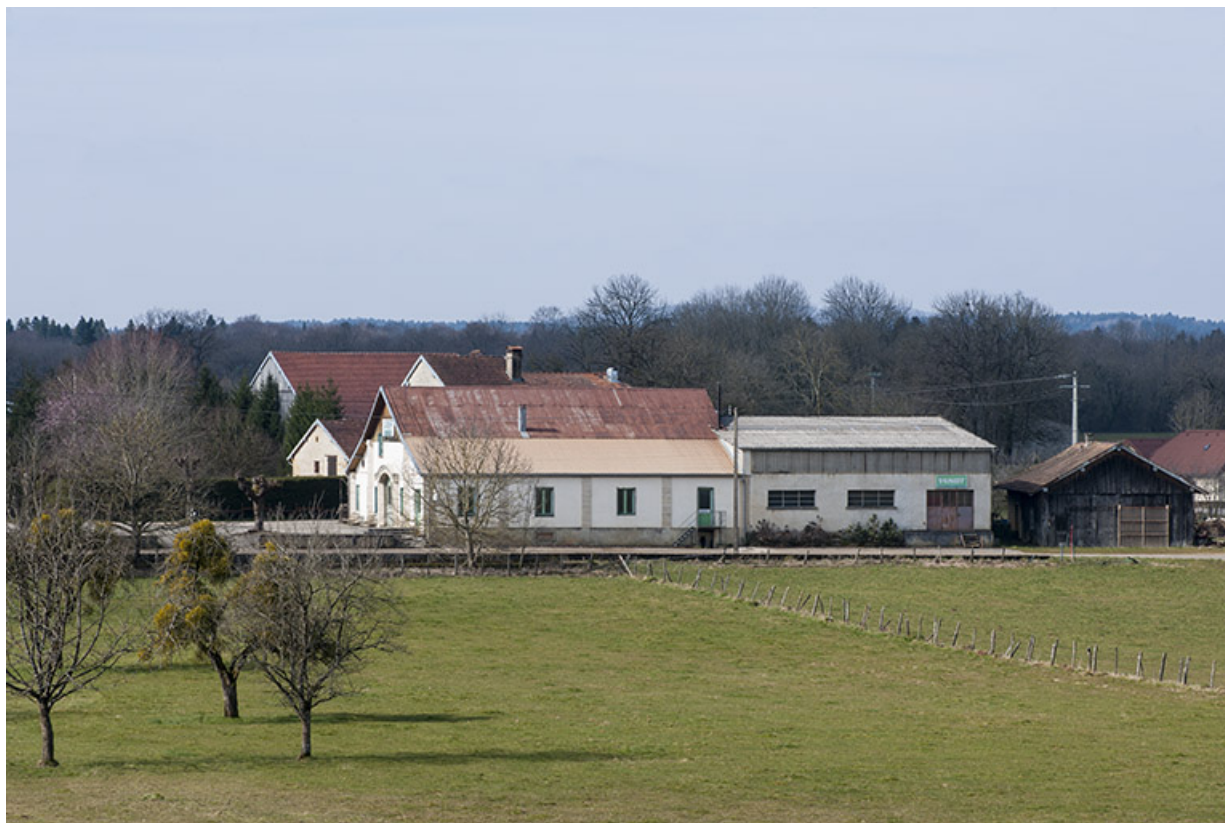
Vue d'ensemble depuis le nord-est.