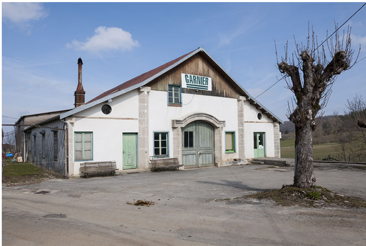
Vue de trois quarts gauche.