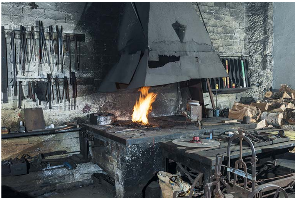
Forge. Vue d'ensemble.