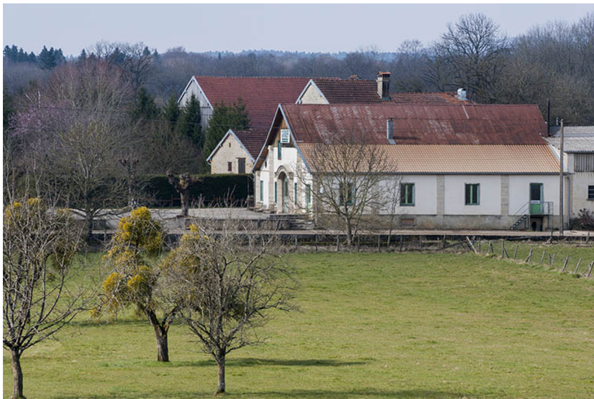
Façade nord de l'atelier de fabrication.