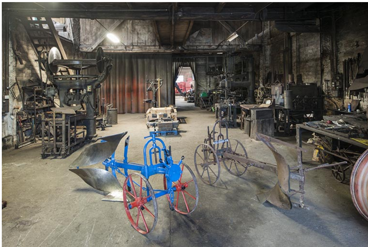
Vue d'ensemble depuis l'entrée.