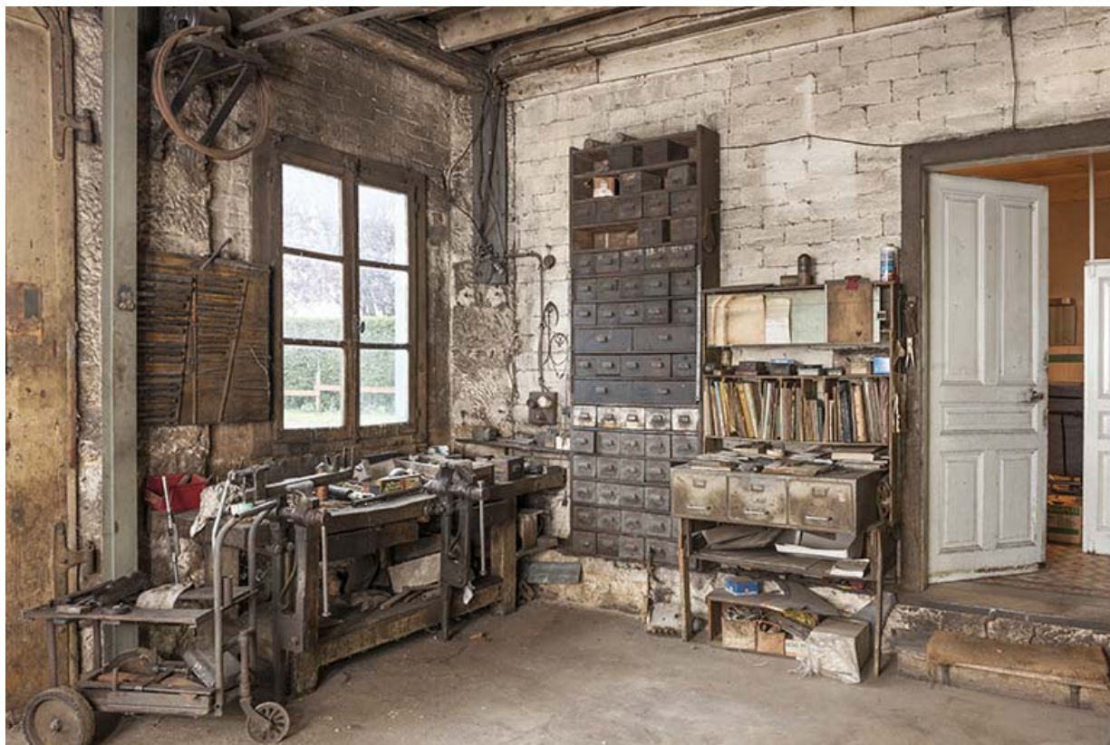
Entrée de l'atelier. Accès au bureau.