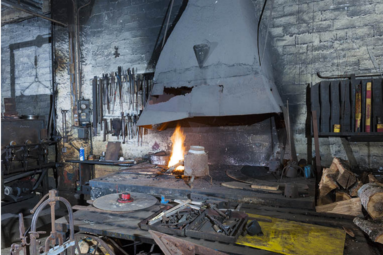
Forge. Vue de trois quarts.