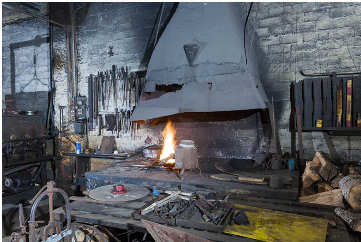
Forge. Vue de trois quarts. 25, Éternoz, 39 Grand Rue