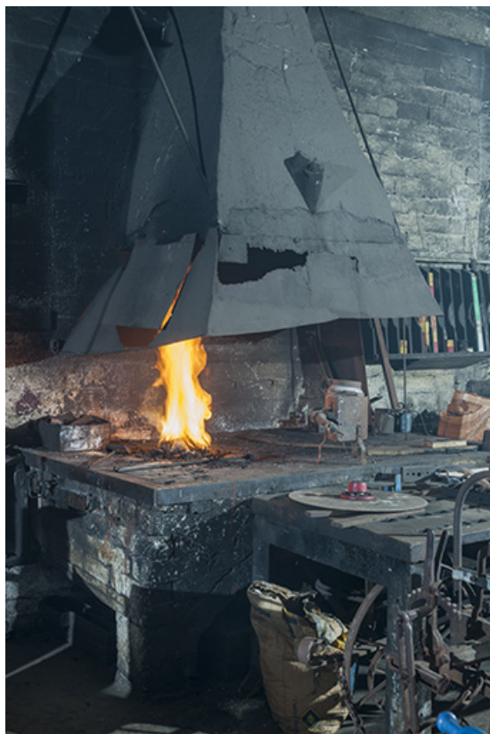
Forge : le foyer et le manteau en tôle. 25, Éternoz, 39 Grand Rue