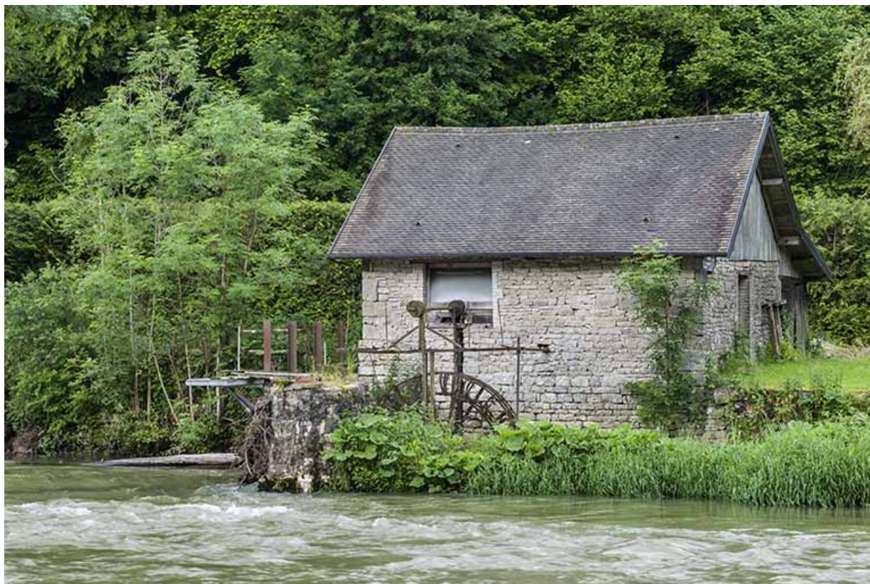
Façade est du bâtiment d'eau, et roue hydraulique pendante.