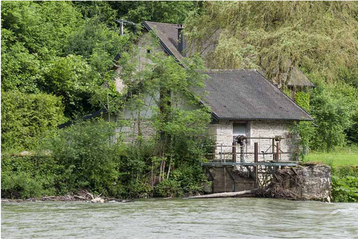
Vue d'ensemble depuis le sud-est.