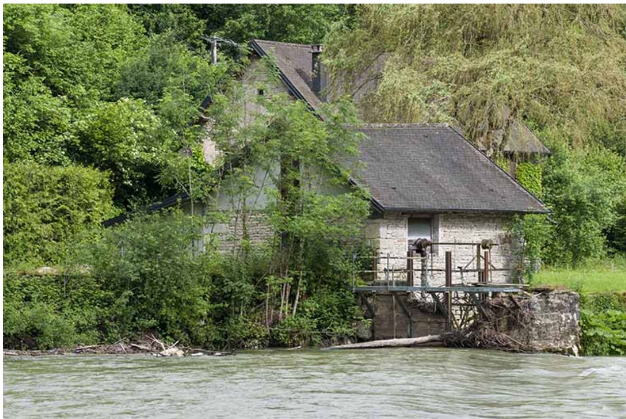
Vue d'ensemble depuis le sud-est.