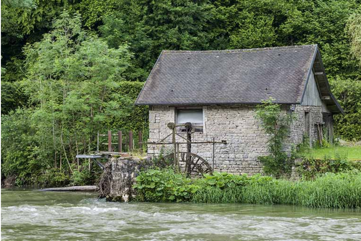
Façade est du bâtiment d'eau, et roue hydraulique pendante.