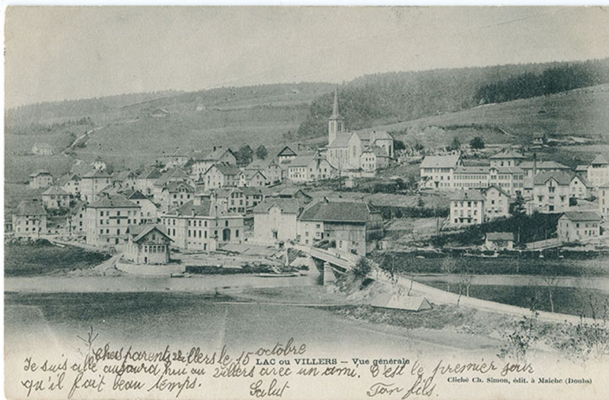
Lac ou Villers - Vue générale [le village, depuis l'est], 1902 ou 1903. Le bâtiment est visible au premier plan à droite. 25, Villers-le-Lac