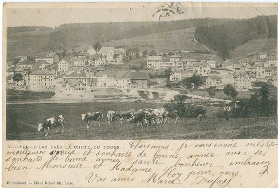
Villers-le-Lac près la chute du Doubs [vue d'ensemble du village depuis la rive droite, en amont du pont], 1898 ou 1899. Le bâtiment est visible dans la partie droite.

25, Villers-le-Lac, 3 et 5 rue de l'Horlogerie