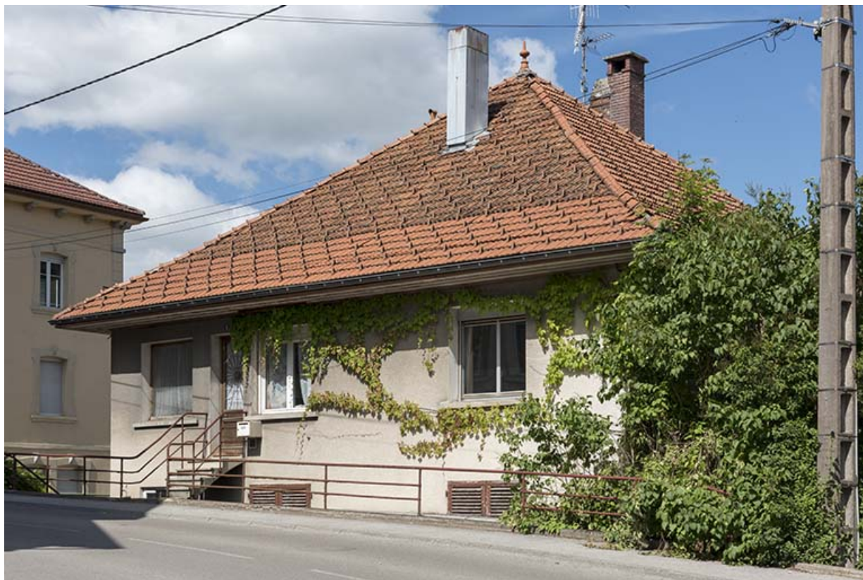
Façade postérieure (rue du Maréchal Foch). 25, Villers-le-Lac, 1 rue du Doubs