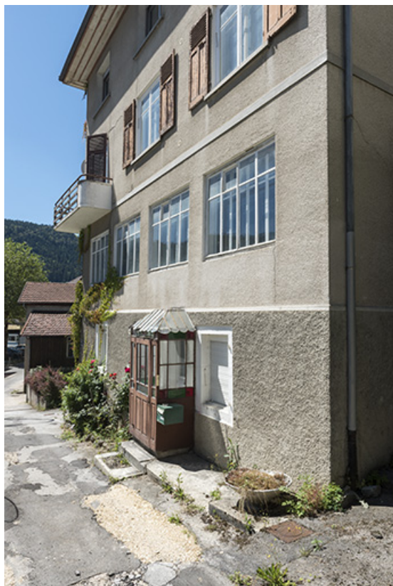
Façade antérieure (rue du Doubs), vue en enfilade : baies d'atelier. 25, Villers-le-Lac, 1 rue du Doubs