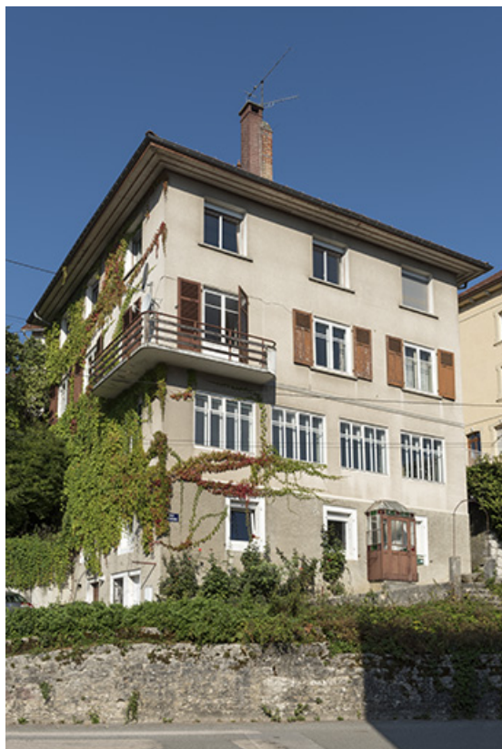
Façades antérieure (rue du Doubs) et latérale gauche.