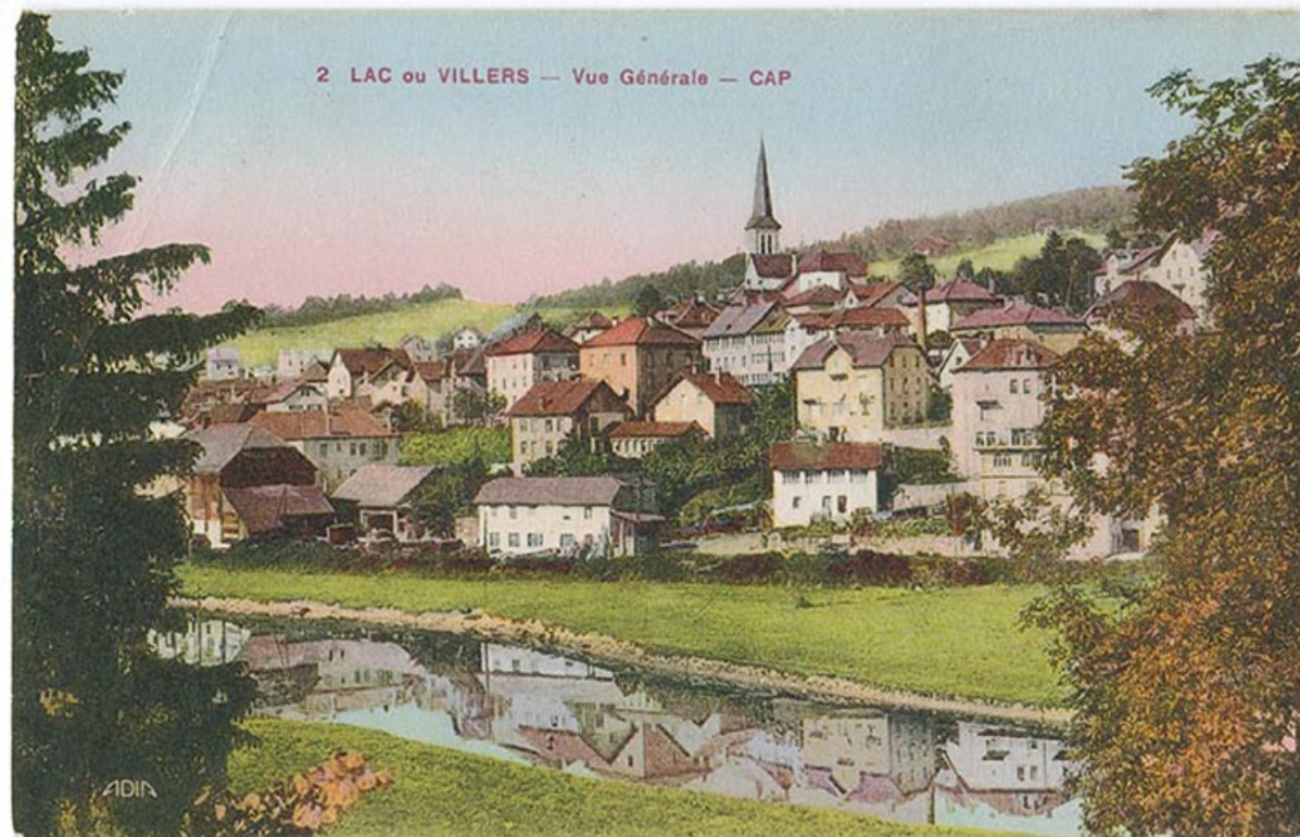
2 Lac ou Villers - Vue générale - CAP [le village vu de l'est], 2e quart 20e siècle [vers 1930]. 25, Villers-le-Lac