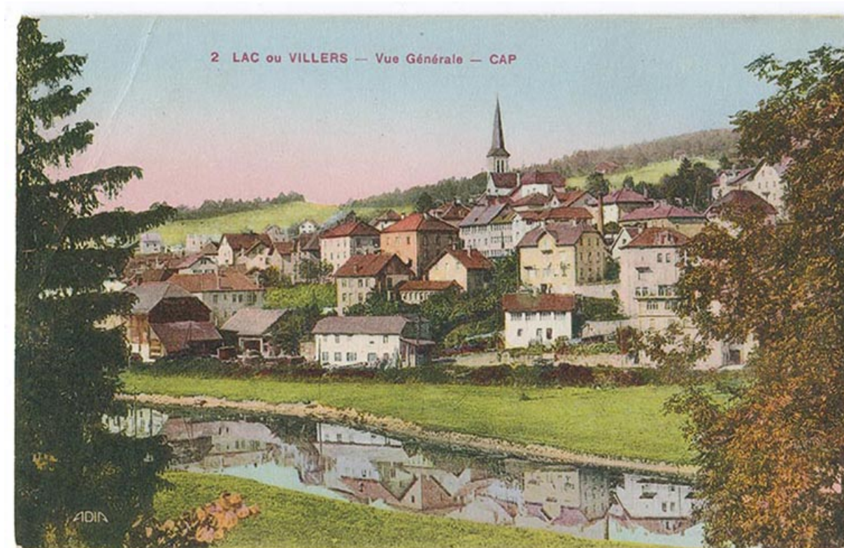
2 Lac ou Villers - Vue générale - CAP [le village vu de l'est], 2e quart 20e siècle [vers 1930].