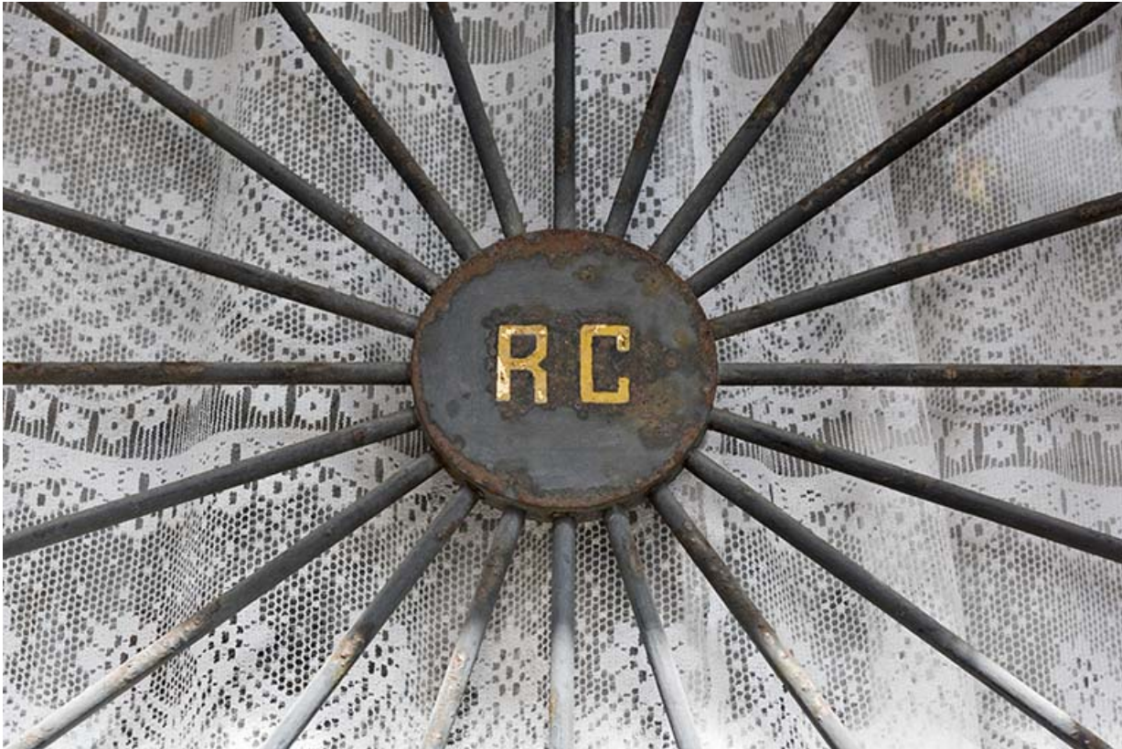
Façade postérieure (rue du Maréchal Foch) : initiales sur la grille de la porte d'entrée. 25, Villers-le-Lac, 1 rue du Doubs