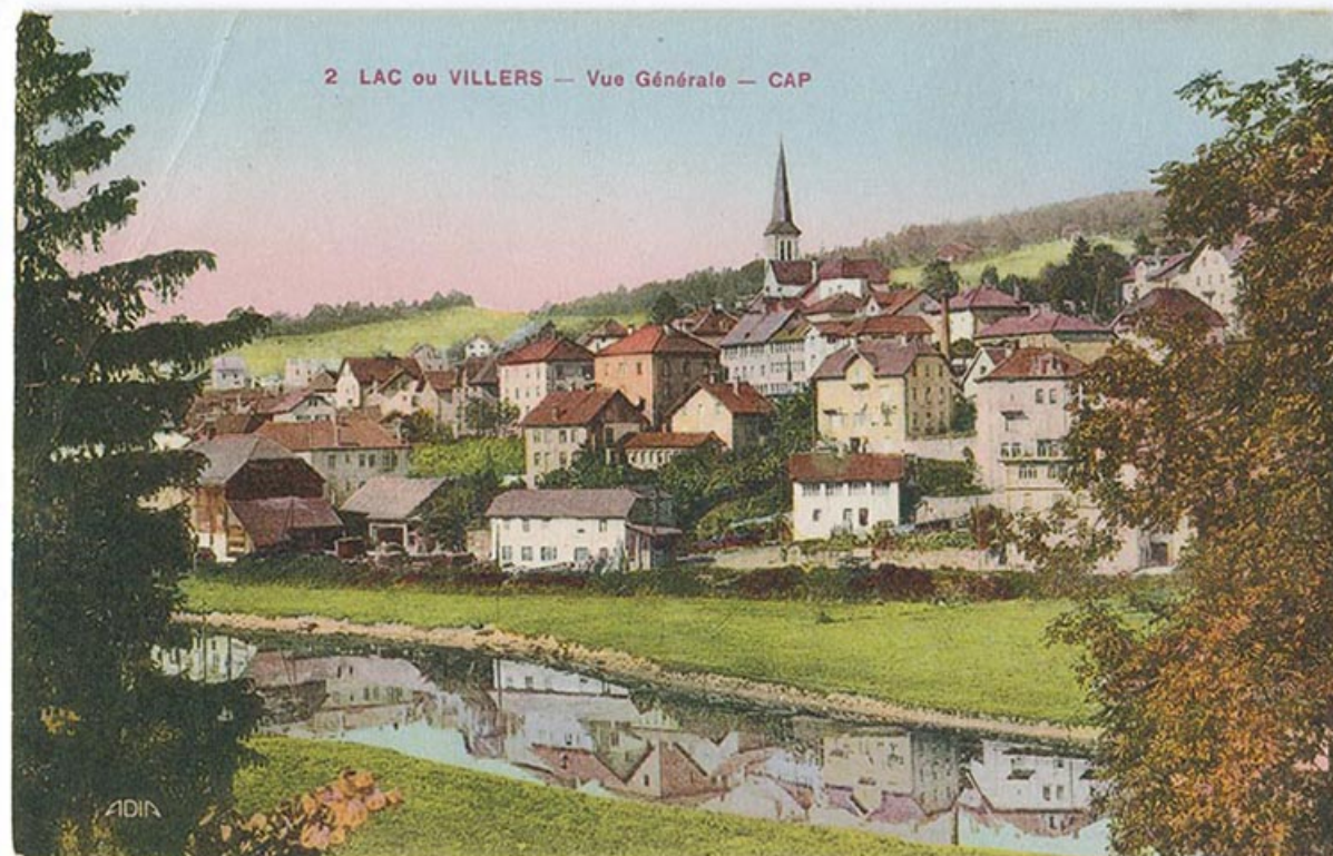
2 Lac ou Villers - Vue générale - CAP [le village vu de l'est], 2e quart 20e siècle [vers 1930]. 25, Villers-le-Lac