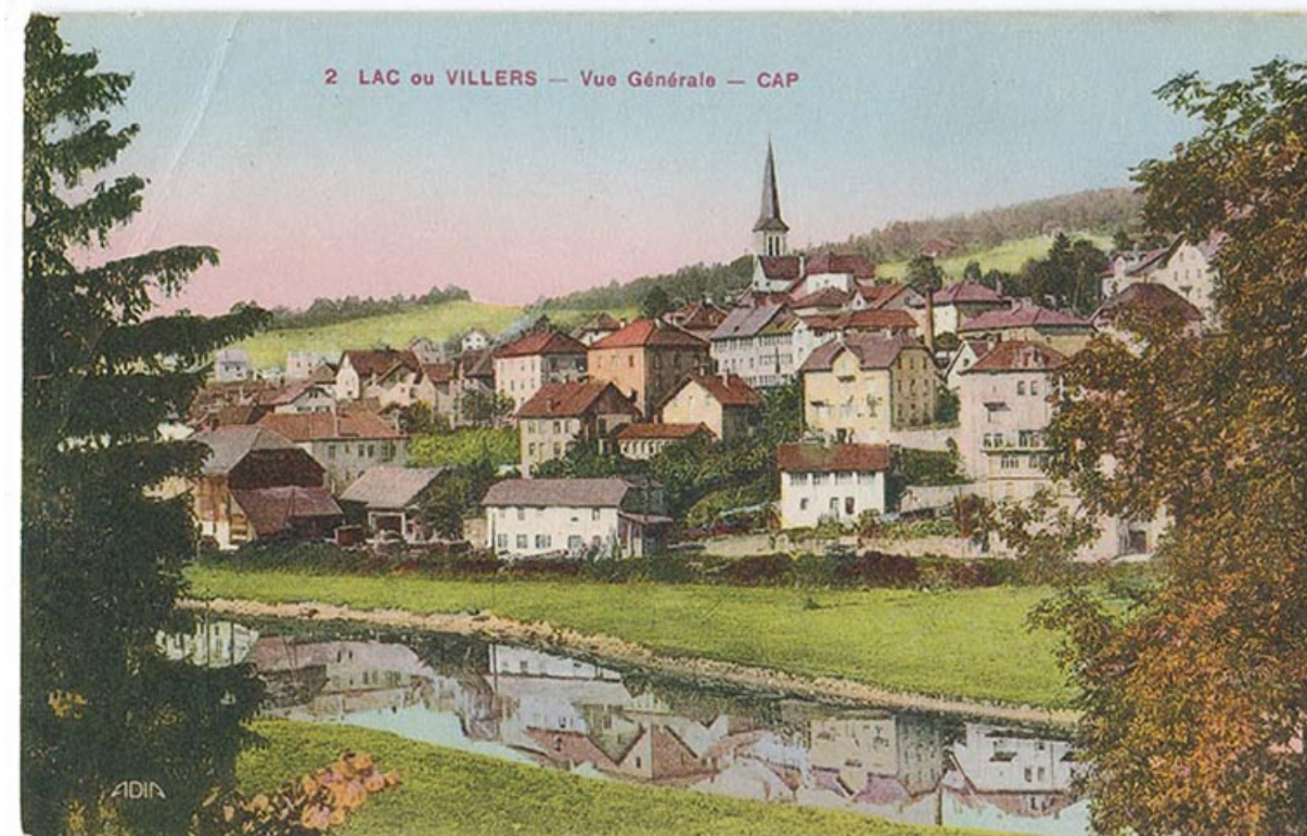
2 Lac ou Villers - Vue générale - CAP [le village vu de l'est], 2e quart 20e siècle [vers 1930]. 25, Villers-le-Lac