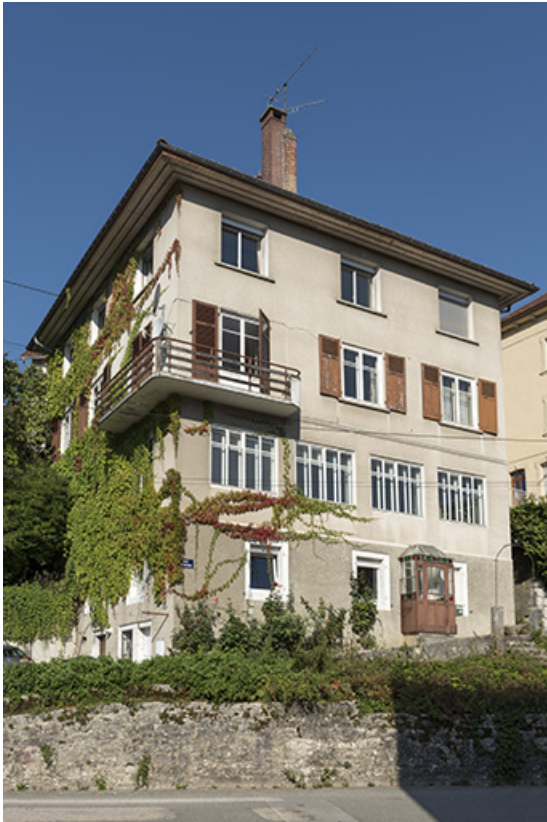
Façades antérieure (rue du Doubs) et latérale gauche.