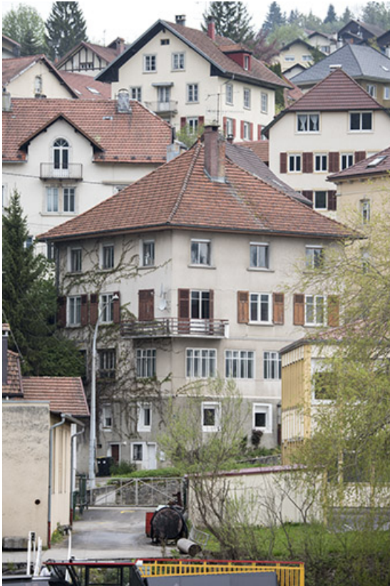
Vue d'ensemble, depuis le sud-est (façade sur la rue du Doubs).