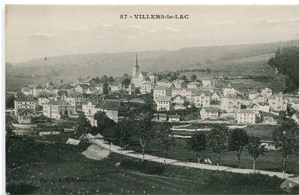
57 - Villers-le-Lac [vue d'ensemble, depuis l'est], 1er quart 20e siècle [entre 1908 et 1914 ?]. Les bâtiments sont visibles au centre, entre les Ets Lambert et Parrenin.

25, Villers-le-Lac, 2 place Maxime Cupillard