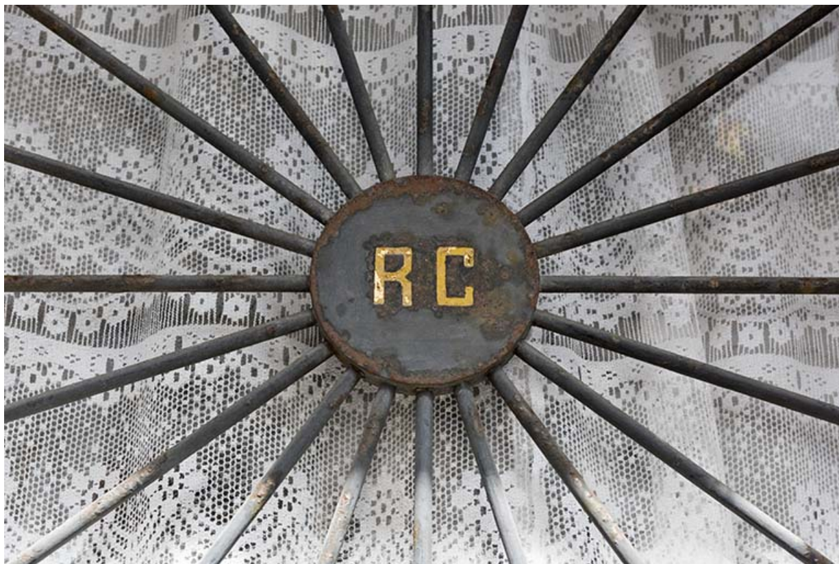
Façade postérieure (rue du Maréchal Foch) : initiales sur la grille de la porte d'entrée. 25, Villers-le-Lac, 1 rue du Doubs