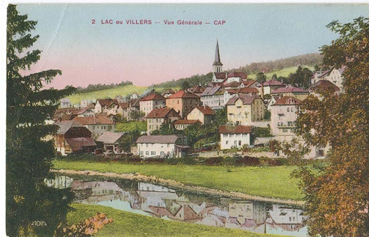
2 Lac ou Villers - Vue générale - CAP [le village vu de l'est], 2e quart 20e siècle [vers 1930]. 25, Villers-le-Lac