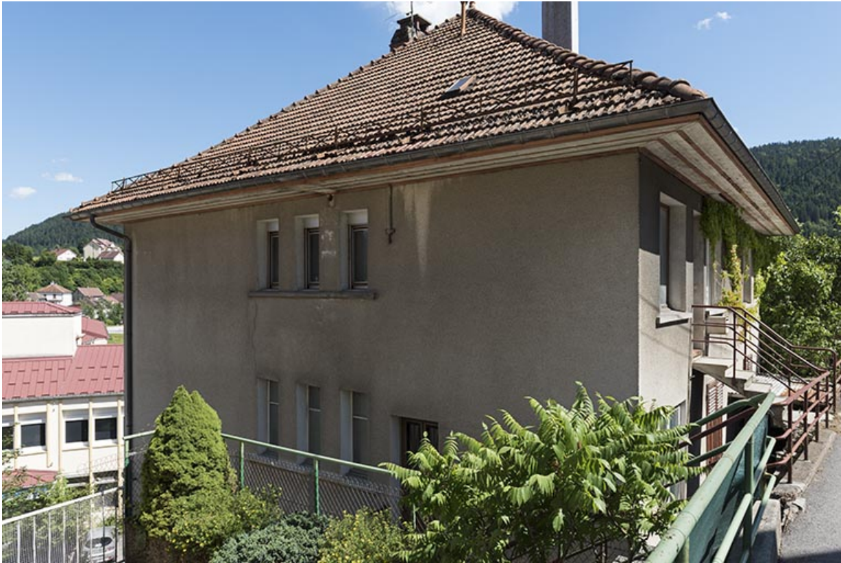
Façade latérale droite, de trois quarts.