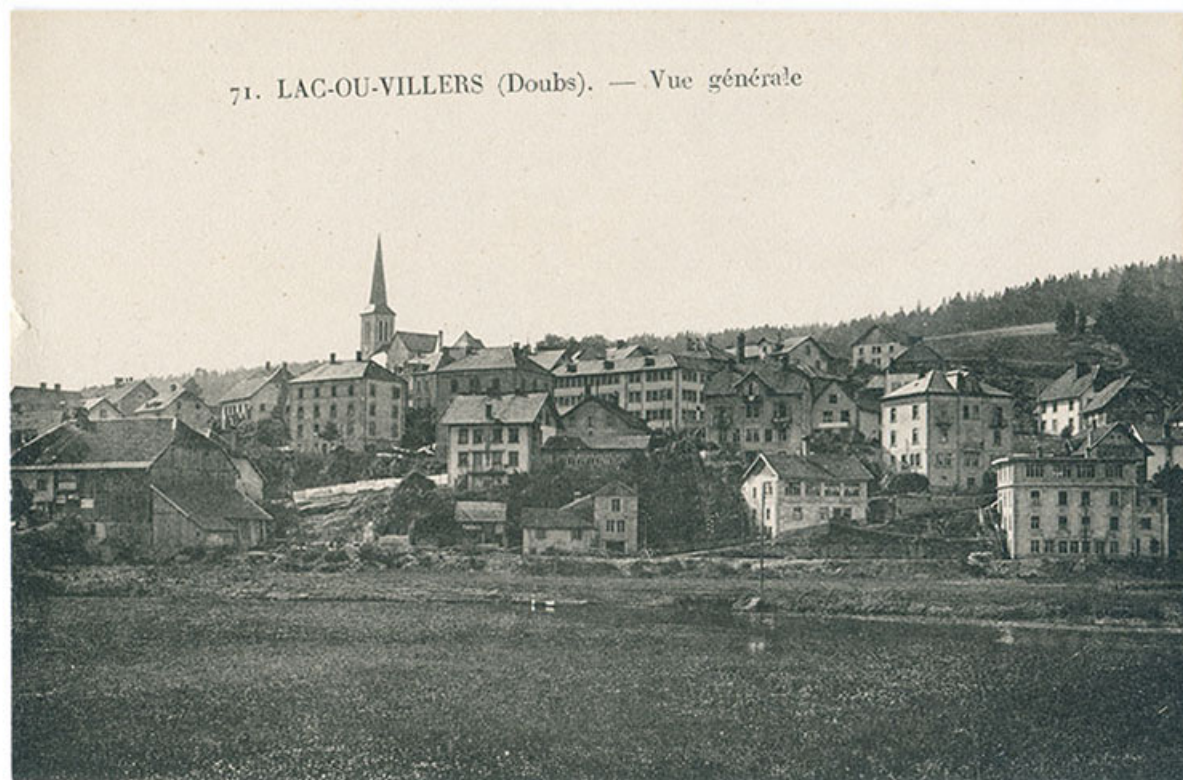
71. Lac-ou-Villers (Doubs). - Vue générale [le quartier des rues du Lac et du Doubs, depuis l'est], décennie 1930. 25, Villers-le-Lac, 3 et 4 rue du Lac