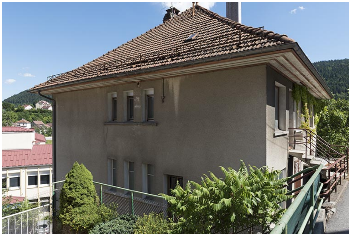
Façade latérale droite, de trois quarts.