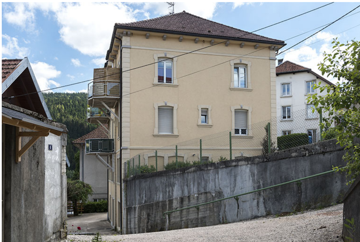
Façade latérale gauche, de trois quarts gauche, et rue du Doubs. 25, Villers-le-Lac, 10 rue du Maréchal Foch