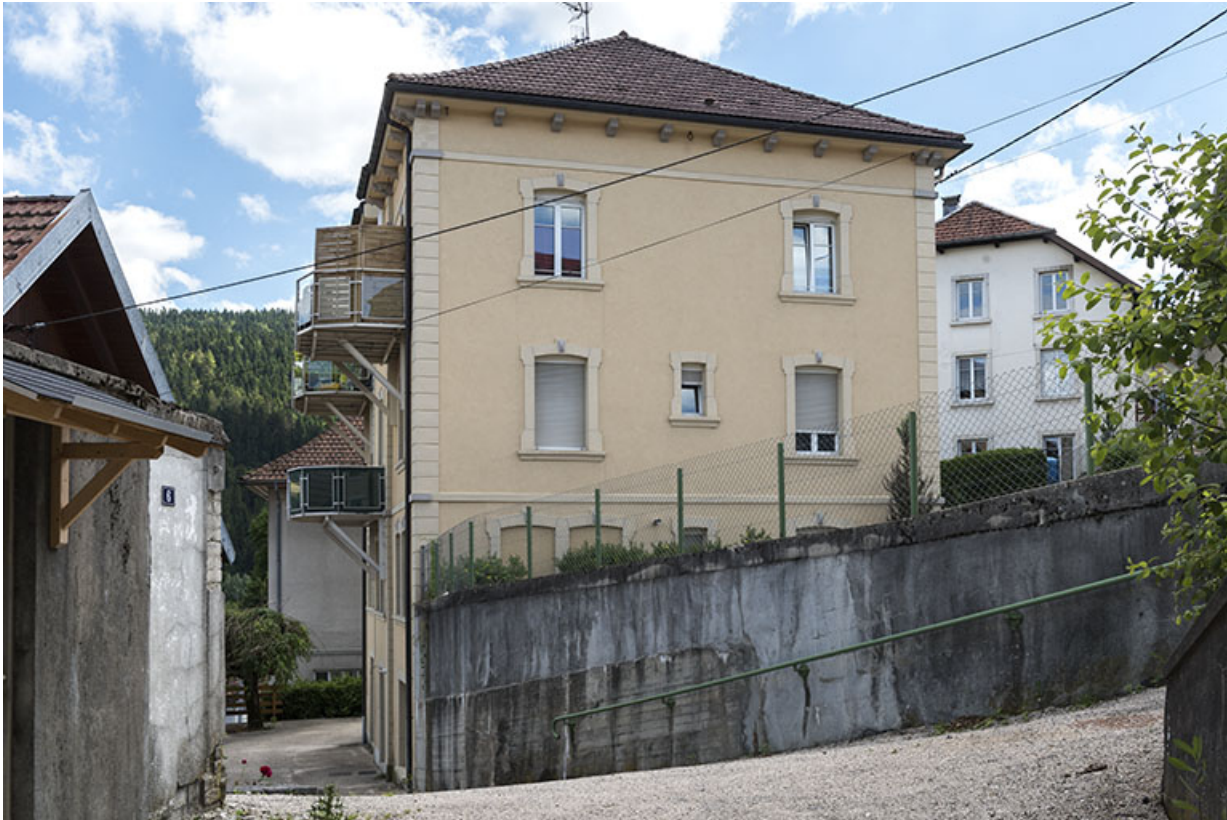
Façade latérale gauche, de trois quarts gauche, et rue du Doubs.

25, Villers-le-Lac, 10 rue du Maréchal Foch