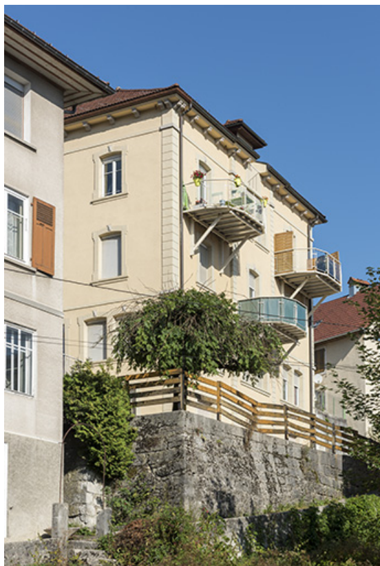
Façade postérieure, vue de trois quarts gauche et en contre-plongée. 25, Villers-le-Lac, 10 rue du Maréchal Foch