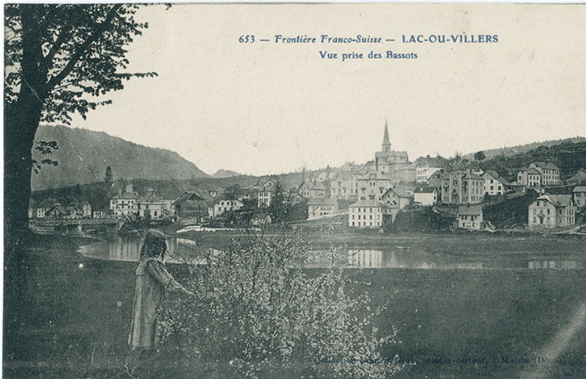
653 - Frontière franco-suisse - Lac-ou-Villers - Vue prise des Bassots, 1er quart 20e siècle [avant 1908].