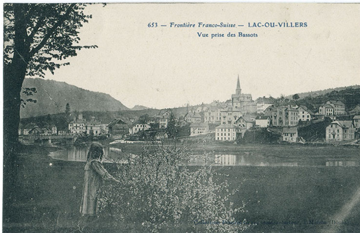
653 - Frontière franco-suisse - Lac-ou-Villers - Vue prise des Bassots, 1er quart 20e siècle [avant 1908].