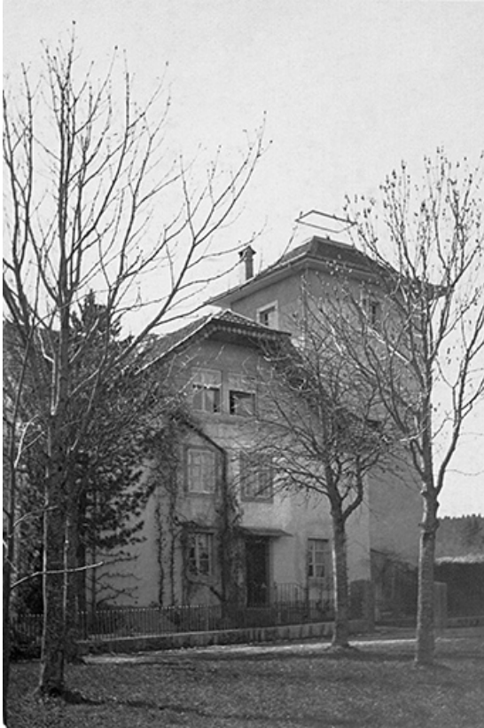
[La maison : façade latérale droite], 1936.

25, Villers-le-Lac rue des Vergers, lieudit : le Replenot