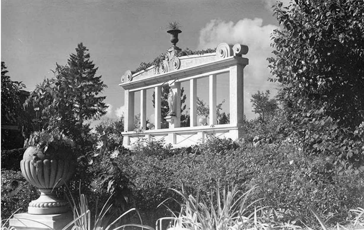
[Le monument à la Vierge], décennie 1950 [1957 ?]. 25, Villers-le-Lac rue des Vergers, lieudit : le Replenot