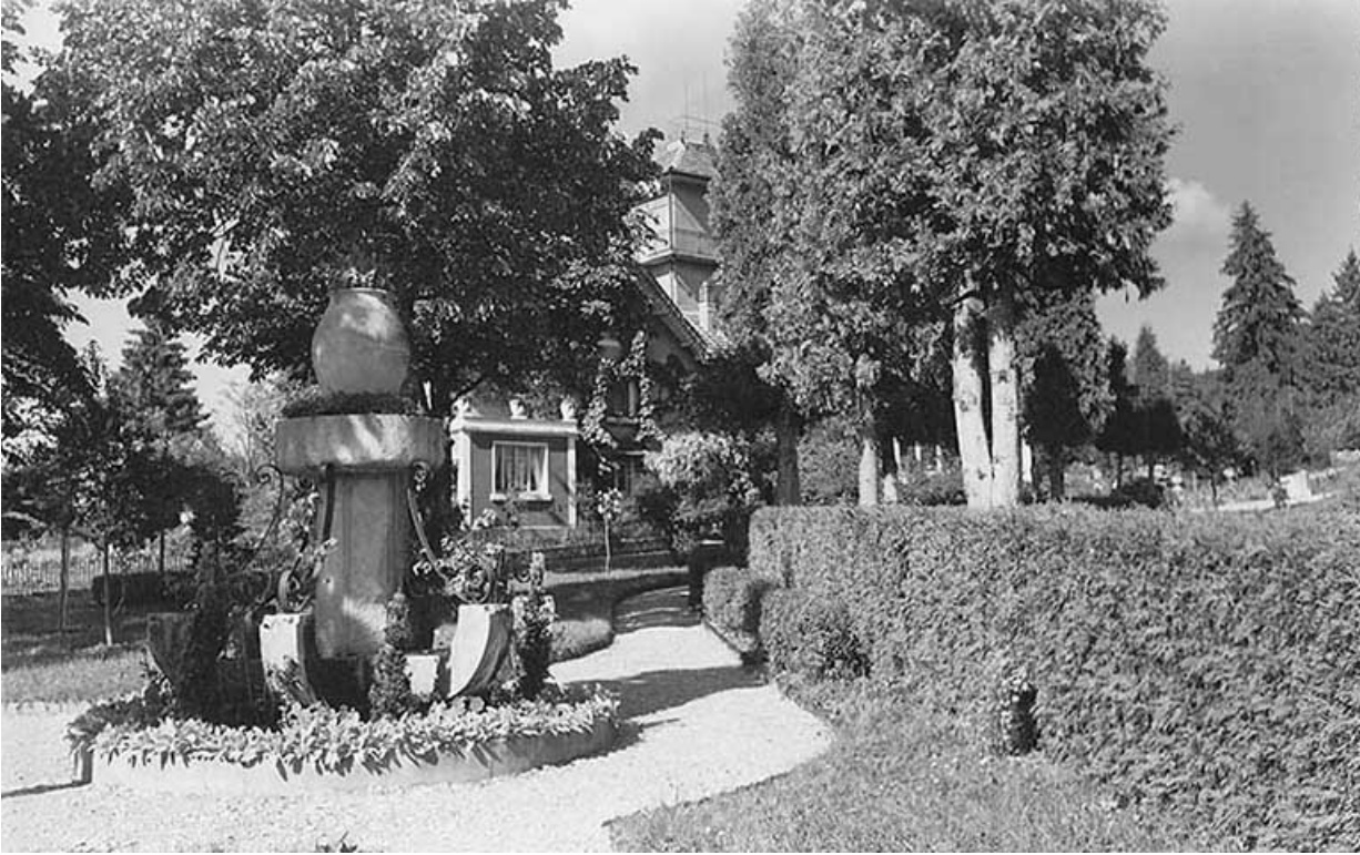
[Le parc et la maison], décennie 1950 [1957 ?]. 25, Villers-le-Lac rue des Vergers, lieu dit : le Replenot