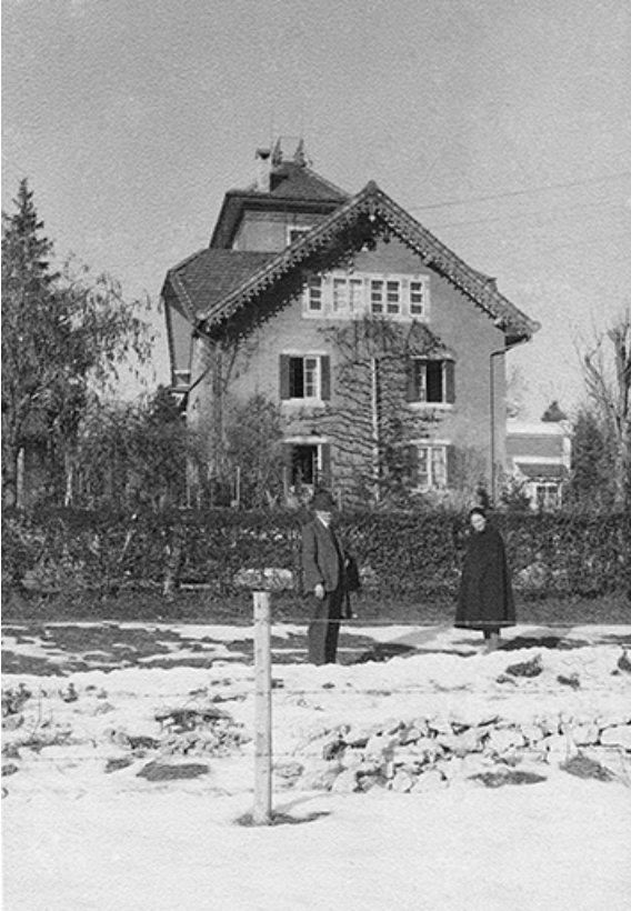
[La maison : façade latérale gauche], 1950.

25, Villers-le-Lac rue des Vergers, lieudit : le Replenet