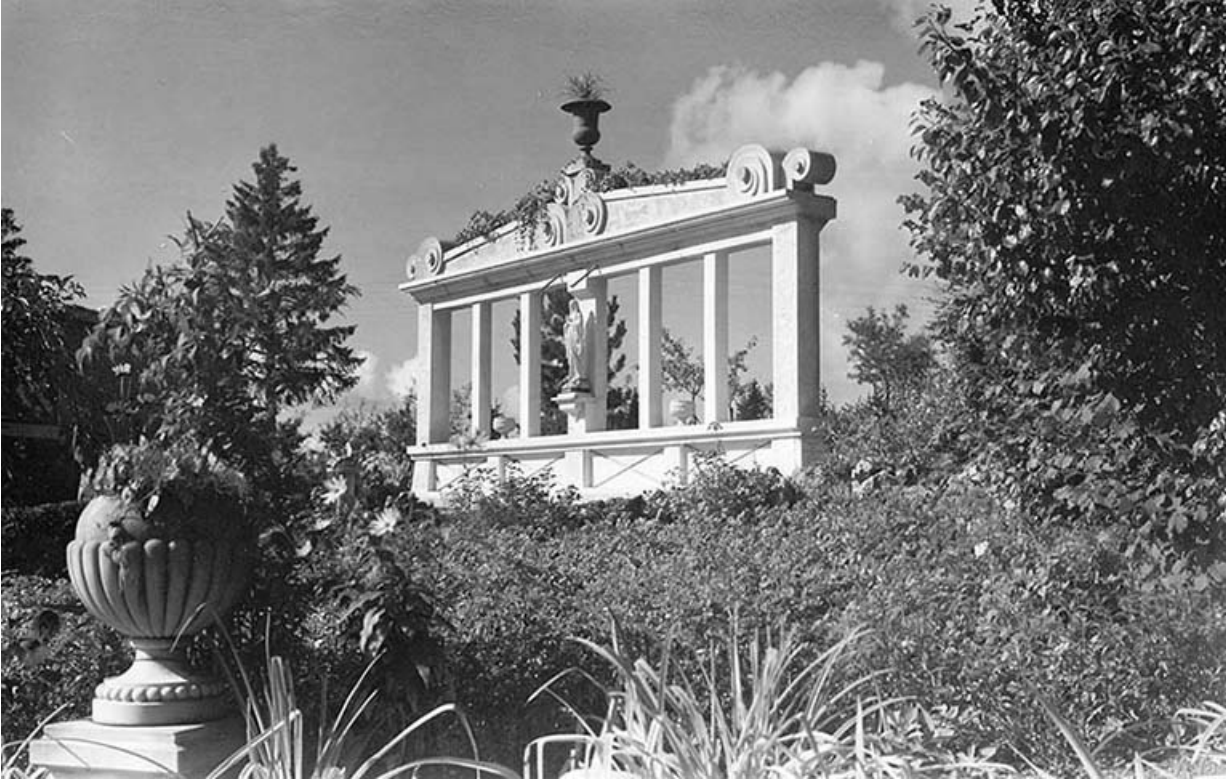
[Le monument à la Vierge], décennie 1950 [1957 ?]. 25, Villers-le-Lac rue des Vergers, lieudit : le Replenot