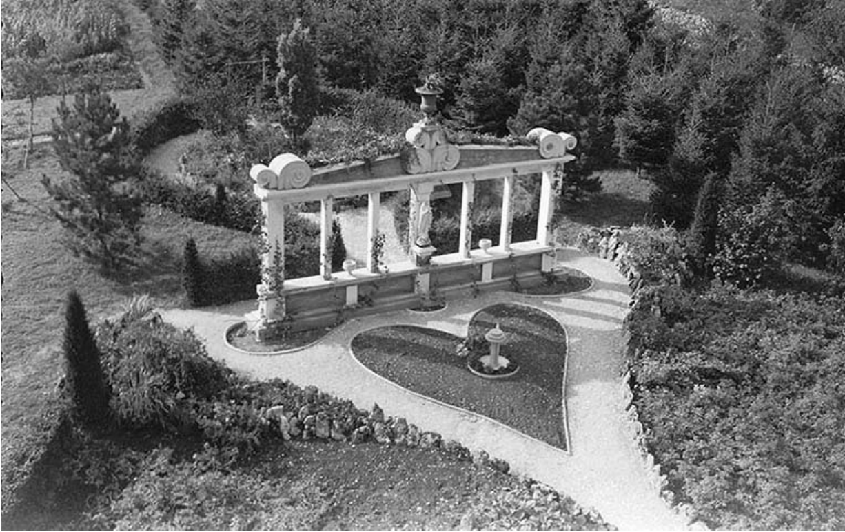
[Vue plongeante sur le monument à la Vierge], décennie 1950 [1957 ?].

25, Villers-le-Lac rue des Vergers, lieudit : le Replenot