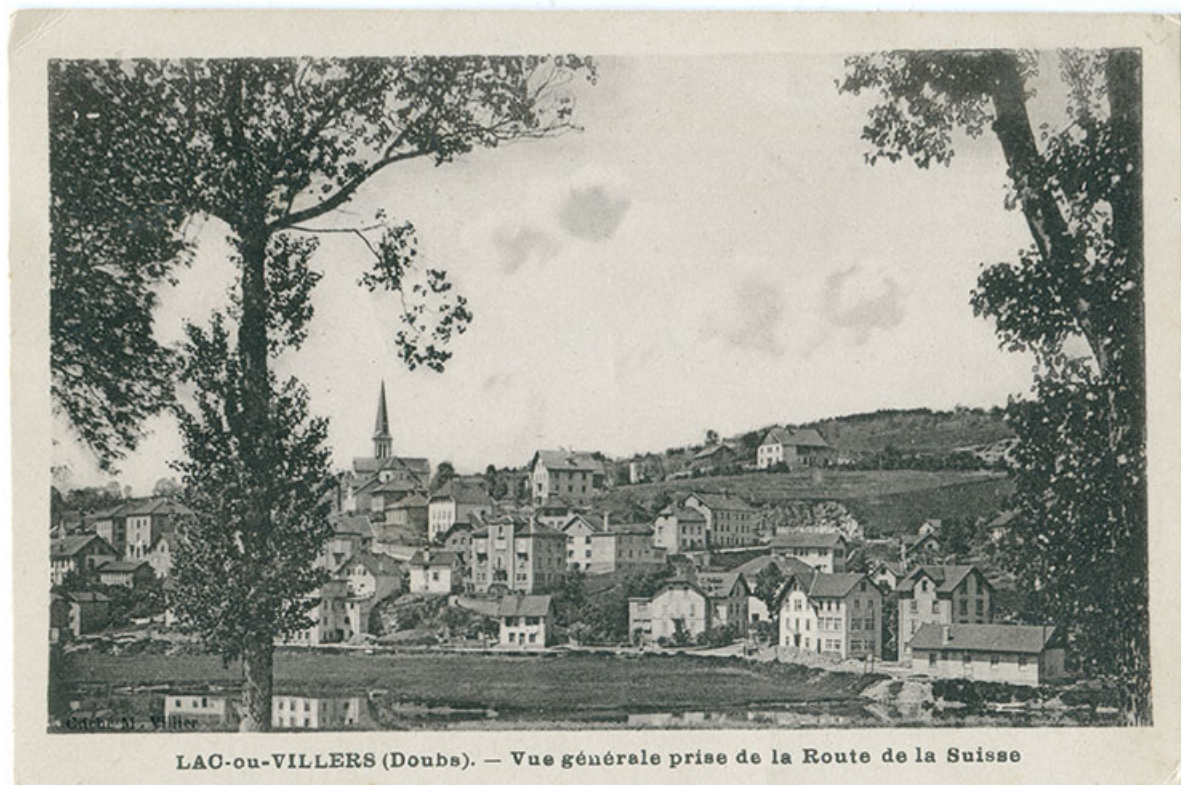
Lac-ou-Villers (Doubs). - Vue générale prise de la route de la Suisse [vue d'ensemble du village, depuis l'est], 2e quart 20e siècle [avant 1945].