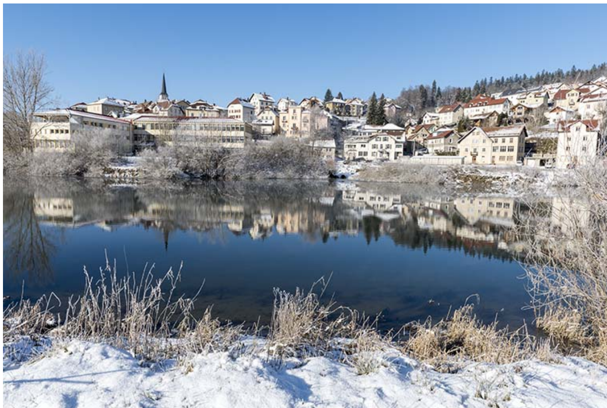
Site récent, vu du nord-est, en hiver. 25, Villers-le-Lac