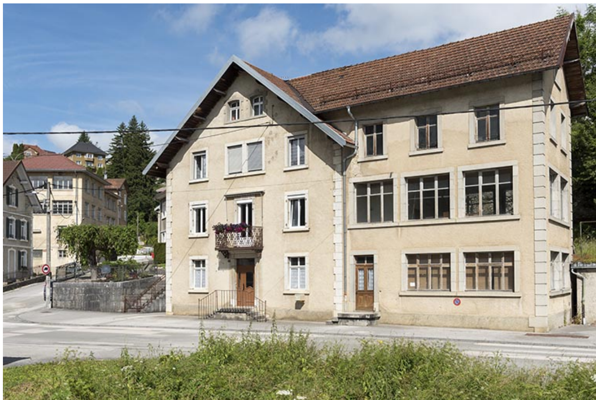
Maison et atelier oriental : façade antérieure, de trois quarts droite.