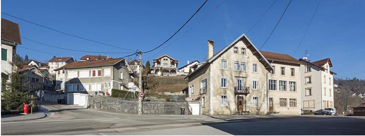
Usine de montres et d'ébauches de montre (1890, vers 1925, vers 1934) Victor Anguenot et Cie, aux 7 rue du Lac et 2 rue de la Perrière.