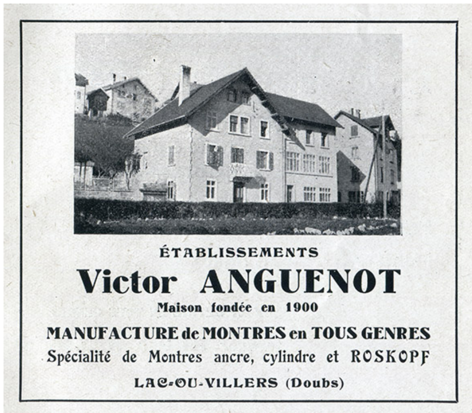
Etablissements Victor Anguenot [façade antérieure, de trois quarts gauche], 1943. 25, Villers-le-Lac, 7 rue du Lac