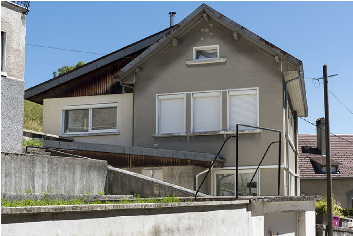
Atelier occidental : façade latérale gauche.