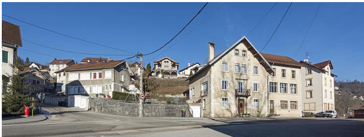
Usine de montres et d'ébauches de montre (1890, vers 1925, vers 1934) Victor Anguenot et Cie, aux 7 rue du Lac et 2 rue de la Perrière.