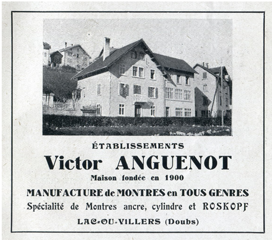
Etablissements Victor Anguenot [façade antérieure, de trois quarts gauche], 1943. 25, Villers-le-Lac, 7 rue du Lac

Etablissements Victor Anguenot [façade antérieure, de trois quarts gauche], photographie imprimée, s.n., s.d. [1943]. Publiée dans : Cent cinquantième de la fabrique d'horlogerie de Besançon. - S.I. [Besançon] : impr. Millot Frères, 1943, p. 39.