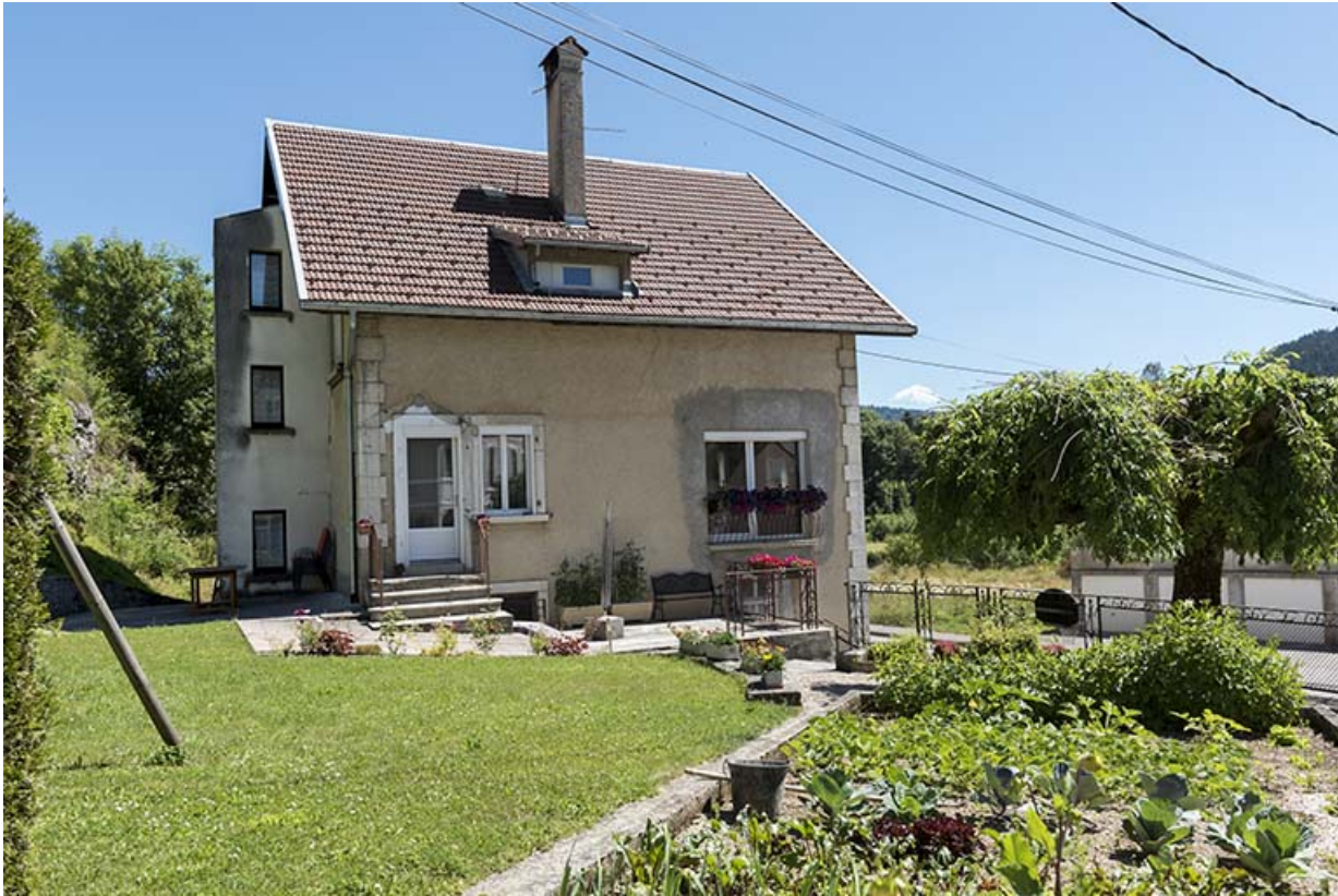
Maison : façade latérale gauche.