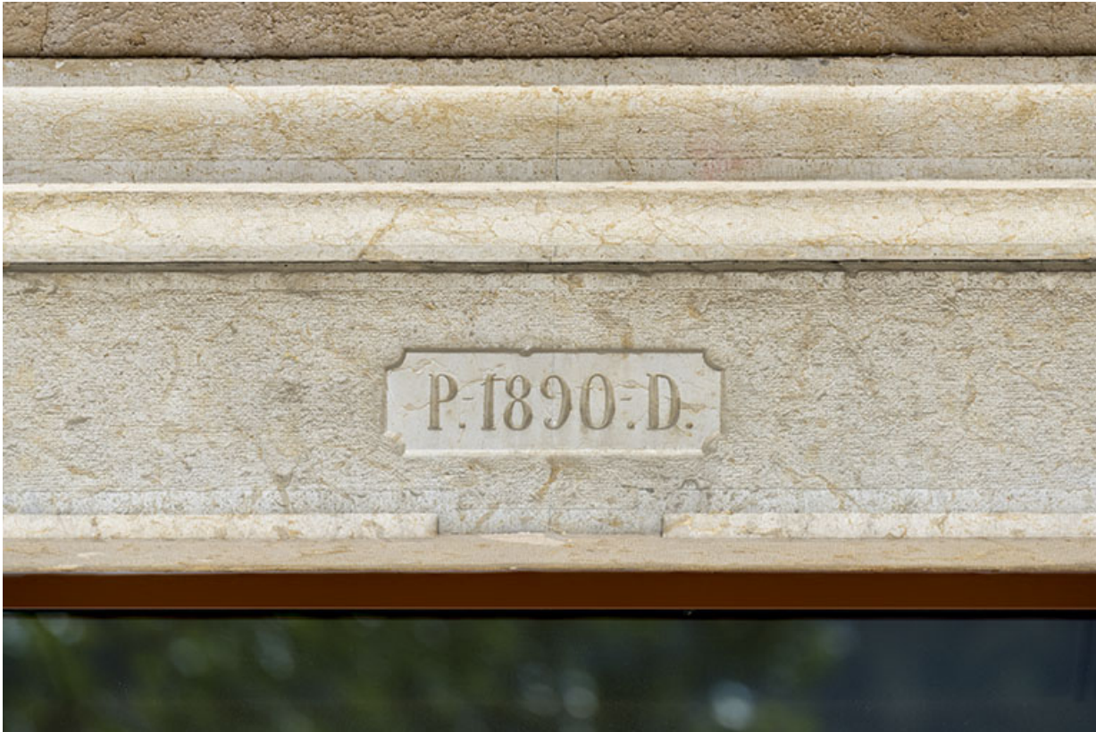
Maison : date et initiales sur le linteau de la porte.