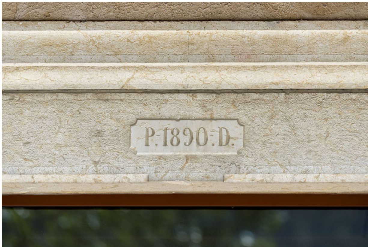
Maison : date et initiales sur le linteau de la porte.