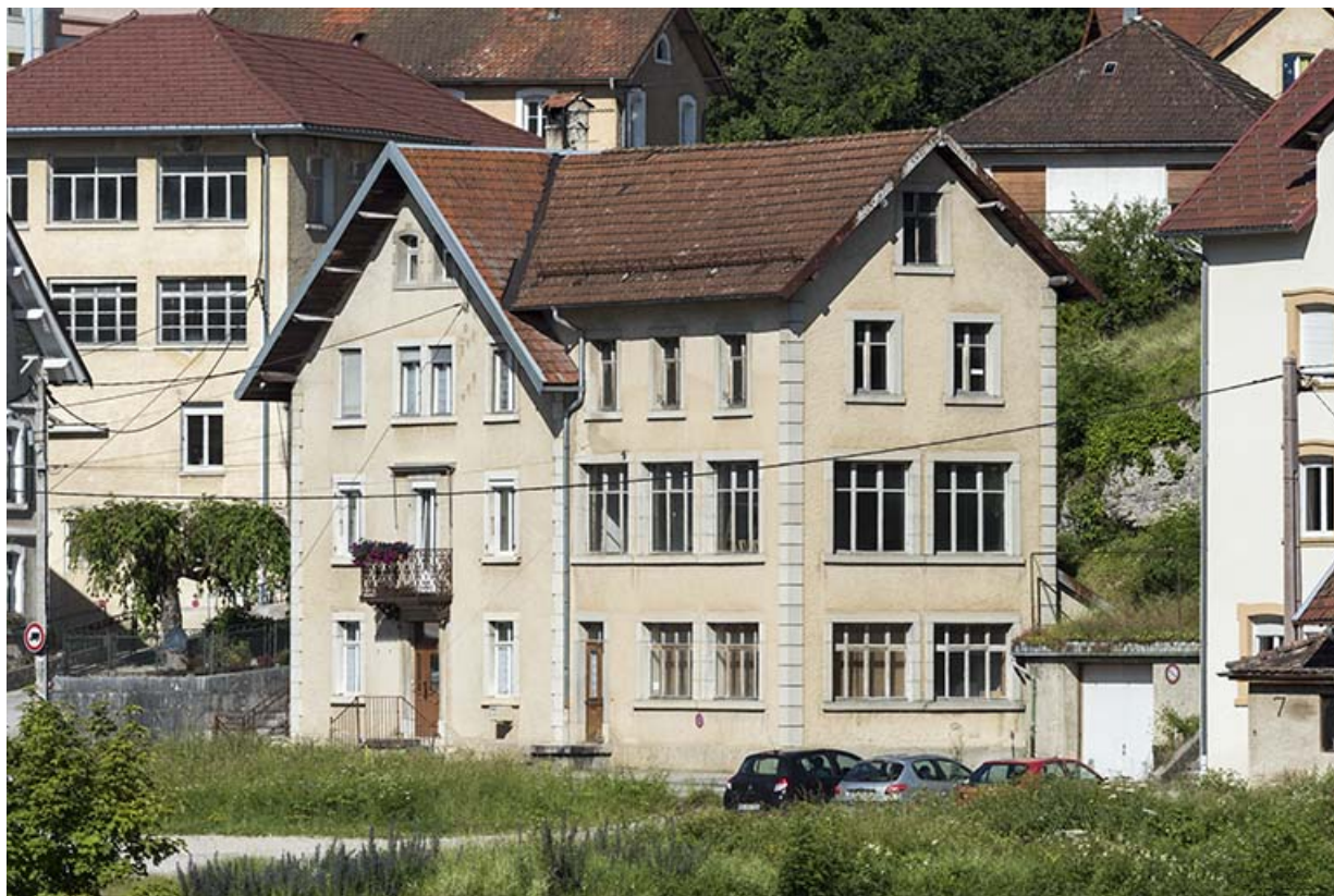
Maison et atelier oriental : vue d'ensemble (façades antérieure et latérale droite).