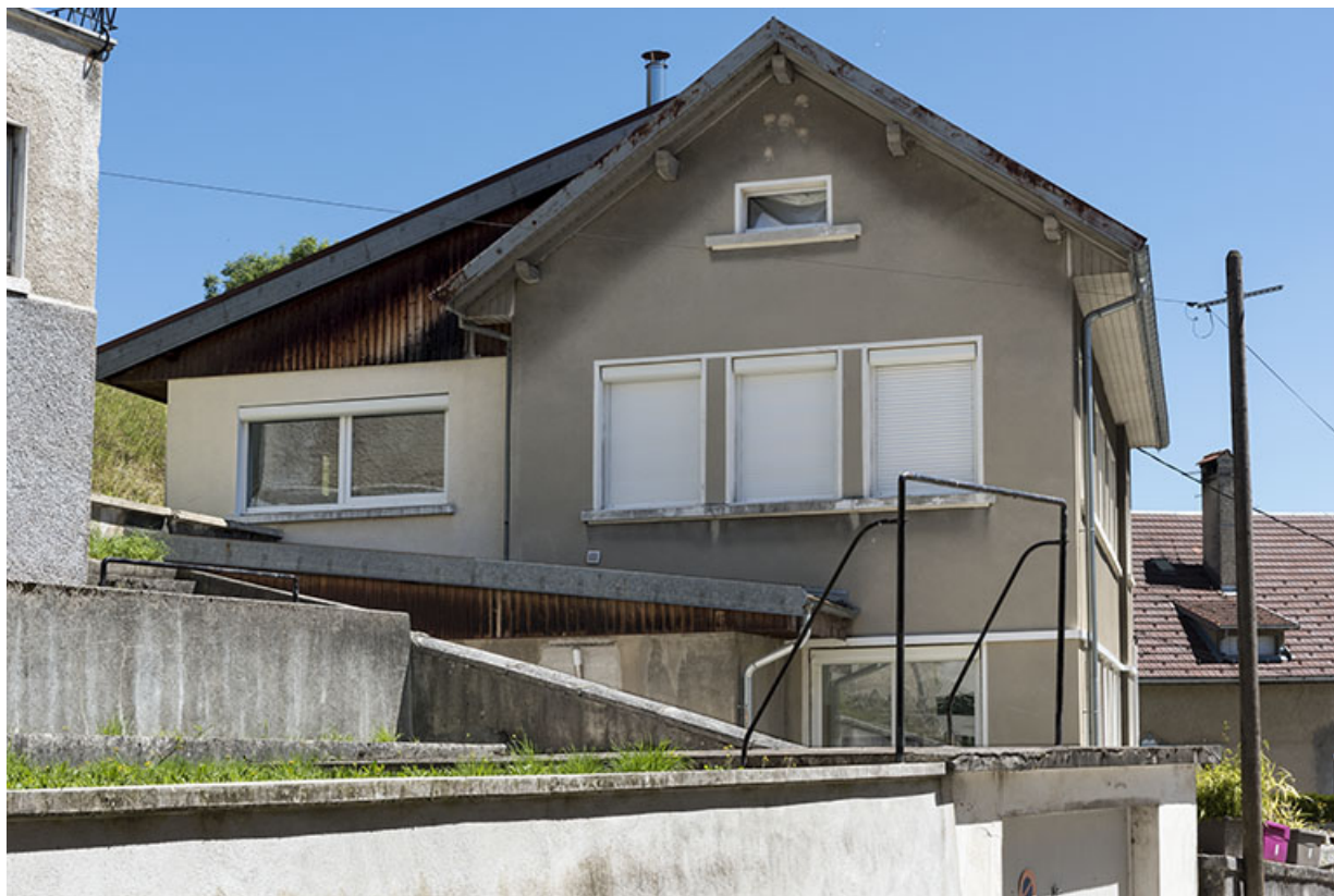
Atelier occidental : façade latérale gauche.