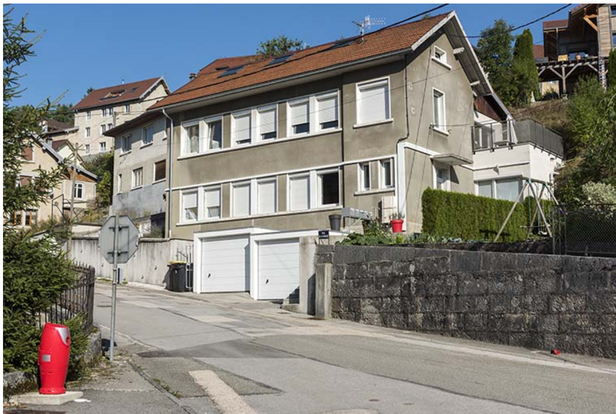
Atelier occidental (rue de la Perrière) : façades antérieure et latérale droite. 25, Villers-le-Lac, 7 rue du Lac