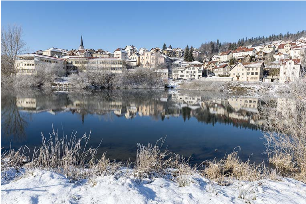
Site récent, vu du nord-est, en hiver.