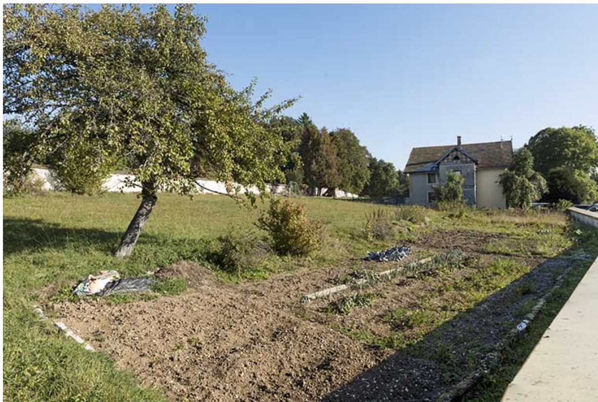
Vue d'ensemble, depuis le sud-ouest (façade latérale gauche).

25, Villers-le-Lac, 38 route des Fins, lieudit : la Courpée